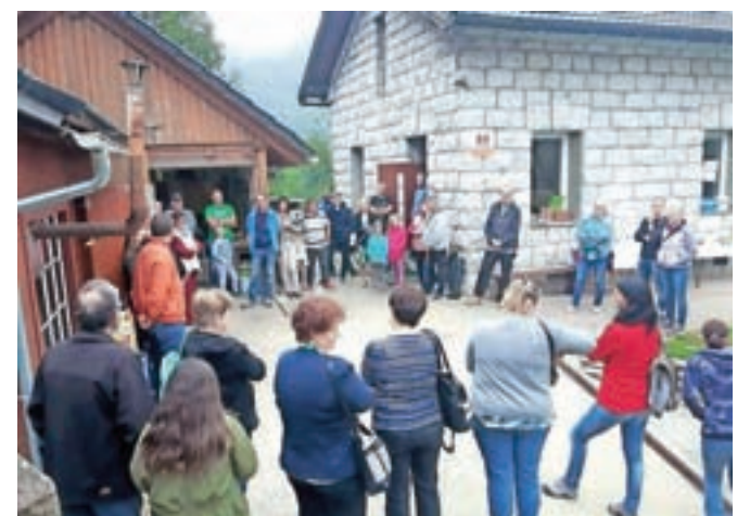
Dan odprtih vrat Skupnosti Žarek v Bitnjah

Obiskovalci so lahko поблиžje spoznali program komune, si ogledali prostore, mizarško delavnico in spoznali uporabnike. V skupno-