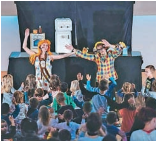
V torek, 1. oktobra, bo v Kolpernu potekal Ta prav živ žav, otroška prireditev ob Tednu otroka.

OSNOVNA ŠOLA KOROŠKA BELA, OD 7.30 DO 17. URE