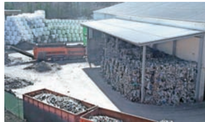
Deponija Mala Mežakla, 15. marca