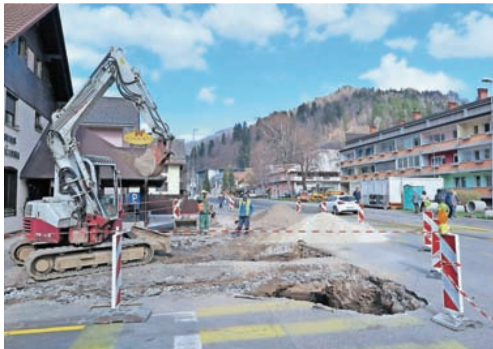
Obnova ceste pri Metuljčku in na mostu čez potok Jesenica se zdaj nadaljuje.

Pogodbena vrednost vseh del znaša 1,4 milijona evrov,