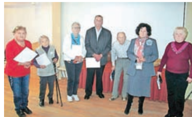
Prejemniki društvenih priznanj