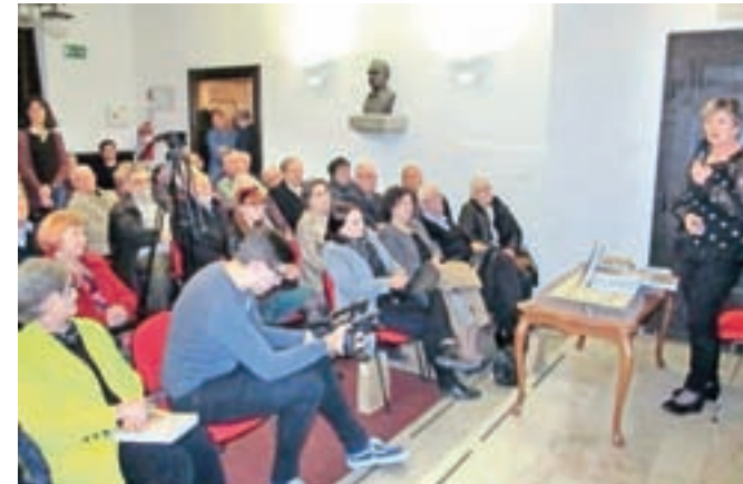
S predstavitve zbornika v Kosovi graščini

Predstavitve Jeseniškega zbornika 2019 v Kosovi graščini je naletela na veliko zanimanje med občani.