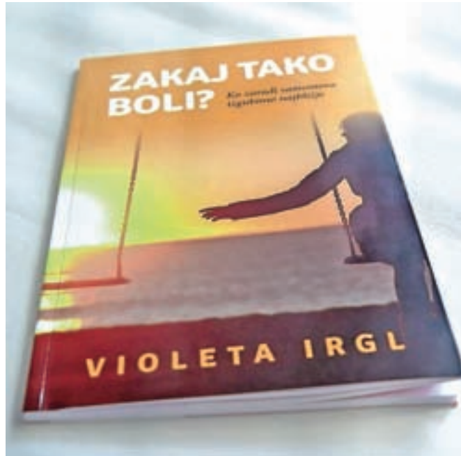
Drobna knjižica Zakaj tako boli? želi pomagati svojcem ob izgubi bližnjega zaradi samomora.