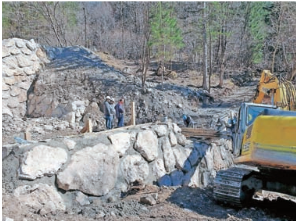
Ena od dveh novozgrajenih zaplavni pregrad nad Koroško Belo

Po besedah Urbana Ilca so dosedanji ukrepi stali blizu 800 tisoč evrov; financirala pa jih je država. Na svetovni dan voda, ki ga obeležujemo 22. marca, je Direkcija RS za vode pripravila dan odprtih vrat na nekaterih od svojih infrastrukturnih objektov, tudi na zaplavni pregradi nad Koroško Belo. Oglela se je udeležilo tudi nekaj domačinov Koroške Bele, ki z zanimanjem spremljajo dogajanje v zvezi s plazom.