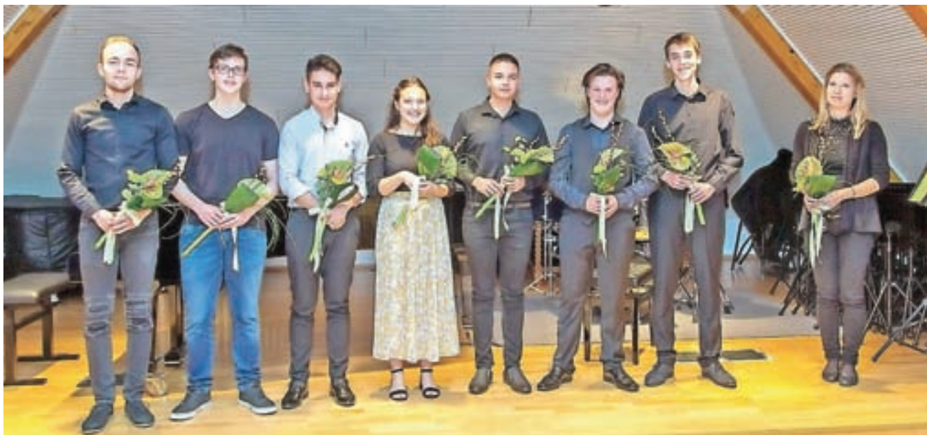
Nekdanji učenci Glasbene šole Jesenice, zdaj dijaki in študenti, znova v dvorani Lorenz

urniku vsako leto znova odzovejo povabilu in nastopijo na domačem odru, mi pa s ponosom opazujemo njihov napredek," je ob tem dejala pomočnica ravnateljice Klavdija Jarc Bezljaj.