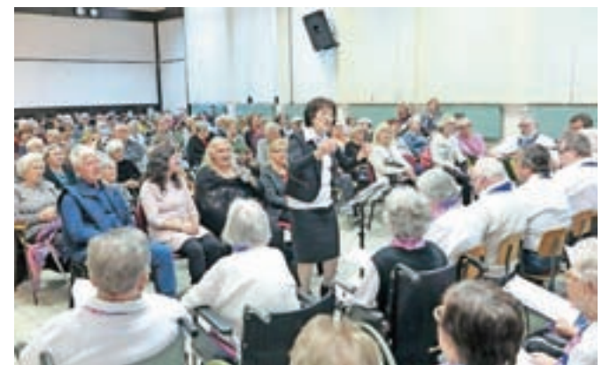
Nastopil je tudi domski pevski zbor Večerni zvon.