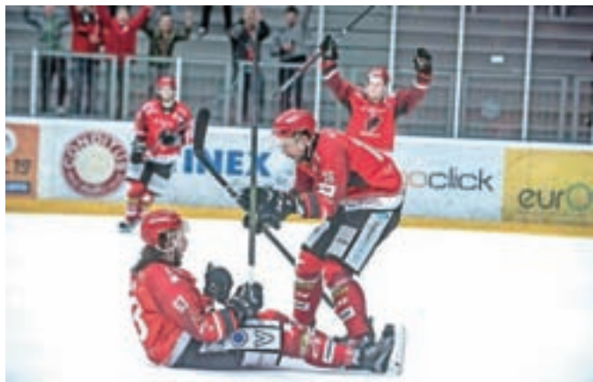
Danes je na sporedu tretja tekma.

Danes je na sporedu že tretja tekma (igra se na tri zmage). Morebitna četrta bo v nedeljo na Jesenicah, peta pa v torek v Pustertalu.