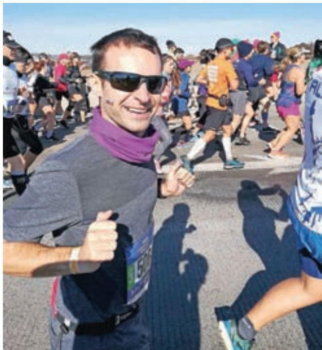
Tekel je z nasmehom.