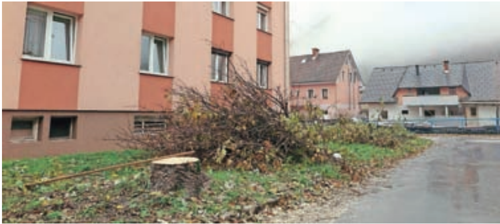
Požagana drevesa na Ulici Franca Benedičiča

dreves nastalo – (divje) parkirišče ... Pozanimali smo se, kdo je sprejel odločitev, da drevesa posekajo, in koga so pravzaprav motila. Najprej smo se obrnili na Občino Jesenice, kjer so pojasnili, da je bil poseg opravljen na zemljišču, ki je v