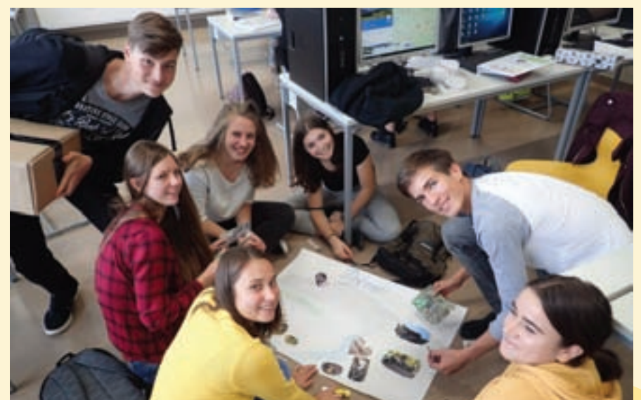
Delo v mednarodni skupini

Gimnazijci se redno vključujejo v mednarodne projekte. V oktobru so skupaj s koroškimi in tržaškimi Slovenci razvijali svoja naravoslovna znanja. V novembru so gostili belgijske in nemške dijake, s katerimi so razvijali podjetne ideje. Izdelali so medeno linijo kozmetičnih in pekovskih izdelkov.