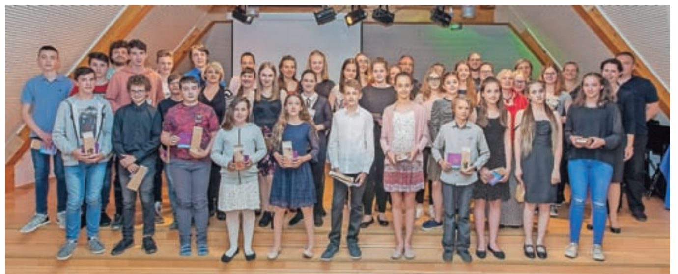
Učenci z mentorji in ravnateljico

»zastrupili« z glasbo do te mere, da bo ostala njihova sopotnica tudi naprej v življenju, in da se bodo še srečevali v hramu glasbe – nekateri bodo nadaljevali šolanje na višji stopnji, nadaljevali z obiskovanjem simfoničnega orkestra ali pa bodo prihajali kot publika na abonmajske koncerte.