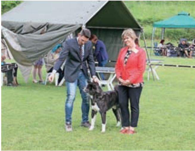
Razstave se je udeležilo več kot tristo psov različnih pasem.

Prilagodnje leto, ko bodo obeleževali 20. obletnico razstave, organizatorji napovedujejo, da se bodo še dodatno potrudili in bo 20. razstava pravi nezpozabni kinološki dogodek.