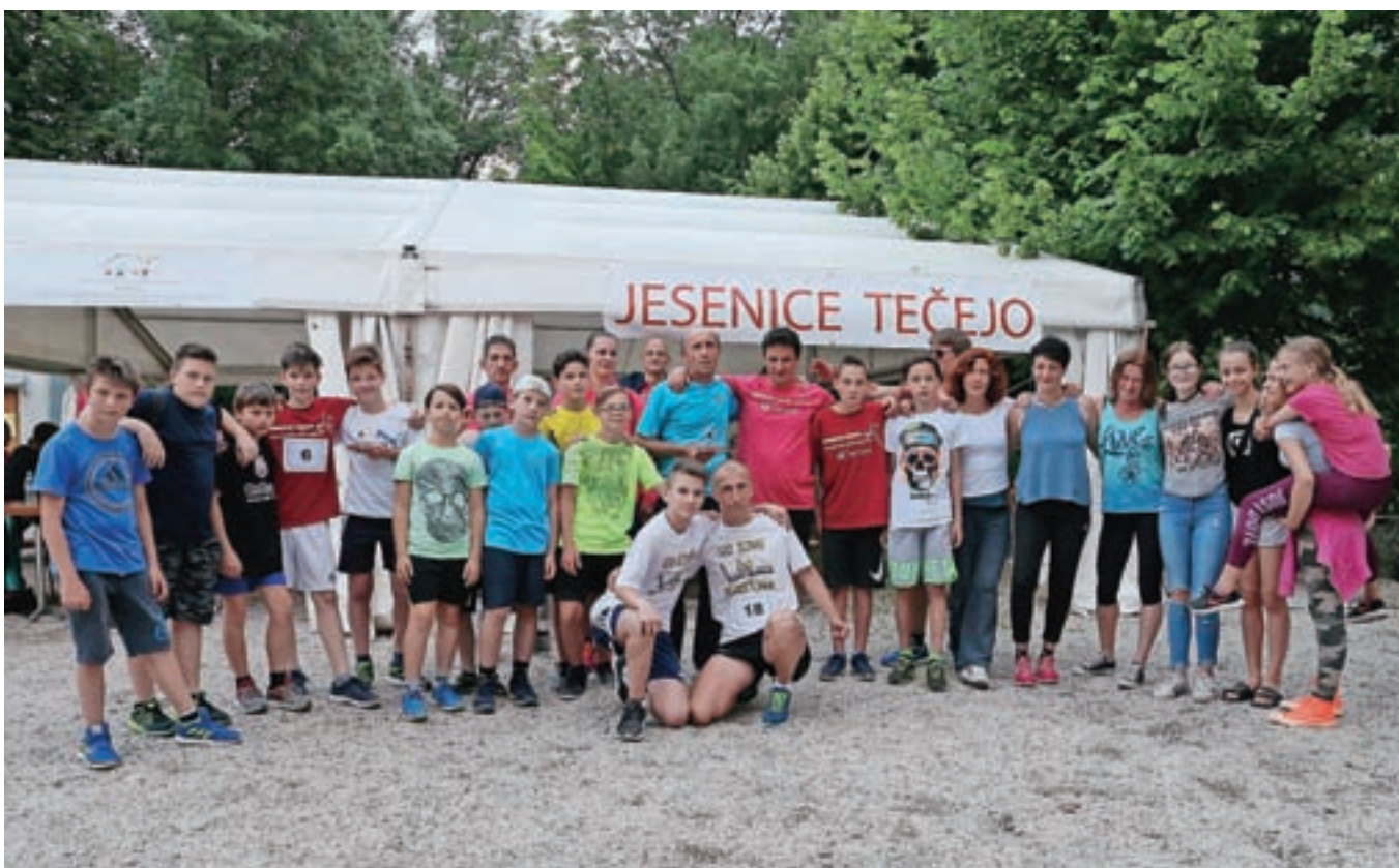
Del udeležencev letošnjega dobrodelnega teka, ki poteka na dvokilometrski trasi po središču Jesenic. Izkupiček teka je v celoti namenjen letovanju socialno ogroženih otrok v letovišču Pinea pri Novigradu.