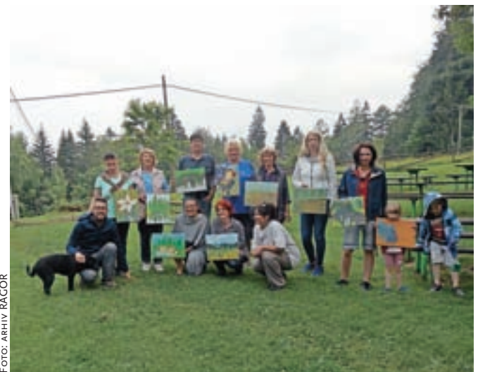
Udeleženci delavnice slikanja v Zoisovem parku