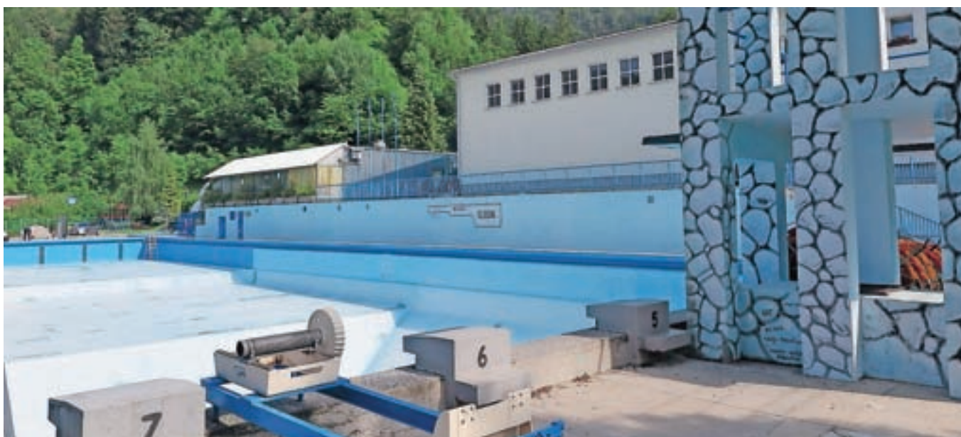
Kopališče Ukova bo za kopalce pripravljeno do 20. junija.