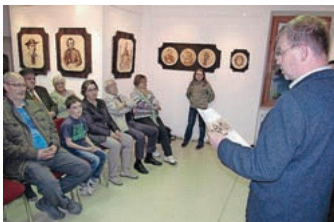
Z odprtja razstave