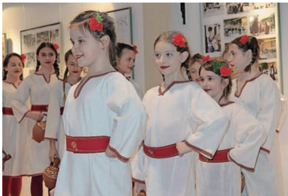
Kulturna mavrica na Jesenicah poteka že od leta 2007. / FOTO: ARHIV

dan, 9. junija, bo najprej ob 17.30 sprevid skupin skozi mesto Jesenice. Ob 19. uri bodo v športni dvorani Podmežakla nastopile gostujoče skupine KUD Šokica Slobodnica iz Hrvaške, MKD Kočo Racin iz Kopra, KUD Izvor Klagenfurt iz Avstrije ter slovenski skupini Svoboda Črnuče in KUD Jurij Vodovnik Skomarje.