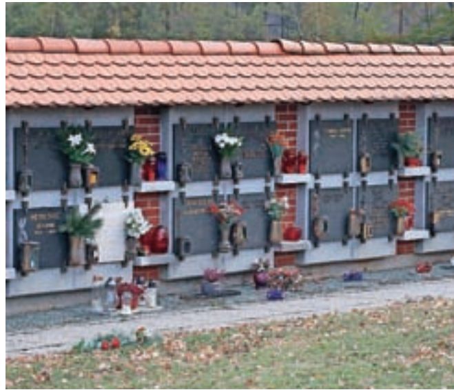
Po novem bo javno komunalno podjetje JEKO opravljalo 24-urno dežurno službo in pokopališko dejavnost, pogrebno dejavnost pa bodo prepustili trgu.

Potrdili so tudi odlok o pogrebni in pokopališki dejavnosti ter pokopališkem redu. Po novem bo javno komunalno podjetje JEKO opravljalo 24-urno dežurno službo in pokopališko dejavnost, pogrebno dejavnost pa bodo prepustili trgu. V praksi so pomeni, da bo JEKO v sklopu 24-urne dežurne službe opravljal prevzem pokojnika na lokaciji smrti (bolnišnica, dom upokojenec, doma, na cesti ...) in prevoz do hladilnice oziroma zdravstvene ustanove zaradi obdukcije. Pripravo