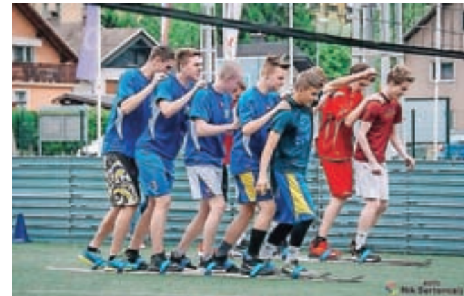
Dijaki so se pomerili v petih disciplinah. / FOTO: NIK BERTONCEJ

Ob dnevu Evrope je v Športnem parku Podmežakla potekalo 5. športno srečanje jeseniških srednješolk in srednješolcev. Dijakinje in dijaki Gimnazije Jesenice in Srednje šole Jesenice so se v organizaciji Zavoda za šport Jesenice pomerili v petih športnih disciplinah: štafeti, odbojki, kegljanju, košarki in nogometu. Na koncu so skupno zmago slavili dijaki Srednje šole Jesenice in že tretjič zapored prejeli prehodni pokal. Jeseniški srednješolci se na športnih tekmovanjih srečujejo od leta 2014.