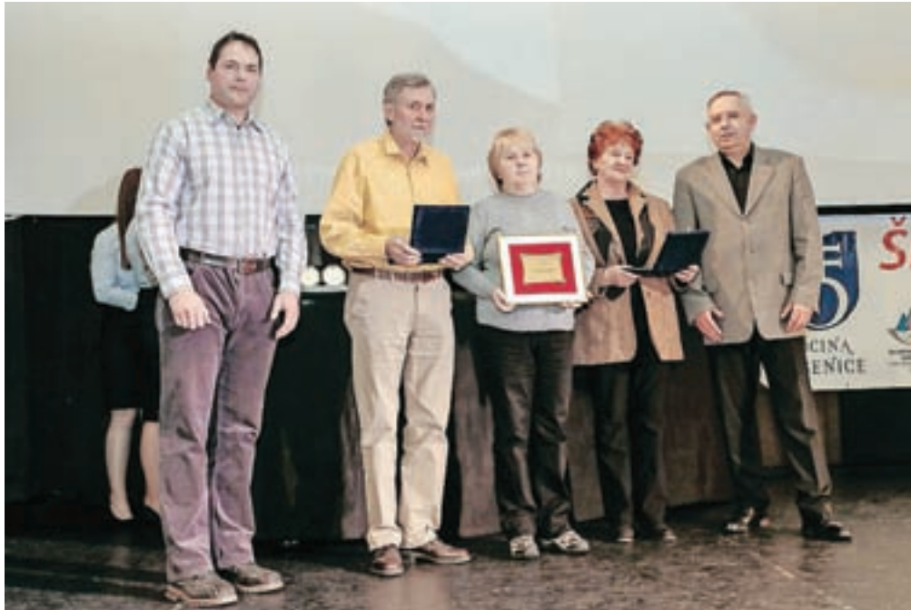
Prejemniki zlatih plaket in posebnih priznanj z županom