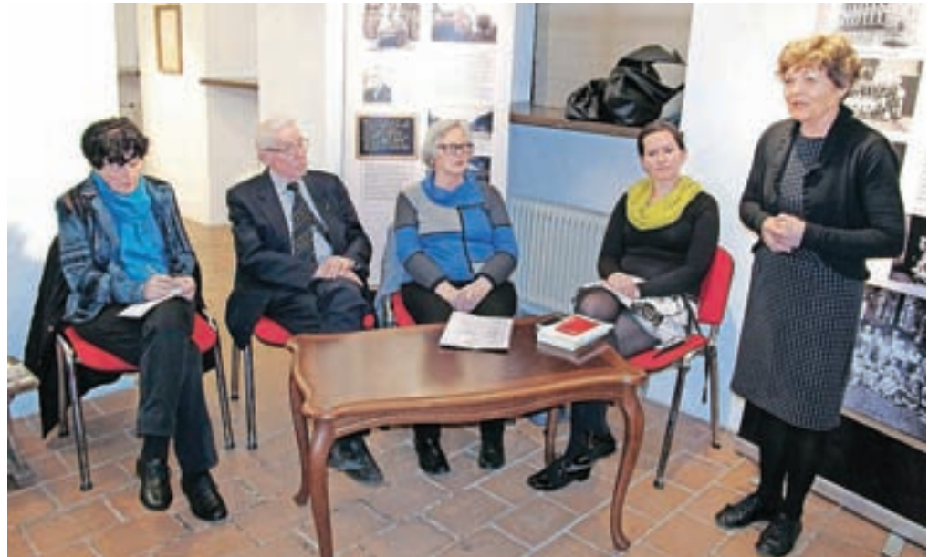
Hospickafe v Kosovi graščini