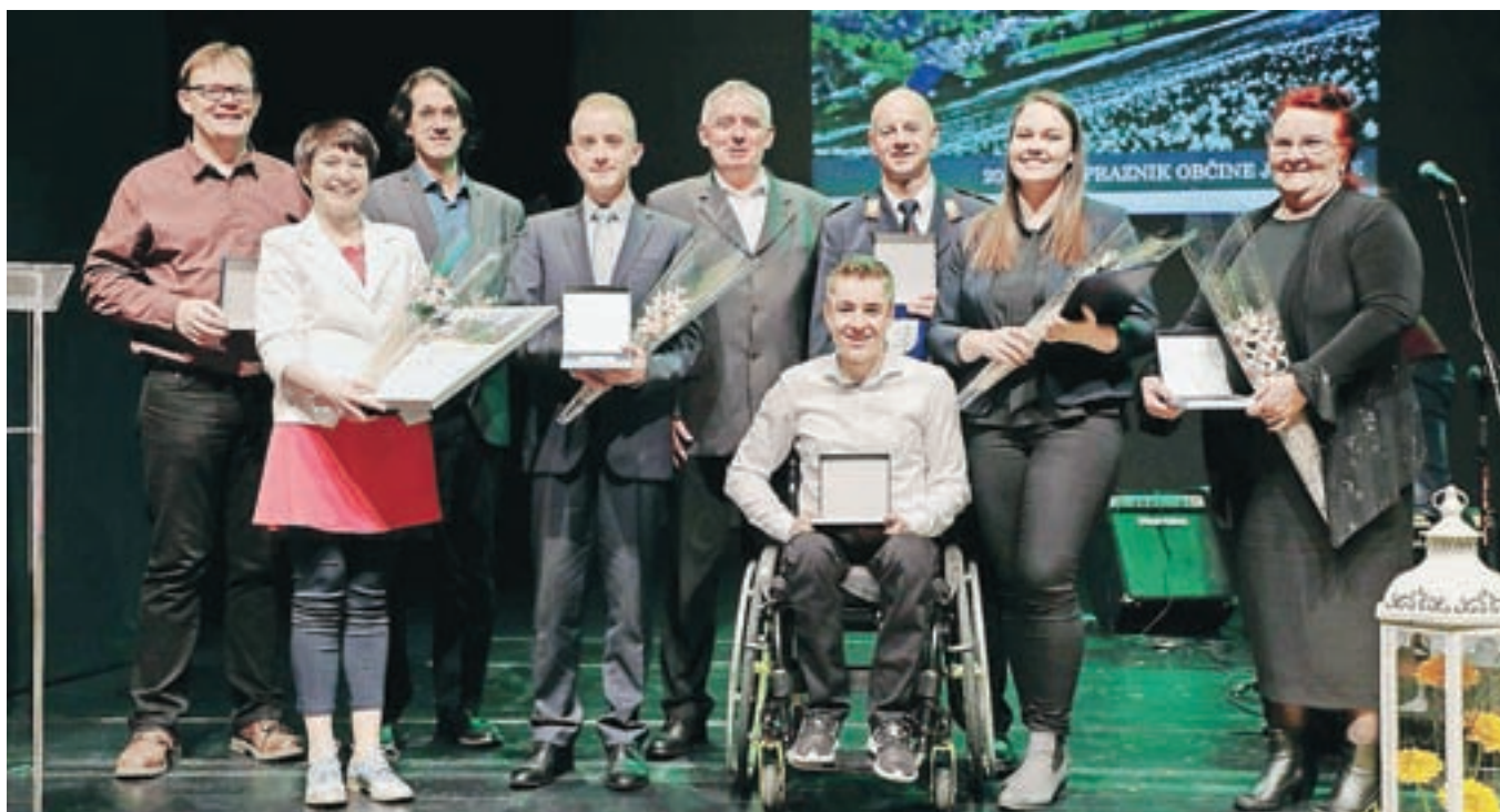
Občinski nagajenci z županom