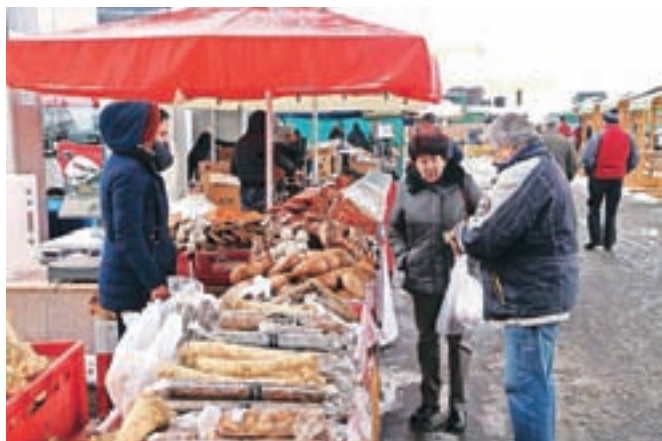
Vremenu je kljubovalo okrog štirideset razstavljalcev, našli pa so okrog pet tisoč obiskovalcev.

ca leta 1929 pridobile status mesta, zaradi česar 20. marca obeležujejo tudi občinski praznik. Obiskovalcem je zaželel, da bi se ob obisku sejma lepo imeli in bi med ponudbo našli kakšno malenkost zase ali svoje bližnje, razstavljalcem pa, da bi bila tudi zanje udeležba na sejmu čim bolj pozitivna. Po uradnem odprtju je za zabavo skrbel jeseniški kantavtor Elvis Fajko, v soboto ansambel Gorenjski kvintet, v nedeljo pa že tradicionalno ansambel Zgornjesavci.