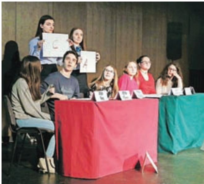
Mladi tekmovalci so letos morali odgovarjati na vprašanja o zgodovini šolstva na Jesenicah.