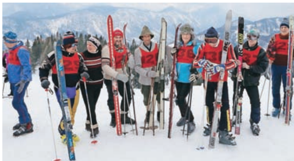
Tekmovalci v stari smučarski opremi

smučali trideset odstotkov ceneje, čakala pa jih je tudi veleslalomski preizkušnja, po kateri so ugotovili, da je smučanje na starih smučeh precej težje kot na novih, a so se vseeno nepozabno zabavali. Eden od tekmovalcev je na tekmo prišel celo iz Ljubljane. Kot se za smučar-