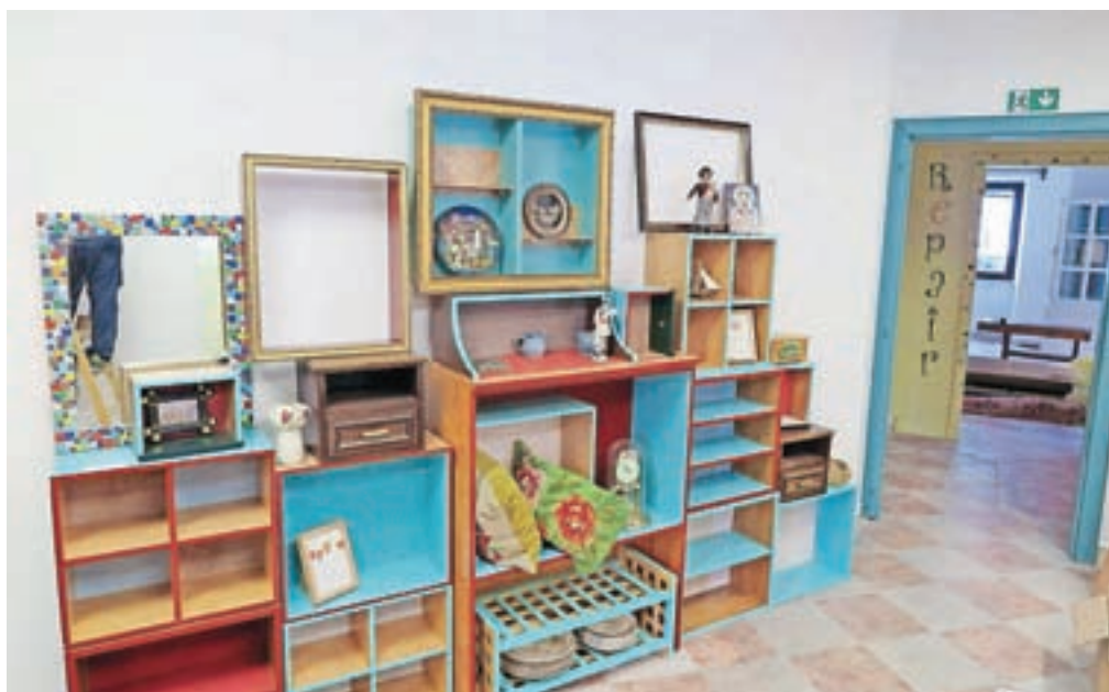
Prostore Centra ponovne uporabe Jesenice še opremljajo, odprli pa ga bodo predvidoma v začetku aprila.