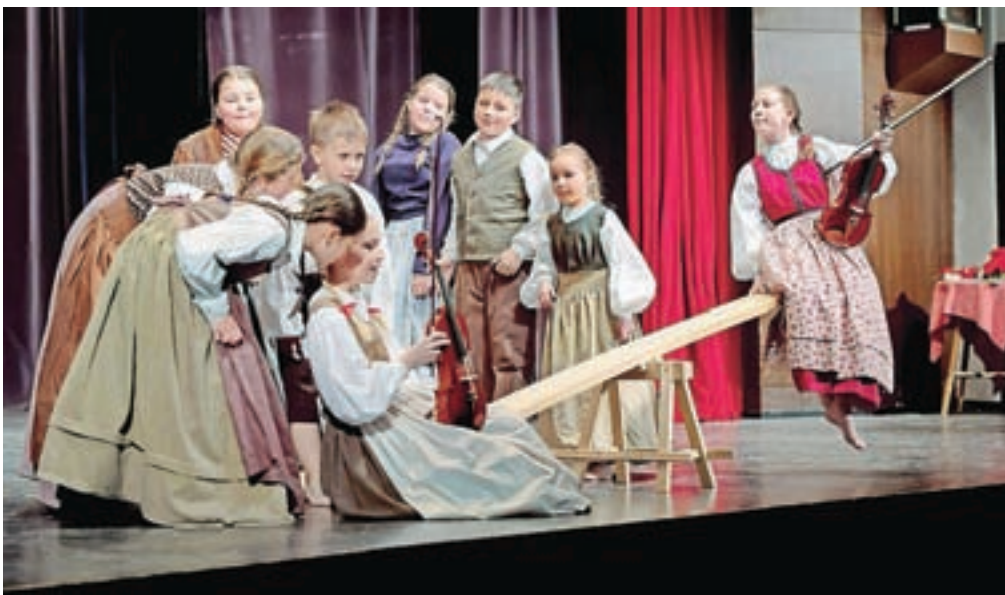
Folklorna skupina Mali Triglav