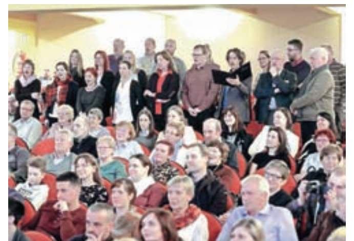
Člani zbora Vox Carniola so zapeli iz dvorane.