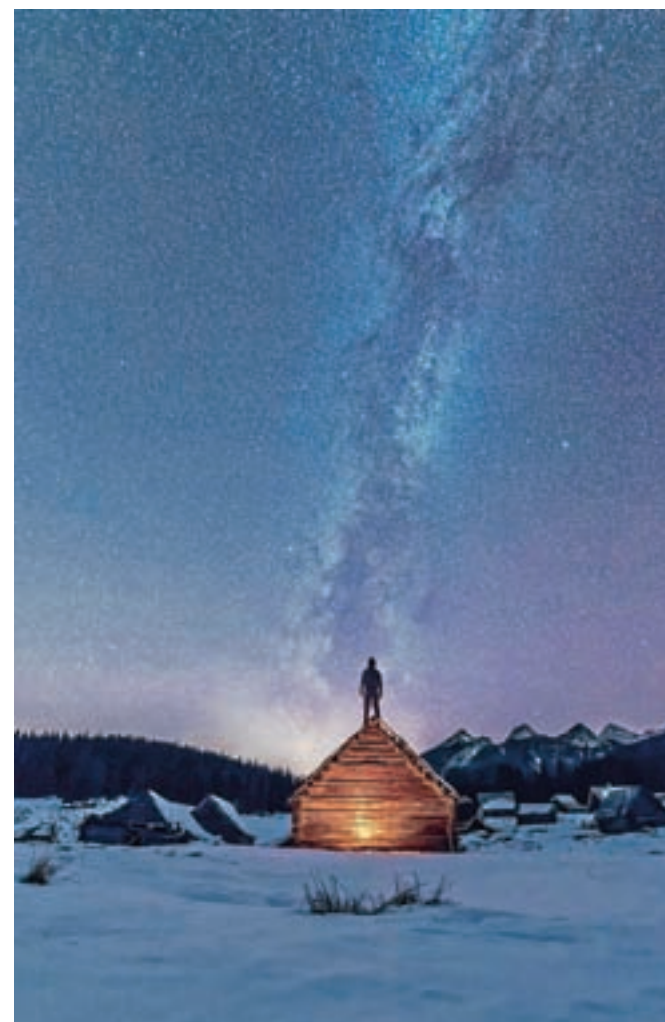
Planina Javornik z Rimsko cesto