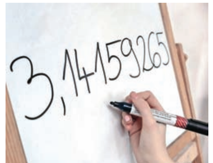
Dan števila pi obeležujemo 14. marca, ker je ameriški zapis datuma 3/14.