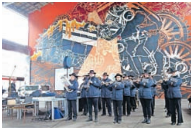
Na odprtju sejma so nastopili tudi člani Pihalnega orkestra Jesenice - Kranjska Gora.