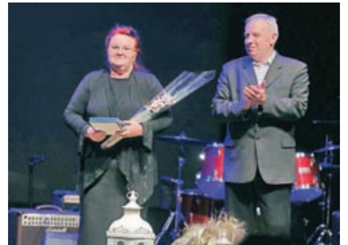
Prejemnica plakete občine je pesnica, pisateljica in esejistka Sonja Koranter.