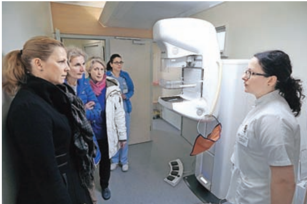
Mobilna enota je opremljena z najsodobnejšim mamografom, s katerim rentgensko slikajo dojke in odkrijejo že začetne rakave spremembe.