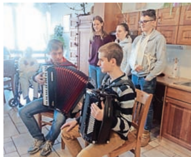
Dijaki so pripravili kulturni program.