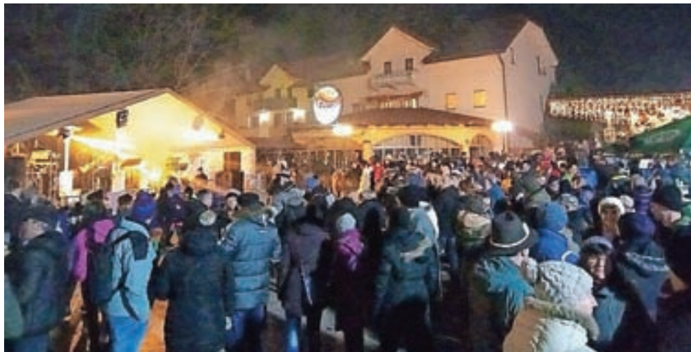
Novoletne prireditve na Čufarjevem trgu so bile dobro obiskane.

društev prijateljev mladine Jesenice. Kasneje so na svoj račun prišli tudi starejši obiskovalci, ki jih je na odru zabaval Šexpir band.