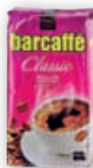
kava Barcaffé 250 g