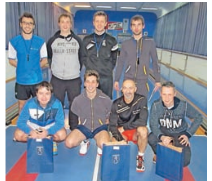
Najboljši udeleženci tekmovanja kegljanja na asfaltu