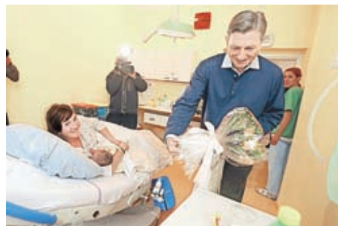
Le dobro uro po rojstvu je mlado mlado družinico za nekaj minut obiskal predsednik države Borut Pahor.