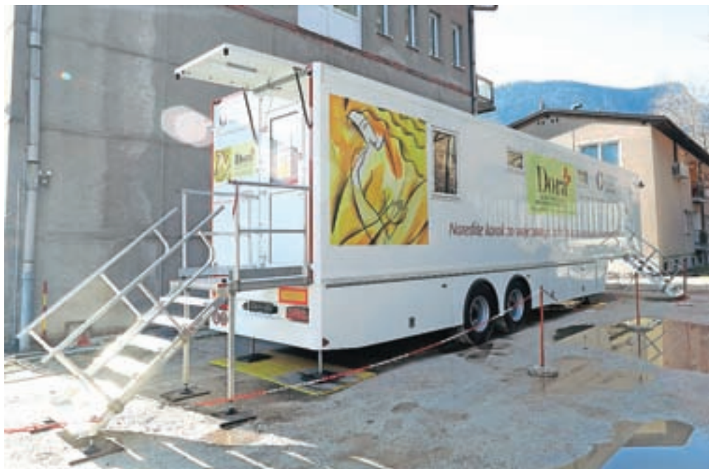
Mobilna enota državnega programa za zgodnje odkrivanje raka dojke Dora deluje na zgornjem parkirišču jeseniške bolnišnice.

vse ženske, ki se bodo odzvale na vabilo, zatem pa naj bi enota na Jesenice znova prišla čez dve leti.