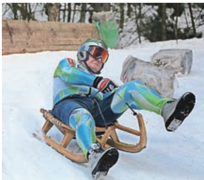
Nastopilo je trideset sankačev iz šestih društev.