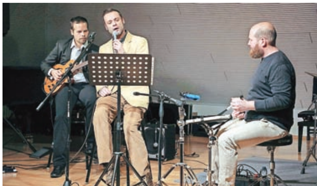
Zasedba Trio Cart je popestrila literarni večer v glasbeni šoli.