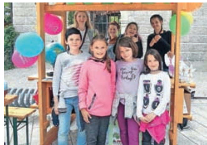
Avtorji besedil, risb in ugan so jeseniški osnovnošolci.