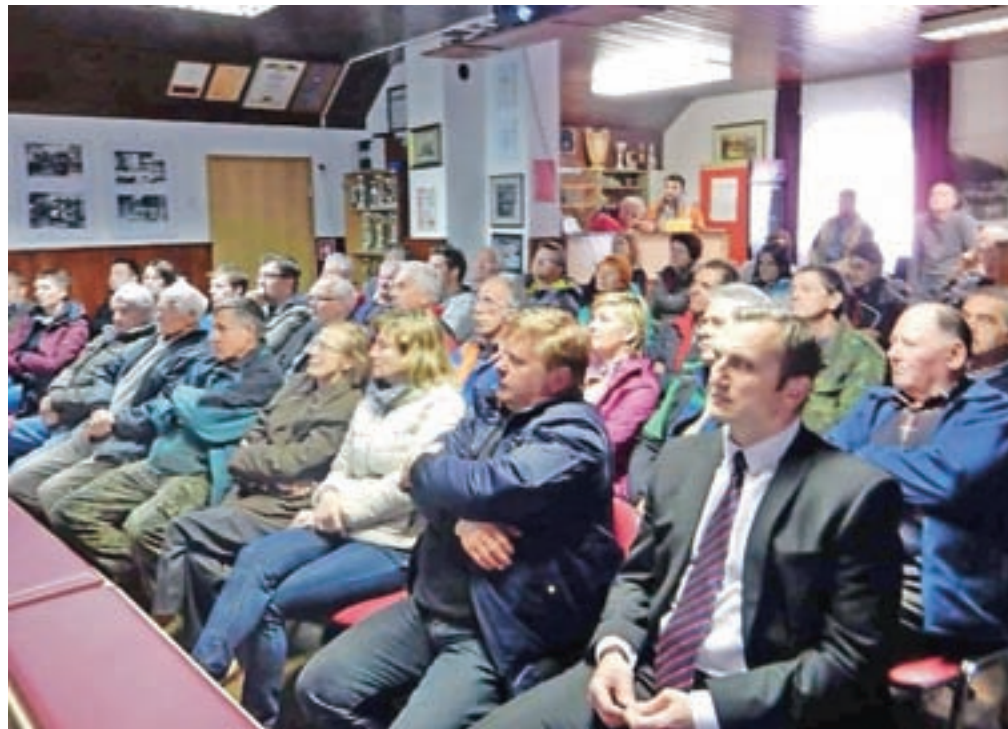
Srečanja na Koroški Beli se je udeležilo triintrideset ljudi.

Po predstavitvi so strokovnjaki s krajanji govorili tudi o nadaljnjih aktivnostih in raziskavah, od katerih bo