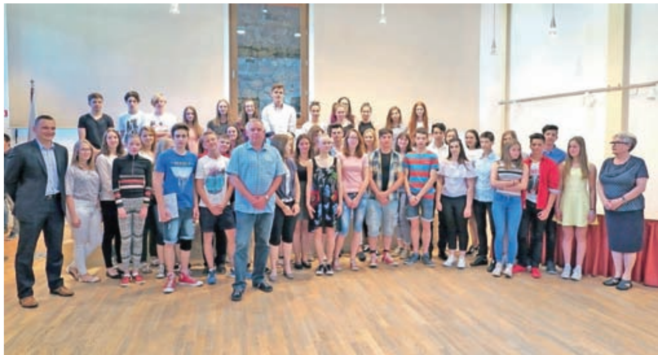
Najboljši jeseniški učenci in dijaki z županom in podžupanoma