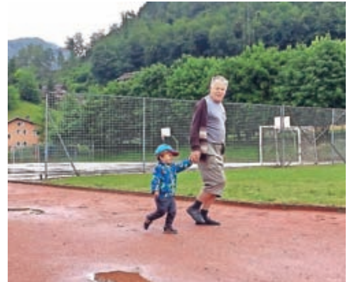
... najbolj pogumni pa tudi med lužami ...

cev preteklo veliko več krogov, kot so jih nameravali. Krogi so nam koristili tudi pri tekmovanju za najbolj športni razred. Sam sem jih preteklo 80 in če ne bi zmanjkalo časa, bi jih preteklo še 20 za okroglo številko."