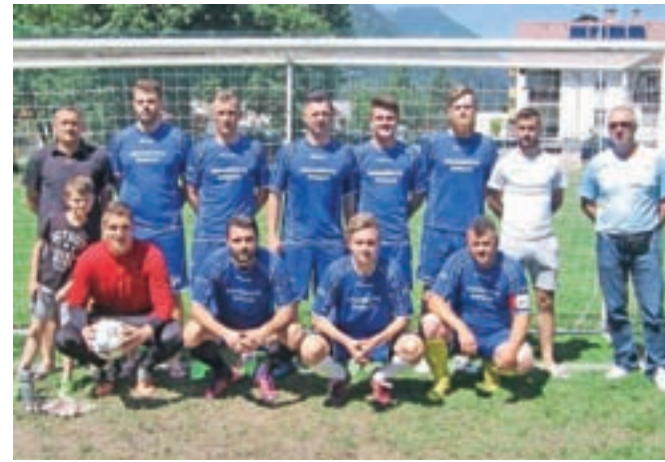
Zmagovalac medobčinske malonogometne lige skupine A Fasaderstvo Kumalič Biser

Končana je še ena medobčinska malonogometna liga Radovljica. Končnica, kar se tiče razpeta na vrhu, je bila mirna, saj je bil zmagovalac že nekaj kol pred koncem znan. Na vrhu lestvice skupine A je povsem zaslužno jeseniška ekipa Fasaderstvo Kumalič Biser, ki je v osemnajstih tekmah doseglo šestnajst zmag (Podnart 8:4, 5:3, Ribno 9:4, 2:1, Calimero boys 11:4, 12:3, Brezje 7:3, Utrip 8:3, 14:3, Smola 10:4, Lipce 10:2, 8:2, Hrušica 9:1, 4:1, Begne 11:3, 5:2) in le dva neodločena rezultata (Smola 4:4, Brezje 3:3). Drugo ekipo Ribno so prehiteli za devet točk, tretjo Smolo pa za 17 točk. Imajo tudi najboljšo razliko v golih. Dali so daleč največ golov, 140, prejeli so jih 50.