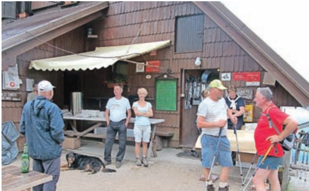
Del pohodnikov pri Koči na Golici

Udeležencem osmega prazničnega pohoda na dan dneva državnosti na Golico (v organizaciji Občine Jesenice in Planinskega društva Jesenice) vreme ni bilo naklonjeno. Po čudovitih sončnih in vročih dneh v nedeljo že v jutranjih urah prve dežne kaplje niso obetale nič dobrega. Pravih planincev (150 jih je bilo) to ni zmotilo. Dobro opremljeni in zavarovani za slabo vreme (tudi z dežnikom) so se povzpeli do kočice Planinskega društva Jesenice, najbolj pogumni in hrabri so tudi v dežju in vetru osvojili priljubljen vrh v Karavankah. Med pohodniki je bilo veliko takšnih, ki se pohoda udeležijo vsako leto, med njimi je bila skupina petnajstih članov pohodne skupine Kul-