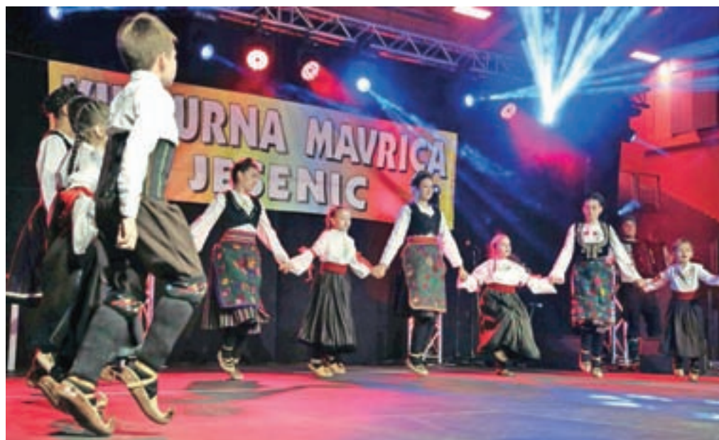
Na kulturni mavrici se s plesi, petjem, recitacijami in kulinariko predstavijo društva in skupine.

dogodka so pred sobotnim drugim večerom pripravili tudi sprevod sodelujočih skupin skozi mesto.