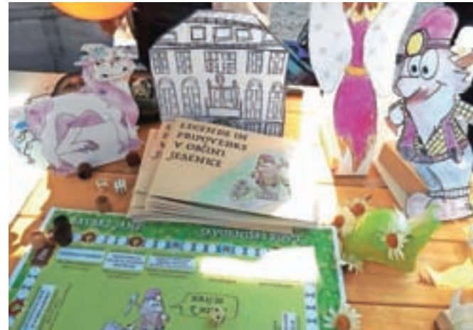
Brošura Legende in pripovedke v občini Jesenice