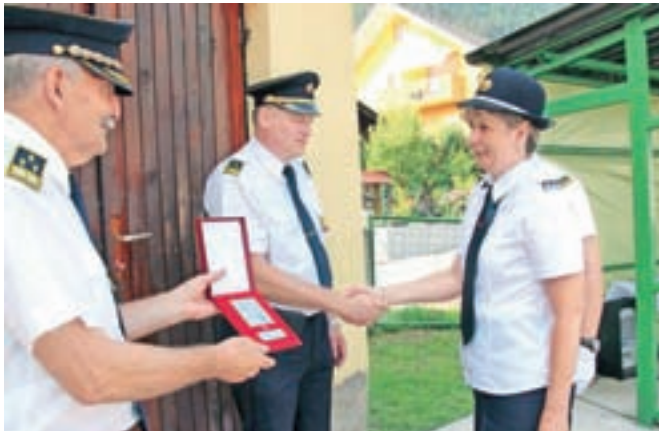
Podelitev srebrne plakete Gasilske zveze Slovenije