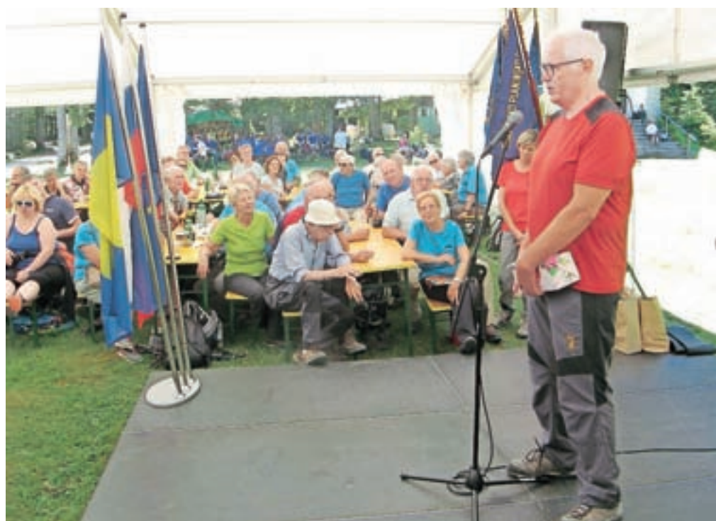
Srečanje z zamejskimi planinci v Vratih