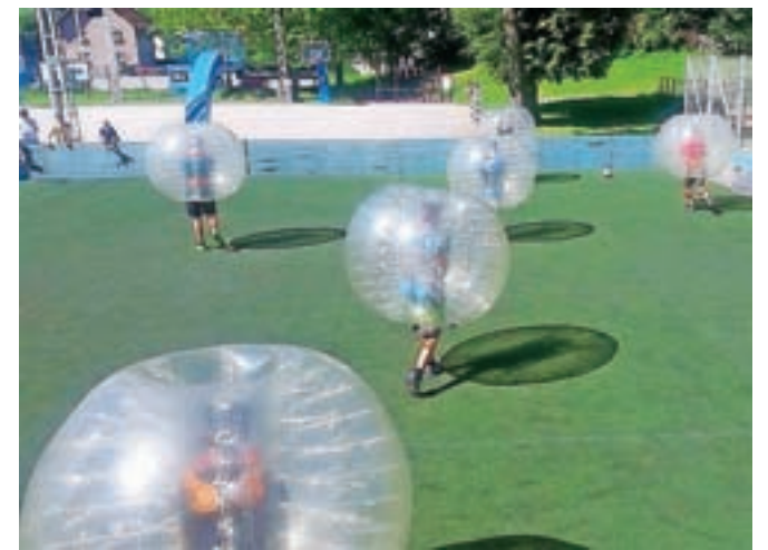
Zorbing nogomet je nov moštveni šport, kjer se igralci skrijejo v zorb mehurček.

V Športnem parku Podmežakla, na zunanjem malem omejenem igrišču z umetno travo, je potekal turnir v zorbing nogometu. Gre za nov moštveni šport, kjer se igralci skrijejo v zorb mehurček in se odbijajo, zabijajo, naletavajo, divjajo in se borijo proti ostalim tekmovalcem. V enem športu so tako združeni zabava, adrenalin, akrobatika in nogomet. Ekipa šteje tri člane, ena tekma pa traja deset minut z vmesnim dvominutnim odmorom. Turnir je potekal v organizaciji Mladinskega centra Jesenice, namenjen pa je bil starejšim od petnajst let.