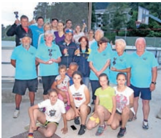
Zmagovalci športnih iger