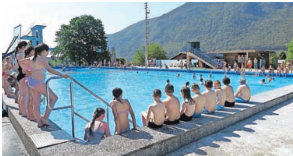
Na kopališču Ukova se bo vse poletje dogajalo veliko zanimivega.

obudili stare že pozabljene otroške igre. Dva sredina popoldneva, 6. julija in 24. avgusta, pa bodo v Soseski