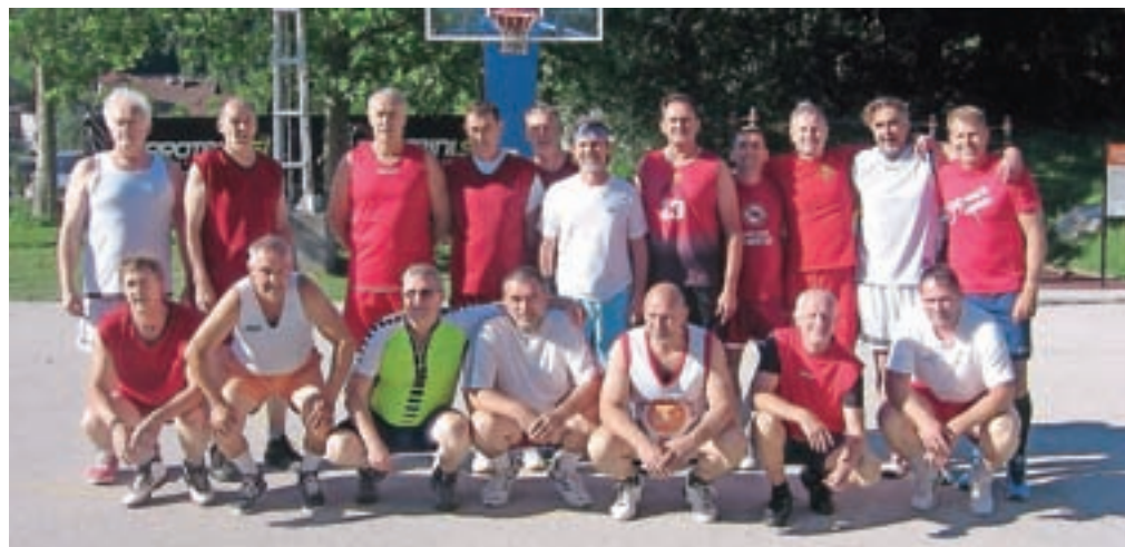
Veterani jeseniške košarke