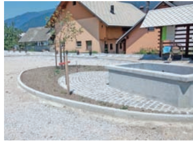
Vaško jedro na Blejski Dobravi dobiva novo podobo.

komunalnih vodov ter priprava za izvedbo javne razsvetljave," so pojasnili. Pogodbena vrednost znaša nekaj manj kot 26 tisoč evrov (brez DDV). Obenem so že uredili dodatno ponikovalnico za ostale zaledne meteorne vode, za kar so zagotovili financiranje izven pogodbe. Na Občini Jesenice upajo, da bodo vremenske razmere še naprej ugodne, tako da bodo dela zaključili najkasneje v septembru.