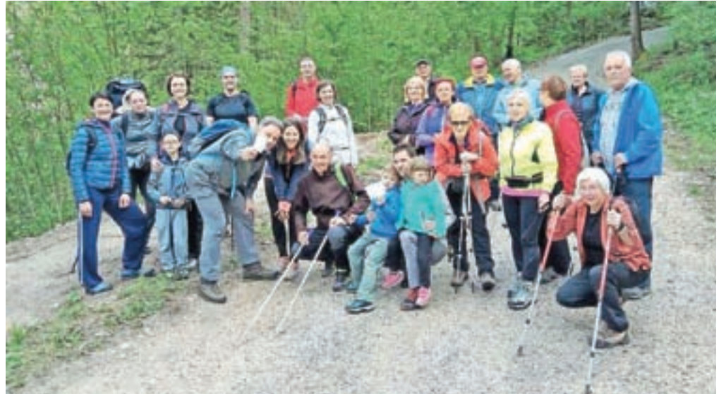
Udeleženci pohoda po Poti po pomolih

Jesenice so dobile obnovljeno pohodniško pot, imenovano Pot po pomolih. Poteka od Trebeža do letnega kopališča Ukova, pohod je zanimiv in nezahteven, nudi pa lepe razglede na Jesenice in okolico. Pot je označena z rumenimi markacijami in tablami. Poteka od peskopa v Trebežu po cesti proti Javorniškem Rovtu, po približno stotih metrih pa zavije na označeno pot in se nadaljuje z vzponom po brezovem gozdu na pobočje Kozjaka. Naprej se vije pod Jelenkamnom do Kalvarije in mimo kapelice do letnega kopališča Ukova. Pot je z markacijami označena tudi v obratni smeri od letnega kopališča do Trebeža, treba je slediti "rumenim pikam", ki so postavljene na desni strani poti. Pohod traja uro