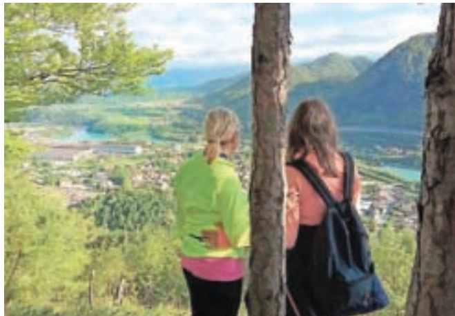
S poti so lepi razgledi na Jesenice, na dveh razglednih točkah pa sta tudi vpisni knjigi.

V organizaciji Zavoda za šport Jesenice je potekal tudi voden pohod po poti, ki se ga je udeležilo okrog 25 pohodnikov, od najmlajših do upokoencev.