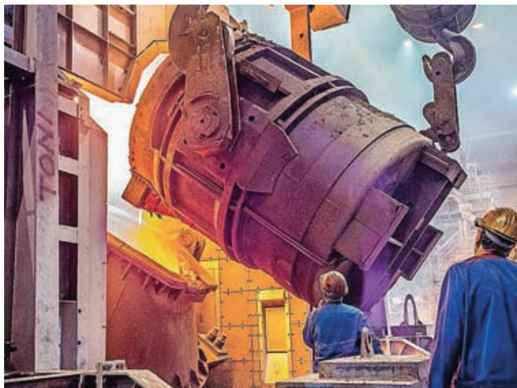
Acroni zdaj izdelava od 120.000 do 130.000 ton nerjavnega jekla na leto, z novo pečjo pa bodo v prihodnjih desetih letih proizvodnjo nerjavnih jekel vsaj podvojili.

To je že druga velika investicija v SIJ Acroni v zadnjih dveh letih, lani so tako predali namenu 32 milijonov evrov vredno linijo za toplotno obdelavo debele pločevine. V zadnjih desetih letih, odkar so v SIJ Acroni v zadnjih dveh letih, lani so tako predali namenu 32 milijonov evrov vredno linijo za toplotno obdelavo debele pločevine. V zadnjih desetih letih, odkar so v SIJ Acroni skupaj investirali že okoli 650 milijonov evrov.