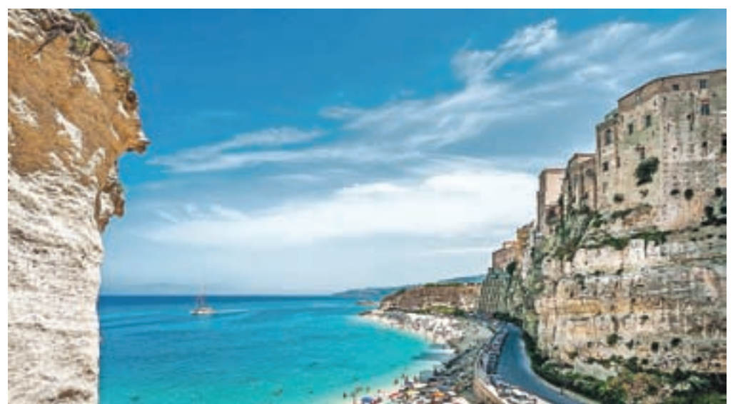
Eden najbolj slikovitih in priljubljenih kopaliških krajev v celi južni Italiji je Tropea.

Na slikoviti zahodni obali Kalabrije se nahajajo tri znane riviere: Riviera dei cedri, Riviera degli oleandri in Riviera degli dei. Južna Tirenska obala se zaradi svojega prelepega barvnega odseva imenuje tudi vijoličasta obala. Ob sončnem zahodu se vsa pokrajina pogrezne v vijoličasto svetlobo. Eden najbolj slikovitih in priljubljenih kopaliških krajev v celi južni Italiji je kraj Tropea.