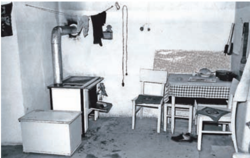
Kuhinja delavskega stanovanja v Kasarni iz leta 1930