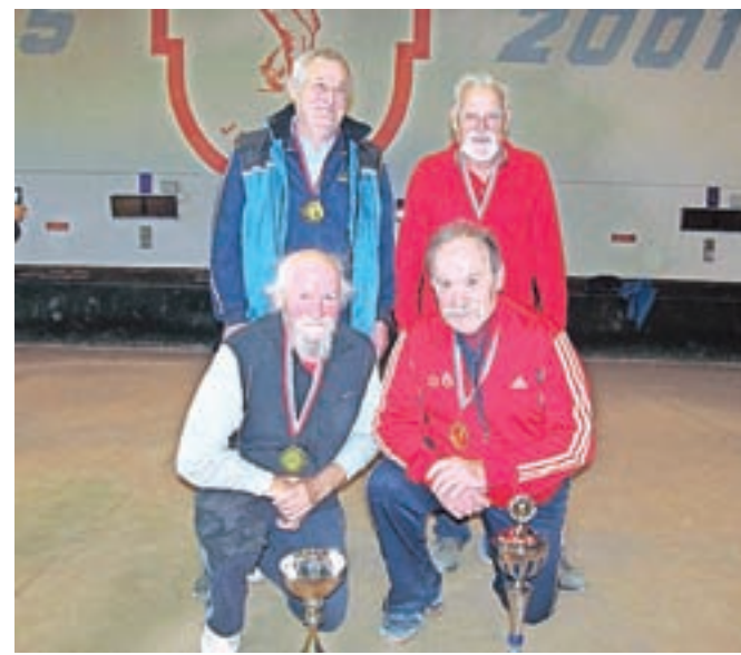
Moška ekipa DU Jesenice je zasedla prvo mesto.