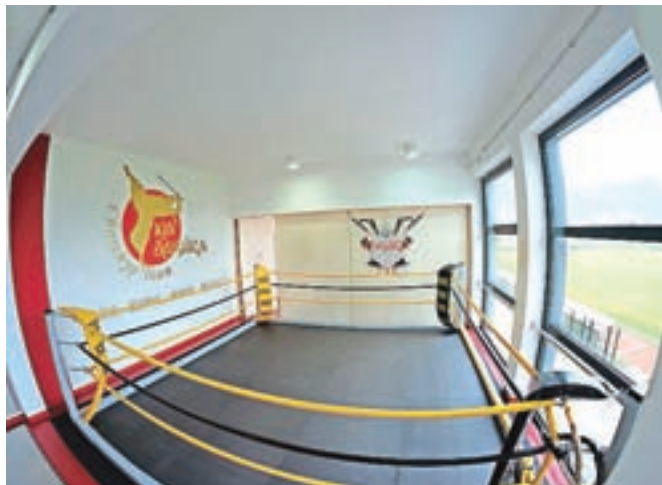
Vadbeni prostor je razdeljen na tri dele, borilnim veščinam je namenjen Bushido room.