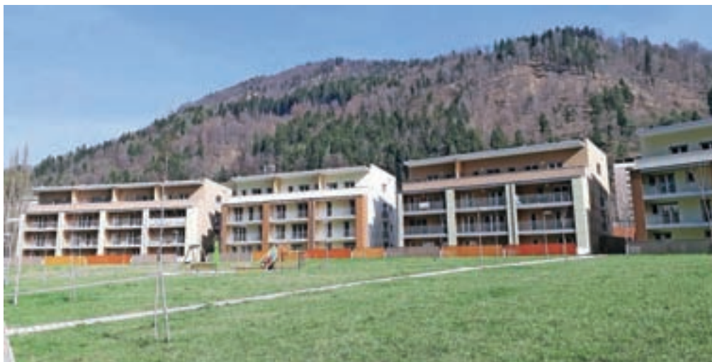
Stanovanja so z balkoni obrnjena na jug, kar zagotavlja obilo sonca ves dan.

Po dobrega pol leta, kar so začeli prodajati stanovanja v novi jeseniški sosesci Gorenjski sonček, je prodana že več kot polovica stanovanj. Kot so povedali v družbi Anepremičnine, so doslej prodali 34 stanovanj od skupaj 62, še za devet stanovanj pa imajo potrjene rezervacije, saj bodo kupci še urejajo financiranje. Večina kupcev prihaja iz okolice Jesenic pa tudi iz Kranja. Kupci se najbolj zanimajo za dvosobna in trosobna stanovanja pa tudi za garsonjere. Kupci, ki se selijo iz stanovanjskih hiš v stanovanje, pa se raje odločijo za atrijska stanovanja, pravijo v družbi Anepremičnine. "Nova stanovanjska soseska je med prebivalci Gorenjske in širše okolice zelo dobro sprejeta, prvi stanovalci so nad stanovanji navdušeni. V družbi Anepremičnine si prizadevamo, da bi bil Gorenjski sonček prepoznaven