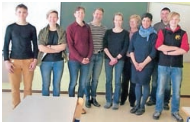
Finski gostje so obiskali Osnovno šolo Toneta Čufarja Jesenice.