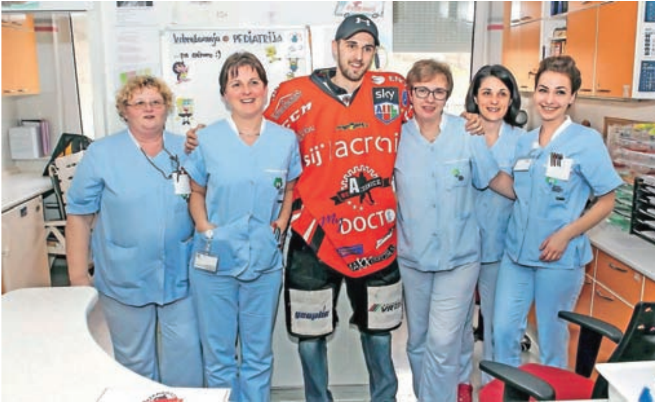
Hokejisti so polepšali dan tudi medicinskim sestram in ostalemu osebju.

Jeseniški hokejisti so še enkrat dokazali, da niso samo odlični športniki, ampak tudi super fantje. Tako so z obiskom razveselili otroke na pediatričnem oddelku Splošne bolnišnice Jesenice. Predstavili so jim hokej, hokejsko opremo, jim povedali, kako trenirajo, podelili pa so jim tudi diplome, s katerimi so malčki postali uradni navijači ekipe HDD Jesenice.