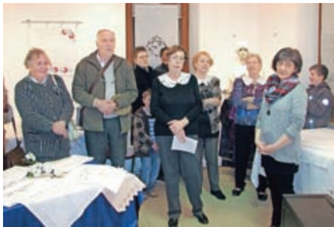
Obisk vezilj iz Boršta pri Trstu

tehnike vezenja. Nekatere so zelo stare in so ljudskega izvora, druge pa so nove, saj so nastale v začetku tega stoletja. "Razstavljene so bile slovenske narodne vezenine s križci, vezenine v tehniki "Hardanger" iz Norveške, "hesensko vezenje" iz Nem-