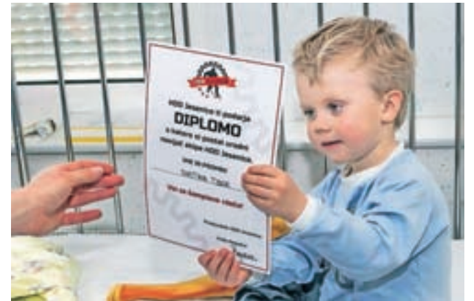
Otroci so dobili diplome, s katerimi so postali uradni navijači ekipe.