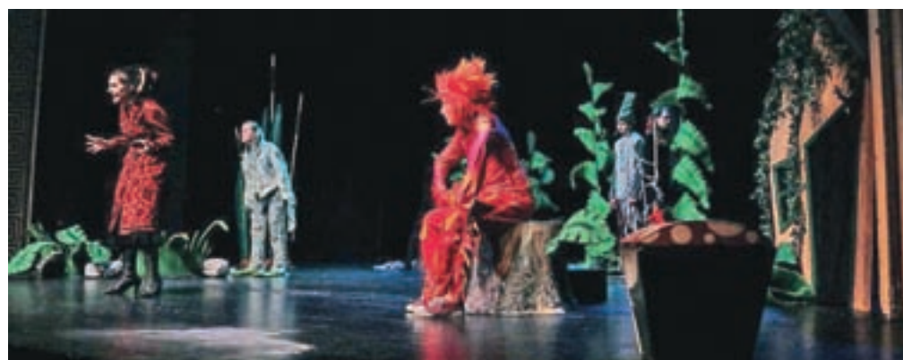
Otroška gledališka skupina pri Gledališču Toneta Čufarja Jesenice je nastopila s predstavo Coprnica Zofka.