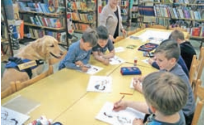
Na Noči z Andersenom je bila tudi psička Honey.

Drugošolci Osnovne šole Toneta Čufarja so Noč z Andersenom znova preživeli v šoli.