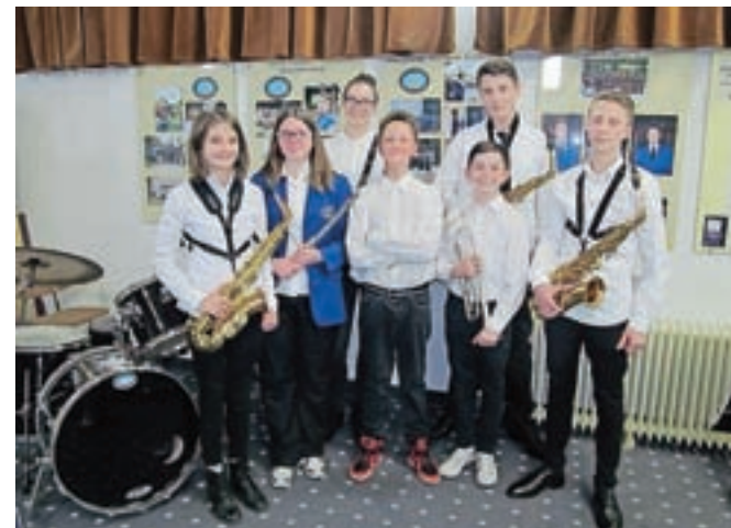
Del mladih godbenikov, ki so pomladili vrste pihalnega orkestra.