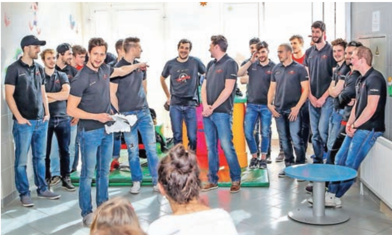
Jeseniški hokejisti so razveselili otroke na pediatričnem oddelku Splošne bolnišnice Jesenice.