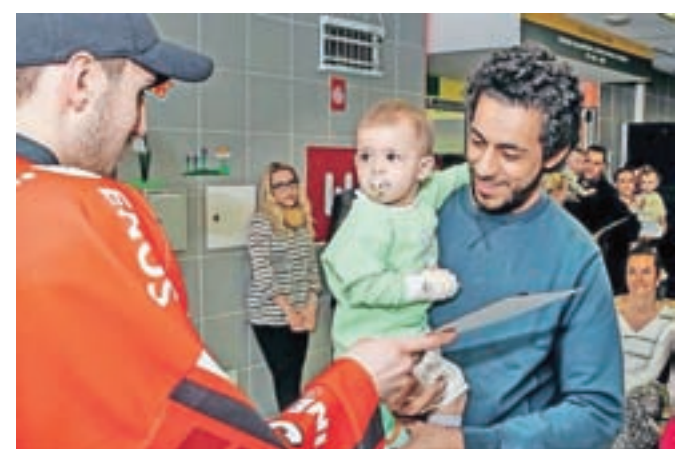
Eden najmlajših novih navijačev ... / BESEDILO: URŠA PERNEL