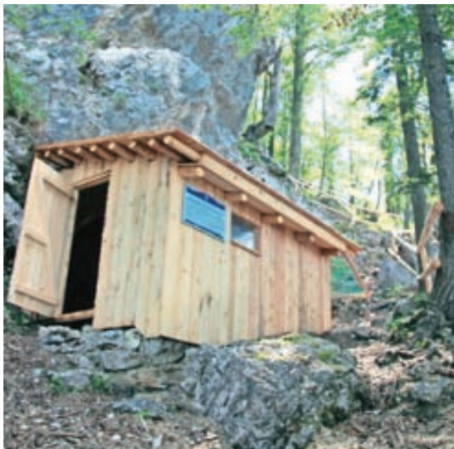
Prenovljena mala partizanska bolnišnica na Mežakli