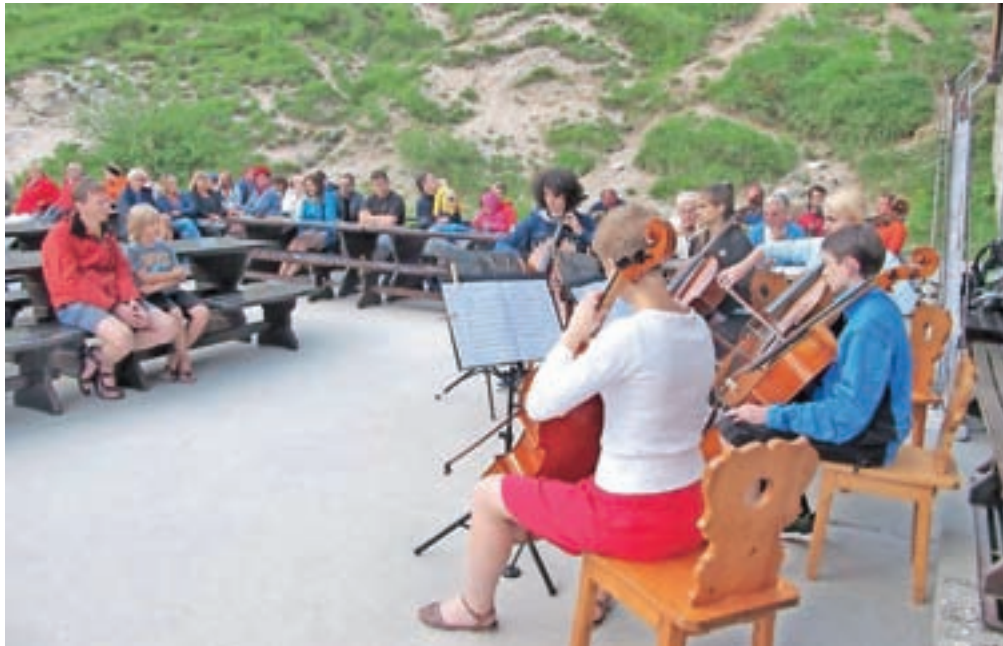
Na praznovanju petdesetletnice novega Tičarjevega doma so nastopili mladi glasbeniki z Orkesterkampa.

Tičarjev dom je poleti ena najbolj priljubljenih planinskih postojank, ki je v upravljanju Planinskega društva Jesenice. V pol stoletja je dom prešel več burnih obdobj. Prvo kočjo na tem mestu je kot protiutež nemško-avstrijski Vossovi kočji na Vršiču (sedanji Erjavčevi kočji) zgradilo Slovensko planinsko društvo na pobudo in ob pomoči dr. Josipa Tičarja, predsednika kranjskogorske podružnice društva. Imenovala se je Slovenska kočja, odprli pa so jo 4. avgusta leta 1912. Med prvo sve-