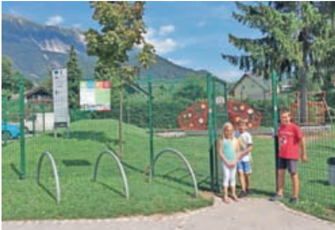
Nova zaščitna ograja na otroškem igrišču na Slovenskem Javorniku