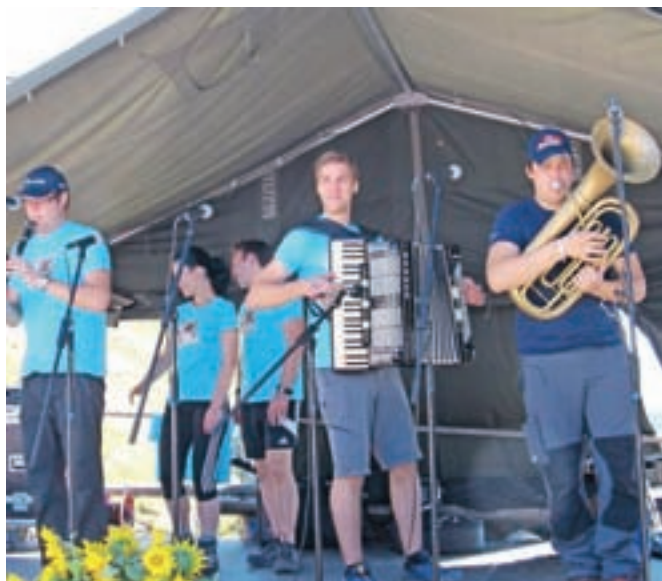
Ansambel Saša Avsenika je že lani pri Koči na Golici poskrbel za odlično vzdušje.

"Planinci prihajajo z vseh vetrov. Poleg domačih in že stalnih iz sosednjih držav so prvič prišli Španci, Francozi in Rusi. Veliko imajo nočitev, saj planinci opravljajo slovensko transverzalo, ki vodi čez Golico. V koč so spet vrača pravo planinsko razpoloženje z glasbo in pesmijo. Vsem sta na voljo dve harmoniki in kitaro – in kdor ju obvlada, lahko poskrbi za veselo vzdušje za vse v koči," pravijo v društvu. Društveni markacisti stalno skrbijo, da so poti na Golico dobro urejene in varne. V koči pa želijo urediti osrednjo informacijsko točko za ta del Karavank.