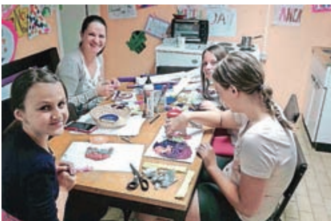
Ena od počitniških delavnic v dnevnem centru društva Žarek

nistrstvo za delo in Fundacija za financiranje invalidskih in humanitarnih organizacij v RS.