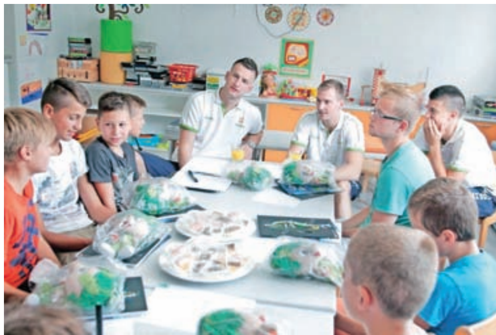
Košarkarji so klepetali z otroki in odgovarjali na njihova vprašanja.

Trije člani slovenske košarkarske reprezentance, ki so bili konec julija na pripravah v Kranjski Gori, so polepšali dan malim bolnikom na pediatričnem oddelku jeseniške bolnišnice. Zoran Dragič, Alen Omić in Matic Rebec so prav nič zvezdniško klepetali z otroki, ki so počitniške dni morali preživljati v bolniških posteljah. Razveselili so jih tudi z darili: maskoto Lipko, knjigo Lipko in Košorok in zvezki iz košarkarske kolekcije. Na koncu so otroci dobili tudi avtograme, s košarkarji pa so se tudi fotografirali. In kaj so jim med drugim povedali košarkarji? Da jim košarka pomeni vse, da trenirajo dvakrat na dan, da pred tekmo navadno nimajo treme («Pozabim vse in igram,» je dejal Alen Omić), razen morda pred kakšnimi pomembnimi obračuni ... Zoran Dragič je med drugim povedal, da je vesel, da je košarka njegova služba, saj v njej res uživa. Z bratom