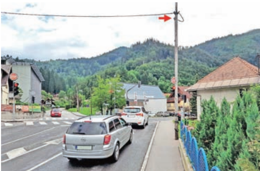
V sklopu analize stanja na področju prometa je na štirih križiščih potekalo anonimno štetje prometa s pomočjo kamer.

Občina Jesenice je aktivno začela z izdelavo celotne prometne strategije. Gre za strateški dokument, ki je namenjen reševanju izzivov občine na področju prometa. Celotna prometna strategija poudarja pomen postopnega reševanja problemov in podaja ukrepe, ki bodo podlaga za izboljšanje trajnostne mobilnosti. Dokument predstavlja tudi podlago za boljši dostop do sredstev Evropske unije. V proces priprave so vključeni strokovnjaki, predstavniki občine, občani in druga zainteresirana javnost. Za sprejem pretehtanih odločitev je nujno in neobhodno tesno sodelovanje vseh akterjev. Izdelava dokumenta bo zato potekala več mesecev in bo sestavljena iz