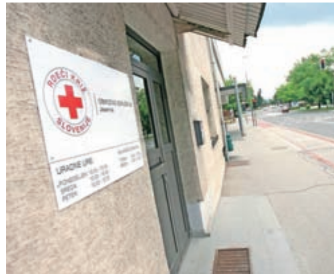
Rdeči križ Slovenije – Območno združenje Jesenice ima zdaj prostore v pritličju stavbe nekdanje policije.

njem letu pomoči dovolj, dobave pa so redne. Tako so samo letos razdelili že blizu devet tisoč litrov mleka, štiri tone moke, štiri tone in pol testenin, dve toni in pol riža, dva tisoč litrov olja ... Jeseni pričakujejo novo pošiljko pomoči, ki jo bodo vso razdelili med občane. "Kolikor pomoči bi imeli, bi jo razdelili. To je dodatna pomoč, ne morejo pa občani samo s tem preživeti," sta ob tem poudarili sogovornici. Kot sta dodali, pa so letos na letovanje odpeljali tudi 28 otrok iz občin Jesenice, Kranjska Gora in Žirovnica.