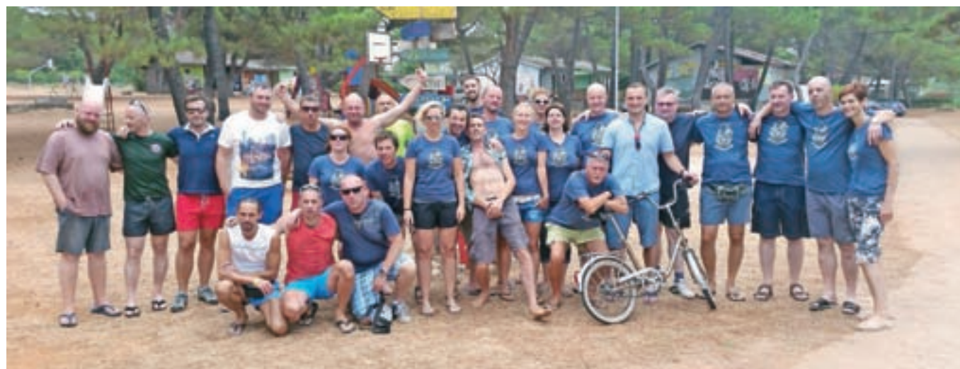
Na cilju v Pineti