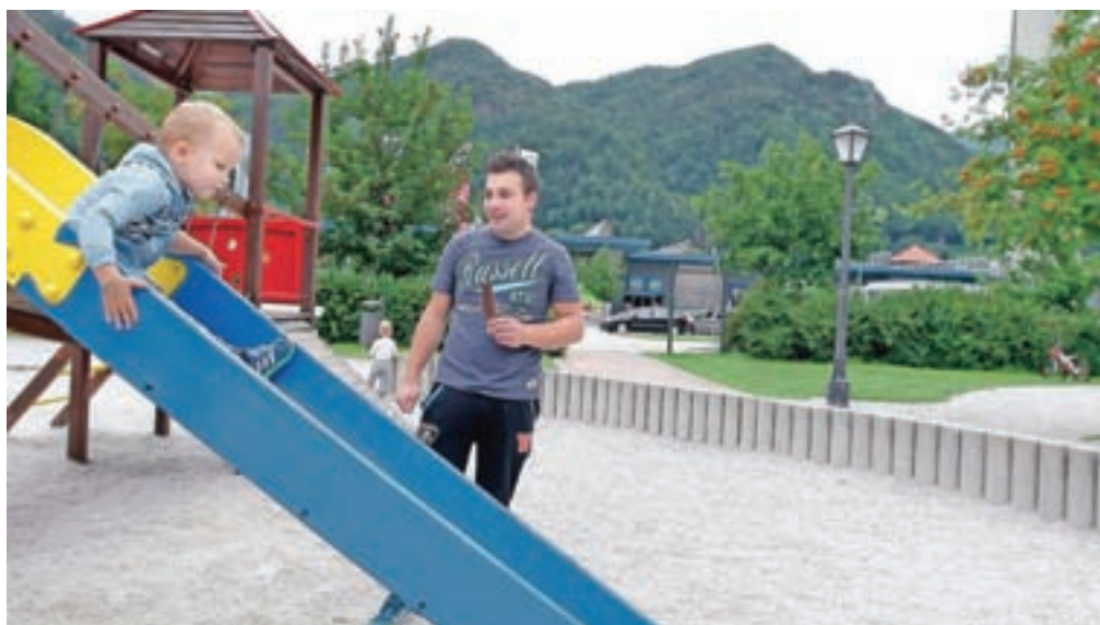
Ena od možnosti je, da bi igrišče na Stari Savi povečali, tako da bi postalo centralno jeseniško otroško igrišče.