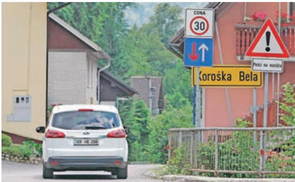
Na obnovljenem odseku ceste v Trebežu, kjer je onemogočeno normalno srečevanje vozil, je največja dovoljena hitrost trideset kilometrov na uro.

Potem ko so stanovalci Trebeža že dalj časa opozarjali na komunalno problematiko (poudarili so zlasti potrebo po gradnji kanalizacije, obnovi vodovoda in rekonstrukciji ceste), je Občina Jesenice novembra lani pričela projekt izgradnje kanalizacije za komunalno odpadno vodo na območju Cesta v Rovte–Trebež. Projekt so zaradi finančne obsežnosti razdelili v dve fazi in prva, vredna več kot 360 tisoč evrov, je zdaj zaključena. V tem sklopu so zgradili kanalizacijski sistem v dolžini približno petsto metrov, obnovili vodovodno omrežje in cesto od križišča Ceste talcev s Cesto v Rovte do mostu čez vodotok Javornik. Izvajalec je bilo podjetje Garnol iz Kranja. S tem pa projekt še ni zaključen, predvidoma naslednje leto bodo zgradili kanalizacijo in obnovili vodovod še na trasi od mosta čez potok Javornik do hišne številke Cesta v Rovte 11. A če so prebivalci Trebeža zadovoljni, da so vsaj v delu naselja dobili novo komunalno infrastrukturo, pa se je pojavila nova težava. Obnovljena cesta namreč zdaj dopušča večje hitrosti vožnje, zato so nekateri vozniki začeli po njej voziti prehitro. Tako je na predlog kra-