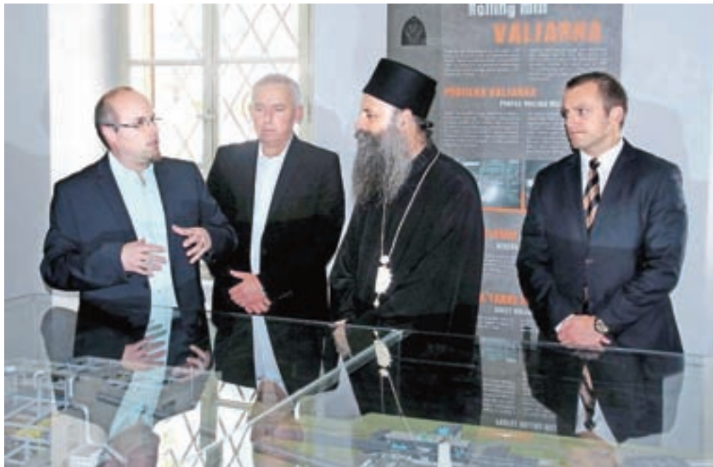
Visokemu dostojanstveniku pravoslavne cerkve so razkazali tudi Ruardovo graščino.

Kot je še poudaril metropolit, je namen obiska iskanje rešitev za bogoslužje pravoslavnikov vernikov: »Pogovarjali smo se o različnih možnostih, tako trajnih kot začasnih. Zato smo tudi obiskali cerkev na Stari Savi, ki je v lasti občine, a potrebuje velik materialni vložek, kar bo trajalo. Pomembno je predvsem to, da smo naleteli na razumevanje in bomo lahko sporazumno iskali rešitve za naše vernike.«