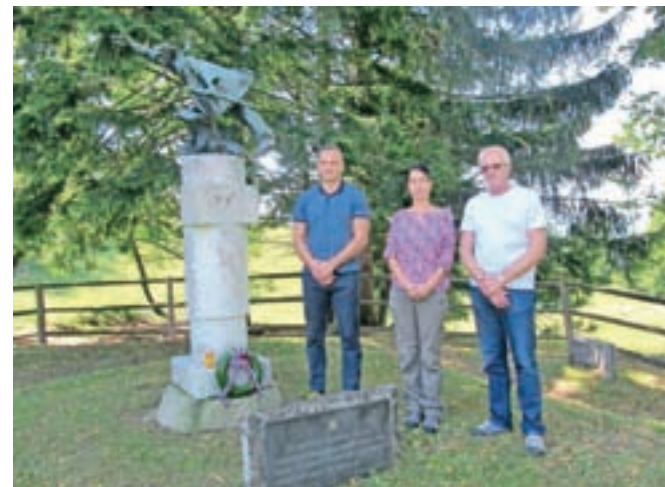
Polaganje vencev k spomeniku na Obranci

Prvi avgust je bil vrsto let praznik občine, leta 1998 pa so tedanji občinski svetniki za sedanji občinski praznik določili 20. marec, ko je bil leta 1929 trg Jesenice preimenovan v mesto. Prvi avgust pa se je preimenoval v spominski dan.