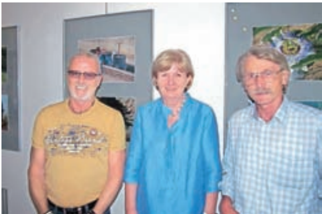
Najboljši fotografi Fotokluba Jesenice