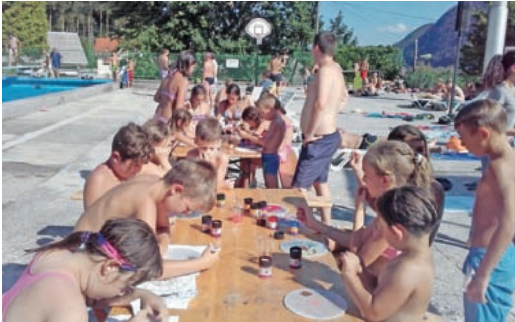
Ustvarjalne delavnice na bazenu Ukova

V mladinskem centru se je med počitnicami dogajalo že marsikaj, veliko dejavnosti pa osnovnošolce in mlade še čaka, obljublja Tkalecva. Do prve polovice julija je bilo najbolj živahno vsak ponedeljek, torek in sredo na Petrinih vodenih aktivnostih Fletno poletno za osnovnošolce v soseski Center II. Skupaj s sodelavci športnega programa so mlade razveselili s postavitvijo plezalne stene in drugimi športnimi igrami. Pestro je bilo tudi ob torkih popoldne na Kopaljšču Ukova, kjer je ponudbo družabnih iger do-