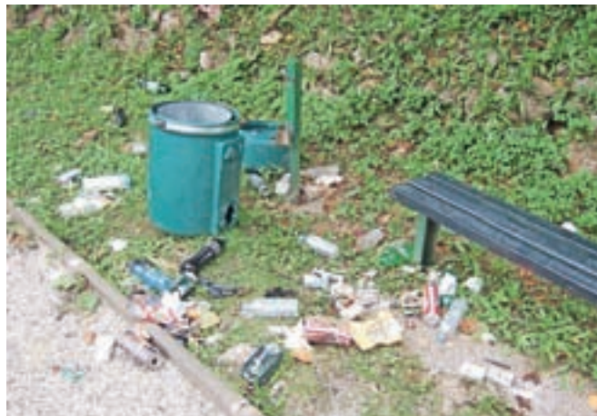
Poškodovani koši za odpadke / BESEDILO: URŠA PETERNEL