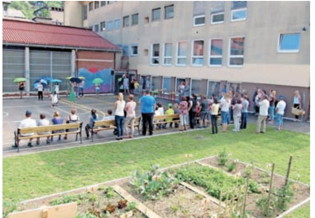
Ob zunanjem igrišču je tudi šolski vrt.