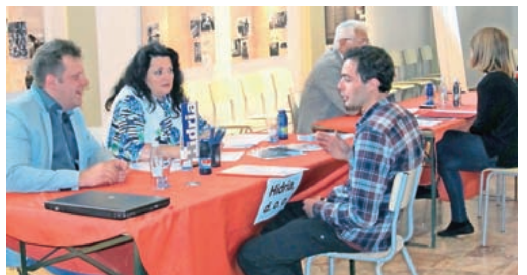
Mladi iskalci zaposlitve so imeli priložnost spoznavanja delodajalcev v obliki hitrih zmenkov.