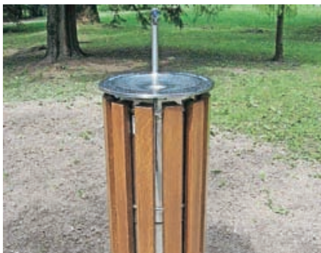
Uničeni ventili na pitniku v Spominskem parku