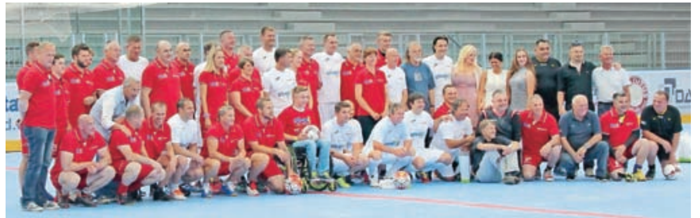
Udeleženci nogometne tekme med legendami športnega društva Olimpiki in Jeseniškimi legendami