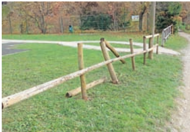
Uničena ograja na otroškem igrišču na Slovenskem Javorniku