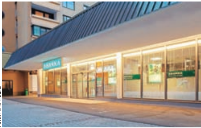
Prenovljena poslovalnica Abanke na Jesenicah

Abanka je prenovila in tehnološko posodobila poslovalnico na Jesenicah. Prenova je trajala štiri mesece, v tem času pa je poslovanje potekalo na začasni lokaciji v neposredni bližini, tako da so stranke ves čas lahko nemoteno opravljale svoje storitve. Kot so pojasnili v banki, je bila jeseniška poslovalnica ena prvih, ki so jo odprli, in sicer že leta 1971. Na sedanji lokaciji deluje od leta 1989. Banka za stranke posluje od ponedeljka do petka od 9. do 17. ure. Abanka ima na Gorenjskem še dve poslovalnici, in sicer v Kranju in v Trzinu.