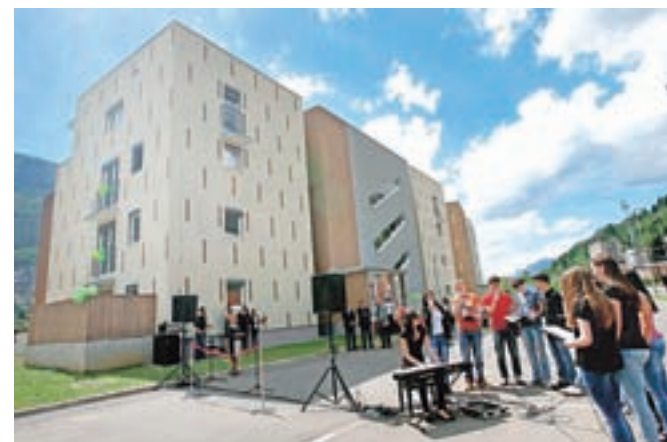
V novi soseski je dvainšestdeset stanovanj.

Jesenice so dobile dvainšestdeset novih stanovanj.