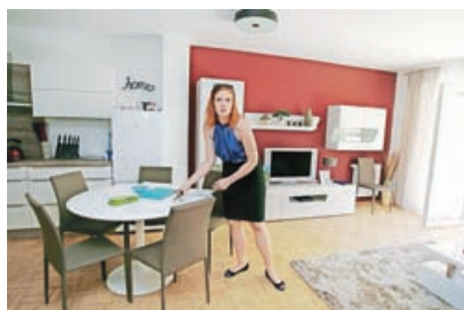
Na ogled je tudi vzorčno stanovanje.