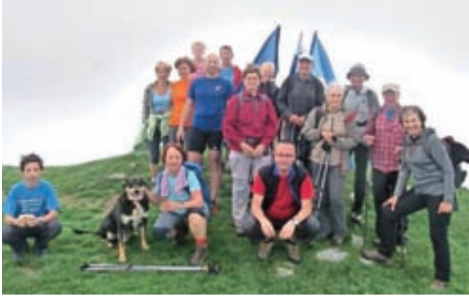
Pohodniki na vrhu Golice

Prazničnega pohoda na Golico se je udeležilo okrog štiristo pohodnikov.