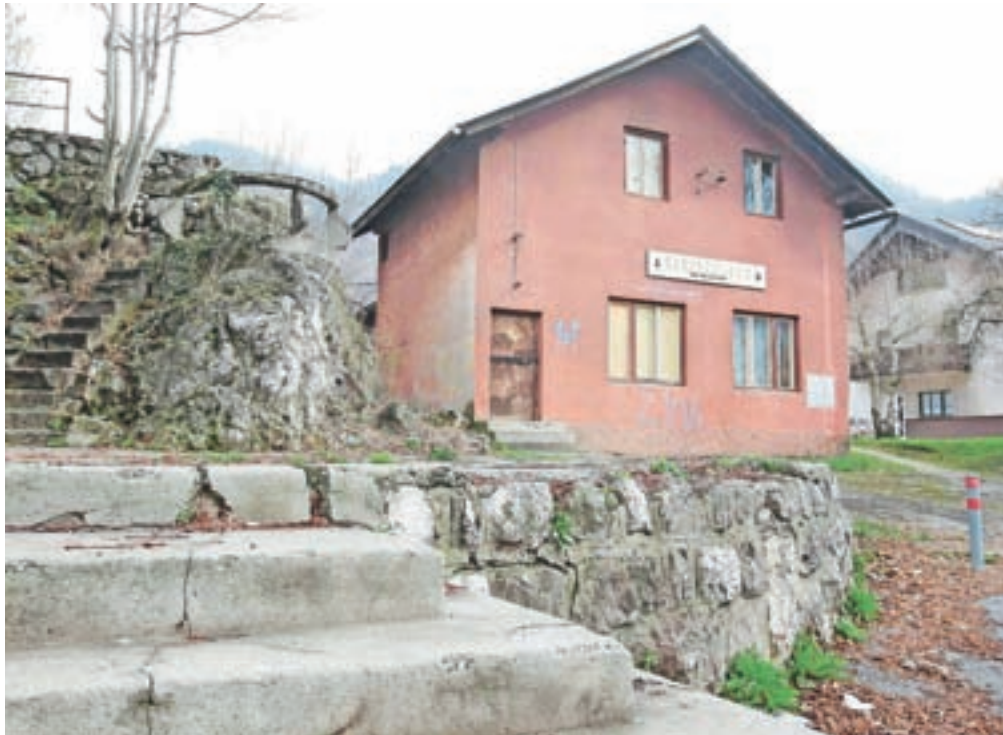
Ob Šahovskem domu, kjer je bil nekdanji paviljon, stoji velika skala, pod katero so v zadnjih letih priredili tudi nekaj predstav na prostem.