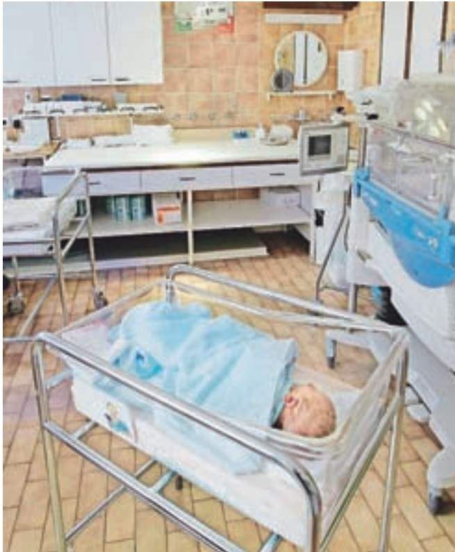
V bolnišnici bi med drugim radi obnovili tudi prostore za nego novorojenčkov.

Oddelek za ginekologijo in porodništvo je bil v jeseniški bolnišnici ustanovljen že leta 1949. Prostori oddelka so bili prvič obnovljeni leta 1985, drugič pa leta 2013 oziroma 2014. Takrat so z lastnimi sredstvi in s pomočjo donacij prenovili prvi del porodnega oddelka, to je porodni blok. Z drugim delom prenove pa bodo poskrbeli za prijetnejše okolje za oskrbo novorojencev, porodnic in otročnic, so povedali v bolnišnici.