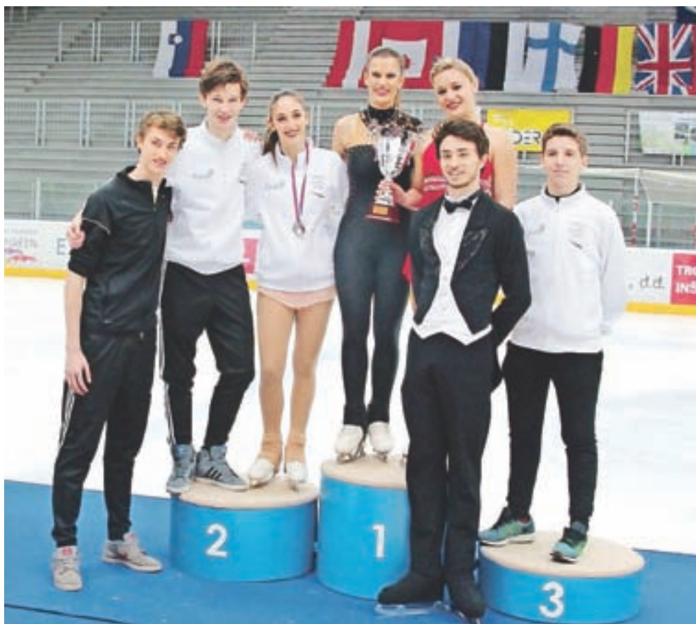
Zmagovalci Triglav trophyja – velika in močna ekipa iz Italije