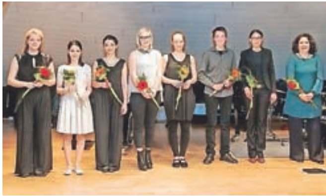
Koncert dijakov in študentov