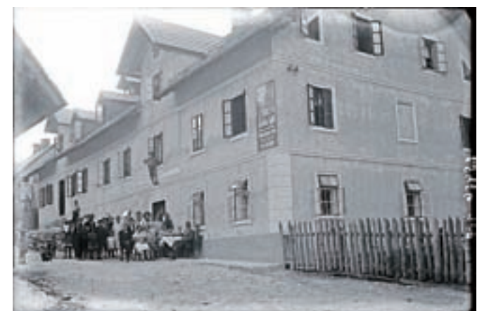
Gostilna Lasan (hrani Gornjesavski muzej Jesenice)

li »šintarji«, kot so rekli slabim zobozdravnikom. Z zbiranjem fotografij, predmetov in spominov bomo nadaljevali v sredo, 13. aprila, ob 10. uri. V Železar-