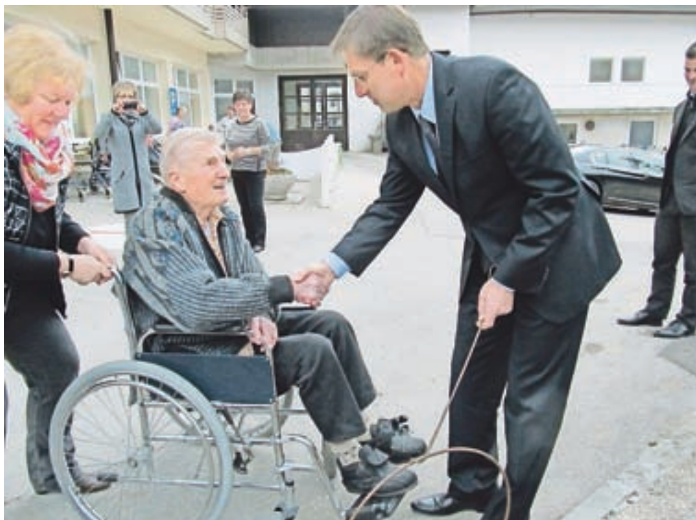
Predsednik vlade Miro Cerar se je starostnikom pridružil pri igranju starih železarskih iger, ki so jih pripravili s pomočjo Gornjesavskega muzeja Jesenice.

Prejšnja sobota je bila tako za stanovalce kot zaposlene Doma dr. Franceta Bergelja Jesenice res poseben dan, saj jih je obiskal predsednik vlade in stranke SMC Miro Cerar. V sklopu dneva za spremembo je preživel slabo uro v druženju s starostniki in učenci Osnovne šole Toneta Čufarja Jesenice, ki stanovalce Doma redno obiskujejo. Tokrat so se medgeneracijsko družili ob igranju starih železarskih iger, kot so metanje podkve, obešanje perila, vrtenje kolesa, pri katerih se jim je pridružil tudi predsednik vlade. "Z zgledom je treba pokazati, da je treba iti med ljudi, še posebej tiste, ki potrebujejo pomoč. Spodbujati je treba tudi medgeneracijsko sodelovanje in to, kar sem videl danes, je res odlično, videl sem mlade in starejše skupaj, vse nasmejjane, kako obujajo spomine na starodavne igre, se skupaj zabavajo in pogovarjajo. To je tisto, kar je pomembno za našo družbo," je dejal premier, ki se je tudi sprehodil po Domu ter v prijetnem in