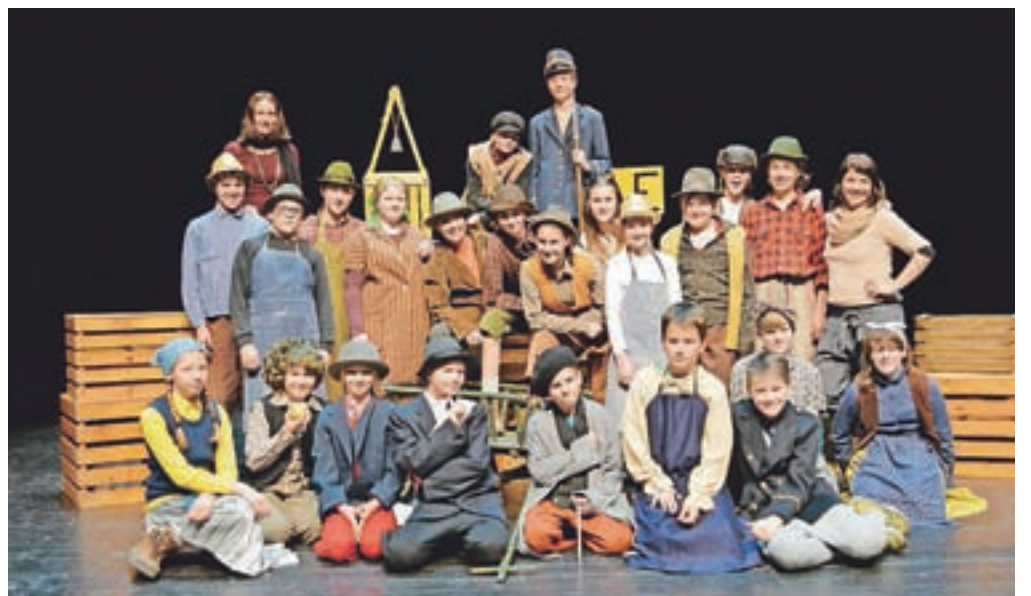
Otroška predstava Butalci v izvedbi igralcev gledališke šole pri Gledališču Toneta Čufarja Jesenice

Šest. Butalce so premierno uprizorili 24. marca na odru jeseniškega gledališča, s predstavo, ki traja štirideset minut, pa so sodelovali tudi na pravkar končanem Kekčevem srečanju na Jesenicah.