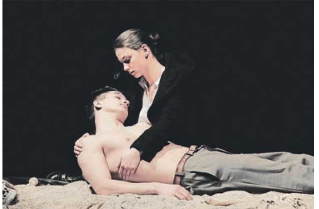
Dijaki so izvrstno "dorekli" zahtevne vloge.