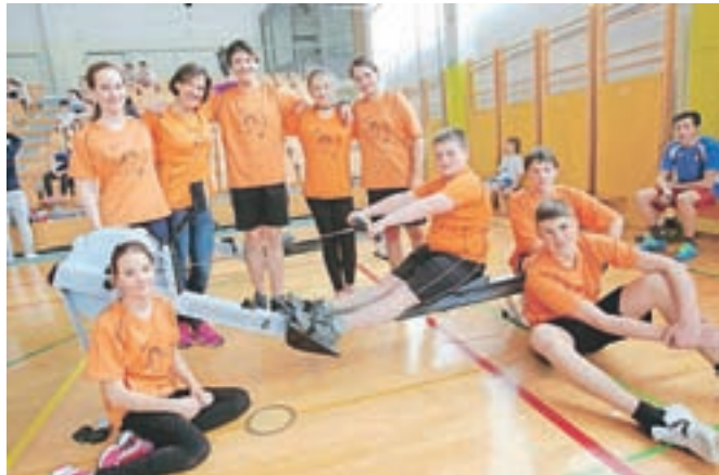
Veslači z OŠ Koroška Bela ...