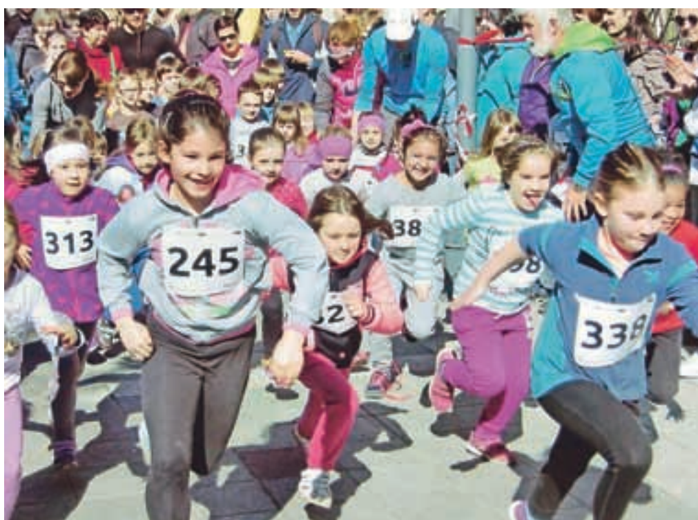
Najmlajši na startu