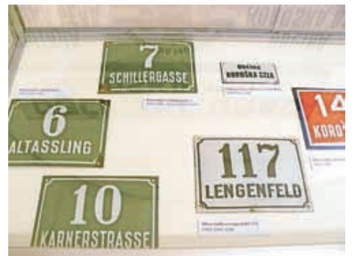
Tablice z imeni ulic in s hišnimi številkami