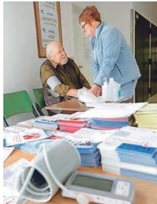
Obiskovalce so seznanjali s pomenom zdravega delovanja ledvic.

V Splošni bolnišnici Jesenice so obeležili svetovni dan ledvic.