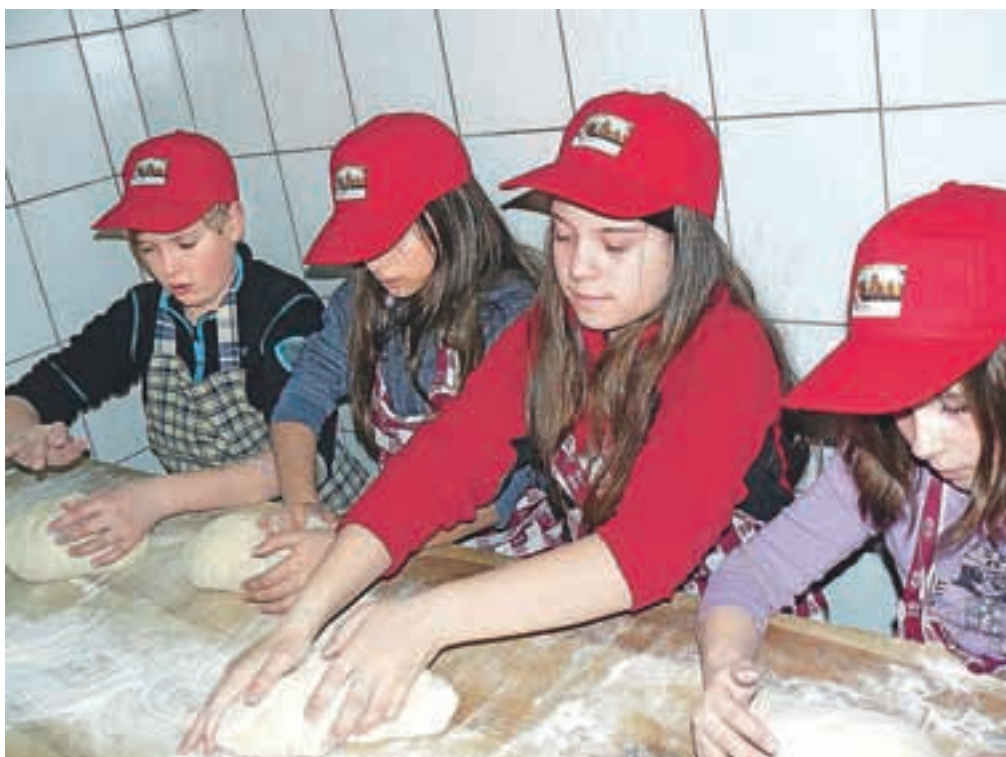
Vsak pregnete svoj hlebček.