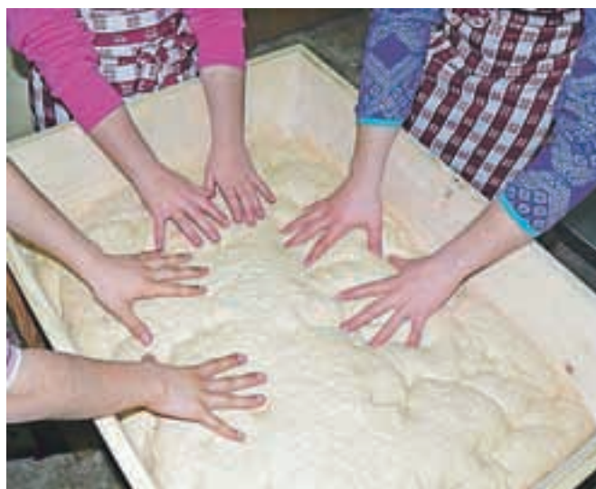
Roke malih pekov, ki pomagajo speči kruh.