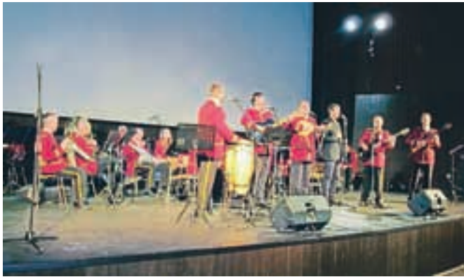
Mestna godba Pag in Klupa Sol

Gostje s Paga so pripravili dva koncerta in uživali v spremljevalnem programu obiska, tudi na drsanju in pri igranju hokeja.