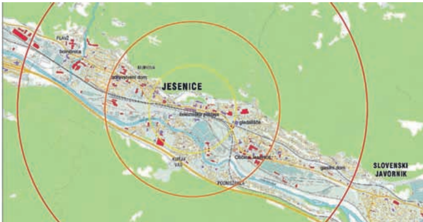
Radiji oddaljenosti: z železniške postaje lahko v manj kot petnajstih minutah pridete peš do zdravstvenega doma, športne dvorane Podmežakla ali do občine, v manj kot pol ure pa do bolnišnice.

ure že cela dva kilometra. Na risbi je z rumeno prikazan 500-metrski radij, z oranžno 1-kilometrski radij in z rdečo 2-kilometrski radij na primeru Jesenic. Z železniške postaje lahko torej v manj kot petnajstih minutah pridete peš do zdravstvenega doma, športne dvorane Podmežakla ali do občine, v manj kot pol ure pa do bolnišnice. Torej Jesenice le niso preveliko mesto za pešačenje, kajne! Hoja ima obilo pozitivnih vplivov na zdravje in počutje ljudi. Ljudje, ki hodijo, so na splošno bolj zdravi, bolj odporni, bolje razpoloženi, bolje se spopadajo z vsakodnevnimi izzivi, med hojo se sprostitijo, vidijo kaj novega, srečajo ljudi, ki jih že leta niso videli. Torej Homo sapiens, kaj še čakaš? Pamet v roke in pot pod noge!