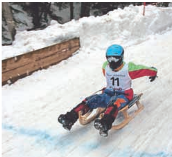
Številni mladi sankači kažejo, da se zanimanje za sankanje na naravnih progah počasi povečuje.