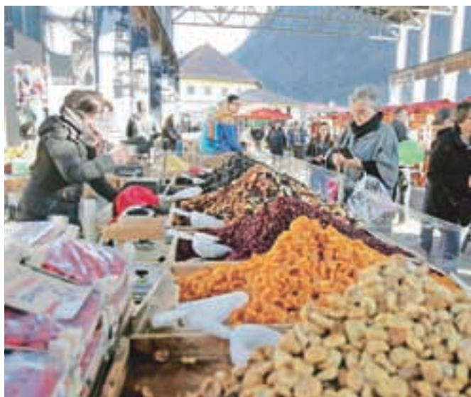
Jožefov sejem je letos trajal tri dni.

pridružil Društvo za razvoj turizma Jesenice. Program so napolnili s posebnim dogajanjem, tržnico piva, ki je s ponudbo odličnih butičnih vrst piv navdušila obiskovalce, potekal je kviz o spoznavanju Jesenic (Mimogrede: ali veste, katera je najnižja točka jeseniške občine?), predstavili so delček turistične ponudbe z liki Stare Rudne poti, vse dni pa je potekal tudi glasbeni program. Ponovno je zaživel tudi gostinski lokal na tržnici, imenovan Kavarna Stara Sava.