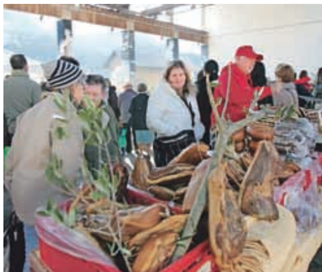
Posebno pestra je bila ponudba mesnin.