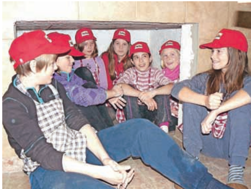
Ko se kruh peče, otroci posedejo pod peč in zapojejo.