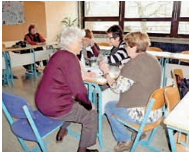
Meritve krvnega sladkorja in krvnega tlaka

Pri Društvu upokojencev Jesenice so leta 2007 začeli izvajati vseslovenski projekt z naslovom Starejši za starejše. Glavni namen je ugotavljanje in preverjanje kakovosti življenja ljudi, starejših od 69 let. Vključeni niso le člani društva, temveč vsi občani v tej starosti v občini Jesenice, skupaj 2197. Največje breme dela sloni na sedemnajstih prostovoljkih, ki obiskujejo starejše in na podlagi anket pridobijo dragocene podatke. Na njihovo željo jih obiščejo tudi večkrat in ob tem nudijo različno pomoč. Doslej so opravile že 8460 obiskov oziroma več kot 97 odstotkov vseh, ki so zajeti v projekt. V lanskem letu je bilo obiskov 1037, od tega prvih 289, po-