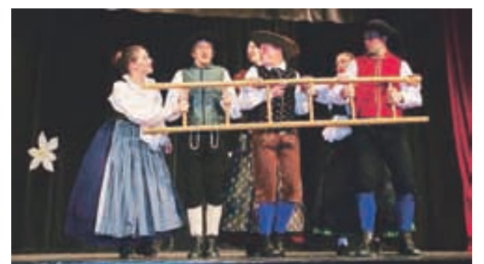
Tako pri otroških kot odrskih folklornih skupinah ni manjkalo pestrosti v odrskih postavitvah.

Sobota 12. marca je bila na Jesenicah pravi folklorni praznik, saj je javni sklad za kulturne dejavnosti – območna izpostava Jesenice pripravil kar dve srečanja, namenjeni otroškim in odraslim folklornim skupinam. Na otroškem srečanju, ki se je odvijalo od 16. ure dalje, so se predstavile otroške folklorne skupine Makedonskega kulturnega društva Ilinden, Kulturno-športnega društva Bošnjakov Biser, predšolska skupina Breznica, folklorna skupina Osnovne šole Prežihovega Voranca, mladi folklorniki Kulturnega društva Triglav Javornik-Jesenice mali Triglav in šolska skupina Breznica, ki so predstavili svoje odrske postavitve. Med odrskimi folklornimi skupinami so letos svoje postavitve predstavili folklorniki MKD Ilinden in KŠD Biser, ki so izstopali s svojo barvitostjo in hitrimi plesi, KUD Triglav Javornik-Jesenice in folklorna skupina Julijana iz Kulturno-športnega društva Hrušica pa z dovršenostjo postavitev, ki so že prave gledališke igre.