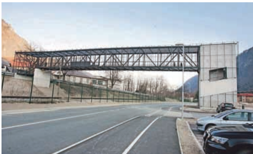
Povezava je dolga 62 metrov, zgradilo pa jo je domače, jeseniško podjetje KOV. Urejeno je tudi dvigalo oziroma dvižna ploščad.