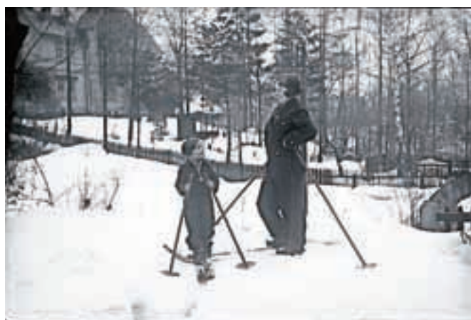
Smučanje v Hrenovici leta 1934