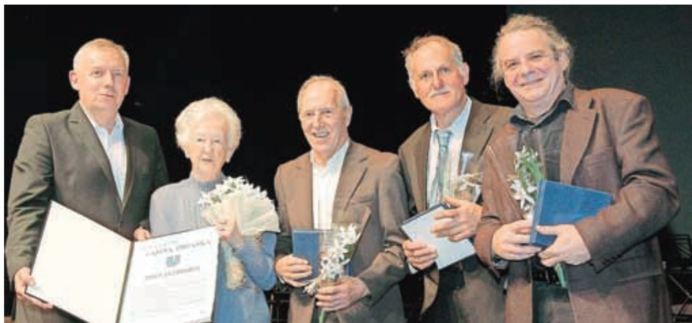
Občinski nagrajenci z županom