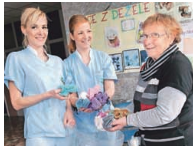
Več kot osemsto parov copatkov čaka na novorojenčke.