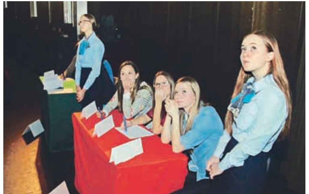
Nastopajoči na letošnjem šolskem kvizu o zgodovini mesta Jesenice so pokazali izjemno znanje.

Mladi nastopajoči so pokazali izvrstno poznavanje Jesenic, tako je na prvi stopnji osnovnih šol preprosto zmajnkalo vprašanj po devetih rednih in desetih dodatnih vprašanjih in so si 1. mesto razdelile kar tri ekipe. Prvo mesto so tako zasedle ekipe