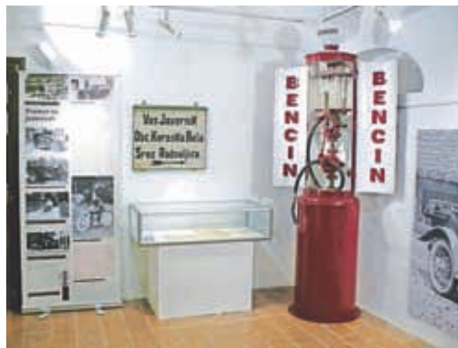
Na ogled so številni zanimivi predmeti, tudi bencinska črpalka.