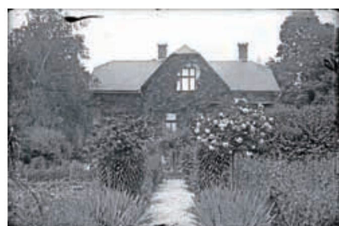
Rudeževa vila pred drugo svetovno vojno (hrani Gornjesavski muzej Jesenice)

V mestu se je število zelenih površin zmanjšalo še za gradnjo stanovanjskih blokov na plavškem travniku in z izgradnjo avtoceste. Izpad so nadomestili z ureditvijo Spominskega parka, trim steze Žerjavec in zelenic med bloki, ki izboljšujejo bivanjski prostor. K temu gotovo pripomogla zasaditev dreves v Hrenovici in odprtje prečne poti med Trgom Toneta Čufarja in muzejskim kompleksom Stara Sava.