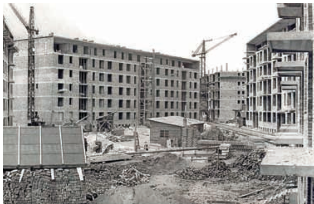
Gradnja stanovanjskih blokov na Cesti revolucije leta 1961

ne in predstavnik sindikata. Odbor je postavil pogoje, da je stanovanje lahko dobi le tisti, ki je v Železarni zaposlen vsaj tri leta in ki s prostovoljnim delom sodeluje pri gradnji. Od proslincev se je pričakovalo petsto ur prostovoljnega dela pri izkopu temeljev, kanalizacije, komunalnih naprav, pri ureditvi dvorišča in drugih pomožnih delih. Stanovanja so bila predvidena za tri- in štiričlanske družine. Bila so v izmeri od 35 do 40 m 2 . Ker je bila stanovanjska stiska res velika, so se dogajale nenavadne zgodbe. Tako je imetnik stanovanjske pravice živel s šestčlansko družino v majhnem stanovanju. Poleg tega je sprejel podnajemnika s štiričlansko družino. Življenjski prostor novih stanovalcev ni bil najboljši. Bile so težave s komunalno infrastrukturo pa z ureditvijo dvorišč in otroških igrišč. Prvi stanovalci šestih novih blokov na Cesti revolucije na Plavžu so se vselili v začetku leta 1962. Več dni so bili brez vode. Ta je namreč v glavnih dovodnih ceveh zamrznila. Po vodo so morali v sosednje hiše. Tudi prihod do bloka je bil težaven, saj so morali po vodi in blatu do vrh gležnjev. Otroci so imeli tudi dokaj dolgo pot do šole na Tomšičevi ulici. Obdobje večjih gradenj je bilo še v začetku osemde-