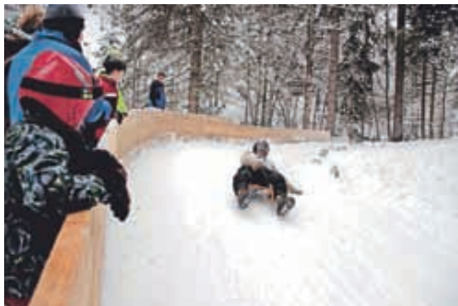
V Savskih jamah so ob mili zimi izvedli prvo tekmo slovenskega pokala v sankanju na naravnih progah.