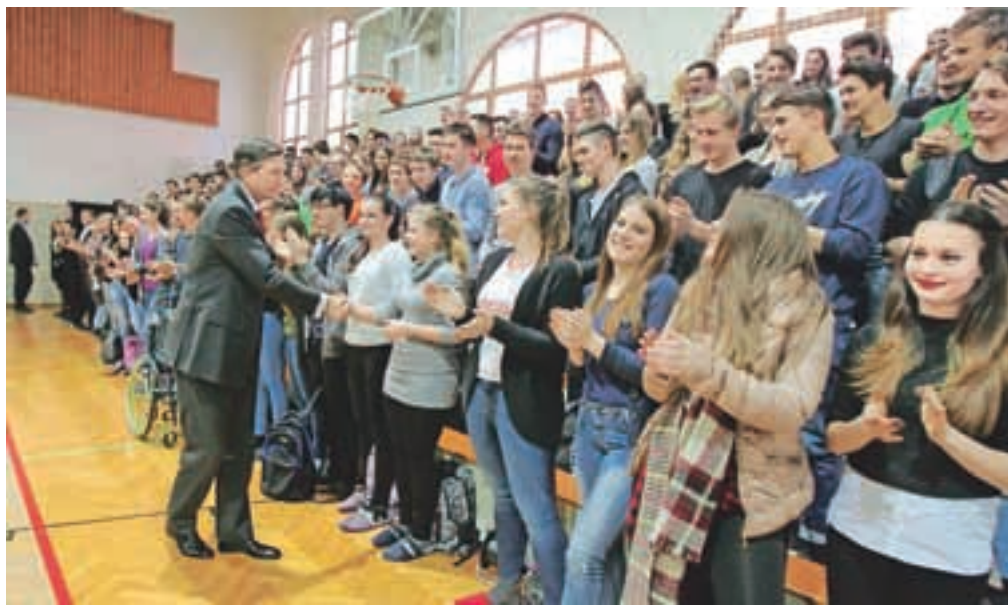
Borut Pahor je prvi predsednik, ki je v več kot sedemdesetletni zgodovini obiskal Gimnazijo Jesenice.