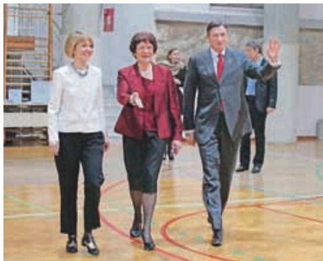
Predsednik države Borut Pahor je častni pokrovitelj projekta Inženirke, inženirji bomo!, s katerimi skušajo mlade navdušiti za tehniške in inženirske poklice.