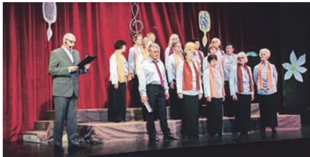
Pevski zbori so dodobra navdušili obiskovalce območnega srečanja pevskih zborov na Slovenskem Javorniku.