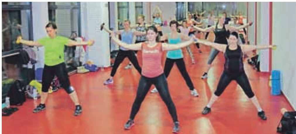
Fly-box je aerobna vadba, primerna tudi za začetnike, ki se niso nikoli ukvarjali s športom.