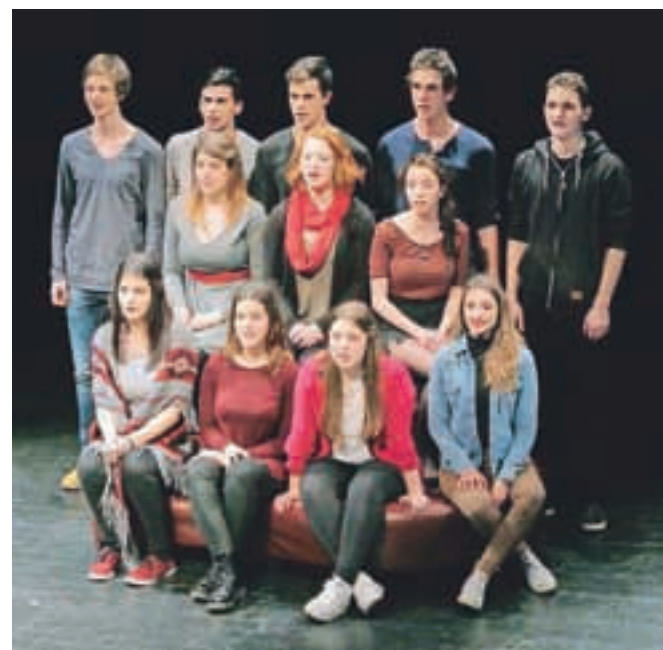
Kot gostje so se letos predstavili člani mladinske gledališke skupine pri Gledališču Toneta Čufarja s predstavo Samo biti .