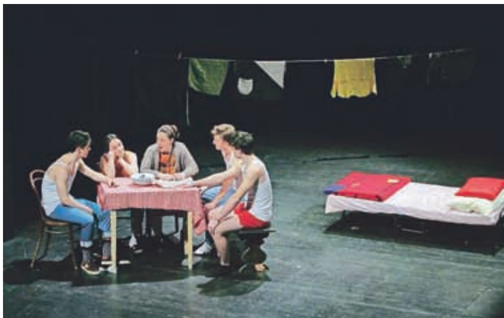
Najboljša predstava po izbiri publike je To so gadi v izvedbi 4. š.

dinske gledališke šole Gledališča Toneta Čufarja Jesenice z odlično predstavo Samo biti v režiji Vida Klemenca.