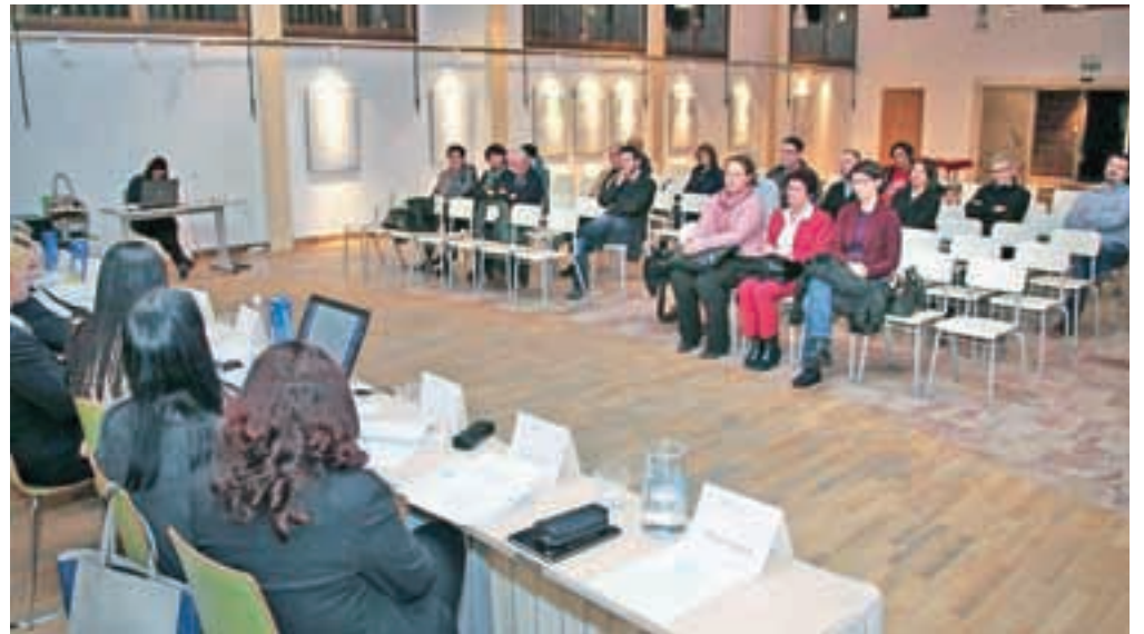
Okrogla miza je bila slabo obiskana.

Občina Jesenice je konec lanskega leta pristopila k novelaciji Občinskega razvojnega programa 2011–2025, ki je eden od temeljnih strateških dokumentov občine, ki opredeljuje vizijo razvoja občine Jesenice do leta 2025, strateške cilje v tem obdobju, prioritete ter programe in projekte, ki so potrebni za uresničevanje teh ciljev. Zaradi ekonomskih, socialnih in drugih sprememb je bila sprememba dokumenta nujna, pri pripravi prenovljenega programa pa je sodelovalo okoli sto udeležencev, od članov občinske uprave do zunanjih strokovnjakov iz vrst lokalnega gospodarstva. Kot ključni projekti so bili izpostavljeni finančne spodbude za razvoj gospodarstva, vzpostavitev neformalnega združenja gospodarskih subjektov, vzpostavitev TCM – managementa mestnih središč, mreženje tako na področju zdravstva in socialnega varstva, kot tudi šolstva in varstva in številni drugi. Dokument so januarja že obravnavali člani občinskega sveta, tretjega februarja pa je bila za vse občane pripravljena še