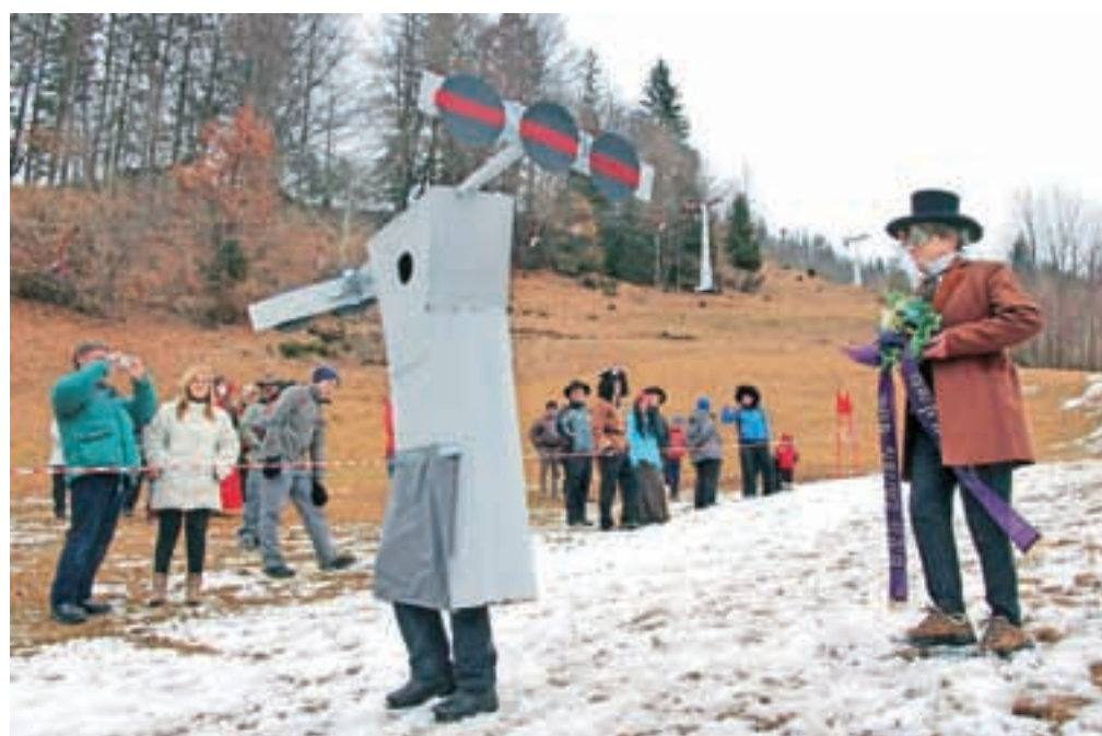
Odrasle maske so kot po navadi prikazale precej lokalne in državne družbene kritike, kot na primer pogreb žičnice Španov vrh.