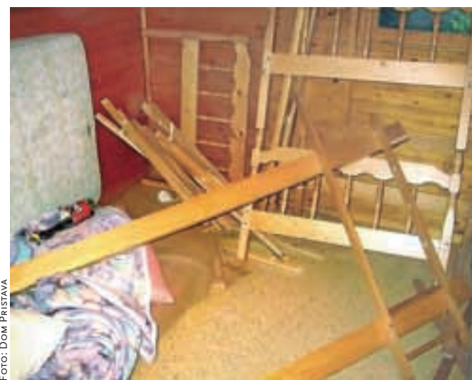
Uničenje inventarja in pohištva je povsem običajno.

bodo vse vrnili ... V nekaj urah se spremenijo. Postanejo nekulturni, nečloveški, počnejo stvari, ki jih razumen človek enostavno ne razume. Da bi kdo hotel slišati o povračilu škode, seveda ni govora, me raje še pretepejo. Izgovori so razno razni, smešni, neumni. Najzadnje sem vsega skupaj še