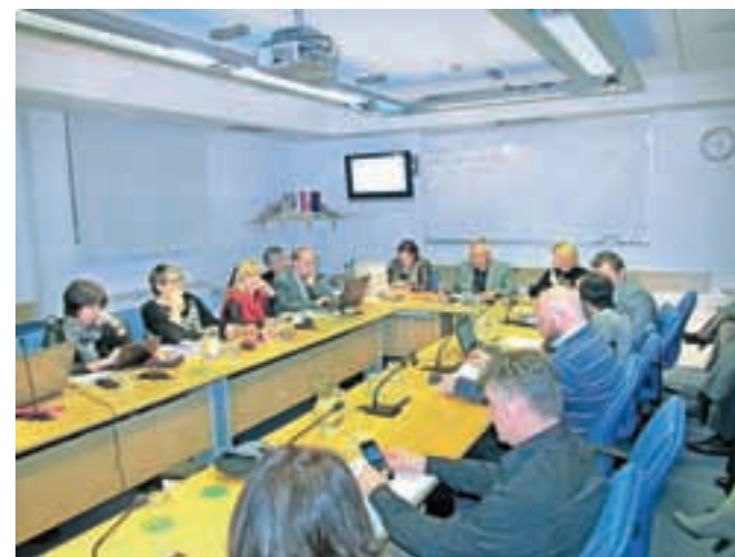
Občinski svetniki s svojimi vprašanji in pobudami pridejo na vrsto ob koncu dnevnega reda seje.

be, torej tisti akti, za katere velja, da se sprejemajo po enofaznem postopku. Poleg tega na dnevni red po potrebi uvrstijo gradivo, s katerim občina pridobiva, razpolaga ali oddaja nepremično premoženje. Temu sledijo predlogi komisije za mandatna vprašanja, volitve in imenovanja in kadrovske zadeve. Kot zadnje točke pa so na dnevnem redu sej programi, poročila in različne informacije. Dnevni red običajno zaključijo z vprašanji in pobudami občinskih svetnikov in odgovori nanje. Občinski svetniki so na predlog programa dela za leto 2016 podali več pobud, med drugim so menili, da bi proračun v prvi obravnavi na mize morali dobiti že na oktobrski seji, v drugi obravnavi pa decembra, zato da bi bilo v vmesnem času dovolj časa za usklajevanje. A v