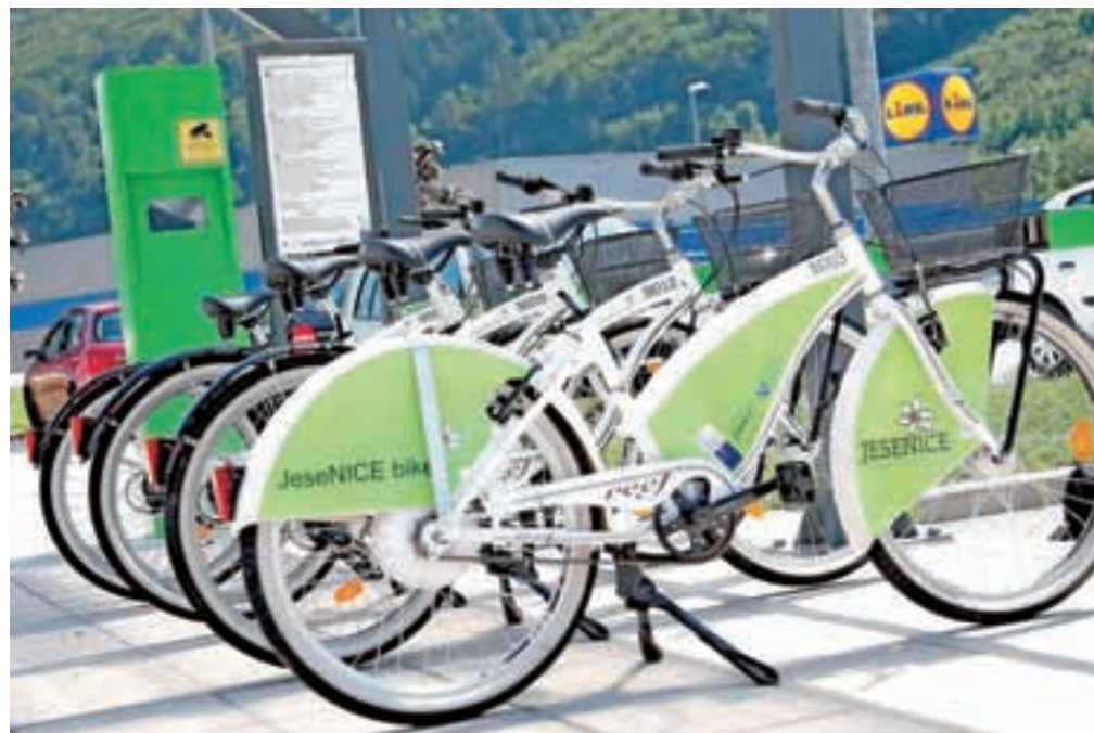
Okolju in človeku prijazni načini potovanja so pešačenje, kolesarstvo, javni potniški promet ...

Celostna prometna strategija vključuje pristope, ki dajejo poudarek na dostopnosti in mobilnosti prebivalcev, hkrati pa poskušajo izboljšati kakovost življenja in bivanja v mestih. Vemo, da je motorni promet eden glavnih povzročiteljev hrupa in slabe kakovosti zraka v mestih, zato je njegovo zmanjšanje ključnega pomena za dvig kakovosti življenja v mestih. S Celostno prometno strategijo bo Občina Jesenice pridobila strateški dokument, katerega sestavni del bo akcijski načrt s konkretnimi ukrepi, ki jih bo morala Občina (in s tem njeni občani) izvesti. Vsak ukrep pa bo