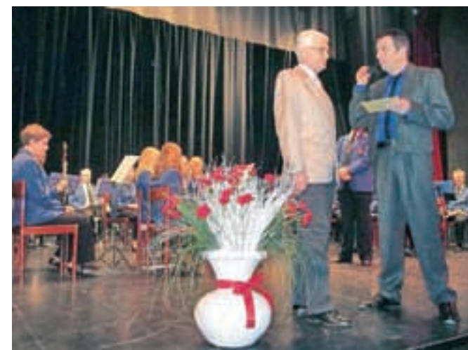
Denar za obnovo so zbirali tudi na dobrodelnem koncertu.

Pri Društvu upokojencev Slovenski Javornik-Koroška Bela so se odločili za obsežnejšo obnovo društvenega doma.