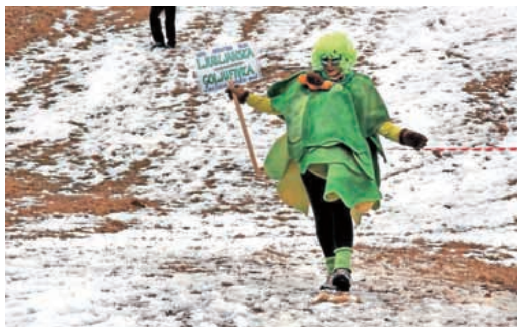
Solata ljubljanska (ledenka) goljufivka, ki je bila v stalni pripravljenosti.