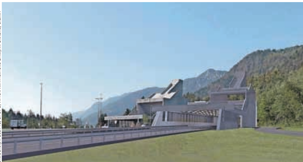
Druga predorska cev bo umeščena vzhodno od sedanje, nov bo tudi portal predora.

Kot so pojasnili na DARS-u, je ta čas v pripravi državni prostorski načrt za umestitev nove cevi in manjkajočega dela avtoceste v prostor. »Načrtovana prostorska ure-