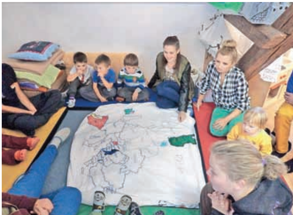
Prostovoljci iz različnih držav so otrokom predstavili države, iz katerih prihajajo. Otroke so naučili pozdrava v tujih jezikih, pesmice in plese.

Tako so se konec lanskega leta vključili v projekt Zavoda za šolstvo z imenom Ustvarjamo prostor za vse, ki bo trajal tri leta. "Kako spodbujati vključevanje otrok in staršev iz drugih kulturnih okolij v dejavnosti vrtca? Kako pomagati staršem in otrokom iz drugih kulturnih okolij pri vključevanju v vrtec? To so raziskovalna vprašanja, na katera bomo iskali konkretne rešitve. Zbirali bomo primere dobre prakse, pripravili interni slovar in prevod vpi-