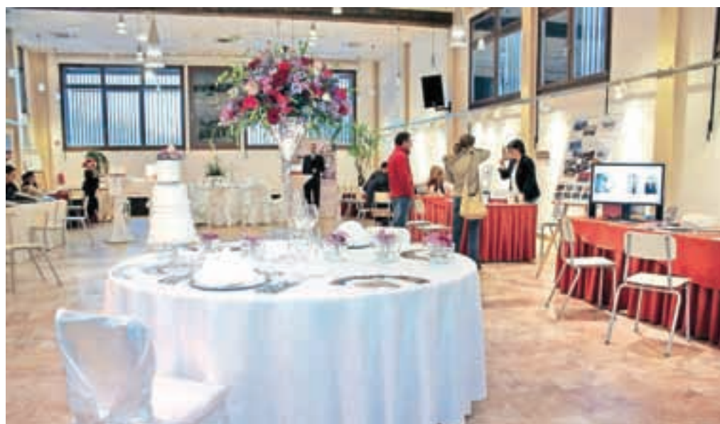
Poročni sejem so na Jesenicah organizirali že petič.