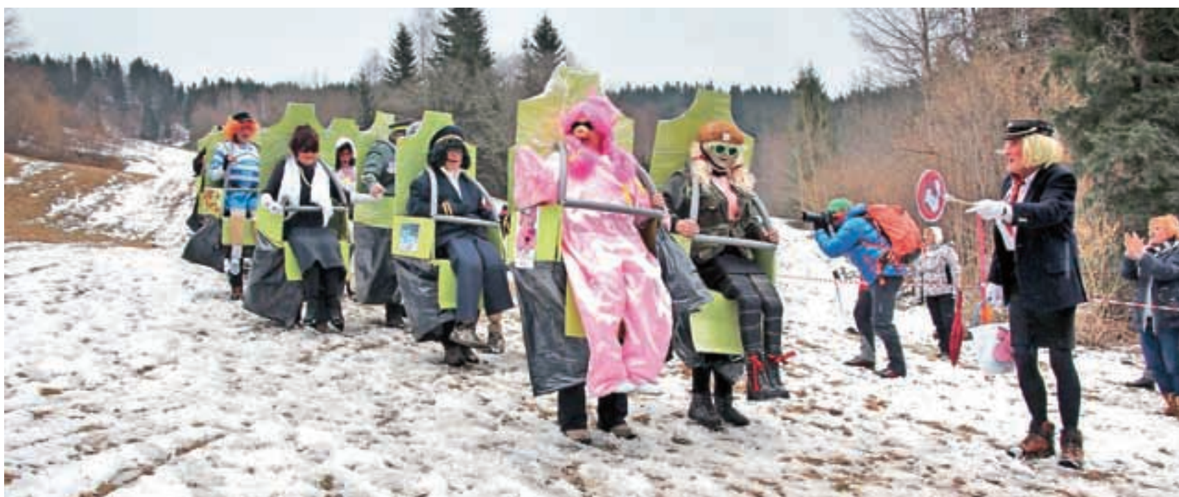
Za najboljšo skupinsko masko je bil izbran vlak smrti Španov vrh.

pravijo organizatorji, se za prihodnost prireditve ni bati, kljub številnim ugibanjem zaradi negotove usode smučišča. Še vedno pa si zelo želijo tudi vrnitve na stari prireditveni prostor na Črnem vrhu.