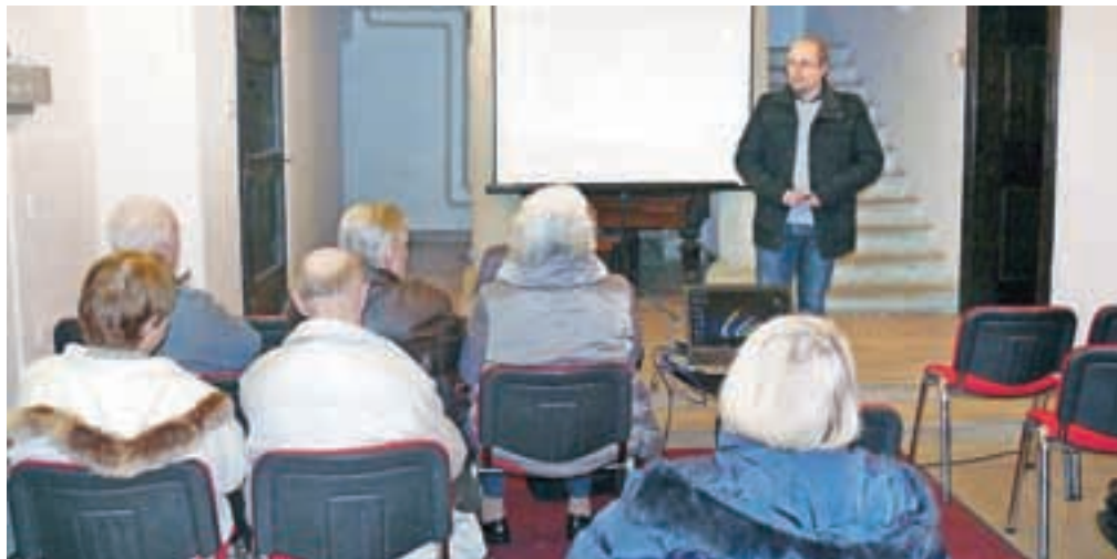
Muzejski večer v Kosovi graščini