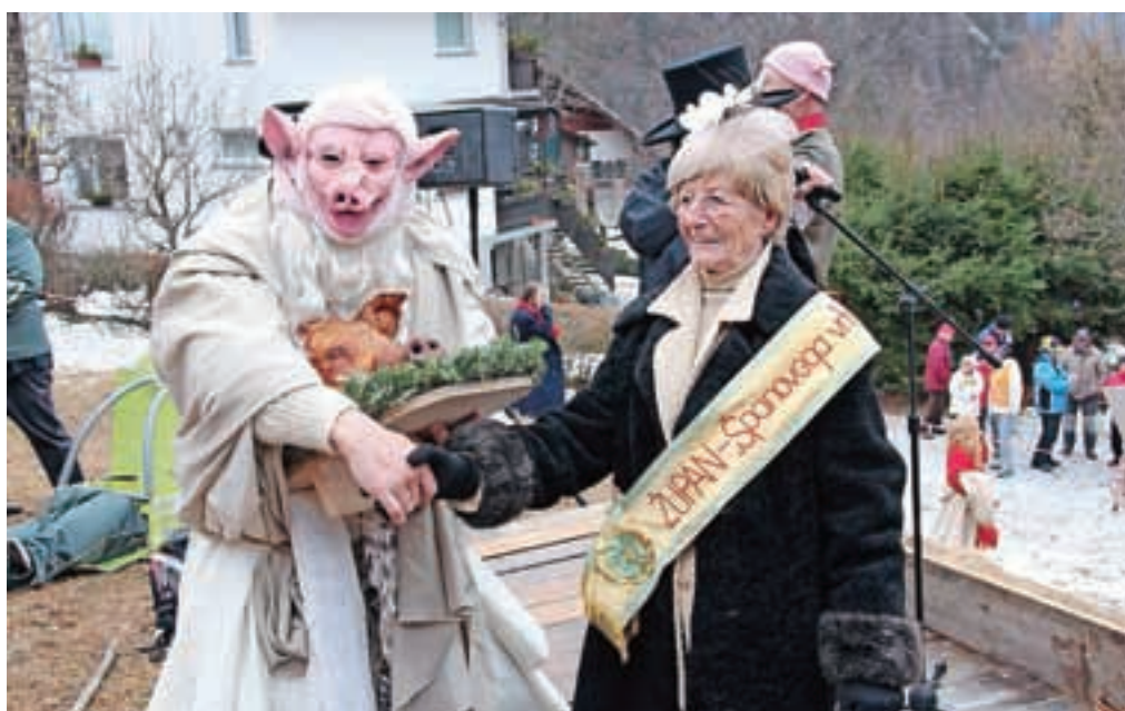
Srednjemu času se je najbolj približal svinjski Abraham.