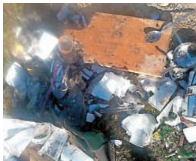
Namesto da bi umazano posodo pomili, jo vržejo kar v smeti.

in poškodovanjem inventarja, zato ga do nadaljnjega ne oddajajo. Kot je na spletnem družbenem omrežju zapisal Repe, zainteresirani pridejo kot nedolžni otroci: »Vsi spedenani, poštir-kani, pridni mamini sinkoti, izobraženi, pametni ..., potrebujejo še to in ono, saj