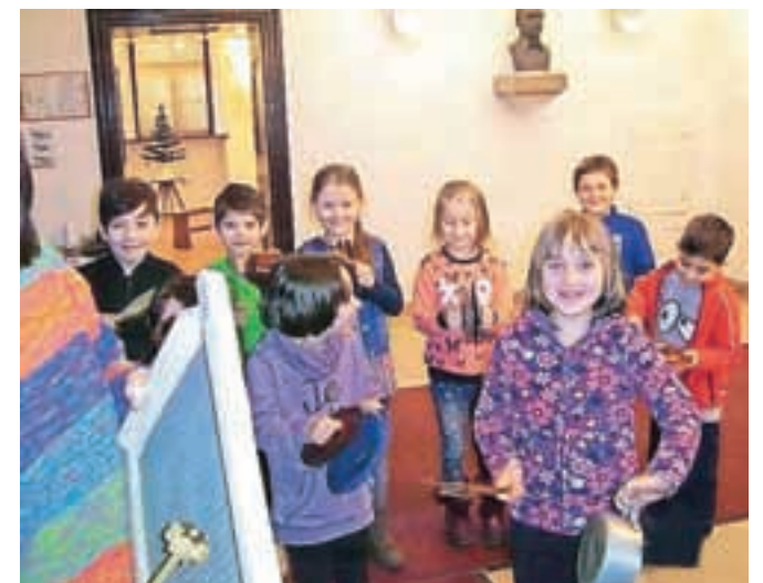
Učenci Osnovne šole Toneta Čufarja z Jesenic so se spoznavali s starim običajem godovanja.