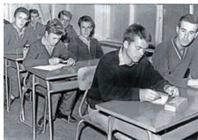
Dijaki Železarskega izobraževalnega centra leta 1961, hrani Gornjesavski muzej Jesenice.

bil pomirjajoč. Še isto noč jih je okoli petdeset pobegnilo in posredovati je morala policija, ki je sprožila iskalno akcijo. Nekaj teh sirot je za vedno ostalo v železarskem mestu in si tu ustvarilo družine. Internat je ostal v barakah do leta 1961, ko so na tem območju začeli graditi stanovanjske bloke. Šola se je odselila že leta 1949. Takrat je bila odprta nova stavba Metalurške industrijske šole. To je bila triletna šola za železarske poklice. Poleg nje je obstajal še delavski tehnikum, ki je s pomočjo gimnazijskih profesorjev in inženirjev železarne usposabljal obratne tehnike in višje kvalificirane delavce. Sprva je imel prostore v stavbi nekdanjega TVD Partizana, potem pa v stavbi na Ruparjevi 2. Leta