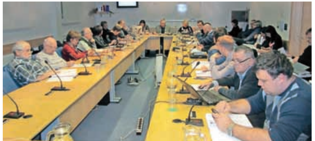
Občinski svetniki so sprejeli tudi predlog programa dela občinskega sveta za leto 2016.