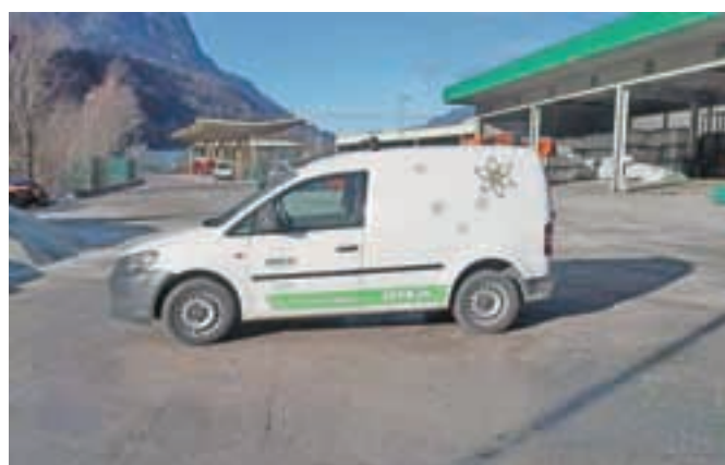
Za večjo promocijo uporabe zemeljskega plina so v JEKO-IN kupili tudi dve službeni vozili na stisnjen zemeljski plin.

Za večjo promocijo uporabe zemeljskega plina so v JEKO-IN pred dobrima dvema letoma kupili tudi dve službeni vozili na stisnjen zemeljski plin. V prihodnje naj bi jih kupili še več. Kot je poudaril Roman Ambrožič, je polnjenje goriva preprosto kot pri navadnem ali dizelskem avtomobilu, polnilnica se nahaja pri podjetju ENOS. »S prvim avtomobilom smo do 1. januarja letos prevozili približno 39 tisoč kilometrov, z drugim pa okoli 20 tisoč kilometrov. Poraba prvega avtomobila znaša približno 7 kg/100 km za mestno vožnjo in približno 6,1 kg/100 km pri vožnji zunaj mesta. Poraba je torej primerljiva s porabo bencinskega motorja, voznja pa je cenejša, saj je cena stisnjenega zemeljskega plina nižja, znaša 0,9 evra za kilogram.«