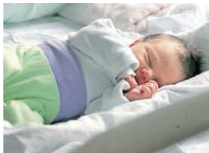
Radi bi obnovili prostor za posebno nego novorojenčkov in sanitarije za mamice ter uredili moderne prostore za sobivanje družine po porodu.

Po besedah Macunove so v zadnjih letih uvedli določene spremembe na področju porodništva, skrb so osredotočili na porodnice in njihove