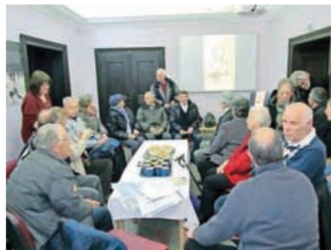
Nekdanji stanovalci so ob čaju in piškotih obujali spomine na bivanje v Ruardovi graščini.