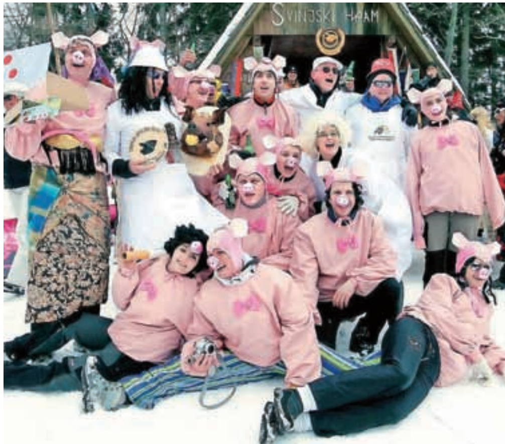
Pustna prireditev v Španovem vrhu je vsako leto zelo zabavna, maske pa izvirne.