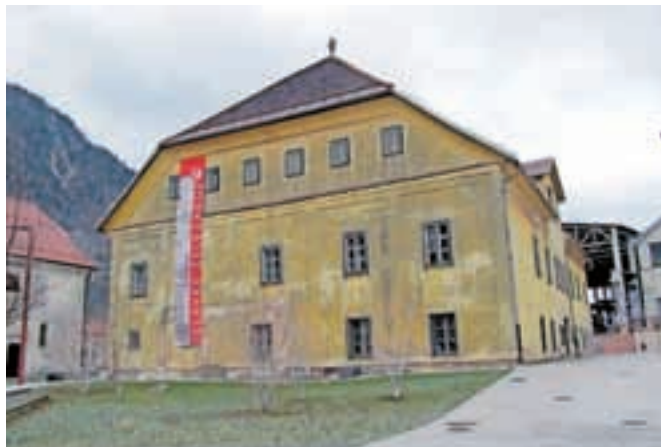
Ruardova graščina je ena najstarejših stavb v mestu. Danes je v njej železarski muzej, prostore pa ima tudi Gornjesavski muzej Jesenice.