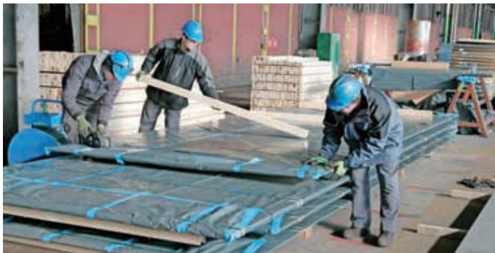
Glavni proizvodni program ostaja nerjavna debela pločevina, glavni trg Evropa, prodaja raste na ameriškem trgu, usmerjajo se tudi v Azijo ...

je cenovne razrede. »Nove produkte, ki smo jih razvili lani, bomo letos dali na trg, kar bo zagotovo pripomoglo k poslovnemu izidu. Poleg tega bomo sredi leta v proizvodni proces vključili novo linijo za obdelavo specialnih jekel, ki nam bo omogočila izdelavo materialov z visoko dodano vrednostjo za najzahtevnejše kupce iz naftne in plinske industrije.« Naložba je vredna kar 31 milijonov evrov, podobno velika pa bo tudi naložba v peč AOD, ki jo bodo v proizvodnjo vključili v začetku prihodnjega leta.