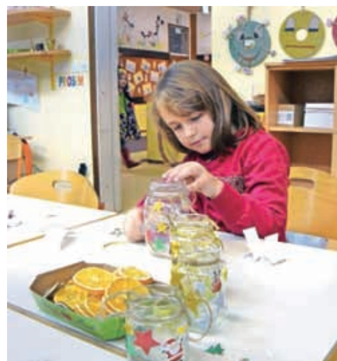
Najprej so izdelali lučke – v okrašene kozarčke so namestili svečke.