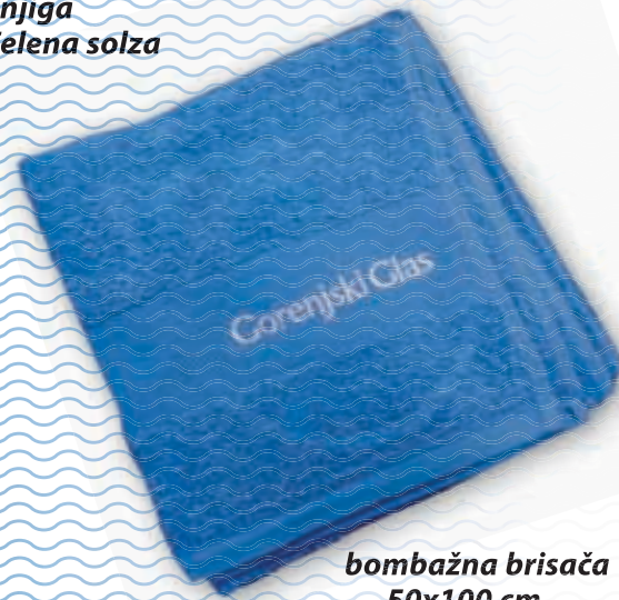
bombažna brisača 50x100 cm

Popust in darilo veljata le za fizične osebe. Daril ne pošiljamo po pošti. Količina daril je omejena.