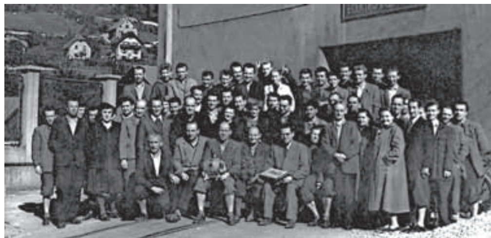
Skupina električarjev in previjalk motorjev pred elektro delavnico Železarne Jesenice okoli leta 1960

leznice poskrbele za razsvetljavo jeseniške železniške postaje in njene okolice. Na elektrifikacijo potniškega in tovornega prometa je bilo treba počakati do leta 1957, ko je na relaciji Beljak-Jesenice začel voziti elektromotorni vlak.