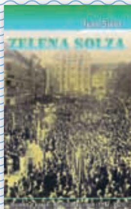
knjiga Zelena solza