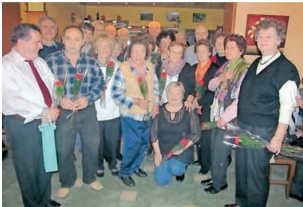
Jubilanti društva invalidov

Pomembno vlogo v društvu igrajo poverjeniki, ki so vez med članstvom in vodstvom društva. Delo v lanskem letu po besedah predsednice ocenjujejo kot dobro in upajo, da bodo tudi letos s programi pomagali čim več članom pri premagovanju težav ter jim omogočili različne prijetne oblike druženja. V decembru so obiskali svoje člane tudi na domovih, v Domu upokojencev dr. Franceta Bergelja na Jesenicah in v Splošni bolnišnici Jesenice ter jim izročili darila.