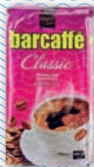
kava Barcaffé 250 g