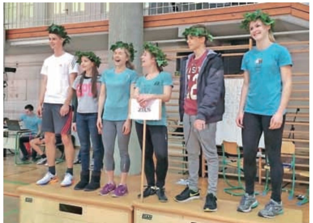
V čem je pomen in kako potekajo olimpijske igre, so izvedeli pri medpredmetni povezavi športne vzgoje in zgodovine.