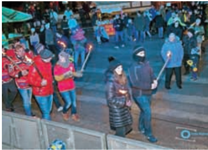
Sprevod z baklami je več kot uspel.