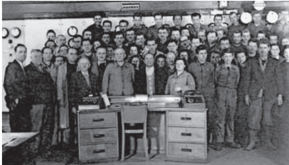
Delavci elektro delavnice na ogledu električne centrale Železarne Jesenice okoli leta 1960

Poleg železarne so se že zelo zgodaj električne energije posluževali tudi pri državnih železnicah. Ko so gradili karavanški železniški predor, so jo potrebovali za pogon vrtilnih strojev in železnice, ki je iz kamnoloma na Mirci prevažala gradbeni material. Zaradi tega so v Vintgarju leta 1903 zgradili elektrarno, ki so jo po izgradnji predora prodali Kranjski industrijski družbi. Že pred odprtjem bohinjske proge so državne že-