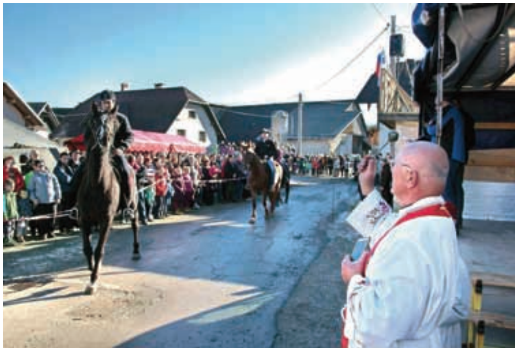
Blagoslov konj pred cerkvijo svetega Štefana na Blejski Dobravi