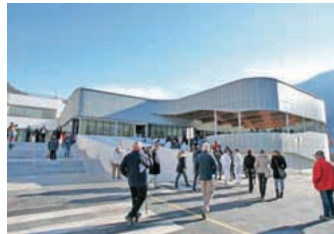
Urgentni center, ki so ga uredili v prizidku, obsega tisoč štiristo kvadratnih metrov, stara urgencia pa je imela le 350 kvadratnih metrov. V njem so pridobili reanimacijski prostor, prostor za urgentni CT, opazovalnico, triažni prostor, pet ambulant, šivalnico, prenovljeni urgentni operacijski blok z dvema operacijskima dvoranama in medicinsko opremo z dvema novima digitalnima RTG-aparatom.