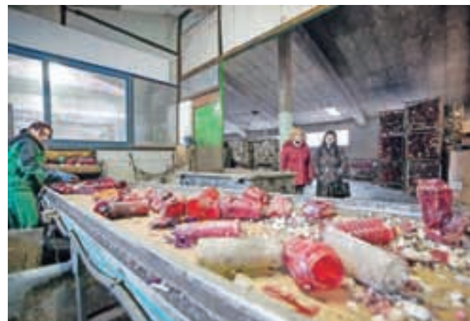
Predelava sveč se začne s sortiranjem.