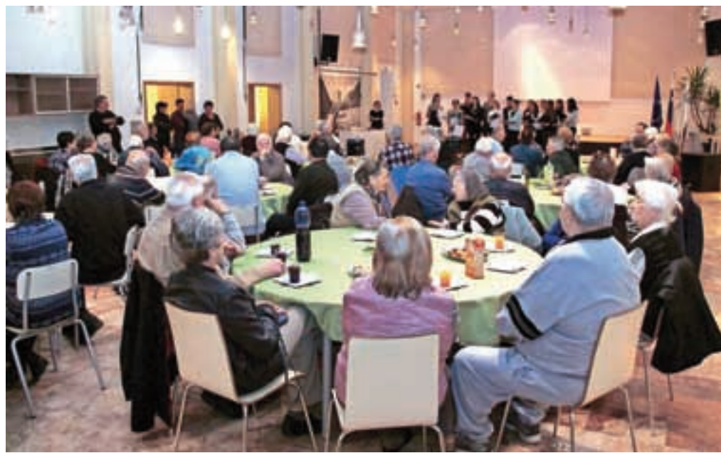
Sprejem krajanov KS Podmežakla v Kolpernu

Poln Teater bar je pričal, da nekateri dogodki Jeseničane privabijo na plano. Tam se je 11. decembra odvijal večer orientalskega plesa, ki sta ga priredila društvo za razvoj turizma, plesna skupina Zaara in Teater bar, ki je poskrbel tudi za dodatek večeru – degustacijo specialnih piv Pivovarne Laško. Dekleta iz plesne skupine Zaara, ki so jeseniški publiki že znana, saj so že nastopila na prireditvi Multikulturi-ka, pa so v orientalskih ritmih očarala obiskovalce.