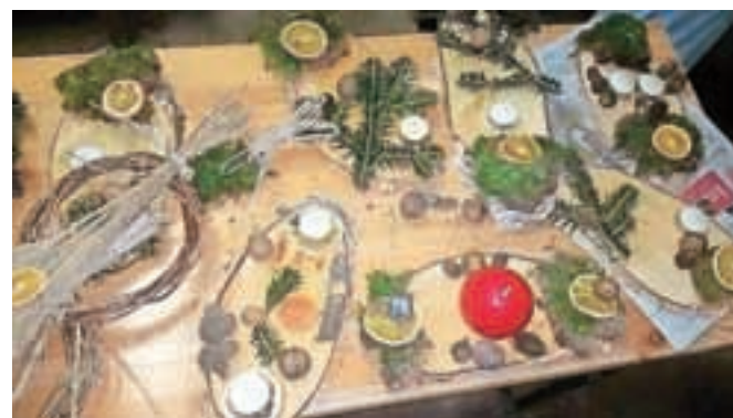
Na kmetiji so v predadventnem času ustvarjali tudi čudovite adventne venčke iz naravnih materialov.

spet vidijo. Prihajajo s cele Gorenjske, saj je to prostor, kjer se sprostijo in doživijo kmečko življenje brez televi-