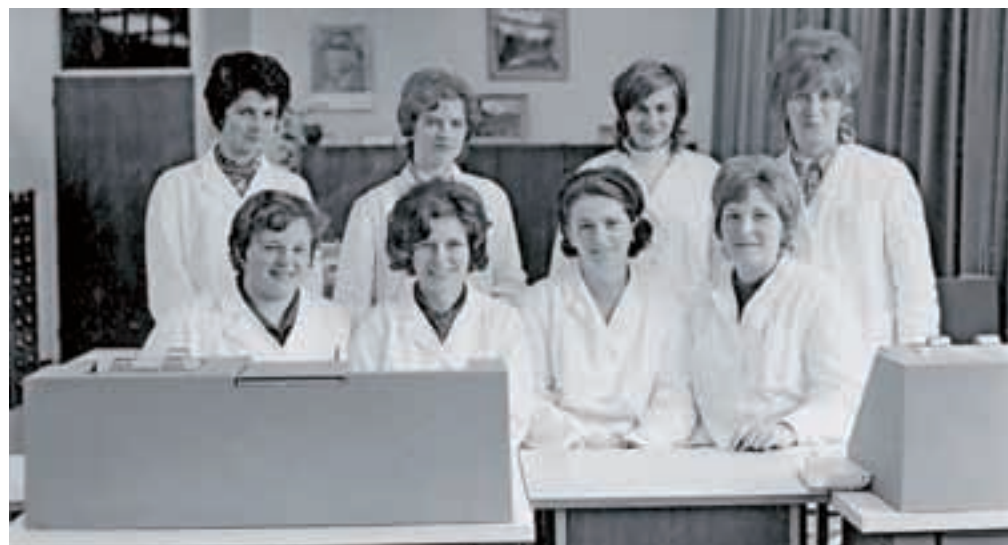
Delavke oddelka IBM leta 1971

Računalnik IBM 360 je imel kapaciteto notranjega spomina 65546 bitov. Njegovo tehnično osnovo so predstavljali elektromagnetni obročki torusi, ki so pod vplivom električnega toka prišli v stanje plus ali minus, ki so jih označili s številkami binarnega sistema 1 oziroma 0. Osem obročkov je sestavljalo enoto bit z 256 kombinacijami podatkov. Celotni sistem z vhodno, izhodno in centralno enoto, ki se je delila še na upravni