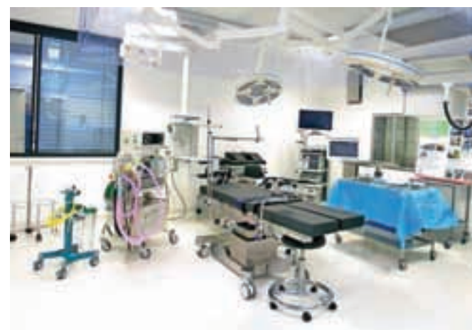
Na dan odprtja so si obiskovalci lahko ogledali tudi notranjost, vključno z operacijskimi dvoranami. V novih prostorih so prvega pacienta z zlomom kolka oskrbeli v soboto, 12. decembra, ob pol enajstih zvečer.