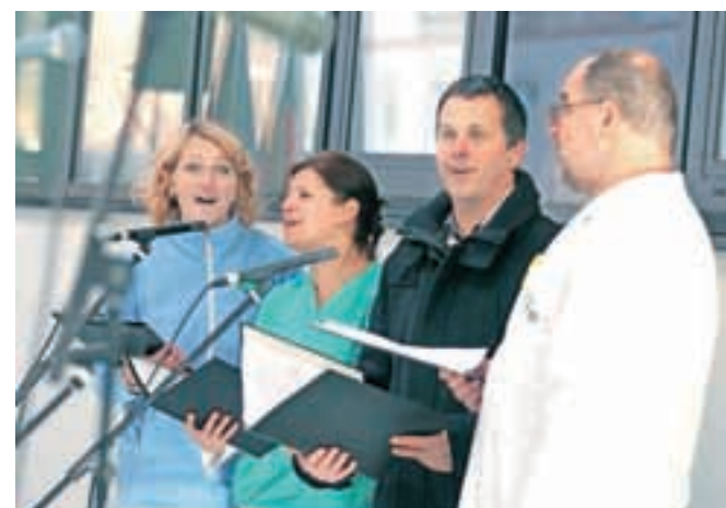
S popevko Dan ljubezni so navdušili zaposleni.