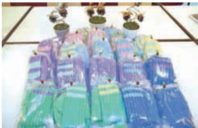
Ročno spletene nogavice, ki jih je starostnikom doma darovala srčna gospa.

darovalka je vsakemu paru nogavic dodala sporočilce z verzi z naslovom Veseli sončni pozdrav: »Z dotikom te božava, z objemom te grejeva, z barvo ti pričarava rožice žlahtne. In misli ti zaplavajo na travnik poletni, še nepokošen, s soncem obsijan. Rožico svojo si izberi sam. Kot sonce greje travnike in gore, želiva greti tvoje noge. Tvoje nove nogavičke.« Kot so povedali v domu, bodo nogavice podarili stanovalcem, ki nimajo ožjih svojcev, in jim s tem sporočili, da dobrota in občutek za sočloveka dajeta lepoto in smisel našemu življenju.