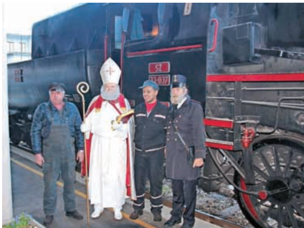
Odhod prazničnega muzejskega vlaka z Miklavžem

in staršem zaželel lep izlet in prijetno druženje. Kot je dejal eden izmed staršev, ki sicer ni domačin, temveč se je na Jesenice priselil pred štirimi leti, so Jesenice prav neverjetne glede na to, koliko različnih dogodkov, namenjenih otrokom, se odvija v prazničnih dneh. Udeležence izleta s prazničnim "čuha puha" je v Bohinjski Bistrici pričakalo še presenečenje v organizaciji Kulturnega društva Bohinj, saj so jih pričakali s čajem, piškoti in glasbo.