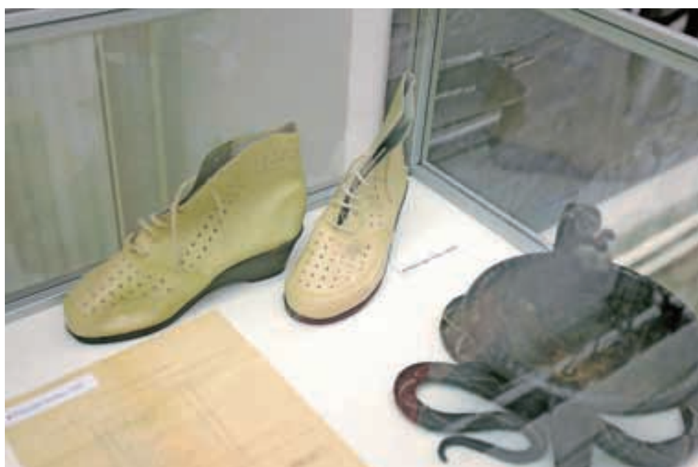
Na ogled so tudi zanimivi predmeti, denimo čistilniki čevlji (na fotografiji) in halja, pisalni stroj, košarica za prenašanje malice, ura iz glavne pisarne, številni dokumenti in knjižice ...