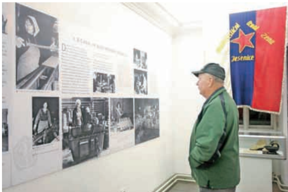
Na panojih je predstavljena vloga delavk železarne od časov Avstroogrške monarhije do obdobja med obema vojnama in v socialistični državi. Predstavljeni so pogoji dela, številčnost žensk v obratih, kako so praznovala ...