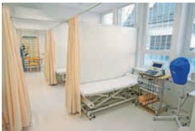
Novi prostori fizioterapije so urejeni na več kot štiristo kvadratnih metrih, so svetli in prijetni ter vrhunsko opremljeni.