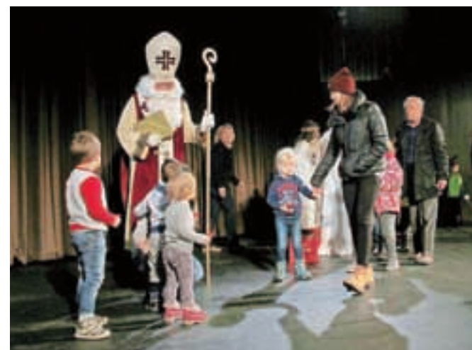
Obisk Miklavža v Kinu Železar

Mladinski center Jesenice je minuli petek v dvorani Kina Železar tudi letos pripravil tradicionalno miklavževanje. Za kulturni program so s petjem in plesom poskrbele mlade animatorke Mladinskega centra Jesenice, otroke pa je obiskal tudi Miklavž s spremstvom angelčkov in parkeljna, prinesel pa je tudi sladka darila za vse otroke. Miklavževanja se je udeležilo več kot 200 otrok.