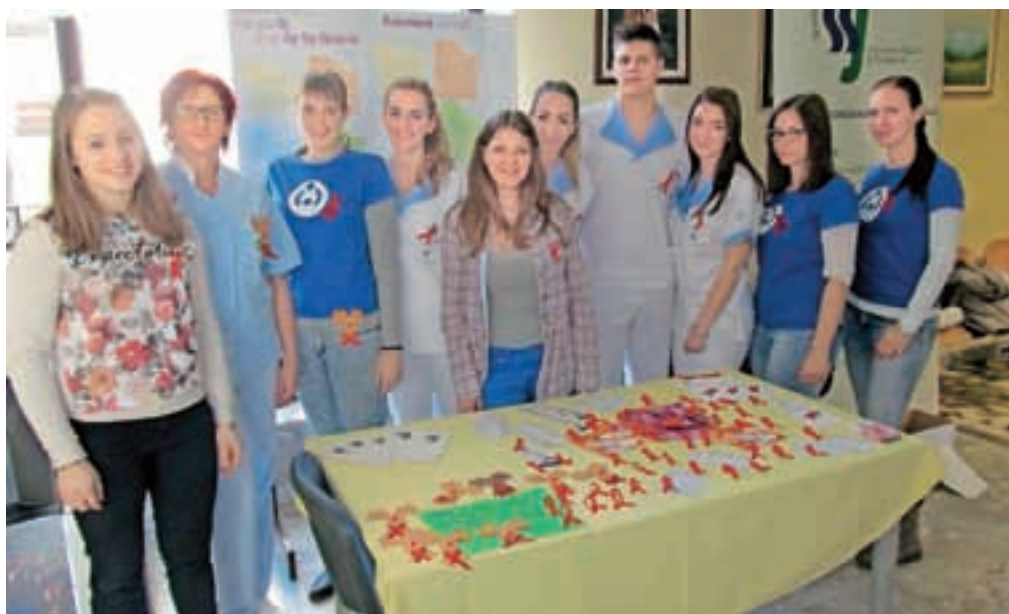
V Splošni bolnišnici Jesenice so v skupni akciji z dijaki in študenti delili kondome in rdeče pentlje.