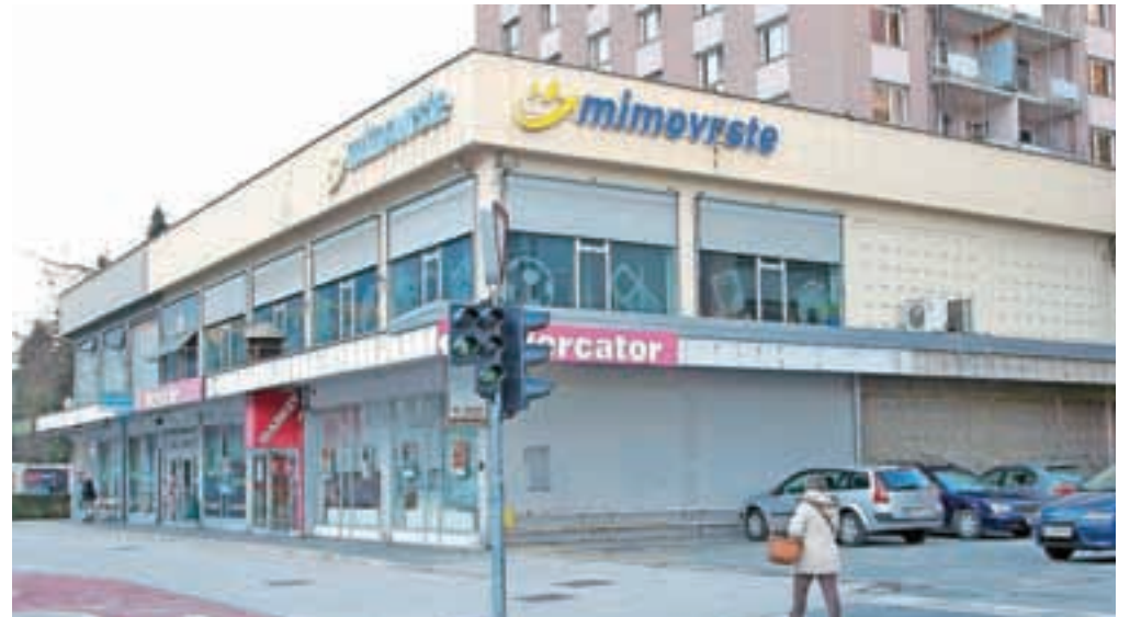
Prevzemno mesto na Jesenicah je zaprto.

»Po lanskem odprtju novega centralnega skladišča in posodobitvi sistema na raven Skupine se je pokazala potreba tudi po večjih prostorih za upravo podjetja in ostale sodelavce, zato v tem letu postopno izvajamo selitev vseh sodelavcev z Jesenic v prostore na Brnčičevi v Ljubljani. Kljub prenosu sedeža podjetja ostajajo Jesenice zapisane v zgodovi-