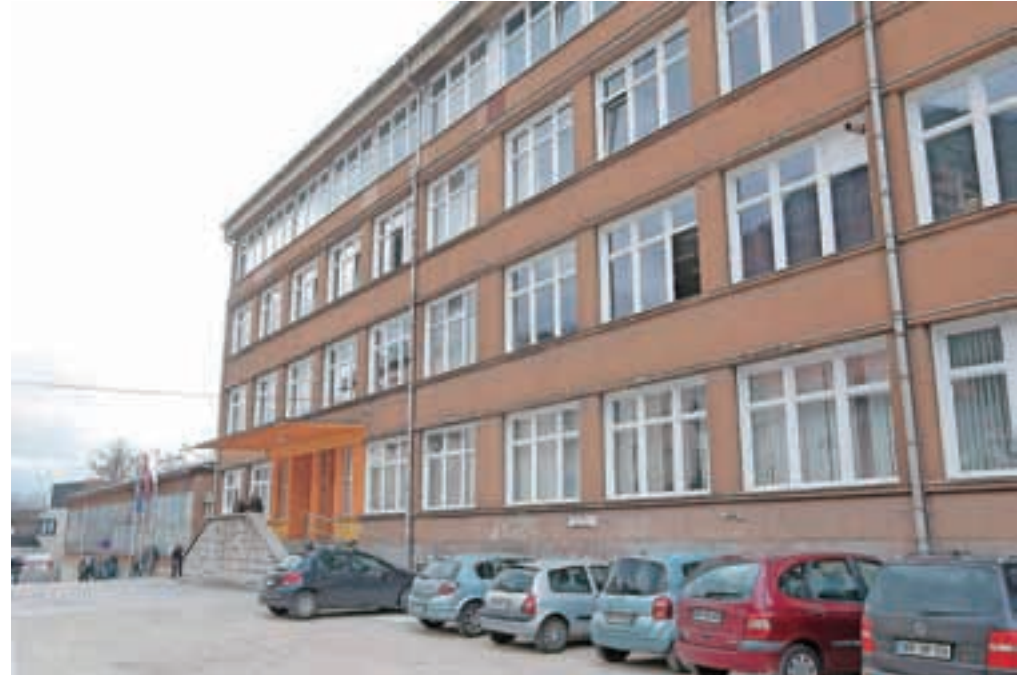
Država naj bi denar za obnovo šole zagotovila šele v letu 2018.

Občina Jesenice je šolsko stavbo prevzela leta 2010 na osnovi pogodbe o prenosu od Železarne Jesenice, ki je bila sprva tudi ustanoviteljica šole. Danes je ustanoviteljica šole Republika Slovenija, v imenu katere aktivnosti za obnovo vodijo na ministr-