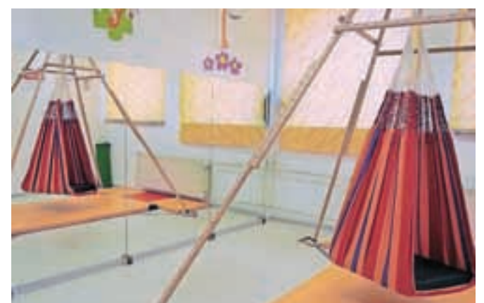
Nova ogledala so nameščena ob vestibulatorju, ki omogoča 360-stopinjsko obračanje in nihanje, kjer učenci razvijajo ravnotežnostni sistem.

šenj, pri zaznavanju in oblikovanju reakcij na različne dražljaje. Obenem se otroci sprostitijo, umirijo, pridobivajo različne veščine in spretnosti, pomembne za vsakdanje življenje," je povedala Valančičeva. Nova ogledala so nameščena ob vestibulatorju, ki omogoča 360-stopinjsko obračanje in nihanje, kjer učenci razvijajo ravnotežnostni sistem. "Učenci med igro v ogledalih opazujejo sebe, predmete in okolico, spoznavajo in razvijajo lastno telesno shemo, občutenja, zaznavajo občutek gladke površine, drsenja ... Ogledala predstavljajo morje možnosti za igro, zagotavljajo dodatno bogato vizualno stimulacijo in senzorno integracijo," je še povedala ravnateljica, ki se je Mladinskemu svetu zahvalila za donacijo.