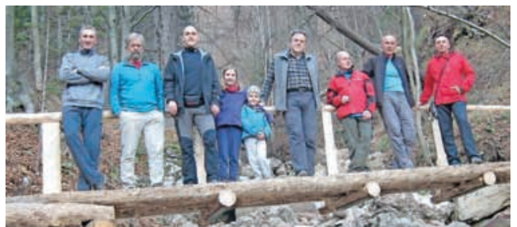
Ekipe prostovoljcev na obnovljenem mostičku čez Ukovo