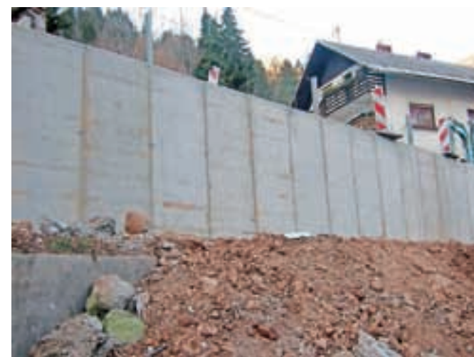
Nov oporni zid na Cesti pod Gozdom

na sedmi seji sveta KS Sava. Med drugim se niso strinjali, da je trenutno stanje plazu na Razgledni poti nespremenjeno in da ni zaznati novih premikov zemlje. Poudarili so, da začasno odvodnjavanje ni v redu, ker so cevi prepele in neustrezno postavljene. Ker gre za problem, ki se vleče že več let, bo treba resneje pristopiti k nadaljnji sanaciji. Med pomembnimi deli, ki se letos izvajajo v krajevni skupnosti Sava, naj omenimo izgradnjo novega opornega zidu in nekaj novih parkirnih prostorov na Cesti pod gozdom, urejanje dela ceste od Vrta Julke Pibernik do Ceste pod Gozdom, odvodnjavanje na Razgledni poti ter odstranitev in zasaditev novih dreves na Čufarjevem trgu.