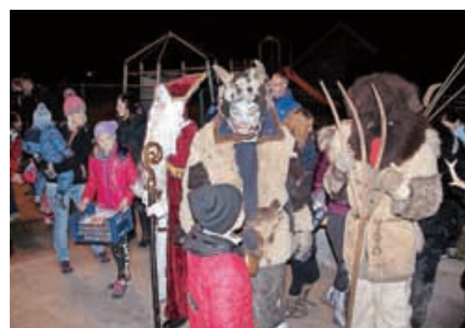
Obisk parkeljnov in Miklavža na Hrušici

V sodelovanju s Prostovoljnimi gasilskim društvom Hrušica so tudi na Hrušici pripravili obisk Miklavža in parkeljnov. Parkeljni so poskrbeli za tiste, ki niso bili dovolj pridni, in jih dobrega zaznamovali z ogljem. Nasprotno je za pridne poskrbel Miklavž z angelčki, ki je med otroke podelil tudi darila. Parkeljni s Hrušice, kjer tradicijo miklavževanja oživljajo v zadnjem desetletju, so se v Podkorenu udeležili tudi tradicionalnega srečanja parkeljnov treh dežel. Tradicija miklavževanja je najstarejša med decembrskimi običaji obdarovanj, sega pa v drugo stoletje našega štetja k škofu svetemu Nikolaju, pod istim imenom pa danes nastopata tako Miklavž kot Božiček. Tradicionalna Miklavževa darila so predvsem suho sadje, jabolka, rožiči, orehi, kasneje pa tudi medenjaki, čokolada in južno sadje, zaradi česar miklavževanje številni še danes povezujejo z mandarinami.