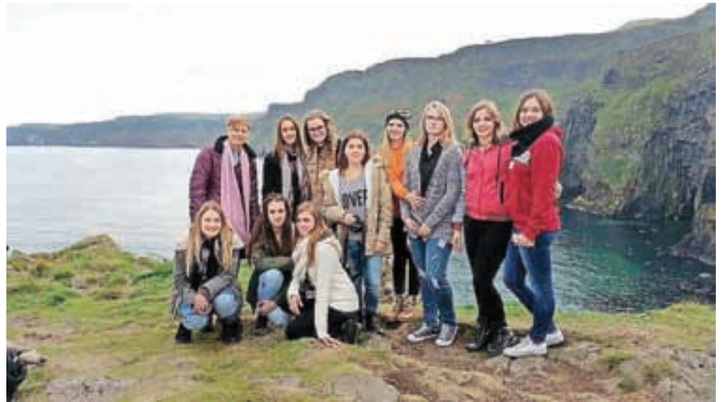
Deset dijakin Srednje šole Jesenice na Severnem Irskem