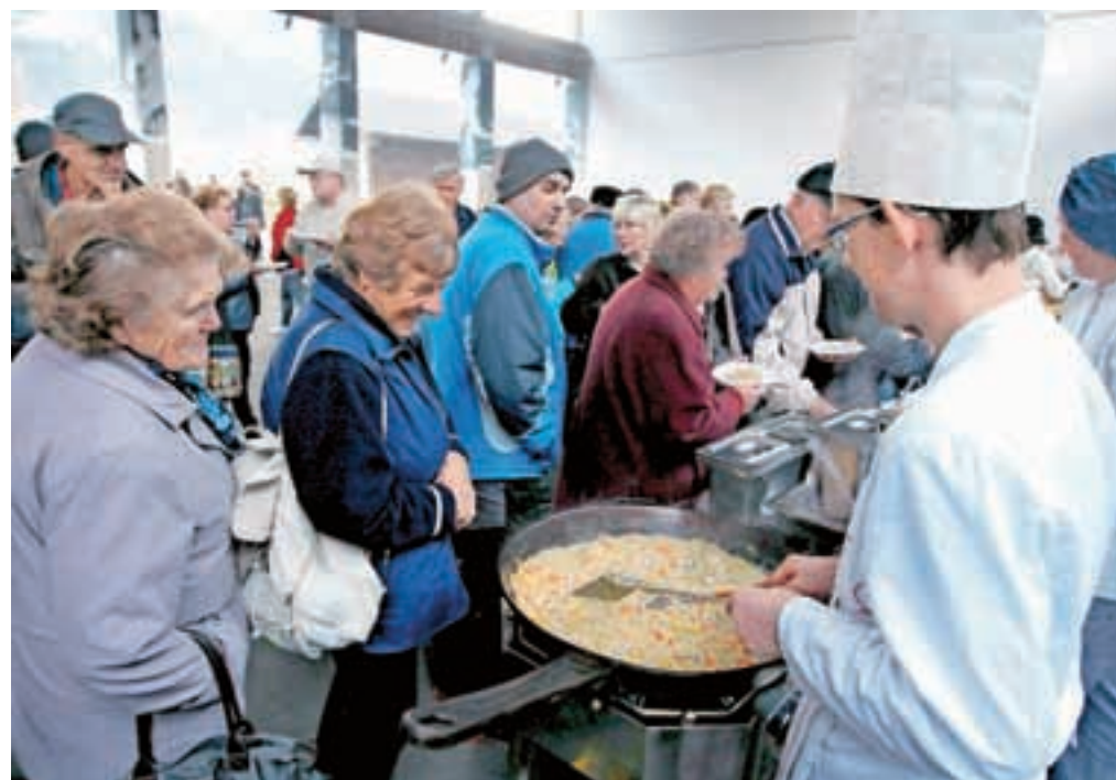
Dijaki Srednje gostinske in turistične šole iz Radovljice so ponujali dobrote iz ekoloških sestavin, med drugim ješprenčkovo rižoto z zelenjavo in sirom.