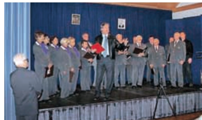
Koncert veteranskega pevskega zbora na Blejski Dobravi