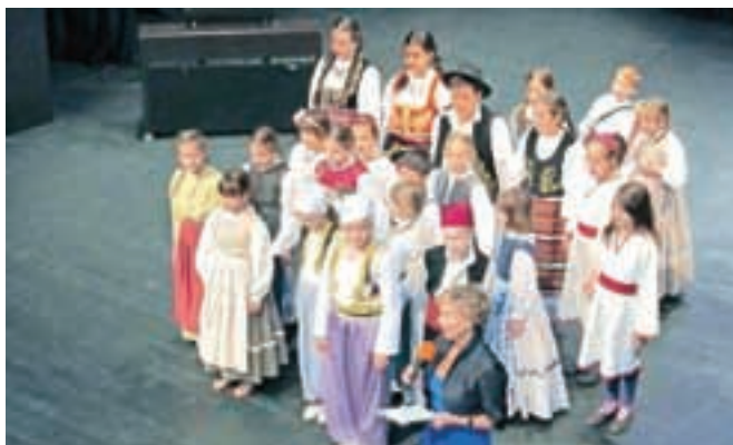
Mavrično podobo Jesenic so predstavili otroci iz kulturnih društev.