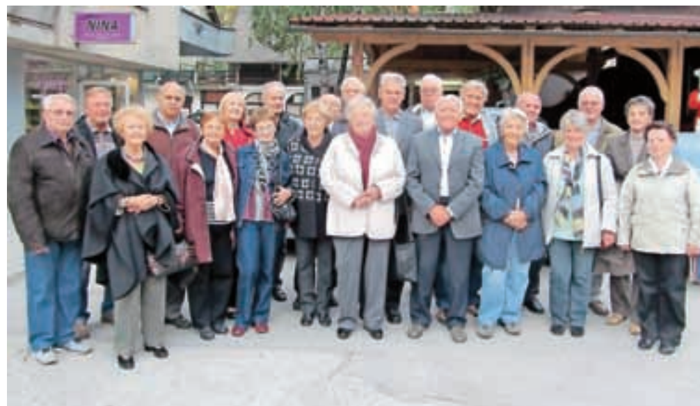
... in danes