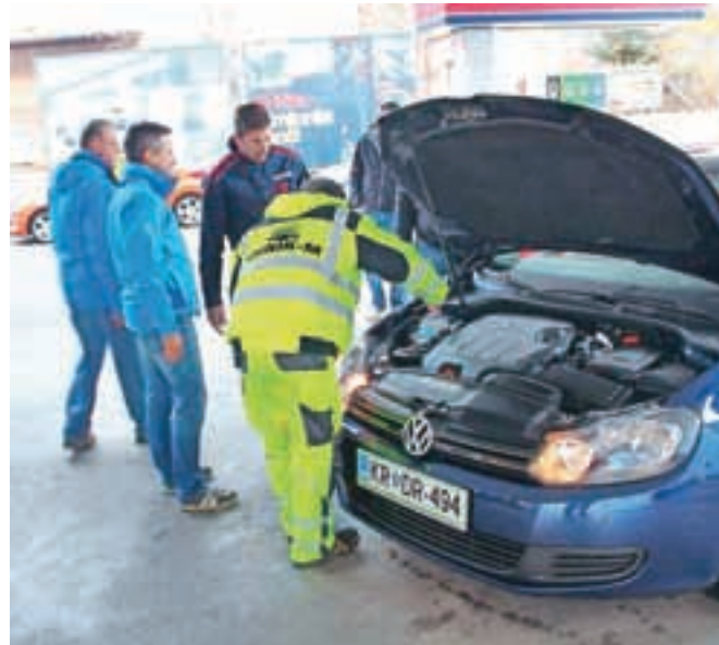
Preventivna akcija Sveta za preventivo in vzgojo v cestnem prometu Jesenice

Svet za preventivo in vzgojo v cestnem prometu občine Jesenice je v sodelovanju s Policijsko postajo Jesenice, Medobčinskim redarstvom in inšpektoratom, bencinskim servisom Petrol in podjetjem Junik-M izvedel tradicionalno novembrsko preventivno akcijo. Kot ponavadi so tudi tokrat preverjali pripravljenost voznikov in njihovih jeklenih konjičkov na zimske razmere, predvsem ustreznost pnevmatik, profil, hladilno tekočino in drugo pripravljenost vozil na zimske razmere. Udeležencem pa so podelili tudi darilca, pripomočke za čiščenje vozil. Kot je povedala Ana-