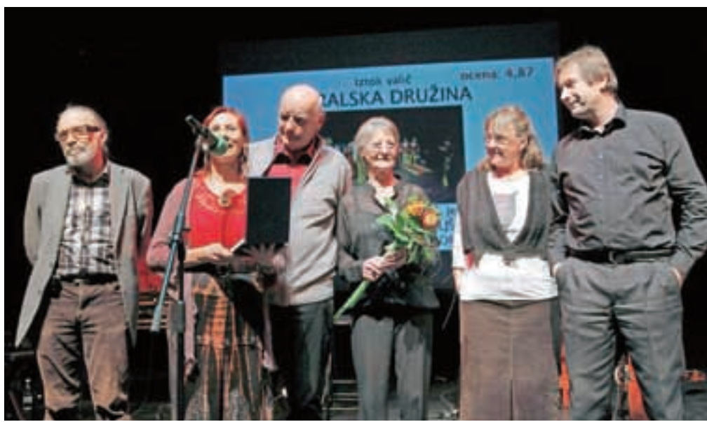
Igralska družina je po oceni občinstva prejela oceno 4,87, kar je najvišja ocena v zgodovini Čufarjevih dni.