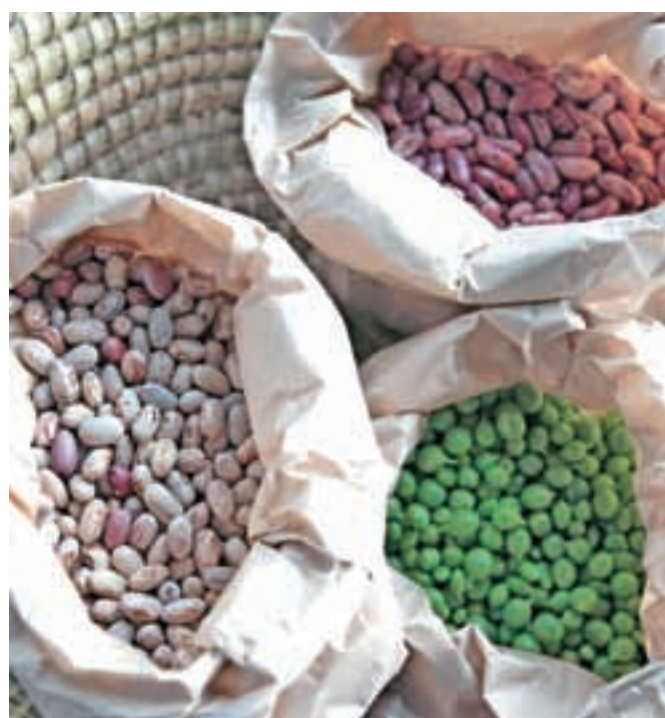
Fižolček in grah z ekološke kmetije z Bohinjske Bele