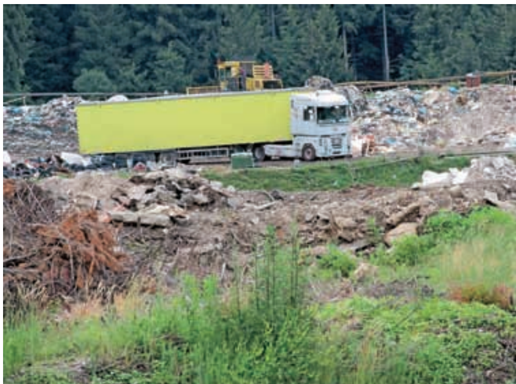
Na deponiji bodo na polju aktivnega odlagališča postavili pregrado, ki naj bi preprečevala vdor deponijskega plina v dolino.

Tamara Hribar iz javnega komunalnega podjetja JEKO-IN je povedala, da ves