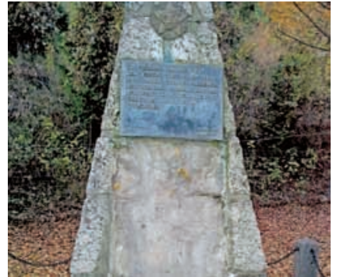
S spomenika so ukradli bronasto spominsko ploščo.