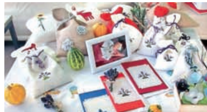
Čudoviti izdelki upokojenk