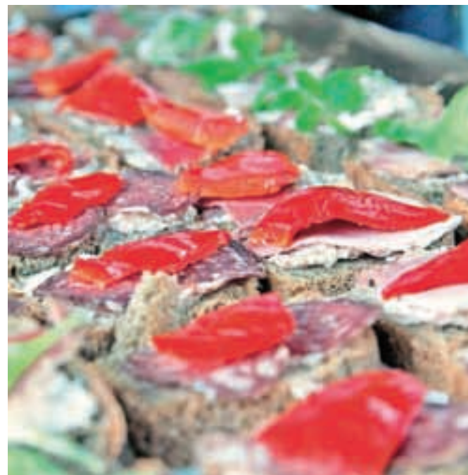
"Eko" domači sendviči

je dejal, naj bi Ekopraznik postal tradicionalen, pripravljali naj bi ga vsaj nekajkrat