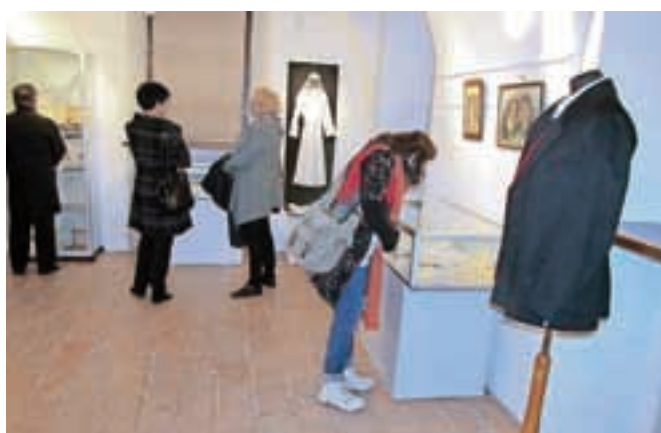
Na ogled je tudi nekaj predmetov in oblačil, povezanih s praznovanji.

ne koledarske oziroma letne šege in navade, ki spremljajo praznovanja. Ta se skozi zgodovino do danes ohranjajo ob najrazličnejših priložnostih, ob osebnih praznikih, cerkvenih, lokalnih, državnih, ob različnih odprtjih, uspehih, dosežkih; skratka motivov za praznovanja je vedno na pretek. Na ogled je tudi nekaj predmetov in oblačil, povezanih s praznovanji. Največ gradiva so prispevali domačini v okviru študijskih krožkov raziskovanja kulturne dediščine, nekaj ga je iz arhiva muzeja. Za prijetno popestritev so poskrbele pevke Učiteljskega pevskega zbora Mavrica.