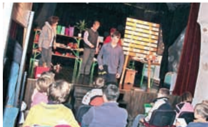
Dobrodelna tombola na Koroški Beli

Povsem polna dvorana kulturnega hrama na Koroški Beli je minulo nedeljo spominjala na prizor iz kakšnega ameriškega filma, ko je več kot 70 krajanov Koroške Bele poskušalo napolniti tablice tradicionalne dobrodelne tombole. Izkupiček je bil v celoti namenjen Župnijski karitas. Na tomboli ni manjkalo pestrega nabora nagrad, vključno z glavno nagrado, čokoladno torto v obliki avtomobila. Kot so povedali udeleženci, pa je tombola tudi odlično druženje v zabavnem, tekmovalnem vzdušju. Tombolo organizirajo že vse od leta 1999, tokrat pa so zbrali nekaj manj kot 900 evrov.