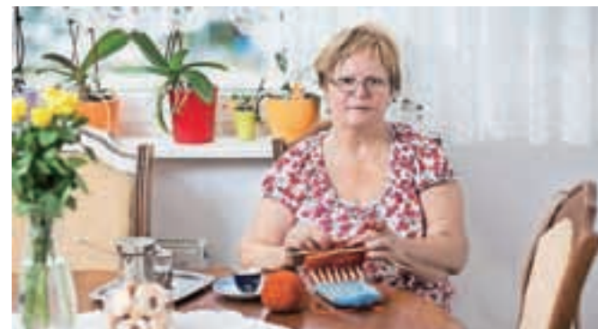
V projektu sodelujejo mojstrice ročnega dela.