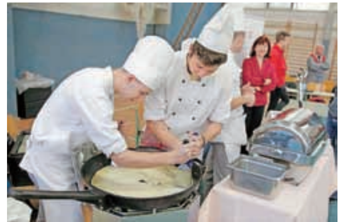
S stojnice Srednje gostinske in turistične šole Radovljica je dišalo po cesarskem pražencu.