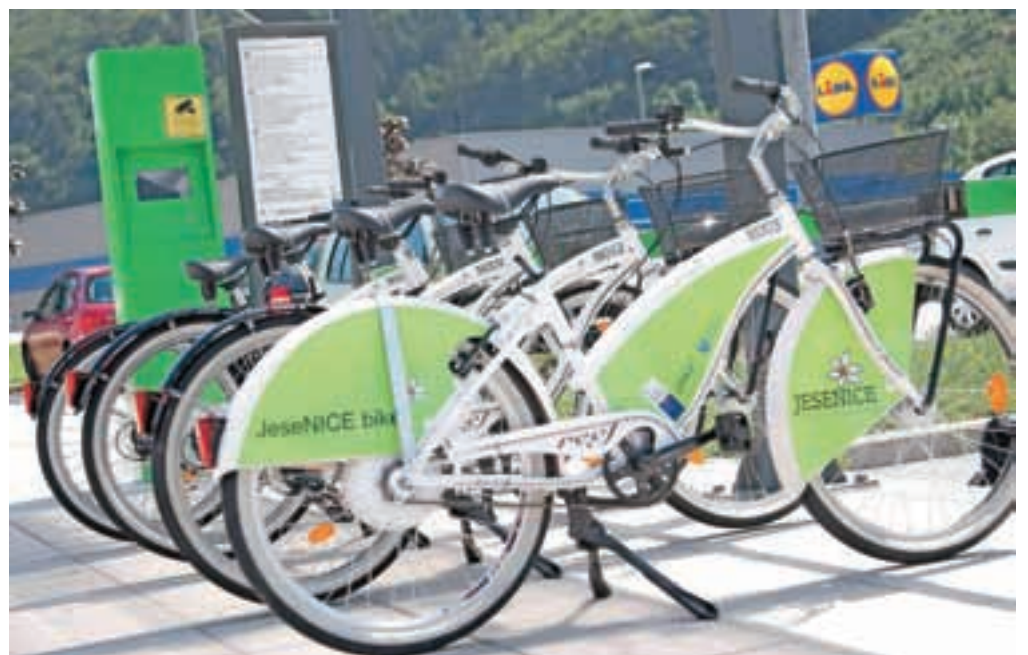
V prvi sezoni so našli 280 izposoj navadnih in električnih koles.

"S prvo sezono delovanja smo zelo zadovoljni. Jesenice smo prva gorenjska občina in šesta v Sloveniji, ki je dobila kolesarski sistem. Glede na prihajajoče trende,