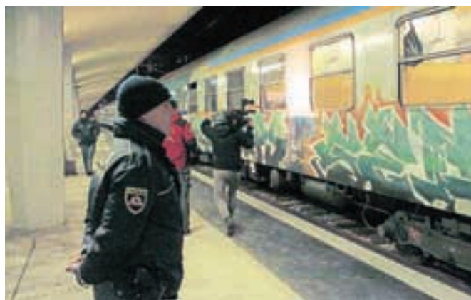
Izredni vlak iz Dobove na jeseniški železniški postaji prevzamejo avstrijski varnostni organi.

organiziranem spremstvu policije z vednostjo in odobritvijo avstrijskih varnostnih organov o sprejetju. Migrante na Jesenicah prevzamejo avstrijski varnostni organi, v istih potniških vagonih pa tudi zelo hitro zapustijo območje Slovenije. Po nekaterih informacijah jih prepeljejo do Podrožce, od tam pa z avtobusi v av-