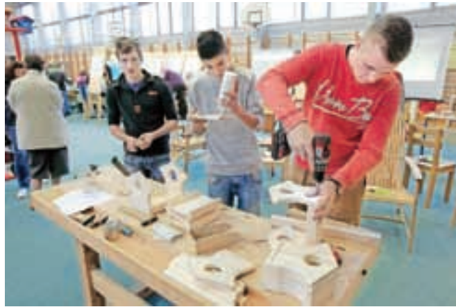
Na stojnici Srednje šole za lesarstvo iz Škofje Loke so dijaki prikazovali izdelavo ptičjih hišic.

Vrtiljaka poklicev se je udeležilo skoraj devetsto osnovnošolcev iz osemnajstih gorenjskih osnovnih šol, ki so prejeli tudi brošure s predstavitvijo vseh šol, poklicev in nadaljnjih možnosti šolanja. Svoje izobraževalne programe in poklice so predstavljali Srednja šola Jesenice, Šolski center Kranj, Ekonomska gimnazija in srednja šola Radovljica, Srednja gostinska in turistična šola Radovljica in Šolski center Škofja Loka.