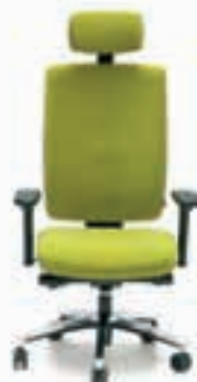
pisarniški stoli in mize