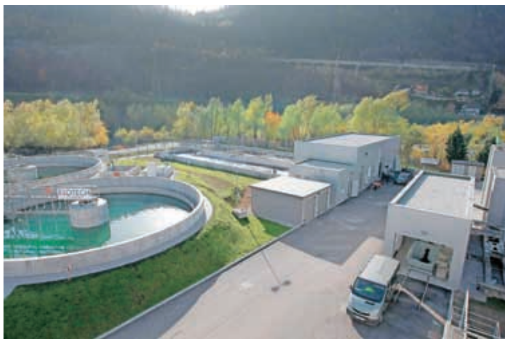
Z nadgradnjo Centralne čistilne naprave Jesenice bo Sava čistejša.

S tem pa celotna jeseniška občina še ni v celoti komunalno urejena. V naseljih Potoki, Javorniški Rovt, Plavški Rovt in Kočna naj bi iskali možnosti za ureditev manjših čistilnih naprav. Župani vseh štirih občin pa upajo tudi na sofinanciranje iz nove finančne perspektive.