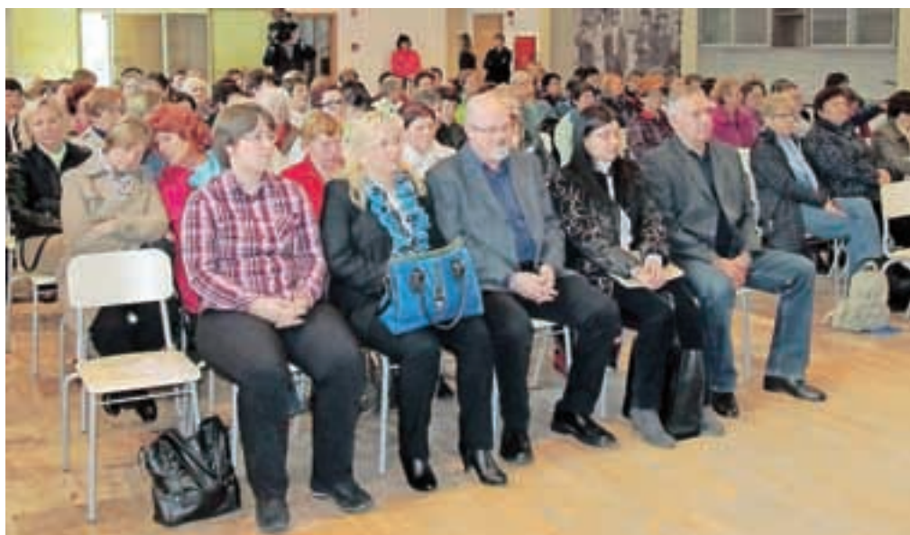
Več kot sedemdeset kmečkih žena in deklet se je zbralo v Kolpernu.