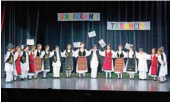
Otroci ohranjajo folklorno izročilo v društvih.

Na Slovenskem Javorniku je potekal drugi otroški festival Razigrani tabančiči, ki se ga je udeležilo več kot dvesto otrok.