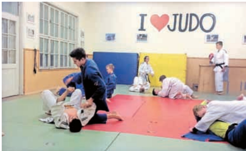
V TVD Partizan si želijo izboljšanja pogojev za vrhunske športnike – judoiste, akrobate in druge, ki trenirajo v okviru enega najstarejših društev.