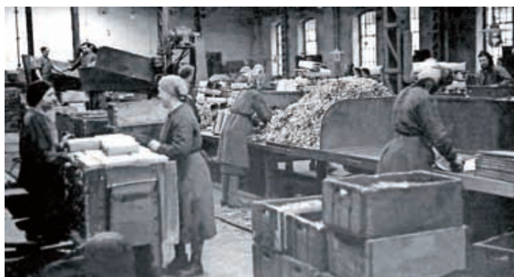
Zavijalnica žebeljarne leta 1955

dvesto. Prihajali so največ iz Baške grape, iz tolminskih in bovških vasi. Da bi beguncem preskrbeli osnovne življenjske potrebščine, so želeli Primorci na Jesenicah organizirati samopomoč. S tem namenom so ustanovili društvo Soča. Člani so v gostilni pri Kobalu uredili prenočišče za begunce, ga opremili s posteljami in štedilnikom. Priskrbeli so jim živež in pomagali najti zaposlitev. Med begunci so bili tudi nekateri pripadniki organizacije TIGR, ki so zagovarjali mnenje, da je možno na fašistično nasilje odgovoriti le z nasiljem. O svojih akcijah so se sporazumevali s šifriranimi sporočili. Za pisavo so služile številke od ena do devet, od katerih so bile ene podčrtane, druge prečrtane, tako da je vsaka številka pomenila neko črko, na primer: 8 3 4 3 6 2 1 3 = JESENICE. Tudi po drugi svetovni vojni se je priseljevanje Primorcev nadaljevalo. Razlog je bil predvsem ekonomske narave. Mnogi med njimi so se zaposlili v železarni. Večina je dobila stanovanje v novih blokovskih naseljih na Plavžu, Javorniku in Koroški Beli. Obstajali so primeri dnevnih migracij iz Baške grape. Nekateri so ob koncu