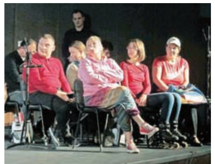
Učitelji glasbene šole so mladim obiskovalcem na zabaven način prikazali, kako se na koncertu ne smemo obnašati.

motili nastopajoče. Obenem pa so ob vsaki točki mladim poslušalcem položili na srce, kako se je na koncertu treba obnašati. "Na koncert je priporočljivo priti pet minut prej, se tiho in udobno namestiti in izklopiti mobilni telefon. Če začetek zamudimo, se premikamo do stola samo med ploskanjem. Obleka naj ne bo neprimerna: kratke hlače, trenirke ne sodijo na koncert. Tudi nastopajoči so poskrbeli, da imajo na sebi »nobl« obleko, v kateri se počutijo lepo in udobno. Nastopajočega po uvodnem priklonu pozdravimo s ploskanjem. Nastop pazljivo in zbrano poslušamo, ne šumimo s papirjem, ne klepetamo. Majhni otroci, ki se naveličajo poslušanja, motijo nastopajoče in ostale poslušalce, prav tako je moteče preglasno kašljanje. Pozorni smo na program, ki ga bomo slišali, saj na programskem listu lahko razberemo, kdaj smemo ploskati (med večstavnim delom NE!). Če je pri izvedbi prisoten dirigent, je stvar preprosta: ploskamo šele, ko dirigent spusti roki.