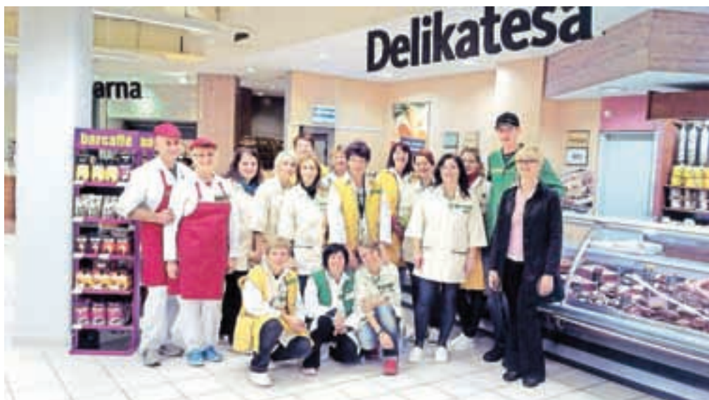
Tušev supermarket na Jesenicah je prenovljen.

Na Jesenicah je podjetje Tuš prenovilo svoj supermarket. Kot so sporočili iz družbe, s prenovo sledijo najmodnejšim nakupovalnim trendom in na police uvrščajo še več lokalno pridelanih izdelkov. »Tuš supermarket na Jesenicah od zdaj dalje na svoji kvadraturi združuje vse, kar potrebuje sodoben potrošniški objekt: premišljeno urejen prostor, ki sovpada s svetovnimi smernicami nakupovanja, nadgrajeno ponudbo kakovostnih izdelkov in posluh za želje kupcev,« so povedali.