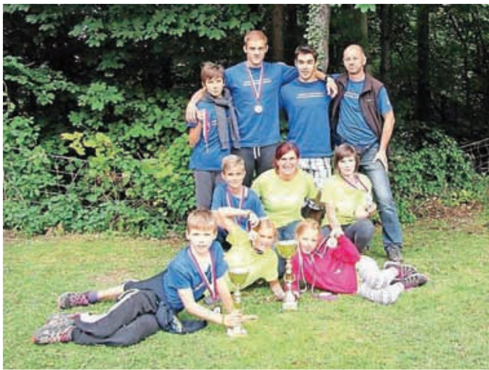
Zmagovalne gasilke pionirke in tretjevršeni pionirji s Hrušice

Kot je dejala predsednica komisije za mladino Saša Kejžar, že uvrstitev na državno tekmovanje ni preprosta, saj morajo mladi gasilci skozi sito občinskih in regijskih tekmovanj: »Samo tri najboljše regijske ekipe pa se uvrstijo na državno tekmovanje. Letos smo bili izjemno močni s štirimi ekipami. Tekmovanje je potekalo tako, da ekipa pred štartom dobi nemo karto z označenimi točkami, točke morajo najti po vrsti, tam pa jih čakajo