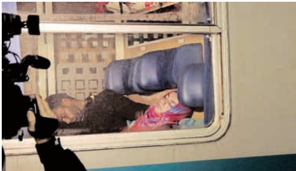
Begunci in migranti so izčrpani in na vlaku zvečine spijo.