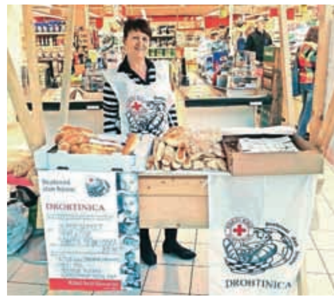
Občani so v zameno za kruh, pekovske izdelke in kremne rezine darovali denar.

evrov, še 540 evrov pa so darovali lokalni obrtniki. Skupaj so tako zbrali 1056 evrov, s katerimi bodo učencem osnovnih šol omogočili 480 toplih obrokov. »Vsem, ki so odprli svoja srca in razumeli stisko tistih, ki imajo manj od vas, iskrena hvala. Vsem občanom, ki ste nas opazovali samo od daleč ali se z našo akcijo niste strinjali, pa vzpodbuda in prijazno vabilo, naslednje leto boste ponovno imeli priložnost sodelovati,« so sporočili z Rdečega križa Jesenice.