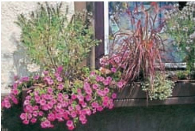
Najlepše ocvetličen poslovni objekt pa je Šiviljstvo Castello na Cesti železarjev.