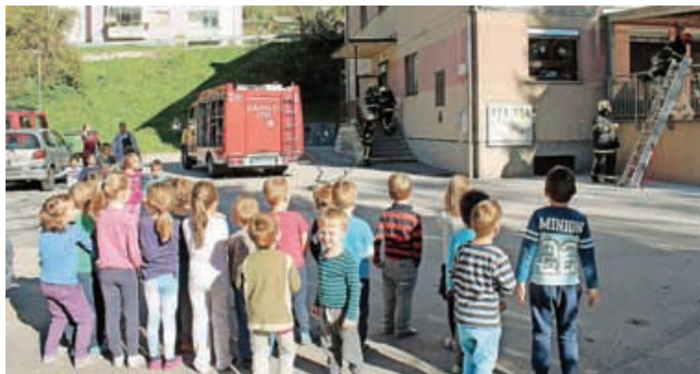
Evakuacija vrtca na Hrušici

Prostovoljni gasilci PGD Hrušica so na Hrušici pripravili pravi gasilski dan za vrtčevske otroke.