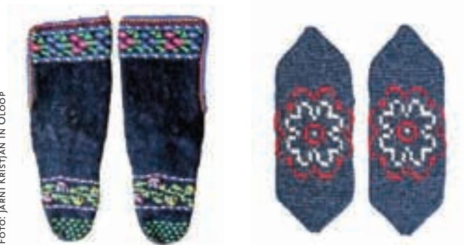
Posodobljeni balkanski copat z islandskim pridihom