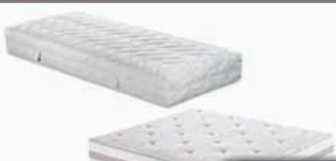
vzmetnice in posteljnina