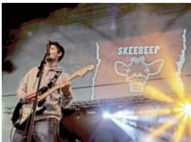
Mlade štajerske pankerje Skeebep so prišli poslušati celo iz Maribora, samo Jeseničanov je bilo bolj malo.