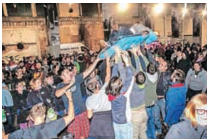
Na koncertu Elvis Jackson ni manjkalo niti deskanja po obiskovalcih.