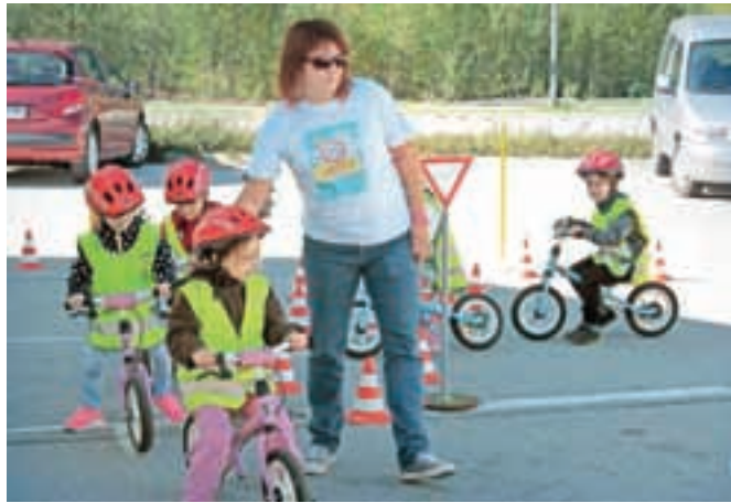
S poganjalčki so se otroci zapeljali po poligonu s prometnimi znaki ...