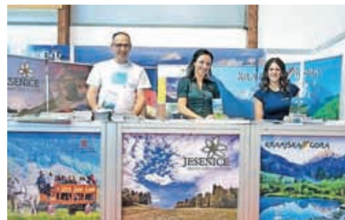
Skupna stojnica TIC Jesenice, LTO Kranjska Gora in ZTK Žirovnica