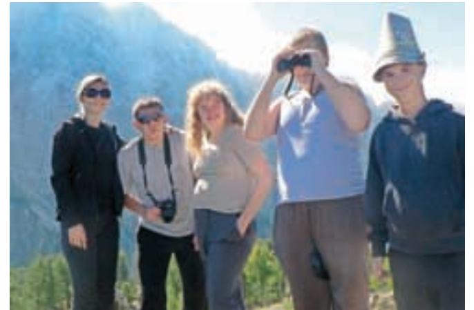
V hribih je lušno ...

mlajši, pa so do Poštarskega doma prišli z vrha prelaza. Večina jih je bila na Vršiču prvič, zato čudenju nad prelepim visokogorskim svetom ni bilo ne konca ne kraja," je povedala Kolarjeva. Po končanem športnem dnevu se je večina otrok z učitelji odpeljala nazaj na Jesenice. Deset učencev prilagojenega in posebnega programa, ki so prizadevno obiskovali planinski krožek, ter tri spremljevalke pa so ostali v Erjavčevi koči. Gorski reševalci so jim pripravili pester program, seznanili so jih z osnovami plezanja in najpogumnejši so se v plezanju tudi preizkusili, podali so se do Tonkine kočice, poseben podvig pa je predstavljala tura do Slemenove špice. "Za učence tovrstna tura predstavlja velik izziv, saj se večina od njih spopada s težavami z globinskim vidom, ravnotežjem, grobo in fino motoriko. Zato je za njih še toliko bolj neprecenljiva pomoč članov GRS Jesenice. Spre-