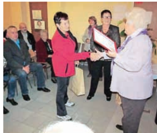
Na zaključni prireditvi so podelili 31 priznanj za lepo cvetje.