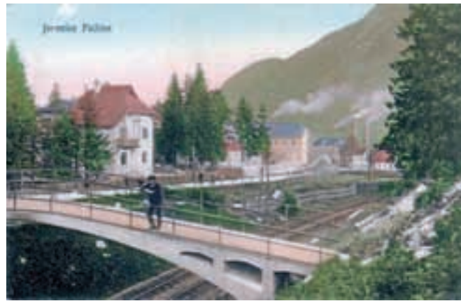
Razglednica Jesenic iz leta 1912, na njej je most čez bohinjsko železnico.