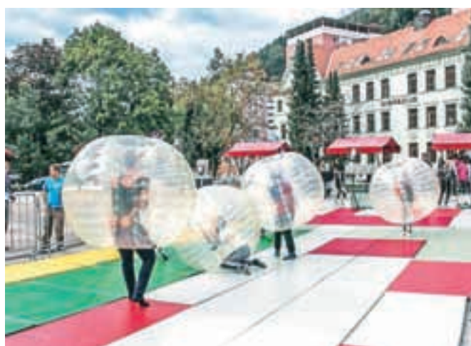
V nedeljo so na Čufarjevem trgu pripravili družinski dan z zabavnimi igrami, kot sta na primer zorb nogomet in srečelov, katerega izkupiček so namenili Osnovni šoli Poldeta Stražišarja.