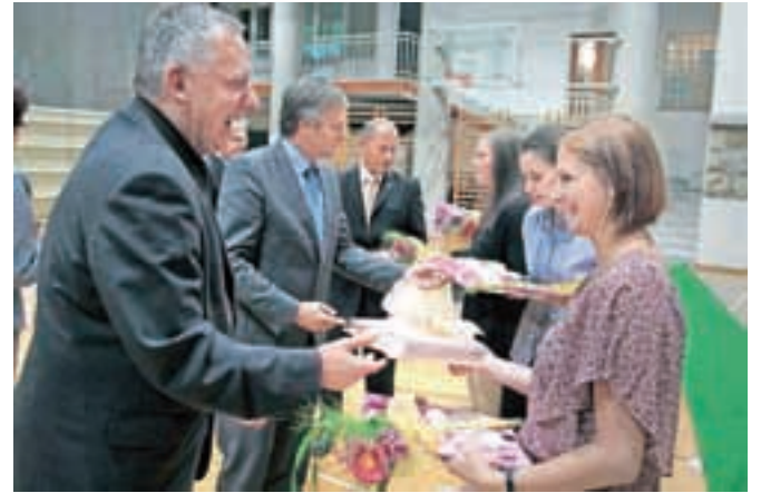
Zlate maturantke so z darili presenetili tudi župani občin, iz katerih prihajajo, to je Jesenic, Žirovnice, Bleda in Radovljice. / BESEDILO: URŠA PETERNEL