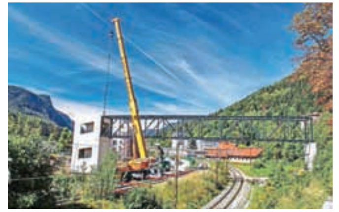
Kovinska konstrukcija mostu je že postavljena. Izdelali so jo v domačem, jeseniškem podjetju KOV.