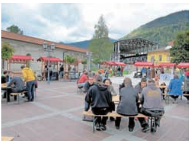
V petek se je v Kolpernu odvijal sejem znanja, v soboto pa tržnica piva in društev na glavnem trgu na Stari Savi.