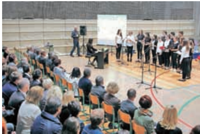
Tradicionalni sprejem na jeseniški gimnaziji v slovo še eni generaciji odličnih maturantov, ki zdaj odhajajo na fakultete.