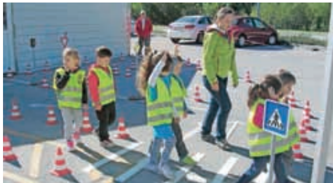
... in se učili pravilnega prečkanja ceste na prehodu za pešce.