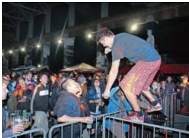
Prireditveni prostor na Stari Savi se je na sobotnem Odmevu bolj napolnil šele pri glavnih zvezdah Elvis Jackson, ki so več kot dve uri dodobra razgrevali okoli 800-glavo občinstvo.

someščanov. Upamo, da se bo to v prihodnjih projektih izboljšalo, ta trenutek pa ne vemo povedati, kako bo s FeSteelvalom v prihodnosti.« Osrednjega koncerta Elvis Jackson se je udeležilo slabih 800 obiskovalcev, koncerta Andreja Šifrerja in nedeljskih prireditev pa okoli 50 obiskovalcev, zato je razočaranje organizatorjev veliko. Kot je dejal Andrej Šifrer po koncertu: »Navaditi jih boste morali, da bodo hodili ven, zato ne odnehati.«