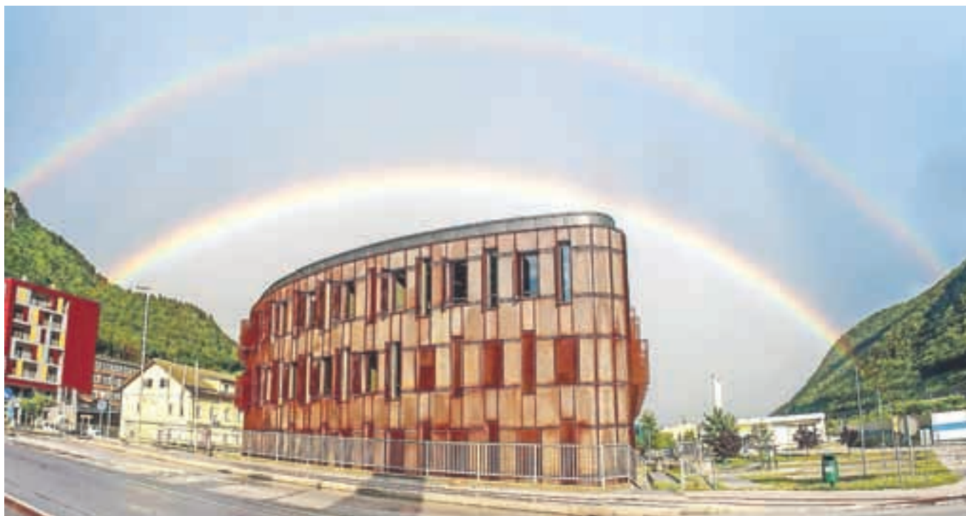
Stavbe upravne enote Jesenice se je med Jeseničani že dodobra prijelo ime Alcatraz, zaradi zunanosti, za katero pravijo, da spominja na zloglasni zapor. Kljub temu pa v pravih razmerah svetlobe izgleda preprosto čudovito. A. S.