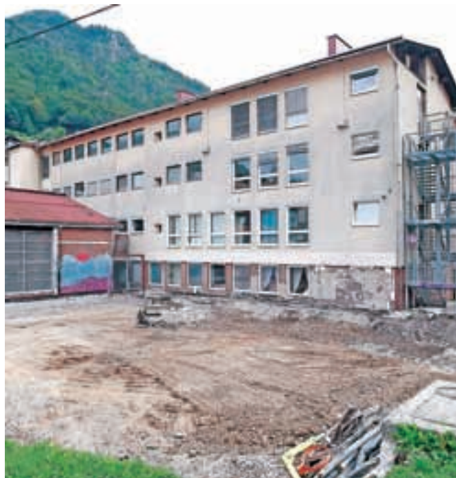
Igrišče je bilo poškodovano zaradi žindre, fasada zamaka, večkrat pa se je lotijo tudi vandali. Potrebna bodo obsežna obnovitvena dela.

čen tako zaradi zamakanja kot tudi zaradi vandalizma. Izbrani izvajalec, Kovinar Gradnje ST, bo najprej začel s sanacijo hidroizolacije kletne stene (zaradi precejšnje vlažnosti v kletnih prostorih, kjer ima svoje prostore Waldorfski vrtec, ter posledično tudi odpadanja ometa), hkrati bo potrebna tudi obnova kanalizacije, saj je le-ta v slabem stanju," so pojasnili na Občini Jesenice. Dela bodo zaključena predvidoma novembra.