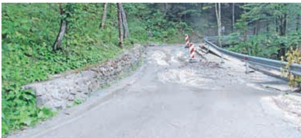
V Planini pod Golico se je sprožil zemeljski plaz, dodatno se je za deset centimetrov udrila cesta proti Betelu in Savskim jamam.

odpadkov in gradbenega materiala, ki je v preteklosti pogosto povzročal težave, kar pomeni, da so ljudje končno prenehali metati odpadke v potoke, na JEKO-IN-u pa prosijo, da ta nivo vzdržujejo tudi naprej. Večina sanacije je bila zaključena že v torek, ko so očistili pretočne kanale Čopovega grabna in posledice nočnega divjanja hudournika, do konca tedna pa naj bi bila znova prevozna tudi cesta do Betela, ki je začasno popolnoma zaprta in neprevozna. V prihodnje bosta JEKO-IN in GARS Jesenice opremljena z dodatnimi 500 protipoplavnimi vrečami, kar bo omogočilo še hitrejši dovoz na kraj dogodka in posledično hitrejši začetek intervencije.