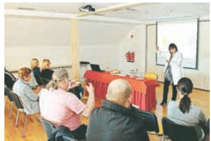
Udeleženci so spoznavali skrivnosti astrologije.

Glede na dober odziv udeležencev si bodo v Društvu za razvoj turizma Jesenice prizadevali, da bi prireditev postala tradicionalna.