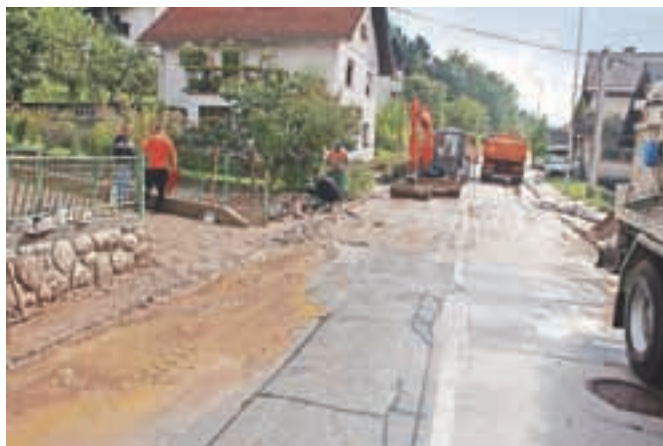
Bregove je prestopil manjši hudournik Čopov graben na Cesti Toneta Tomšiča na Jesenicah.