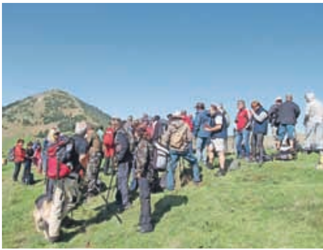
Srečanje na sedlu Rožca

Na sedlu Rožca so se znova srečali prijatelji in sosede z obeh strani Karavank, iz občin Jesenice in Šentjakob.