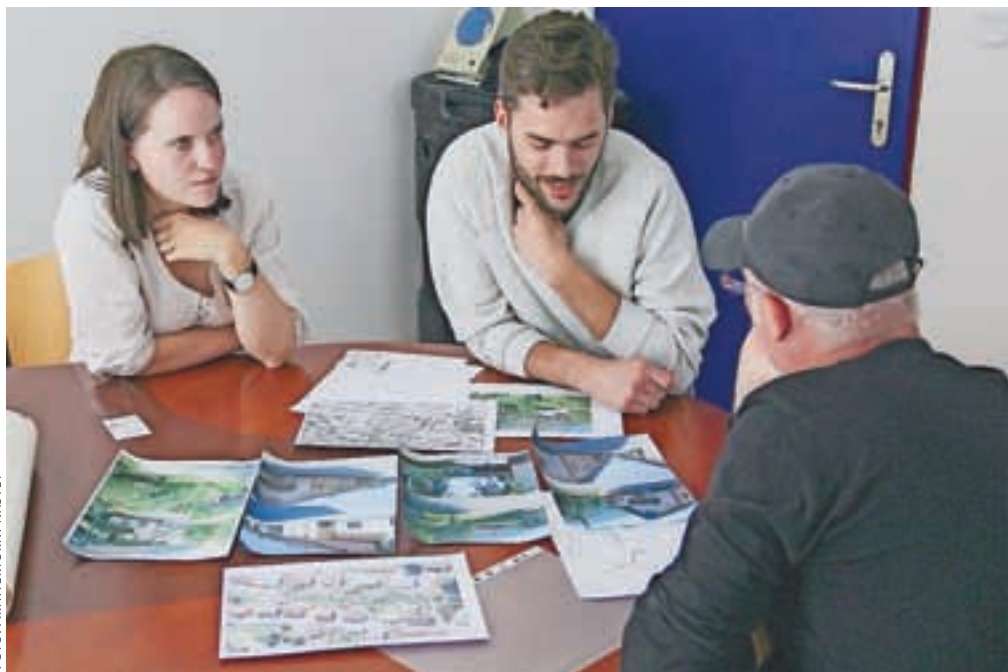
Občani so prišli z zelo različnimi prostorskimi težavami, od ureditve okolice in urejanja dveh otroških sob v eni sobi do problematike s solitrom in sanacije fasade.