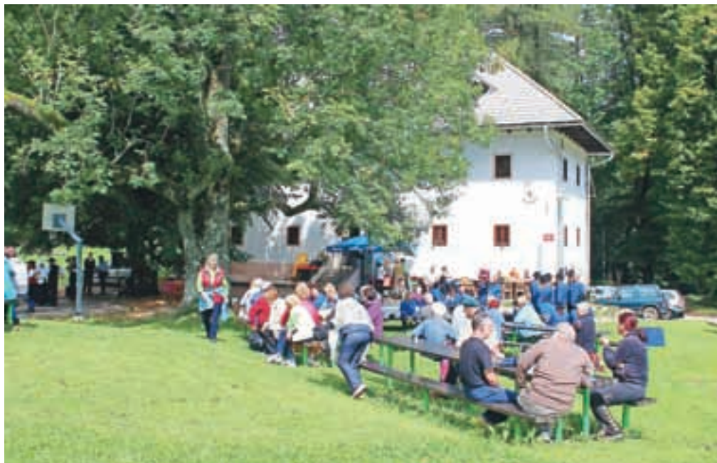
Srečanja na Pristavi se je udeležilo več kot petsto krajanov.

Osrednji del praznovanja praznika krajevne skupnosti se je odvijal v nedeljo, 6. septembra, najprej z gasil-