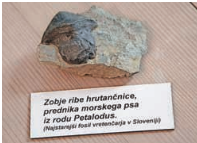
Zobje ribe hrutančnice, prednika morskoga psa iz rodu Petalodus . (Najstarejši fosil vretenčarja v Sloveniji)

Posebno mesto v zbirki pripada štirim zobem karbonskih rib hrutančnic, ki predstavljajo najstarejše znane ostanke vretenčarjev z območja Slovenije; gre za starodavne prednike današnjega morskoga psa.