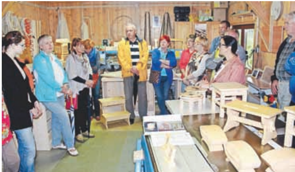
Obiskovalcem so predstavili mizarško delavnico, kjer nastajajo prava mojstrska dela.