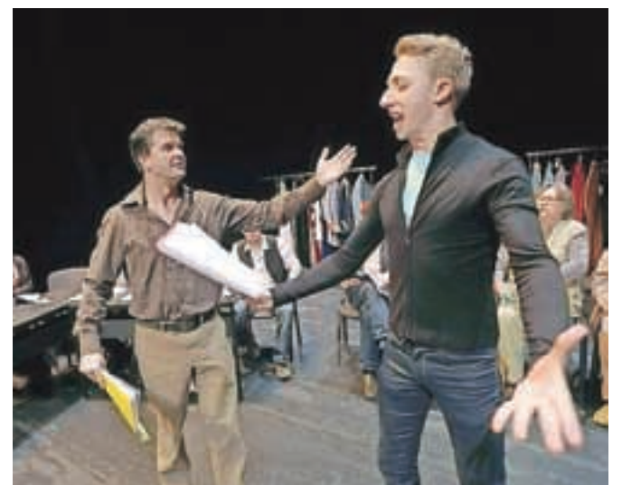
Igralska družina

tom Kako naprej, z dvema predstavama (Operacija spola in Veliki zapeljivec in Igralska družina) pa je nastopila tudi domača gledališka skupina GTČ Jesenice. Drevi bo na oder stopila KD Figura Kranj s Posthumno smetano, prihodnji petek pa mladi jeseniški gledališčniki z Dogodivščinami Zvitorepca, Trdonje in Lakotnika. V nedeljo, 4. oktobra, bodo nastopili še trije dramski krožki z ribenske in blejske osnovne šole.