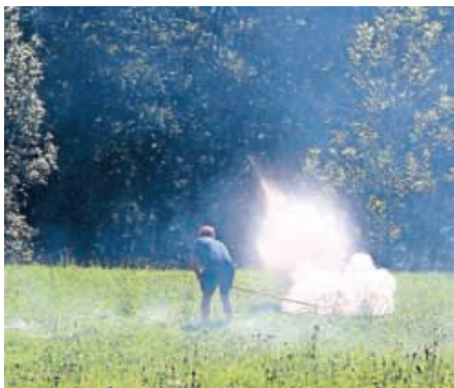
Za preganjanje vsega slabega so poskrbeli člani Kulturnega društva Možnar.