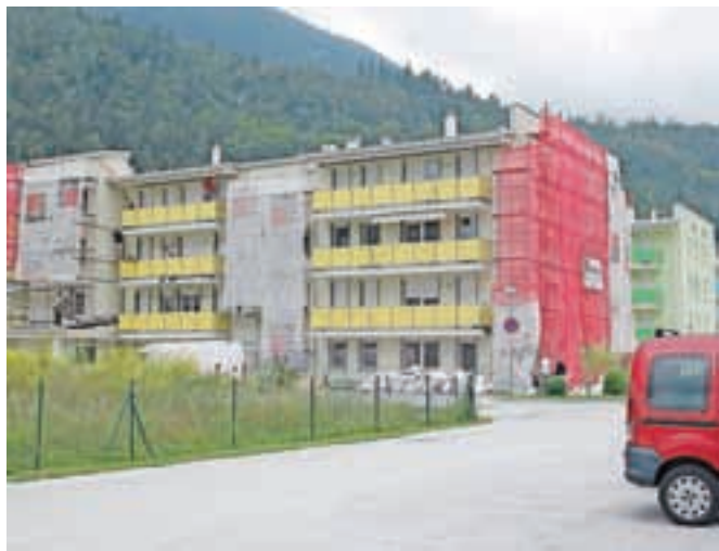
Popravila na blokih – v njih je 69 stanovanj – naj bi trajala tri do štiri mesece.

Po več letih prizadevanj lastnikov stanovanj za popravilo najhujših napak so v Stanovanjskem skladu Republike Slovenije zdaj le začeli z obnovo. V sklopu del bodo, kot so nam pojasnili, sanirali fasade, toplotno izolirali nadstreške nad balkoni, popravili kleparske obrobe in kritine nad vhodi in na strehi objektov, popravili strelove, opravili slikopleskarska dela in dodatna dela pri odvodu talne vode iz kleti na naslovu Ulica Franceta