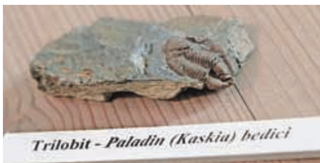
Trilobit - Paladin (Kaskia) bedici

Posebno mesto v zbirki pripada štirim zobem karbonskih rib hrutančnic, ki predstavljajo najstarejše znane ostanke vretenčarjev z območja Slovenije; gre za starodavne prednike današnjega morskoga psa.