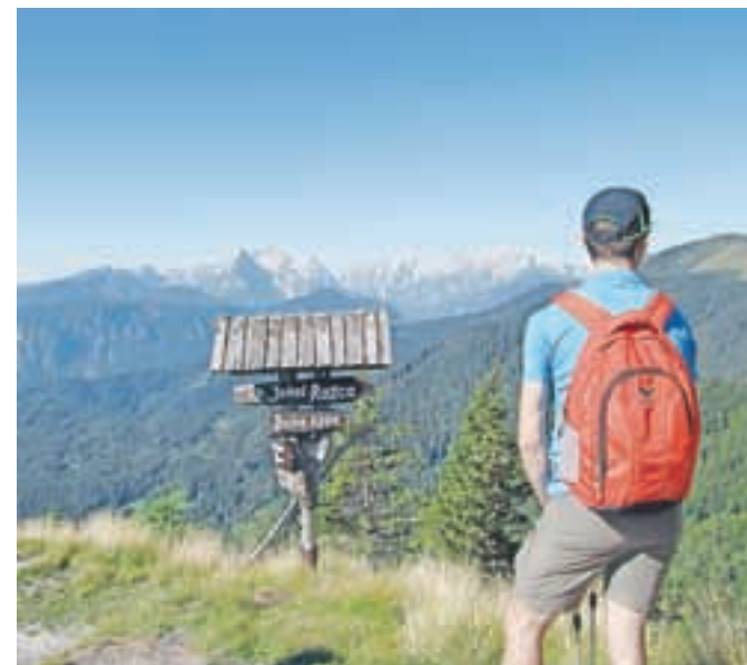
Lepi jesenski dnevi vabijo v gore, a dan se že krajša, pogosti pa so tudi vremenski preobrati. Zato – previdno!