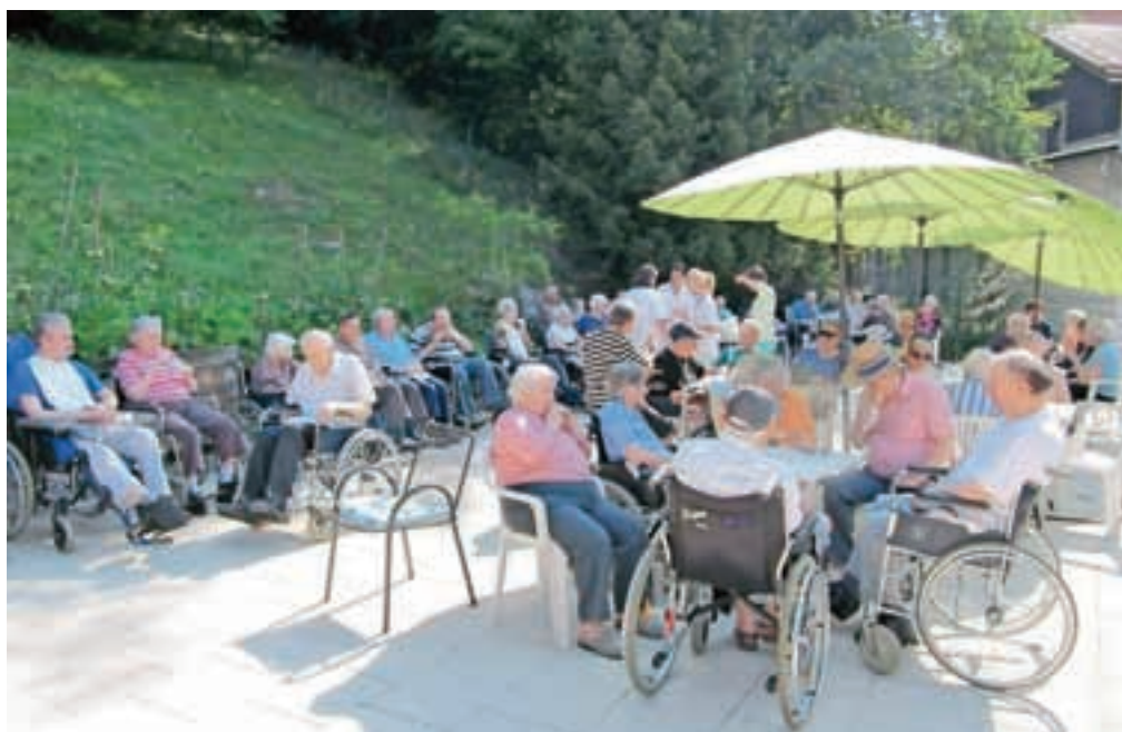
Vročje poletne dni so v jeseniškem domu starostnikov popestrili s pikniki s sladoledom in lubenicami na domski terasi.