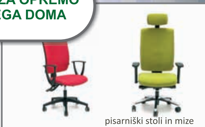
pisarniški stoli in mize

Pohištvo Žakelj LESCE, Alpska cesta 62, T: 04/53 53 530