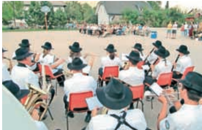
Osrednja slovesnost ob prazniku

nji.« Celodnevni program praznika na lepo sončno nedeljo, 30. avgusta, je obsegal nogometni in balinarski turnir, tek za otroke, pohod na Obranco s kulturnim programom, pohod v Vintgar, predstavitev Društva podeželskih žensk in pokušino njihovih dobrot, prikaz gašenja požara in ogled novega vozila PGD Blejska Dobrava. V petek so obiskali spominska obeležja in položili vence. Poseben ton je prazniku dal obisk delegacije krajanov iz pobratene KS Grgarske Ravne Bate. Vezi