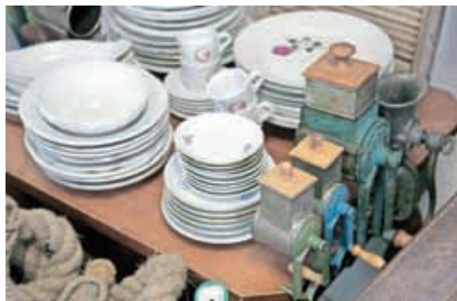
Napredaj so pohištvo, mali gospodinjski aparati, igrače, posode, knjige, kolesa ...