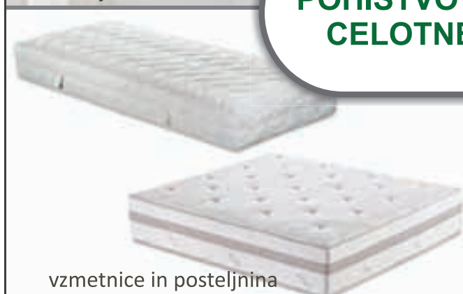
vzmetnice in posteljnina