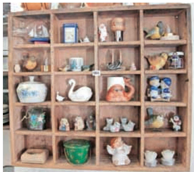
Cene so simbolične in se gibljejo od pol evra do deset evrov.