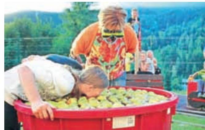
Zabavne kmečke igre: lov na jabolka