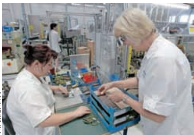
V novo halo se je preselilo šestdeset od skupaj 280 delavcev.