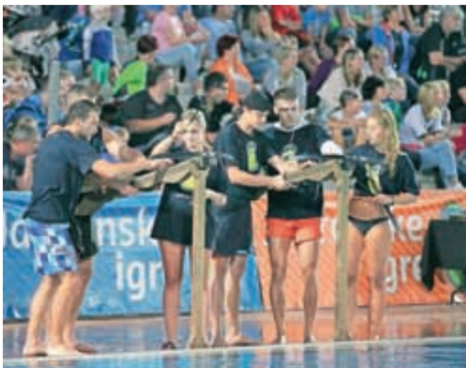
Določene igre so zahtevale natančnost.