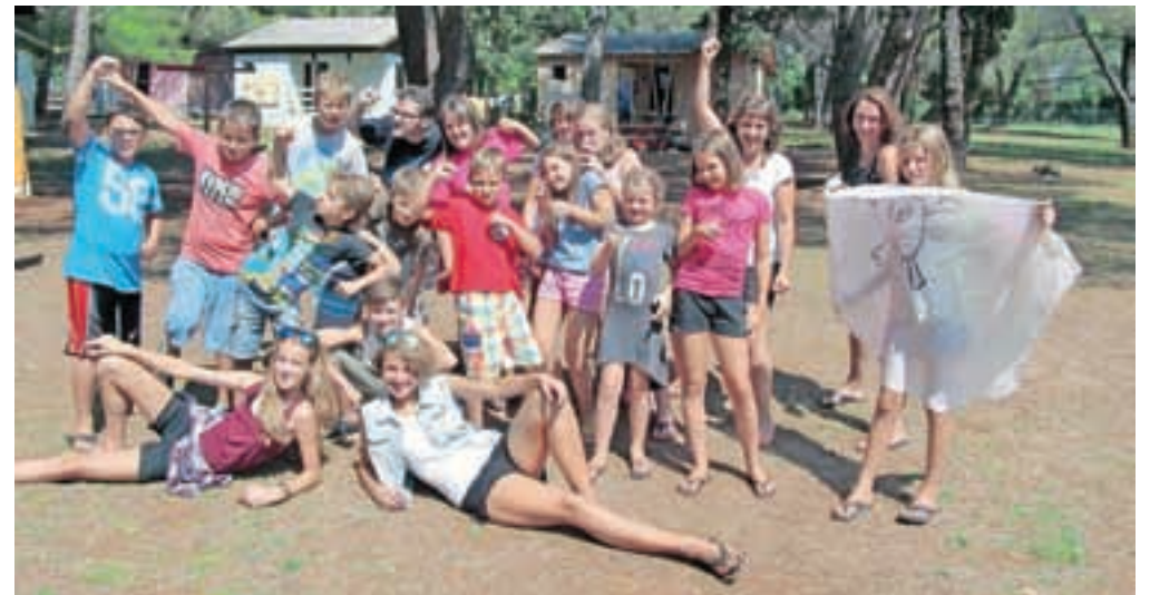
Navdušeni udeleženci poletnega gledališkega tabora

kovanju likov. Naslov tabora je bil Vsak val prinese novo zgodbo. Glede na morsko vzdušje so oblikovali zgodbo za kratko igro o gusarjih, ki so jo predstavili zbranim na letovanju. Vsi so pokazali resen odnos do dela in pri tem tudi uživali. Ponosni pa so bili na kratek film, ki so ga posneli v okviru priprav na igro. Časa je bilo dovolj tudi za kopanje in prijetno druženje.