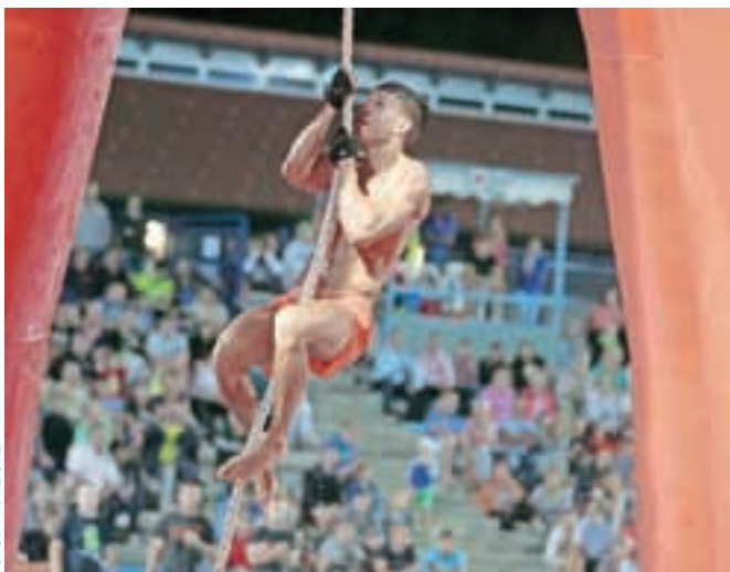
V zahtevni igri 'pršut' je šlo Jeseničanom dobro.