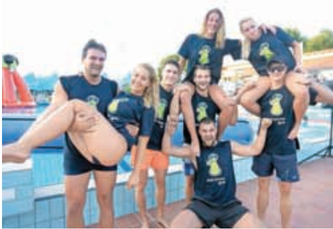
Razposajena jeseniška ekipa

prej odplavati do vrvi, potem pa se po njej povzpeli do pršuta; tekmi sodov, kjer so dekleta v njih veslala od ene do druge točke, in v vleki vrvi. Največ točk so zbrale Štajerske vijolice, medtem ko Jeseničanom kljub trudu in športni zagnanosti ni uspel preboj v finale.