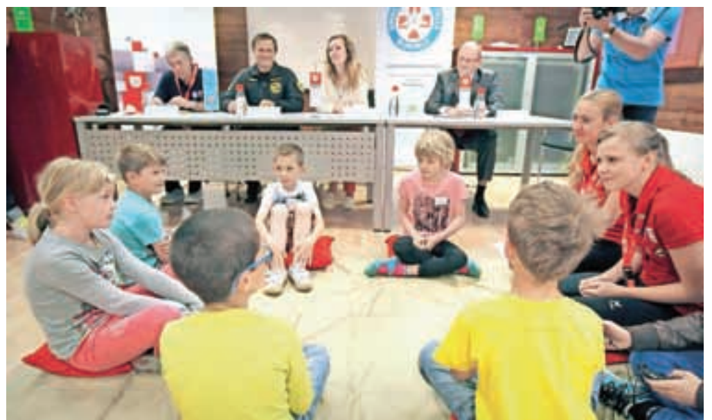
Študentke zdravstvene nege med seznanjanjem otrok z osnovami prve pomoči