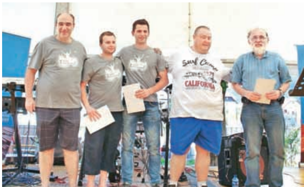
Jeseniški inovatorji, ki gredo na izlet v tovarno BMW.

temperaturam, ki so celo v senci krepko presegale 30 stopinj, pa so bili udeleženci zadovoljni. Kot so poudarjali, jim Dan metalurga pomeni priložnost za druženje, za srečanje izven delovnega časa, spoznavanje drugih sodelavcev, s katerimi se redko videvajo oziroma sode-