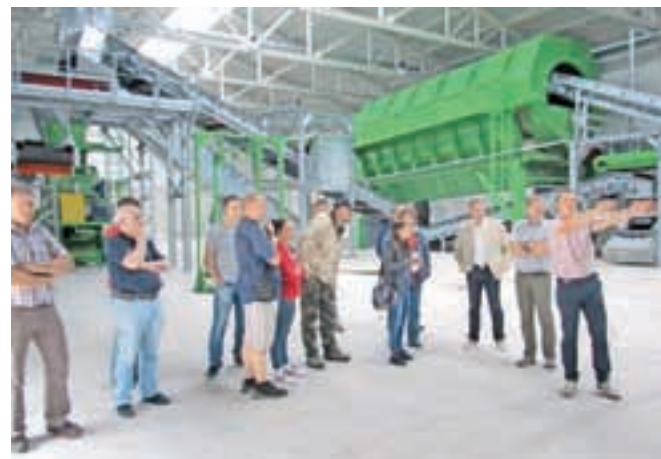
Občinski svetniki in člani delovnih teles na ogledu sortirnice na deponiji Mala Mežakla

Na deponiji ima podjetje Ekogor (občina mu je podelila petnajstletno koncesijo za obdelavo mešanih komunalnih odpadkov) že postavljeno sortirnico, kjer poteka mehanski del obdelave