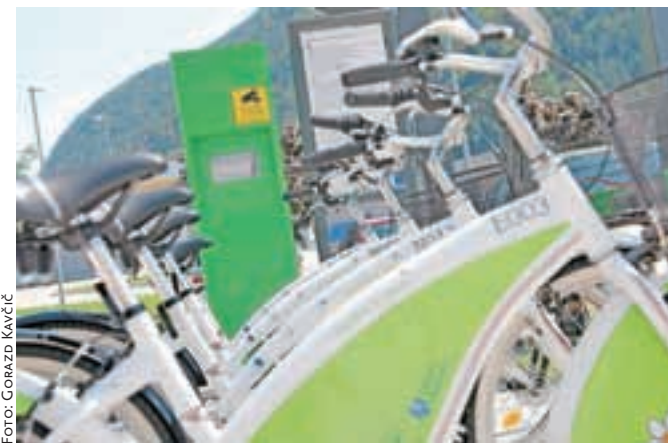
Pri dveh kolesarnicah, pri stavbi Občine in na Hrušici, so namestili kamere, da bi preprečili vandalizem.

jo v skladu z navodili in namenom, v primeru vsakega namernega poškodovanja pa bo Občina Jesenice posnetke predala pristojnim organom v nadaljnjo obravnavo.« pozivajo na Občini Jesenice. Izposoja koles je sicer lepo zaživela, na voljo je petnajst navadnih in šest električnih koles, za letoletno registracijo je treba odšteti deset evrov, v letu dni pa si je mogoče vsak teden brezplačno izposoditi kolo za 840 minut oziroma štirinajst ur. Po podatkih TIC Jesenice so doslej izdali okrog štirideset kartic za uporabo koles.