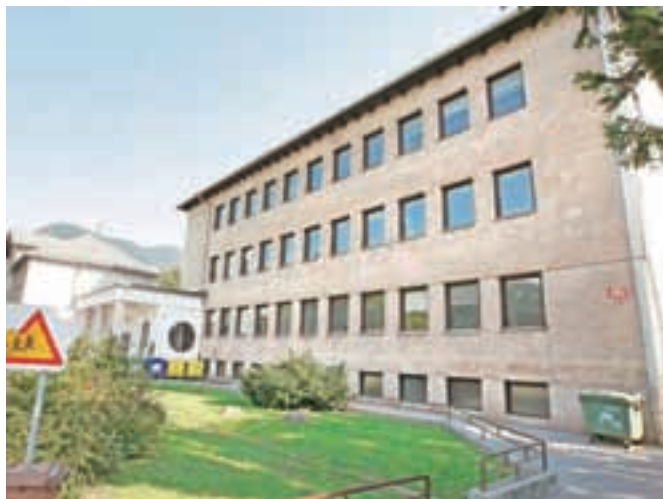
Letos obnavljajo prostore knjižnice in zbornice, prostore tajništva ter pisarn, kabinet, zgradili bodo novo stopnišče v klet in delno uredili kletne prostore.

Občina Jesenice je v projekt vključno z letošnjim predvidenim vložkom vložila že več kot 1,3 milijona evrov. V letu 2017 načrtujejo še ureditev zunanosti šole in parkirišč, s čimer bo celostna obnova Osnovne šole Koroška Bela tudi zaključena.