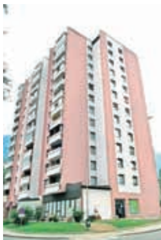
Še ena jeseniška stolpnica je dobila lepšo podobo.

Plavž, največja krajevna skupnost v Občini Jesenice, spreminja svojo podobo na lepše. Že več let se vrstijo obnove večstanovanjskih stavb in zasebnih hiš. V letošnjem juliju so zaključili obnovo stolpnice na Cesti Cirila Tavčarja s 84 stanovanji. Poleg lastniških in najemniških stanovanj so v stavbi prostori Krajevne skupnosti Plavž ter več ustanov in organizacij. Celotna investicija je stala 270 tisoč evrov. Financiranje so zagotovili iz rezervnega sklada stolpnice in sredstvi drugih uporabnikov.