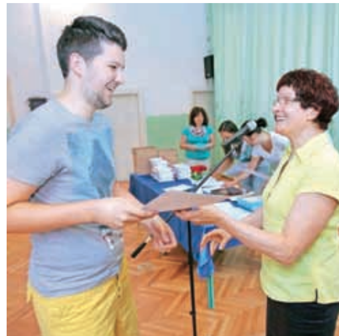
Sredi julija so letošnjim maturantom slovesno podelili maturitetna spričevala.