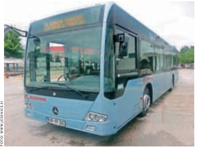
Prvi najsodobnejši avtobus že vozi po jeseniških cestah, še dva naj bi se mu pridružila do konca meseca.

izgubo je koncesionar lani vendarle posloval pozitivno. Na seji občinskega sveta so potrdili tudi predlog nekaterih sprememb cenika, pri čemer pa velja poudariti, da se cene prevozov ne bodo