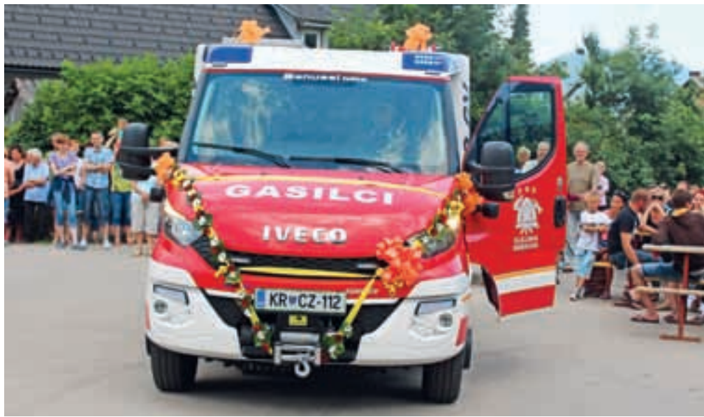
Gasilci z Blejske Dobrave se bodo z novim gasilskim vozilom in 800 litri vode lahko takoj spopadli s požarom.