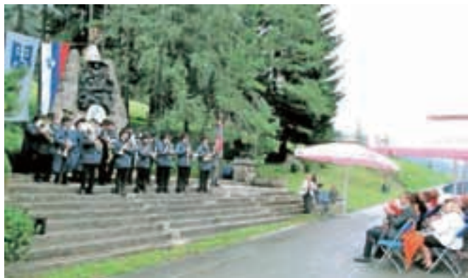
Slovesnost na Belem Polju

Na Hrušici že desetletja vsako leto 27. julija obudijo spomin na 45 talcev, predvsem domačinov, ki so padli na ta dan leta 1942. Hkrati se spomnijo na izgnane družine in vse žrtve druge svetovne vojne. Vedno ob poklonih na spominski svečanosti poudarjajo nesmisle vojn in željo, da se gorje, bolečine in trpljenje ne bi nikoli ponovili.