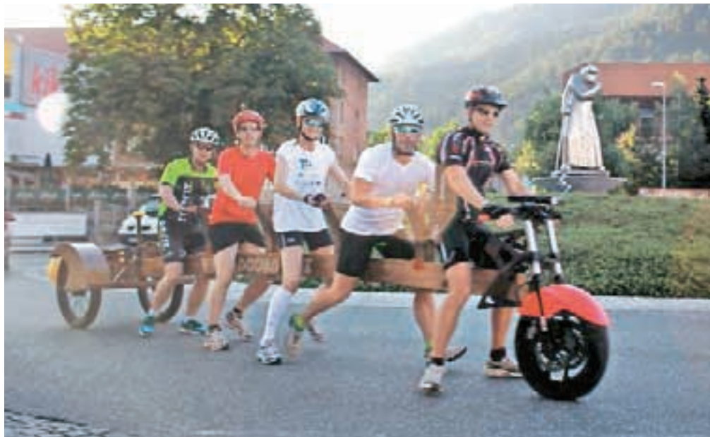
Štart poganjalčka na Jesenicah in začetek 240-kilometrsk poti proti Novigradu