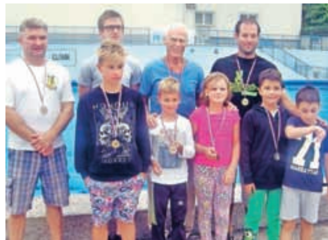
Udeleženci tekmovanja v skokih v vodo