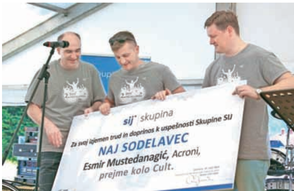
Podelili so nagrade najboljšim delavcem in inovatorjem.