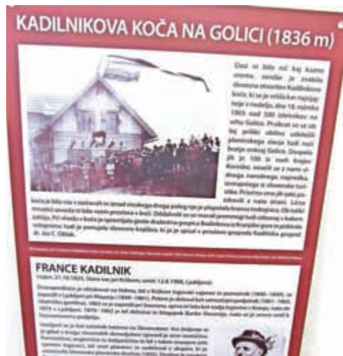
Člani Planinskega društva Jesenice bodo na vrh Golice postavili tablo o Kadilnikovi koči.