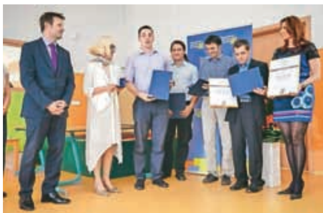
Jeseniški razvojniki so bili za svojo inovacijo že nagrajeni na regijski ravni, kako se bodo odrezali na državnem izboru, bo znano čez mesec dni.

Med 38 nominiranimi inovacijami za državno priznanje najboljšim inovacijam za leto 2014, ki jih bo sredi septembra že tradicionalno podelila Gospodarska zbornica Slovenije, je tudi projekt Razvoj visokoogljčnega jekla X120Mn12 po postopku kontinuiranega litja, ki so ga skupaj zasnovali razvojniki družbe Acroni in Razvojnega centra Jesenice (RC). Njuno inovacijo je namreč strokovna komisija Območne gospodarske zbornice za Gorenjsko priznanje prejeli še begunjski Elan za inovativno tehnologijo pri izdelavi smučke Amphibio 4D, železnikarski Domel in Razvojni center Nela za razvoj nove generacije sesalnih enot z visokim izkoristkom za A-razred energijske nalepke, ter Domel za mešalnik S-Blender 1. Priznanje za najbolj inovativno podjetje je prejelo podjetje Jelovica Hiše.