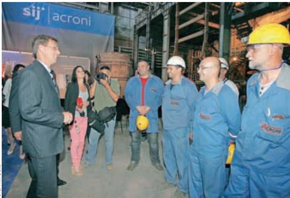
Ob robu dogodka si je premier Miro Cerar ogledal tudi del proizvodnje družbe Acroni.

S podpisom pogodbe, ki obeta novo tehnološko pridobitev za družbo Acroni, je skupina SIJ začela svoj novi naložbeni cikel do leta 2020, v okviru katerega bodo za naložbe namenili okrog 250 milijonov evrov. Zagon proizvodnje nove peči AOD je predviden v zadnjem četrtletju leta 2016, začetek rednega obratovanja pa v prvem četrtletju leta 2017. Neposredne pozitivne učinke investicije v letih 2017–2020 ocenjujejo na več kot deset milijonov evrov letno. Poleg povečanja proizvodnih zmogljivosti nerjavne debele pločevine bo nova investicija v peč AOD vplivala na občutno, kar 30-odstotno zmanjšanje časa izdelave nerjavnih vrst jekel, kar pomeni sprostitvev dodatnih prostih proizvodnih zmogljivosti za druge programe, na primer povečanje proizvodnje specialnih jekel. Z omenjeno naložbo bodo dosegli tudi znižanje specifičnih porab energentov, povečali stabilnost z vidika kakovosti in dosegli nižji okoljski odtis, so poudarili v Acroniju. Pogodbo za dobavo peči AOD sta ob navzočnosti predsednika vlade Mira Cerarja in ministra za gospo-