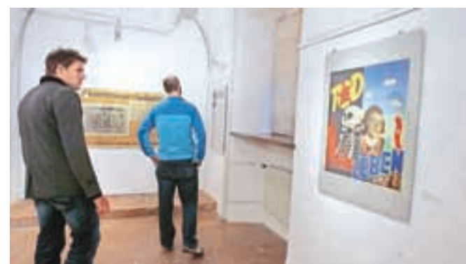
Močna likovna podoba in izjemna povednost sta bili prvi odliki prepričljivega plakata.