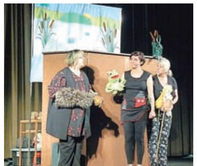
Kosmata žaba za nadobudne bralce