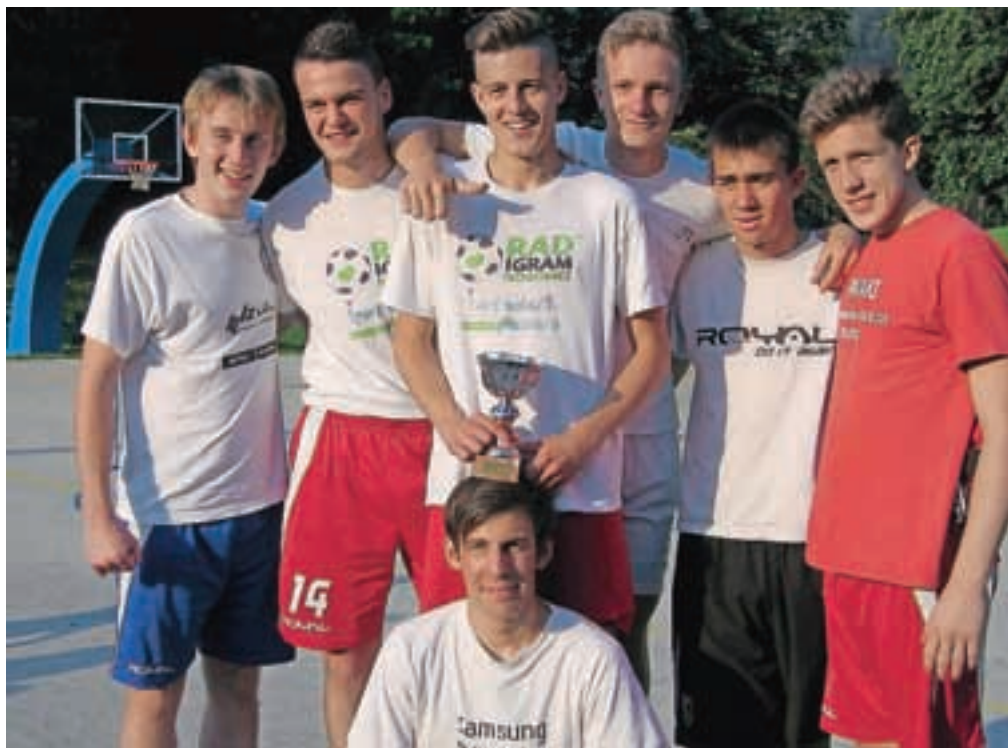
Zmagovalci turnirja v malem nogometu