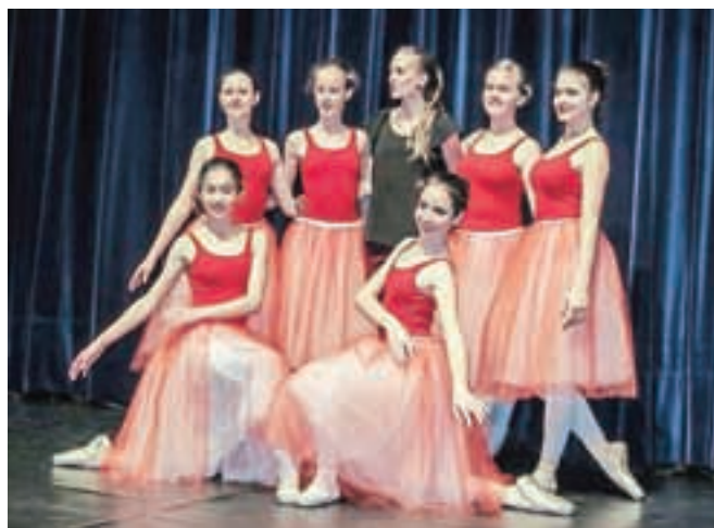
Na odru gledališča Toneta Čufarja se je predstavilo kar 180 baletnih plesalk in plesalcev.

V dvorani Gledališča Toneta Čufarja je potekala deveta revija klasičnobaletnih šol in društev iz vse Slovenije.