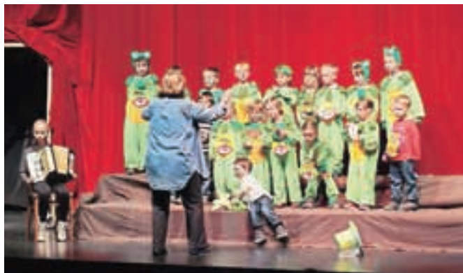
Otroški zbor Žabice iz Kranjske Gore na odru Kulturnega doma na Slovenskem Javorniku

nica, Žabice iz Vrta Kekčevih junakov Kranjska Gora, otroški pevski zbor Biba Buba Baja z Osnovne šole Koroška Bela in otroški zbor 1. in 2. razreda Osnovne šole Žirovnica. Mlade pevke in pevci so navdušili polno dvorano občinstva, predvsem staršev. Prireditev je spremljala strokovna spremljevalka, ki bo tudi podala ocene o nastopih.