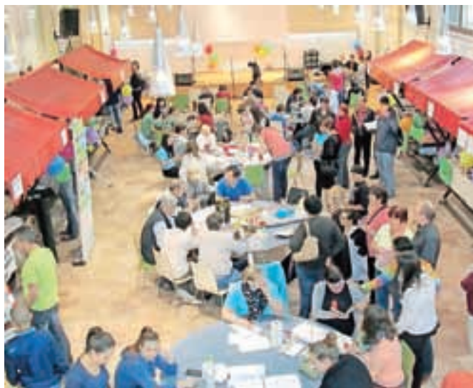
Vrvež v Kolpernu na Paradi učenja 2015

Osrednji dogodek letošnjega Tedna vseživljenjskega učenja na Jesenicah je bila tudi letos Parada učenja, tokrat že četrta zapored, ki pa zaradi slabega vremena prvič ni potekala na trgu na Stari Savi, temveč v Kolpernu. Na stojnicah so se predstavljale različne ustanove in društva, potekale so različne delavnice, od izdelovanja torbic iz recikliranega materiala in terapevtskih žogic iz starih nogavic, copatk ter cofastih pošasti do delavnice kaligrafije, igre križemkrazem ... Predstavili