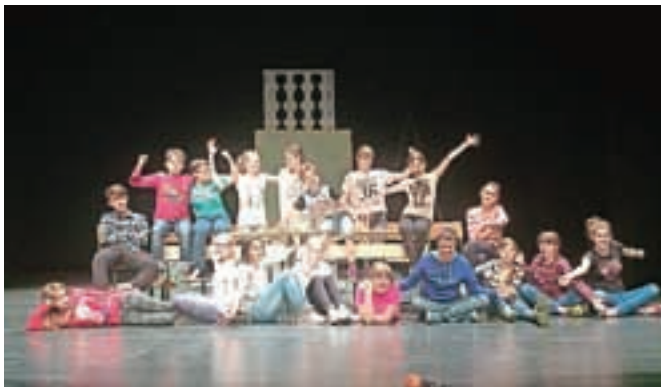
Zaključna produkcija otroške gledališke šole