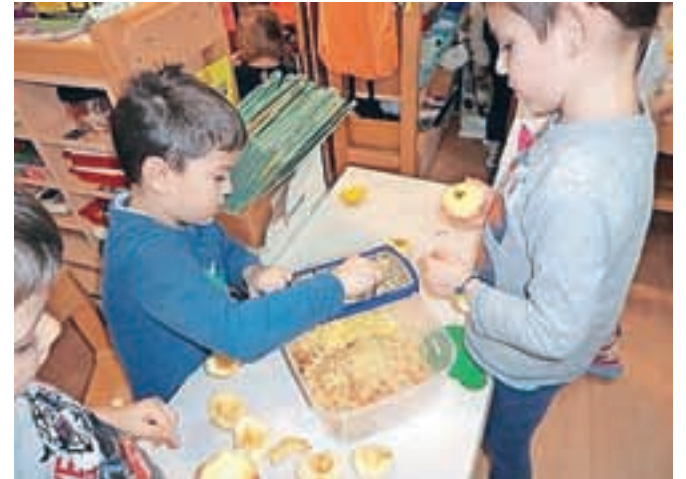
Otroci so se naučili, da iz sadja, ki ostane od sadne malice, lahko spečejo zavitek, skuhamo kompot, stisnejo sokove ...

Poleg tega v vrtcu sodelujejo tudi v programu Etika in vrednote v vzgoji in izobraževanju, v mednarodnem projektu Pomahajmo v svet, pri katerem se otroci vrtca povezujejo preko video omrežja z litvanskim in hrvaškim vrtcem, v projektu Gozdni vrtec v okviru Gozdnega inštituta, v katerem otroci raziskujejo gozd kot učno okolje, v turističnem projektu Z igro do prvih