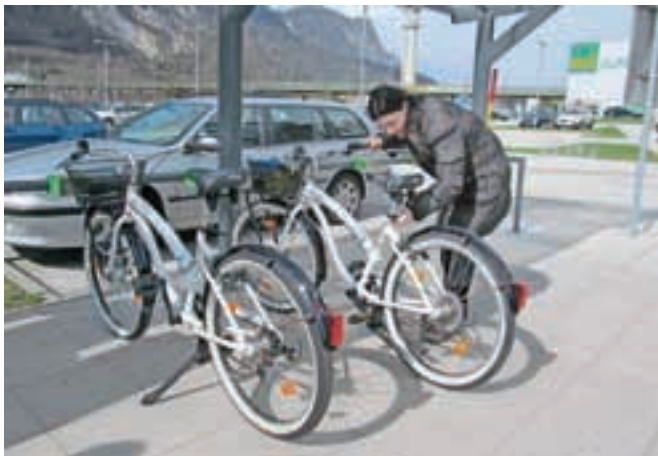
Eno od mest s stojali za izposajo koles bo pri stavbi Občine Jesenice.

Vzpostavitev kolesarskega sistema na Jesenicah je vredna 50 tisoč evrov in sodi pod okrilje projekta IDAGO – izboljšanje dostopnosti in atraktivnosti gorskih obmejnih območij, v katerem Občina Jesenice sodeluje kot eden izmed projektnih partnerjev. Projekt je sofinanciran v okviru Programa čez-