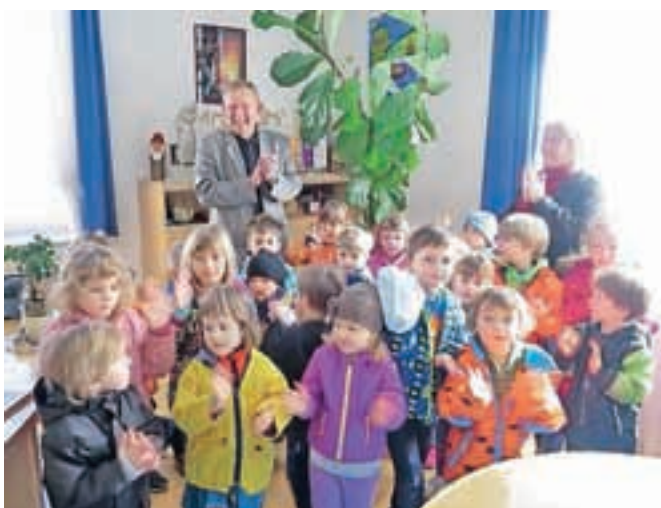
Župan je sprejel malčke z Blejske Dobrave.