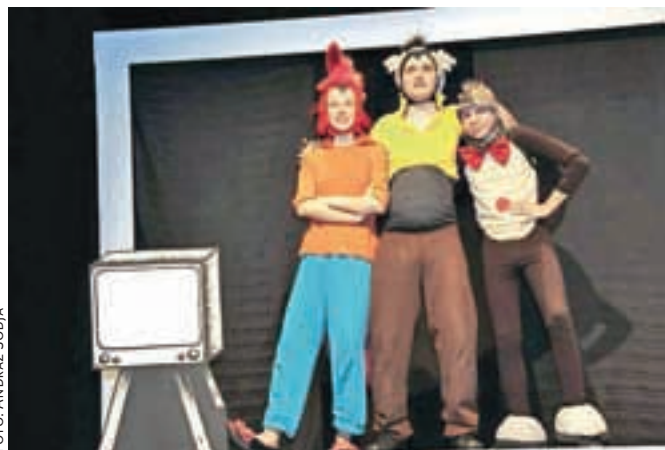
Domača otroška gledališka skupina se je predstavila s stripom Dogodivščine Zvitorepca, Trdonje in Lakotnika.