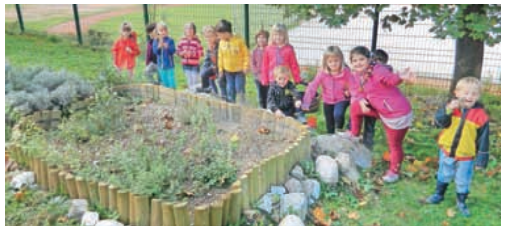
Uredili so več vrtičkov, kjer otroci spoznavajo način pridelave zelenjave, ki jo kasneje uporabijo pri kuhanju.