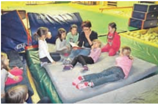
Telovadnica se je spremenila v pravljčno deželo ...