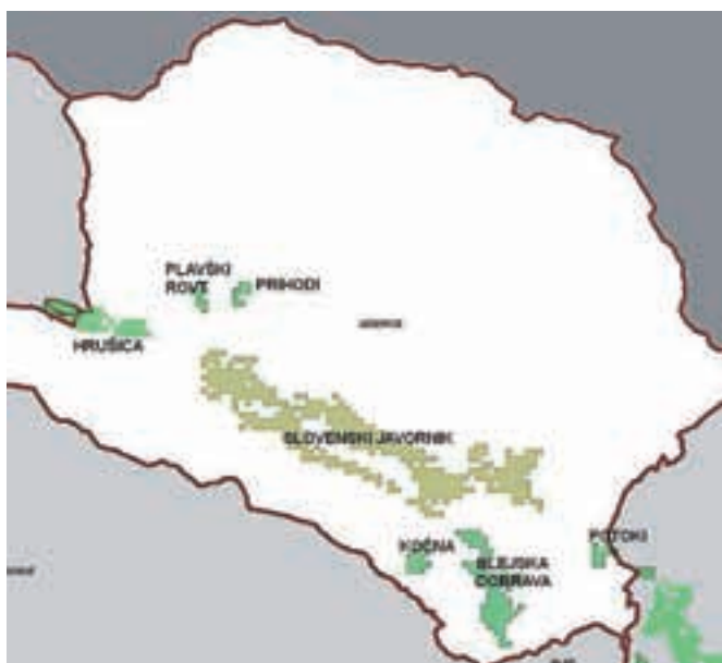
Aglomeracije v občini Jesenice