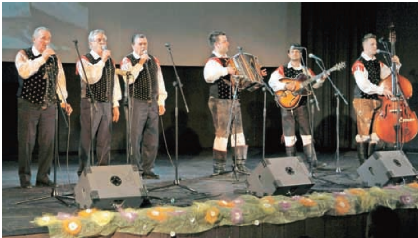
Fantje s Praprotna in ansambel Vikend