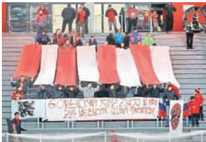
Na tribune stopa nova generacija Red Steelersov.

kazali, da so prišli v športno mesto,« povedo navijači, ki imajo veliko idej in želja, tako si želijo, da bi ob avtocesti našli prostor tudi za tablo, ki bi obveščala mimoideče, da se peljejo proti mestu z bogato športno tradicijo. »Imamo vizijo za prihodnost, ki jo bomo skušali uresničiti, povezani smo s klubom, s katerim dobro so-