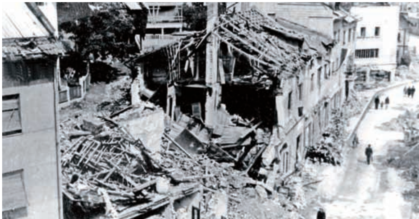
Jesenice, porušene v bombnem napadu 1. marca 1945, na izvorni fotografiji iz fototeke Gornjesavskega muzeja Jesenice, kjer hranijo okrog trideset fotografij posledic bombardiranja.

»Ob 13. uri in petnajst minut so zatulile sirene, da je nevarnost letalskega napada minila. Tisti, ki so sedeli v restavraciji, so brezskrbno ostali pri kosilu. Toda samo nekaj minut zatem so po dolini z vzhoda priletele tri eskadrile trinajstih bombnikov in začeli so spuščati bombe. Odvrgli so 150 bomb, težkih po 250 kilogramov ... Ko so ljudje v zraku zagledali srebrne pike, ki so padale nad mesto, je bilo že prepozno. Bombe so zadevale cilje tako hitro, da ljudje niso imeli časa za umik v zaklonišča ...« (Tone Konobelj, Jeseniški zbornik 2004)