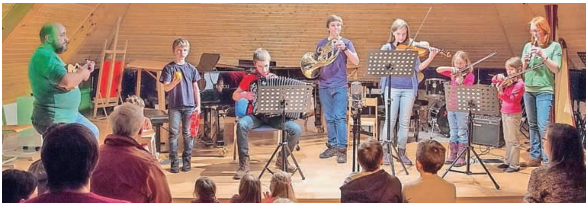
Med nastopajočimi je bila najštevilnejša zasedba družine Čušin s Koroške Bele. Na različne instrumente (tolkala, violo, violino, rog, harmoniko ...) je zaigralo kar osem članov družine s pridruženjo članico.