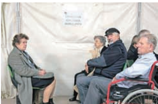
Delo v začasnih prostorih urgence poteka nemoteno, pacienti so z oskrbo zadovoljni.