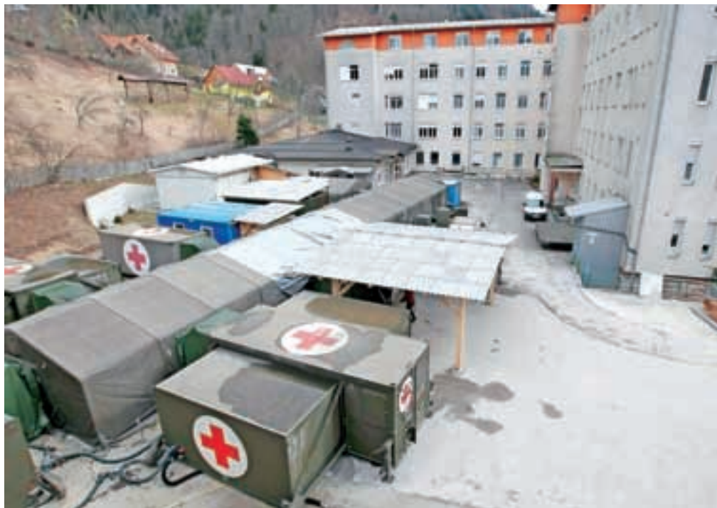
Mobilna vojaška bolnišnica Role 2 je v Sloveniji prvič uporabljena v civilne namene, v njej bo osem mesecev delovala urgenca jeseniške bolnišnice.

Mobilno vojaško bolnišnico in glavno bolnišnično stavbo povezuje montažni objekt, ki vodi do vhoda v radiološki oddelek, urejeni so priključki na obstoječe električne, telekomunikacijske in komunalne vode. Zanimivo je, da je v začasnem objektu na voljo celo več prostora kot v dosedanji urgenci, saj so bili za mobilno vojaško bolnišnico upoštevani višji prostorski standardi, pa tudi njena oprema je v posameznih delih sodobnejša, kot je bila oprema stare urgence. Delo v začasnih prostorih poteka nemoteno, je zatrdil predstojnik enote