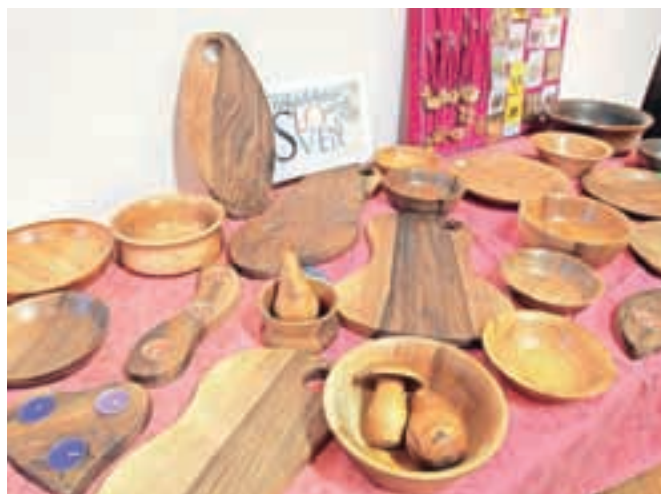
Nekaj izdelkov ima certifikat Rokodelstvo Art & Craft Slovenija