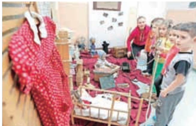
V vrtcu so odkrivali kulturno dediščino, otrokom pa je najbolj všeč tisti del razstave, ki prikazuje igrače, s kakršnimi so se igrali v vrtcu nekoč.

razstavo starih predmetov, oblačil, knjig, fotografij in replik umetniških del doma-