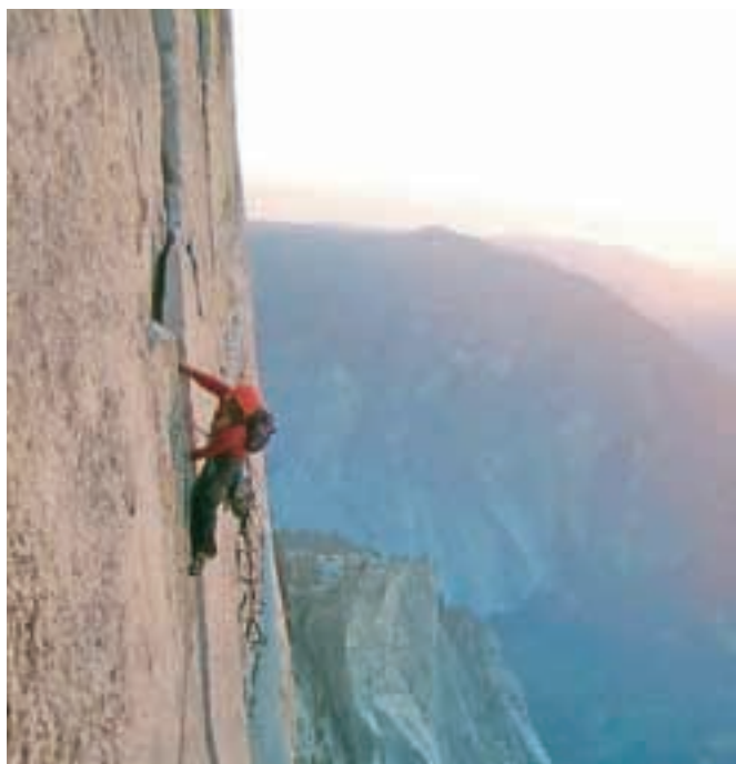
Plezalna izkušnja v Kaliforniji

"Ja, konec aprila gremo s šestimi prijatelji plezat v Kolorado. Najprej se bomo povzpeli na puščavske stolpe, potem pa še na nekaj drugih ciljev v bližini. Podobno bo odpravi v Yosemite, le da bomo tukaj potovali z najetimi avtom in imeli možnost tudi bolj turističnih ogledov."