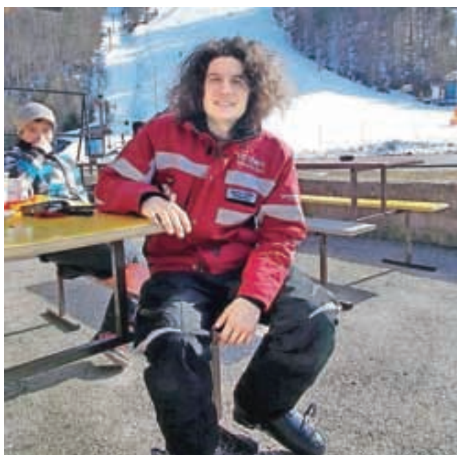
Matic dela kot reševalec na smučišču v Podkorenu.

"Cassinov raz v južni steni Denalija. Legendarna smer, ki so jo prvi preplezali italijanski plezalci. Nameravala sva jo preplezati v lahkem in hitrem slogu v enem zamahu, a je bila ravno v tistem času huda zima. Temperatura nad 4000 metrov je bila