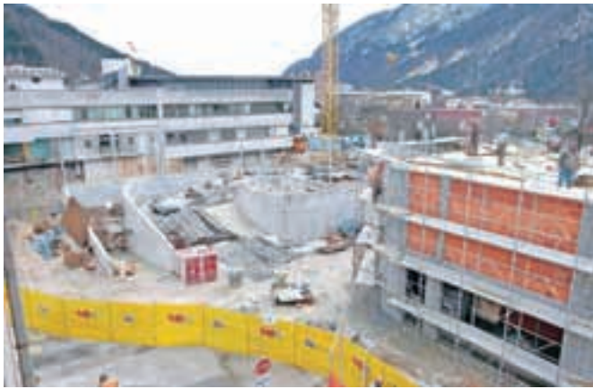
Urgentni center naj bi bil zgrajen do novembra.