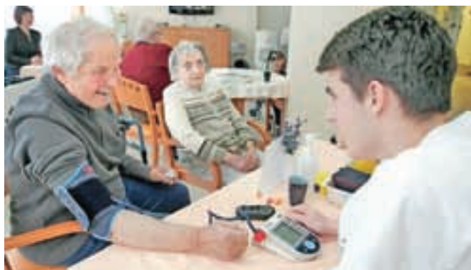
Dijaki so merili krvni tlak in krvni sladkor stanovalcem jeseniškega doma starostnikov.