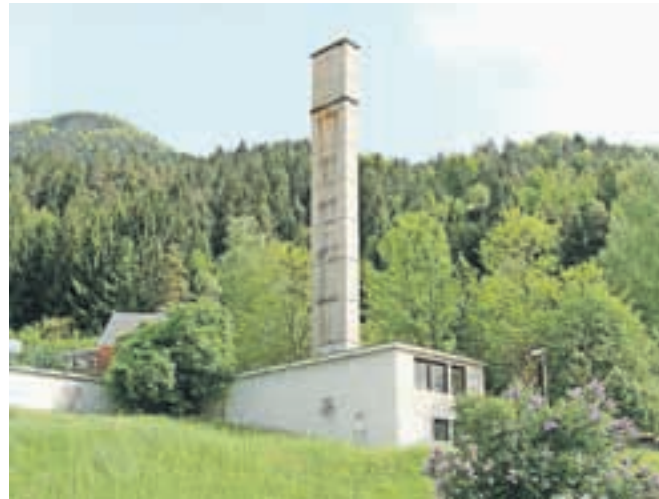
Kotlovnica na Belem polju, ki jo bodo temeljito prenovili.

V krajevni skupnosti Hrušica se po večletnih prizadevanjih vendarle obetajo dobre rešitve za ogrevanje večine večstanovanjskih stavb. Predvsem bodo ugodne za lastnike stanovanj, energetsko učinkovite, ogrevanje pa bo bolj prijazno do okolja. V naselju Belo polje, kjer je na staro in dotrajano kotlovnico priključenih 108 stanovanjskih enot v enajstih večstanovanjskih stavbah, je Dominvest Jesenice kot večinski upravnik kar nekaj let z lastniki iskal možnosti za sanacijo. Predstavljal je različne ponudbe, vendar po vrsti niso bile sprejemljive za večino. Sedaj je, kot kaže, vendarle na obzoru najboljša, ki praktično brez finančne bremena lastnikov stanovanj prinaša še prihranke pri ceni ogrevanja. Dominvest je na sestanku konec marca vsem lastnikom predstavil princip energetskega