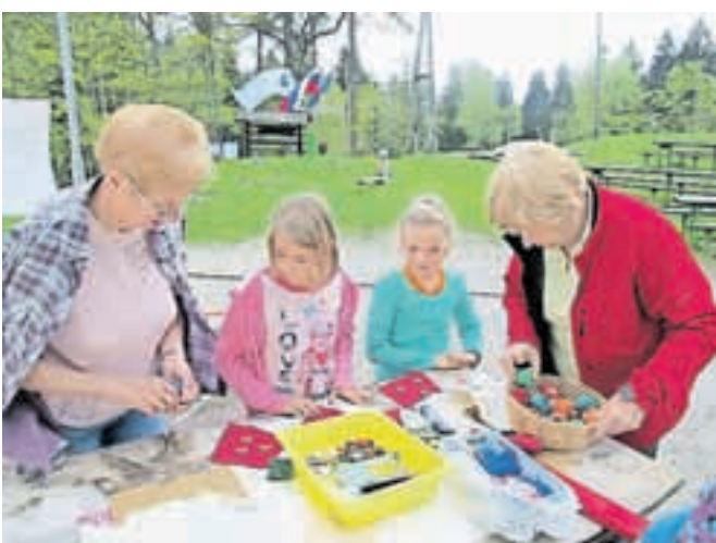
Skupaj z »babicami« so deklice šivale, kvačkale in vezle prtičke s križci. / BESEDILO IN FOTOGRAFIJE URŠA PETERNEL