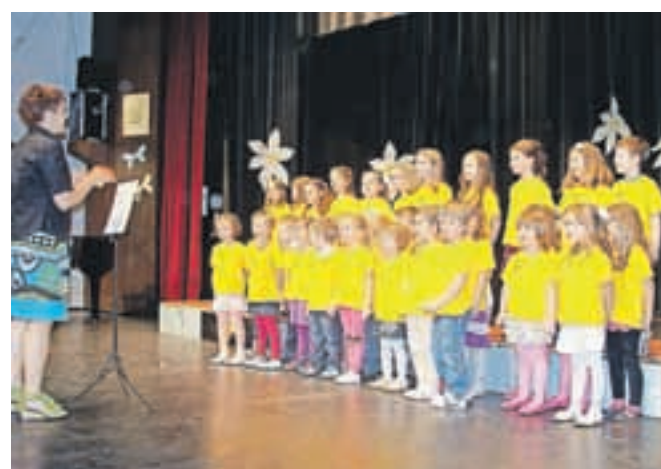
Otroški pevski zbor Mehurčki Vrtca Jesenice