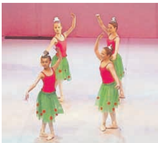
Ples ur v izvedbi učenk 3. razreda