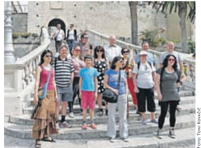
Ekipe Lutkovnega gledališča Ringo raja na Korčuli