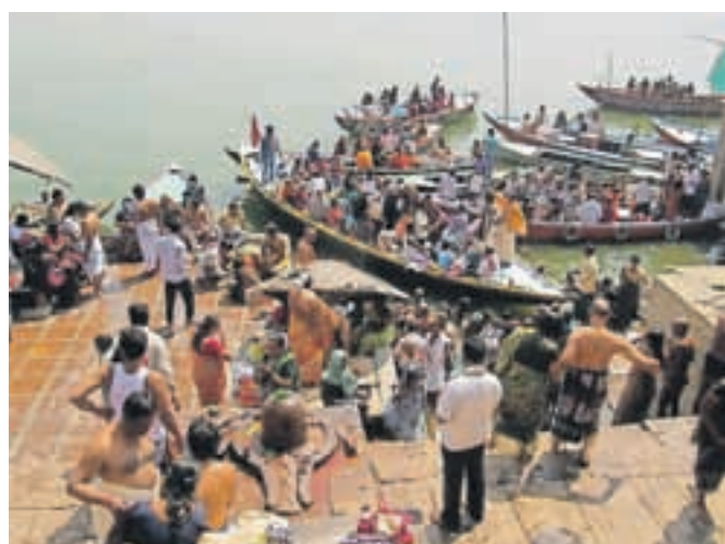
Nepopisna gneča ob Gangesu