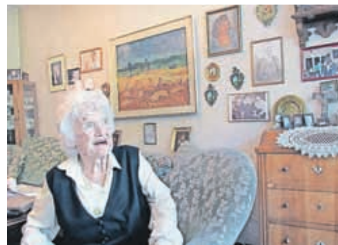
Na mladost jo spominjajo številne fotografije in slike na steni dnevne sobe.