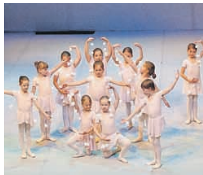
Najmlajše učenke plesne pripravnice v točki Snežinke