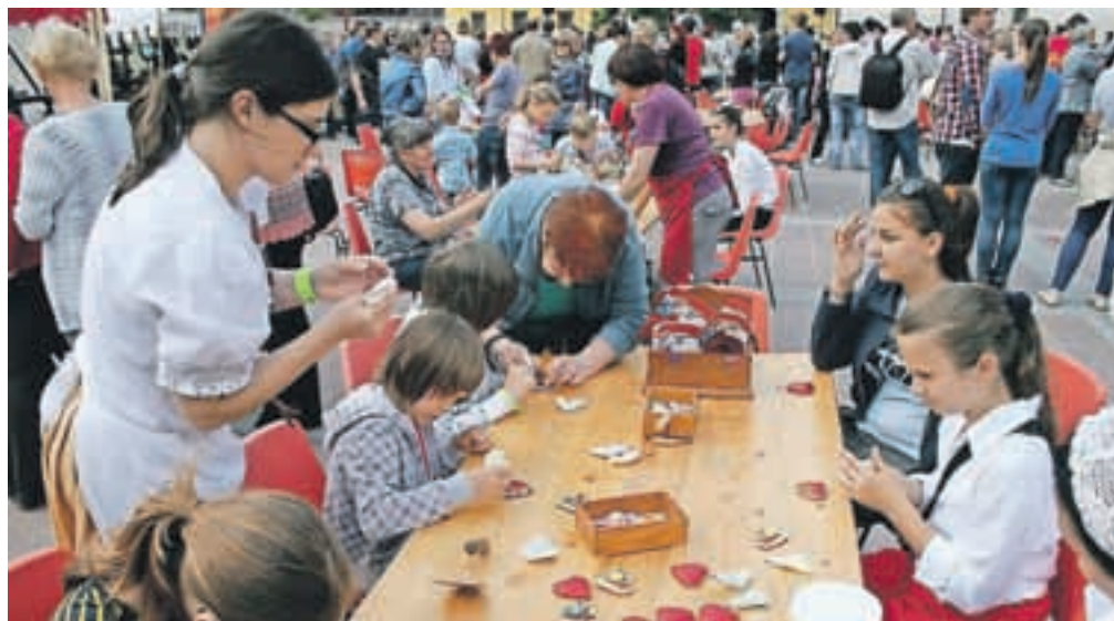
Pripravili so tudi vrsto delavnic od likovne do okraševanja lectovih srčkov.