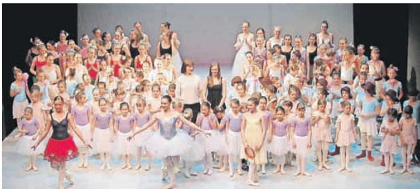
Več kot sto mladih balerin na odru jeseniškega gledališča