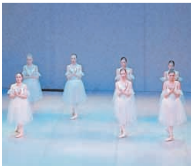
Učenke 6. razreda, ki letos zaključujejo šolanje, v točki Vile

Valant pa je na koncu podelila priznanja sedmim učenkam, ki letos zaključujejo šesti razred, udeleženkam državnega tekmovanja in obema mentoricama. Navdušeni obiskovalci predstave – starši, sorodniki in prijatelji – so povsem napolnili dvorano jeseniškega gledališča.