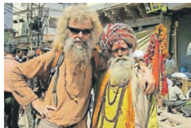
Kako sva si podobna ... Miro z Indijcem.