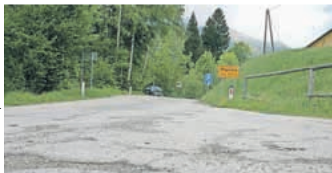
Cesta v Planini pod Golico je že vrsto let močno uničena.

Občina Jesenice bo poleti obnovila cesto skozi Planino pod Golico, in sicer odsek med Prihodi in hotelom Belcijan, natančneje od hišne številke 6/a do hišne številke 14. Poleg investicijskega vzdrževanja in obnove ceste bodo obnovili tudi javno razsvetljavo, so povedali na Občini Jesenice. Javni razpis za izbiro izvajalca je bil že objavljen, dela pa naj bi se začela 25. junija in naj bi trajala dva meseca, torej do 25. avgusta. Ocenjena vrednost projekta je okrog 238 tisoč evrov. U. P.