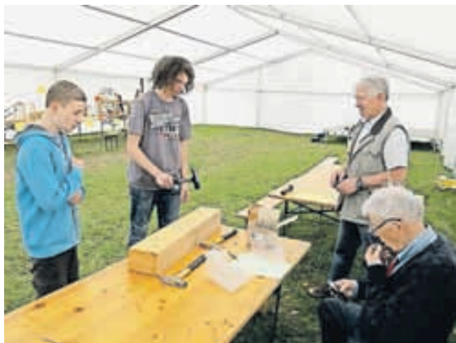
Udeleženci so tekmovali tudi v hitrostnem zabijanju žebeljev v leseno podlago.