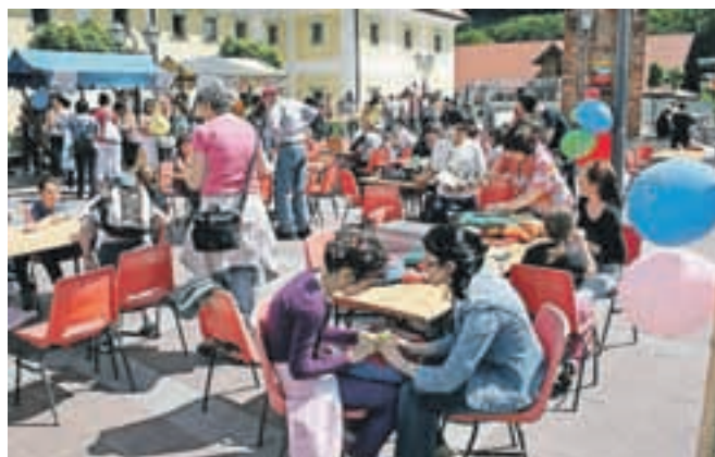
Na stojnicah se je predstavilo okoli dvajset različnih društev in organizacij, ki sodelujejo na področju vseživljenjskega učenja na širšem območju Jesenic.

Na paradi učenja so poleg Ljudske univerze Jesenice sodelovali tudi Občinska knjižnica Jesenice, Mladinski center, Gledališče Tone Čufarja in številna društva, ki so na stojnicah predstavila svojo dejavnost, pripravili pa so tudi vrsto delavnic od likovne do okraševanja lectovih srčkov. Med najbolj obiskanimi je bil verižni eksperiment, ki so ga pripravili učenci jeseniških osnovnih šol s pomočjo članov Društva upokojencev Jesenice. Za konec pa so predvsem najmlajše s kratkim koncertom razveselili tudi Čuki.