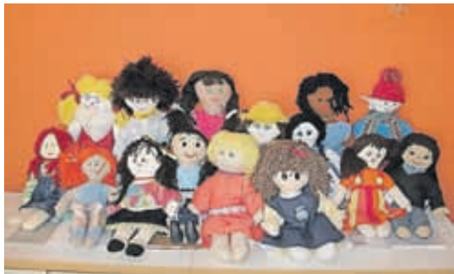
Vsaka punčka iz cunj je ročno izdelana in unikatna, dobi pa tudi svoje ime.

Tudi letos so strokovni delavci Vrtca Jesenice s pomočjo staršev izdelali petnajst punčk iz cunj v okviru projekta, ki poteka pod sloganom Posvoji punčko in reši otroka ter zagotavlja cepljenje enega otroka v državah v razvoju. "Med izvajanjem projekta otroci spoznavajo razmere otrok v državah v razvoju, razvijajo svojo kreativnost, predvsem pa krepijo občutek, da lahko tudi sami pomagajo vrstnikom po svetu. Veliko več se pogovarjajo o medsebojnih odnosih, pričakovanih in vrednotah," so povedali v Vrtcu Jesenice. Vsaka punčka je ročno izdelana in unikatna, ima svoje ime in se odpravi na potovanje po domovih otrok z dnevnikom, v katerega starši zapisujejo, kako so njihovi otroci preživeli dan skupaj s punčko. Po zaključku potovanja punčke pošljejo na Unicef Slovenija, kjer poskrbijo, da jih posvojijo novi prijatelji. U. P.