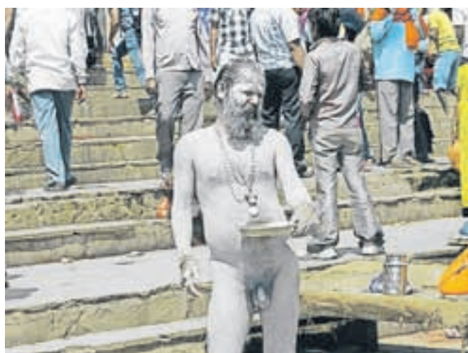
Indijski sveti mož