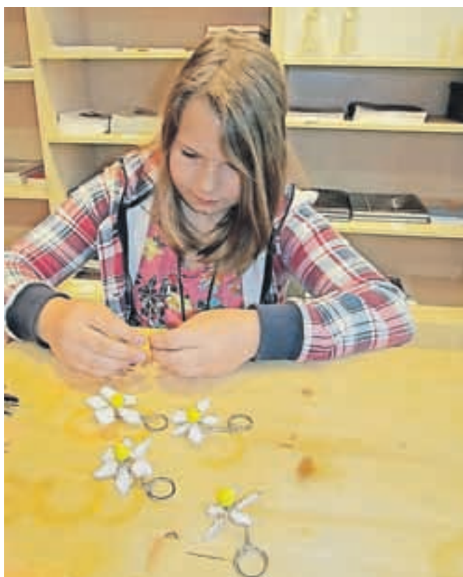
Ena od udeleženk delavnice Patricija pri izdelovanju svoje narcise iz žice.

Ob 18. maju, mednarodnem dnevu muzejev, so v Gornjesavskem muzeju Jesenice odprli vrata svojih zbirk na Jesenicah in omogočili brezplačen obisk. Pripravili pa so tudi delavnico izdelovanja narcis iz žice, ki je potekala v Ruardovi graščini. U. P.