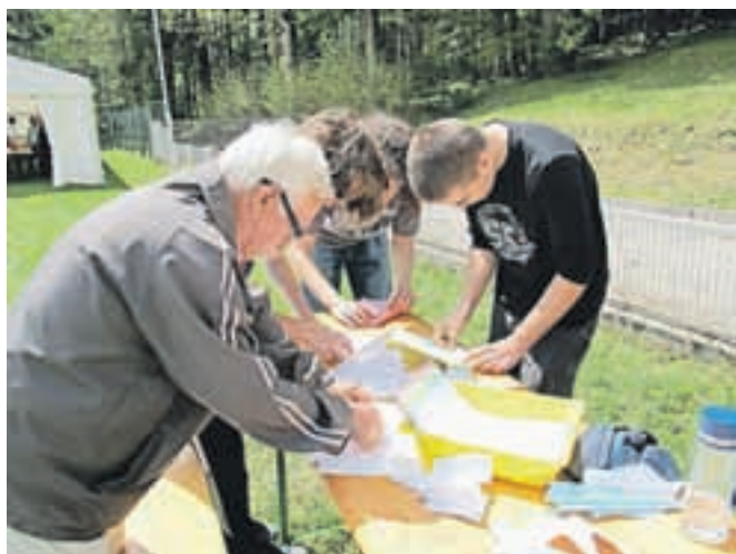
"Dedki" in "vnuki" so skupaj izdelovali tudi papirnate aviončke, rakete na šumeče tablete in vodne rakete.