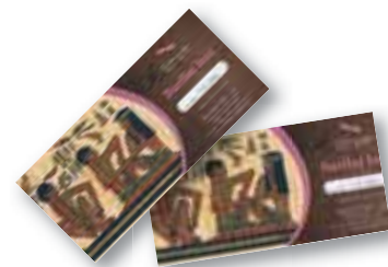
ali darilni bon za refleksoterapijo v vrednosti 20 EUR