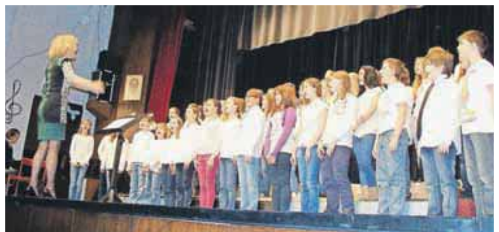
Mladinski pevski zbor OŠ Koroška Bela