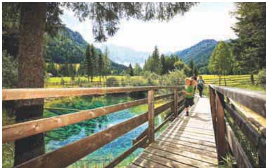
Poden; Foto: ©Tine STEINTHALER_Kärnten Werbung, Bodental_Meerauge

Vse informacije najdete na www.kaerntencard.at in na www.koroska.info