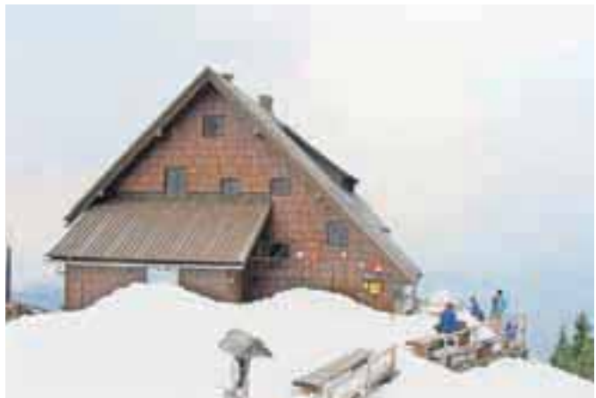
Koča na Golici prejšnjo nedeljo

Pri Planinskem društvu Jesenice so sredi priprav na novo poletno sezono na petih postojankah v Karavankah, na Vršiču, v Trenti in pod Jalovcem. Zaradi obilnega snega v visokogorju bodo nekatere odprli nekoliko kasneje. Kočo na Golici bodo maja odprli takoj, ko bodo vremenske razmere omogočale varen pristop na Golico. Ta postojanka je najbolj obiskana prav maja, ko se planinci množično podajo na ta priljubljeni vrh v Karavankah. Pred prvomajskimi prazniki bodo najprej odprli kočo pri izviru Soče v Trenti, Erjavčeva koča na Vršiču pa je aprila že odprta ob vikendih. J. R.