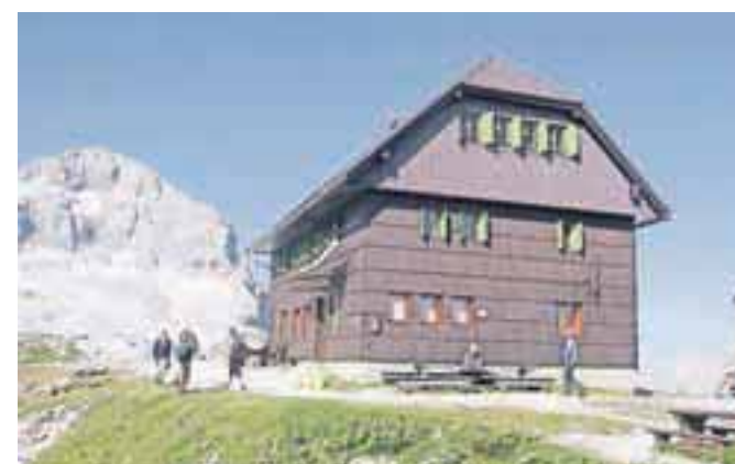
Staničev dom pod Triglavom

manj onesnažujejo okolje, predvsem na obeh visokogorskih postojankah, ki stojita na občutljivem gorskem območju. V prihodnje za še več varovanja okolja društvo čaka velik delovni in finančni zalogaj z gradnjo čistilnih naprav na vseh treh postojankah. Med novimi nalogami so si zastavili povečanje članstva. Markacisti bodo naprej skrbeli za vzdrževanje in obnovo 120 kilometrov poti. Program članov odseka za varstvo narave za leto obsega fotografski večer, botanični izlet ter druge aktivnosti, s katerimi ozaveščajo javnost o pomenu ustreznega odnosa do narave.