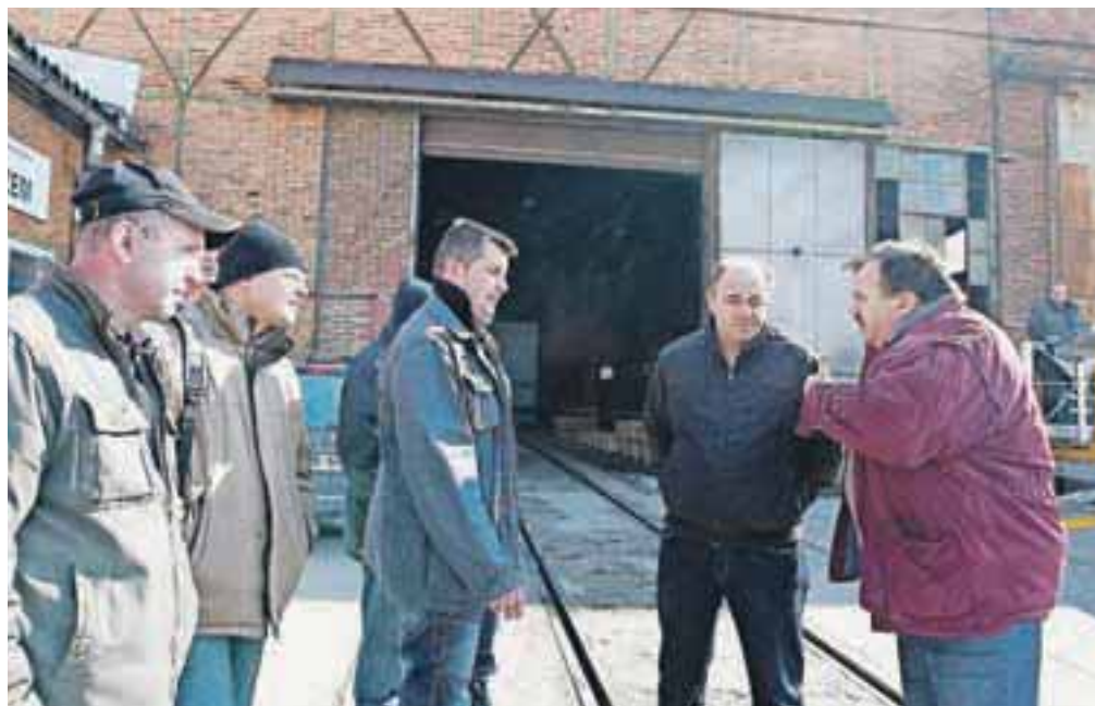
Zaposleni v Pilastru bodo v ponedeljek dobili delovne knjižice in se prijavi na Zavod za zaposlovanje. Kje lahko dandanes dobijo službo?

Stečajna upraviteljica niti še nima natančnih podatkov o premoženju podjetja, kljub temu pa je pojasnila, da vsi stroji niso zastavljeni, zato se bo lahko oblikovala stečajna masa, kolikšna, je za zdaj prehitro ugibati. Zato pa je jasno, da se bo zaposlenim v teh dneh iztekel 15-dnevni odpovedni rok, zato se bo v ponedeljek začel postopek vročitve delovnih knjižic.