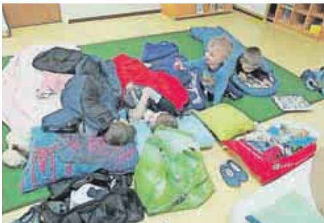
Andersenčki iz 1.c razreda so po pravljicnem večeru v šoli tudi prespali.

preganjati piščeta. Po skupinskih igrah smo se razdelili v manjše skupine. Uro in pol smo nato preživeli na delavnicah. V prvi delavnici sta združili moči psička Daja in Pavla. Ob prebiranju strašnih pravljic se je ježila koža, z odprtimi usti in velikimi očmi so učenci strmeli in podoživljali usodo junakov. Na koncu je le zmagalo dobro in jih z olajšanjem poneslo do druge delavnice. Veselo je bilo v mali telovadnici. Peli in plesali so banse. Uživali so ob igri velikanki. Uspešen met kocke in premik figure na rožico drobne Palčice je igralcu namenil en skok v bazen z gobami. Tretjo delavnico je v knjižnici vodila knjižničarka. Mali bralci so iskali izgubljene povedi iz pravljic in sestavljali sestavljanke naslovnih znanih