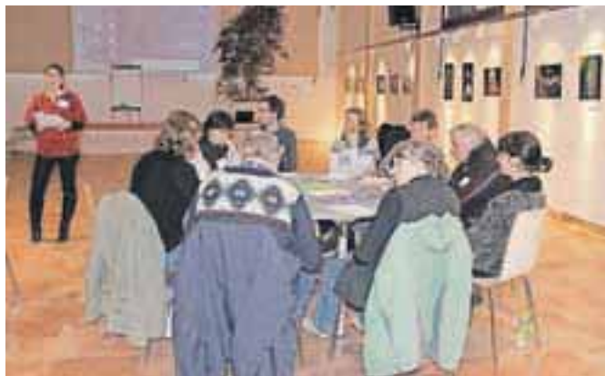
Utrinek s tretje delavnica v Kolpernu

Alianta kot zunanji sodelavec povezali s posameznimi udeleženci in opravili ogled Stare rudne poti ter sestanek za programsko obogatitev meseca narcis. Poleg tega bodo pripravili pregled