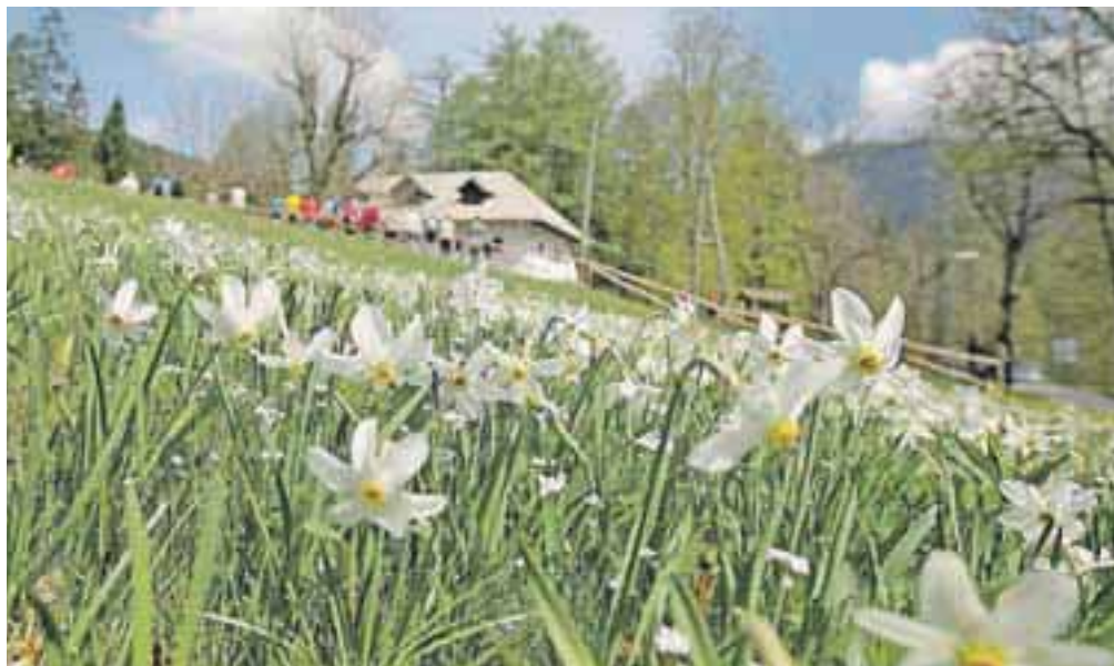
Pristava je zadnja leta tradicionalno prizorišče prvomajskih srečanj Jeseničank in Jeseničanov. Lani so prvega maja že cvetele narcise.

Po tradiciji se Jeseničanke in Jeseničani za prvi maj zberejo na prvomajskem srečanju, ki zadnja leta poteka pri Domu Pristava nad Javorniškimi Rovtom. Srečanje bo tudi letos, in sicer v sredo, 1. maja, začelo se bo ob 11. uri. Nastopil bo Pihalni orkester Jesenice-Kranjska Gora, slavnostni nagovor naj bi imel župan občine Jesenice, poskrbljeno bo za hrano in pijačo in zabavo. Organizator srečanja je letos Zveza društev prijateljev mladine Jesenice, ki je najemnica Doma Pristava in se tretje leto trudi oživiti ta lep del narave nad Jesenicami. Pri organizaciji sodelujeta tudi Občina Jeseni-