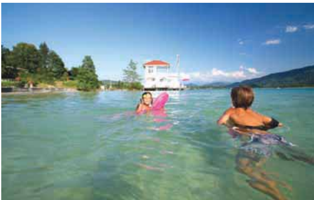
Vrbsko jezero