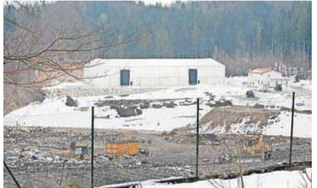
Letos naj bi začela obratovati tudi nova sortirnica na deponiji Mala Mežakla, ki jo gradi koncesionar Ekogor. Z gradnjo sortirnice zamujajo, saj bi ta po prvotnih načrtih morala začeti delovati že oktobra lani. Obdelavo mešanih komunalnih odpadkov zato zdaj izvajajo na premični sortirni napravi.

Med pomembnejšimi aktivnostmi družbe Jeko-In v letošnjem letu bodo med drugim uvedba individualnega odvoza embalaže "od vrat do