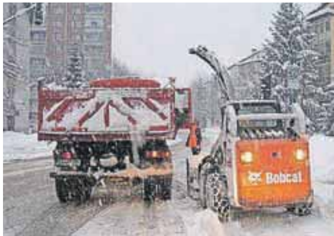
Zimski službi v letošnji zimi ni zmanjkalo dela. Opravili so prek deset tisoč strojnih in prek dvanajst tisoč delovnih ur, delavci so bili na terenu podnevi in ponoči.