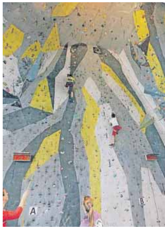
Zelo atraktivna zvrst hitrostnega plezanja je bila tokratna preizkušnja za 203 prijavljene tekmovalce iz 21 klubov v petih starostnih kategorijah.

ŠPO Jesenice ima sicer organizirane vadbe za vse starostne skupine – od najmlajših do veteranov, za rekreativce in tudi tiste, ki se želijo preizkusiti na tekmovanjih. Organizirajo tudi tečaje za pripravnike športnega plezanja, kjer se vsi lahko naučijo osnov varnega plezanja. Tekmovalci ŠPO Jesenice se redno udeležujejo državnih prvenstev, tekmujejo pa tudi v ligi IRCC (medregijski ligi, v kateri sodelujejo Avstrija, Italija, Hrvaška in Slovenija). Poleg najmanj ene tekme v okviru Zahodne lige organizirajo tudi tradicionalno novoletno-božično tekmo, ki je edina tekma, kjer tekmujejo v kombinaciji hitrostnega plezanja in težavnosti. Treningi potekajo na umetni plezalni steni v telo-