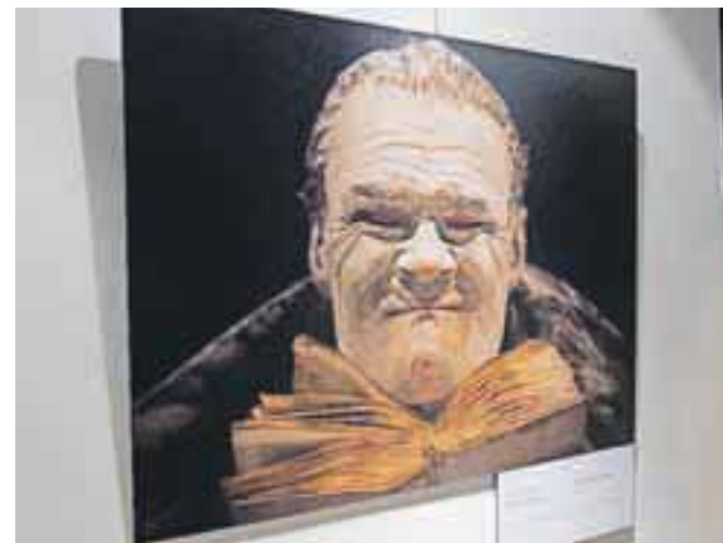
Ena od razstavljenih fotografij na temo Kultura