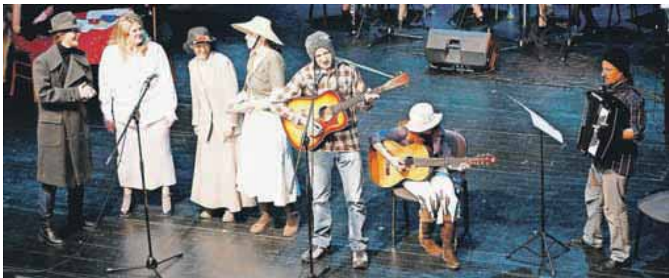
Profesorski zbor je presenetil s pesmijo Que sera, sera in požel gromek aplavz.