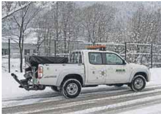
V veliko pomoč pri delu je novo sodobno dežurno intervencijsko vozilo s posipalčkom, ki lahko hitro ukrepa na najbolj kritičnih odsekih cest.