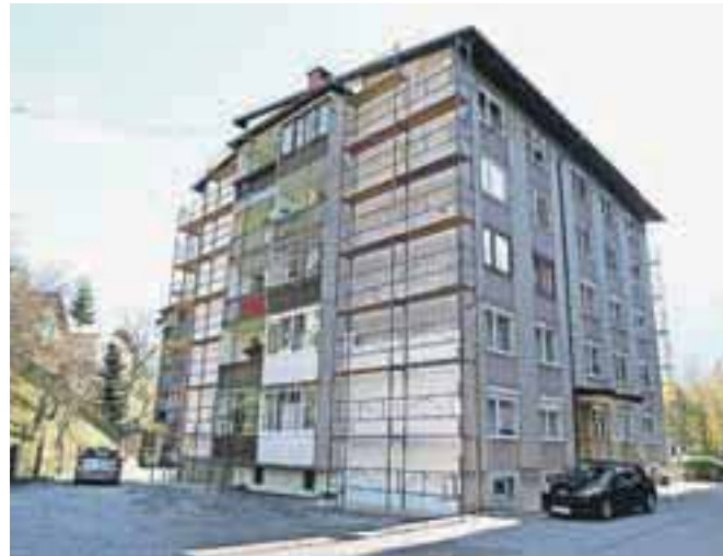
Vrsta večstanovanjskih objektov na Jesenicah je v zadnjem času dobila novo fasado z boljšo toplotno izolacijo.

Eden najbolj zanimivih in učinkovitih ukrepov, ki jih izvaja Občina Jesenice v zadnjih letih, je zagotovo spodbujanje energetske sanacije objektov. V zadnjih desetih letih je tako Občina namenila že okrog milijon evrov proračunskega denarja za investicije v učinkovitejšo rabo energije, in to v obliki nepovratnih sredstev občanom. Letos je na voljo 165 tisoč evrov denarja iz občinskega proračuna, kar je nekaj manj kot lani, ko so za to namenili 180 tisoč evrov. Razpis se je pravkar zaključil, občani, ki so se prijavili, pa lahko dobijo nepovratna sredstva za toplotno izolacijo podstrešja oziroma strehe, toplotno izolacijo in obnovo fasade, zamenjavo