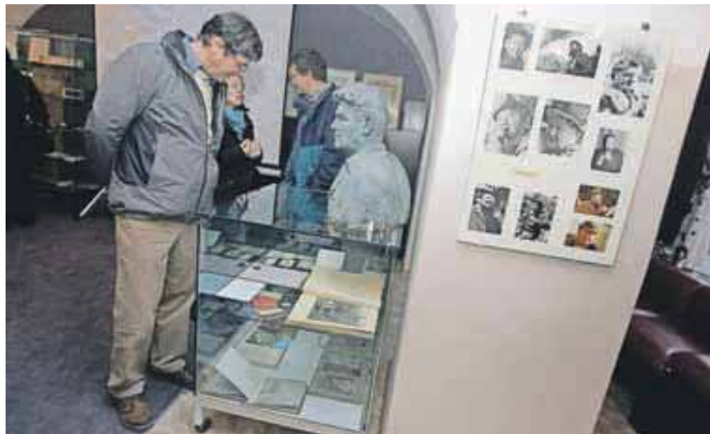
Z dokumentarne razstave o Jožu Čopu v Tržiču