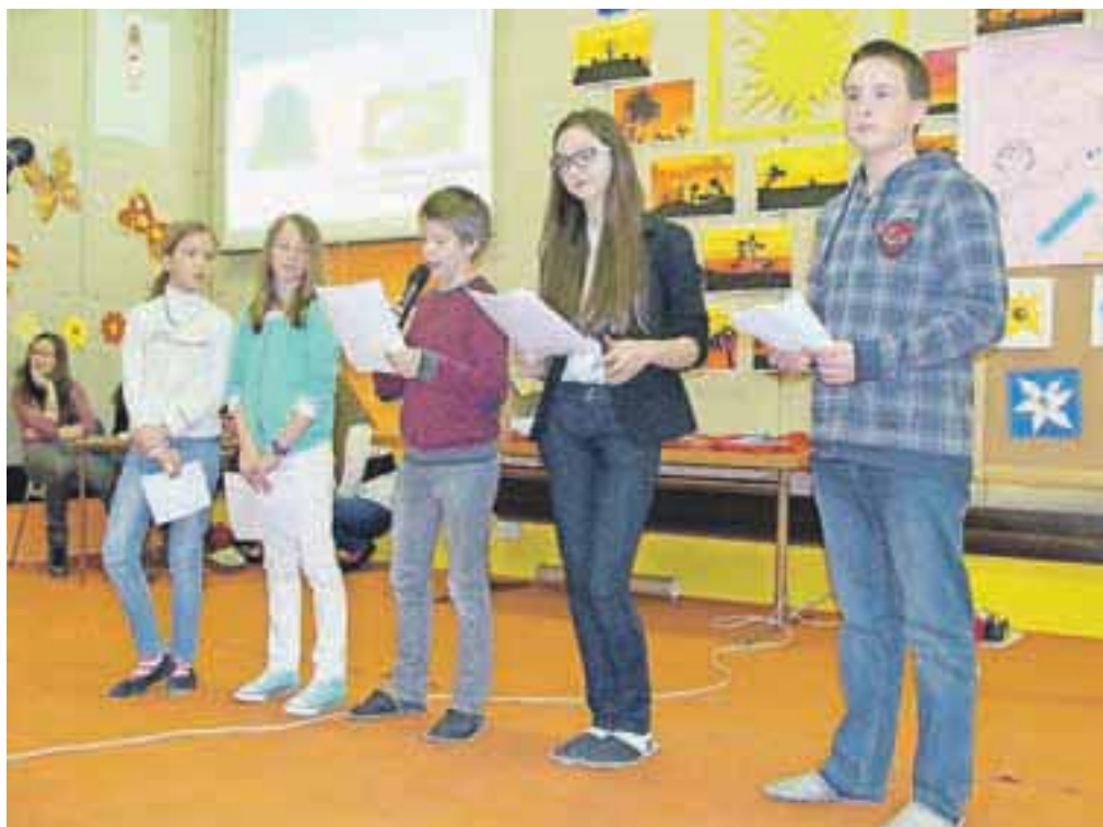
Učenci Osnovne šole Toneta Čufarja Jesenice na otroškem parlamentu