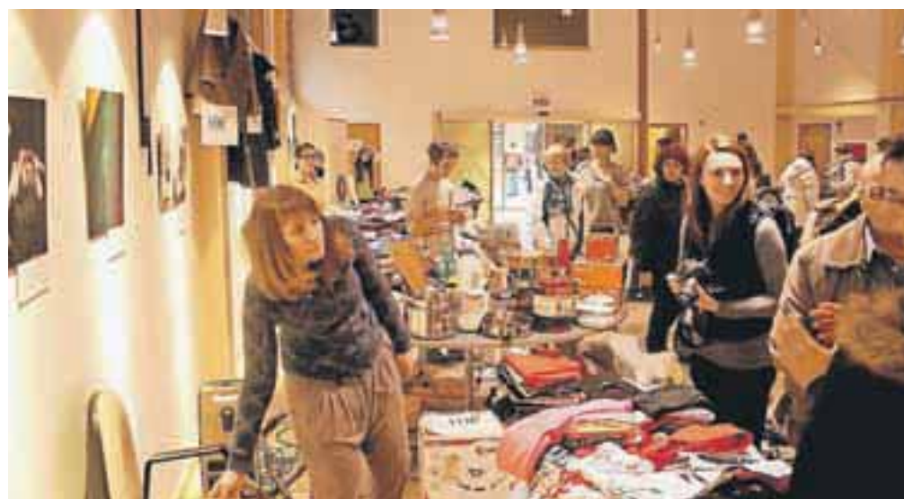
Mladi v občini Jesenice so se letos prvič vključili v prireditve ob Dnevu za spremembe, sam obisk na prireditvi pa jih je presenetil, prav tako tudi končni izkupiček.