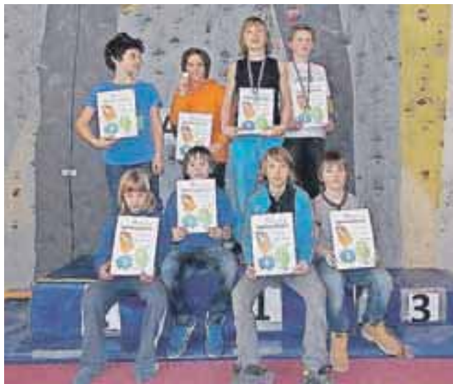
Sodelovali so tudi mladi plezalci iz Športno-plezalnega odseka (ŠPO) Jesenice in kar devet jih je poseglo po medaljah.

V telovadnici ob Osnovni šoli Poldeta Stražišarja je potekala 2. tekma Zahodne lige 2013 v športnem plezanju. Zahodna Liga je sklop tekem v športnem plezanju, ki mladim plezalcem omogoča, da svoje znanje in pripravljenost merijo z vrstniki z območja zahodnega dela Slovenije. Tekmuje se v treh zvrsteh športnega plezanja: balvansko plezanje, težavnostno plezanje ter hitrostno plezanje. In ravno zelo atraktivna zvrst hitrostnega plezanja je bila tokratna preizkušnja za 203 prijavljene tekmovalce iz 21 klubov v petih starostnih kategorijah. Sodelovali so tudi mladi plezalci iz Športno-plezalnega odseka (ŠPO) Jesenice in kar devet jih je poseglo po medaljah.