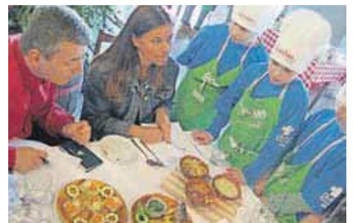
Šefla je predstavila postrv Valentina Vodnika, tris: plazki, grenadirmarš in kolerabce ter kanapeje z ribjim namazom.