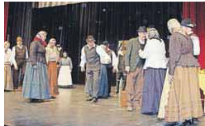
Folklorna skupina Julijana s Hrušice

Območno srečanje otroških in odraslih folklornih skupin