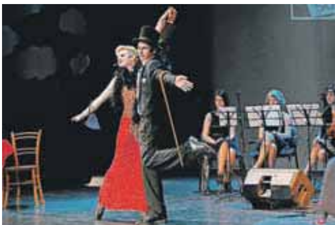
Povezovalca programa sta bila Neža Lunar in Miha Štilec.