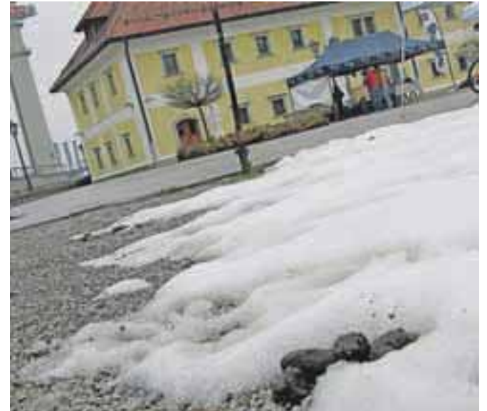
Stara Sava, ki je dobila priznanje kot eno najlepših mestnih jeder v Sloveniji, je žal "okrašena" tudi s pasjimi kakci.

Občina je pred letom dobila prometno študijo in Boštjan Omerzel pravi, da bi na tej osnovi morali čim prej izdelati tudi načrt njenega uresničevanja. Jesenice nimajo površin za pešce in kolesarje, ki bi povečale varnost in spodbujale zdrav odnos do mesta in okolja, malo je tudi območij za pešce in območij umirjenega prometa (kjer bi imeli prednost pešci, omogočena bi bila igra otrok na teh površinah, najvišja hitrost prometa pa bi bila omejena na 10 km/h). Neustrezna je prometna ureditev v okolici šol, javni mestni prevoz ne zaživi, z odprtjem nove tržnice se je pokazala tudi neustreznost prometne ureditve v njeni okolici, saj so zaparkirane površine za pešce. »S spreminjanem navad in s širšim pogledom na to, kaj na Jesenicah pravzaprav želimo, bi se bolj jasno pokazale potrebe in rešitve,« meni Boštjan Omerzel.