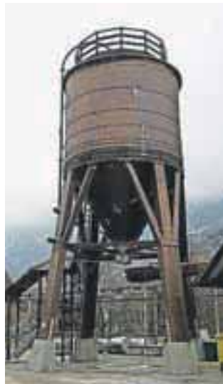
Silos posipnih materialov na Prešernovi – Jeko-In je eno redkih komunalnih podjetij s takšnim silosom.

Med zanimivostmi je Blaž Knific omenil tudi, da so pločnike posipali večinoma s soljo, ne s peskom. Glavni razlog je ta, da se s tem obvaruje meteorna kanalizacija pred nanosom peska, hkrati pa se zmanjšajo stroški za pometanje pločnikov in cestišč ter čiščenje zelenic po koncu zimske službe. Hkrati pa so s tem prislunili željam mamc z vozički in invalidov, ki jim kamenčki peska uničujejo kolesca pri vozičkih.