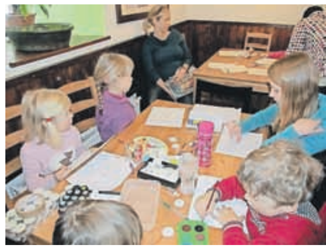
Delavnic (sofinancirala jih je Občina Jesenice v sklopu projekta Slow Tourism) se je udeležilo okrog štirideset otrok in staršev.

nost je tudi ta, da živita v Domu Pristava in tako "dihata" z domom. S prihodki, ki jih ima zveza društev od Doma Pristava, še ne ustvarjajo nobenega dobička, pa tudi sicer bodo ves morebitni dobiček vrnili nazaj v obnovo infrastrukture in namenili za letovanje otrok. Zveza društev ima najemno pogodbo za Dom Pristava z Občino Jesenice sklenjeno do konca letošnjega leta. V zvezi si želijo, da bi lahko ostali dolgoročni najemniki in Dom Pristava razvijali še naprej v dobro otrok in vseh obiskovalcev.