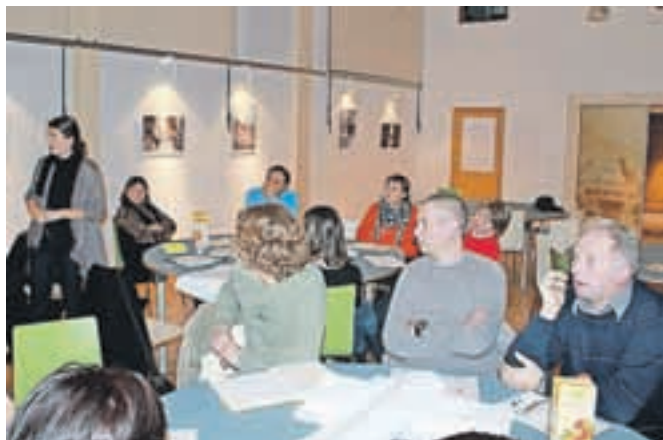
Utrinek z druge delavnice