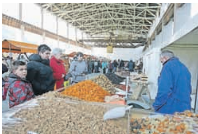
V soboto se je na stojnicah v pokriti nekdanji železarski hali predstavljalo 35 ponudnikov različnih izdelkov.