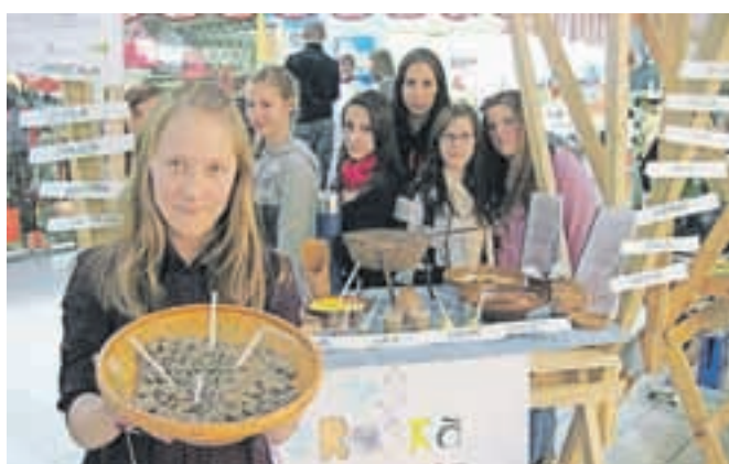
Stare jedi in izrazi zanje so navdušili tudi učence Osnovne šole Koroška Bela.