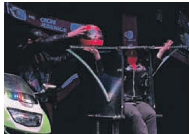
Čarovnik Magic Brane v akciji