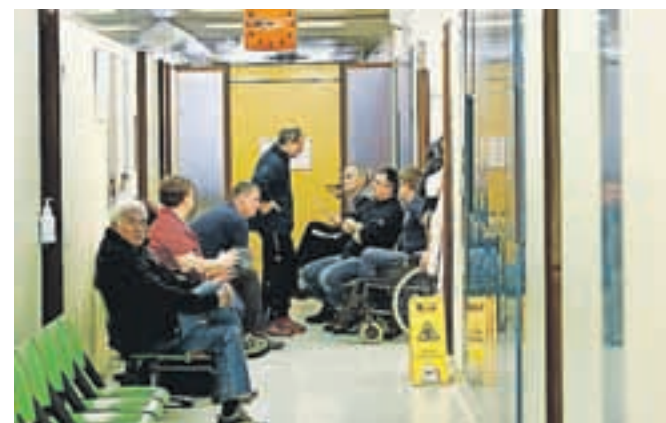
Največja gneča je bila zadnji počitniški konec tedna. Zaradi poškodb, ki so jih pacienti utrpeli konec tedna, pa so v bolnišnico prihajali še v ponedeljek ali torek.

Poškodovani v čakalnicah to različno razumejo. »Ko prednostno pogledamo nekoga, ki je grdo polomljen, ali pa otroka, se bo vedno našel nekdo, ki bo rekel »jaz sem bil tu pred njim«. Obstajajo tudi pacienti, ki vedno pridejo zvečer, ker vedo, da je dopoldne še hujša gneča, pa takšni, ki pridejo sredi noči zaradi malenkosti, ki bi jo lahko uredili naslednji dan v zdravstvenem domu, kot da nikoli ne bi ničesar slišali o kakršnikoli medicinski temi! Ljudje so na splošno bolj občutljivi, kot so bili pred leti, manj poučeni in pogosto absolutno prepričani, da jim vse pripada. Pogosto so tudi popolnoma nestrpni do čakalne dobe, ne glede na to, kaj vidijo okoli sebe. No, seveda so tudi takšni, ki se pri nas pojavijo teden dni po poškodbi, čeprav bi morali priti takoj.«