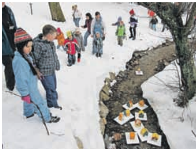
Gregorčke, ki so jih otroci izdelali sami, so nato spustili po bližnjem potoku.