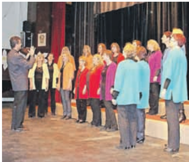
Učiteljski pevski zbor Mavrica

Prva letošnja prireditev v dvorani Kulturnega doma na Slovenskem Javorniku je bila namenjena zborovskemu petju. Pod naslovom Eno pe-