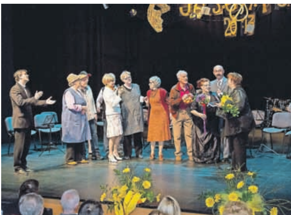
Igralci Gledališča Toneta Čufarja s humornim presenečenjem