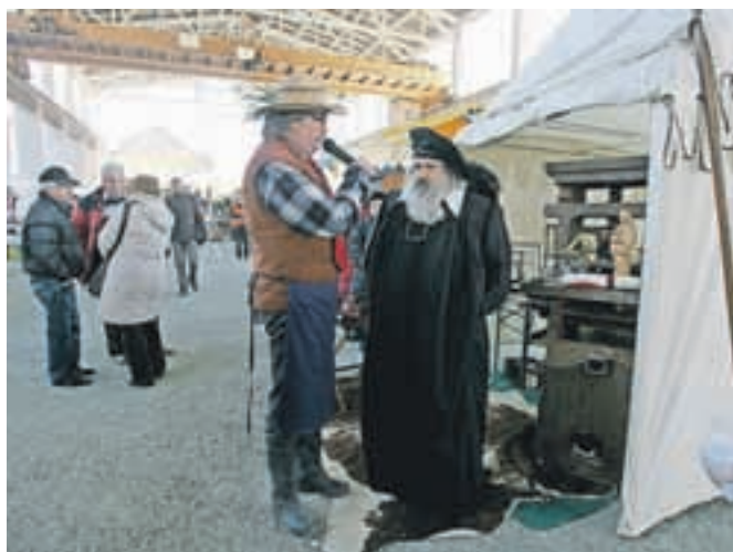
Pri Mojstru Janezu je bilo mogoče natisniti motiv starih Jesenic na ročno izdelan papir.