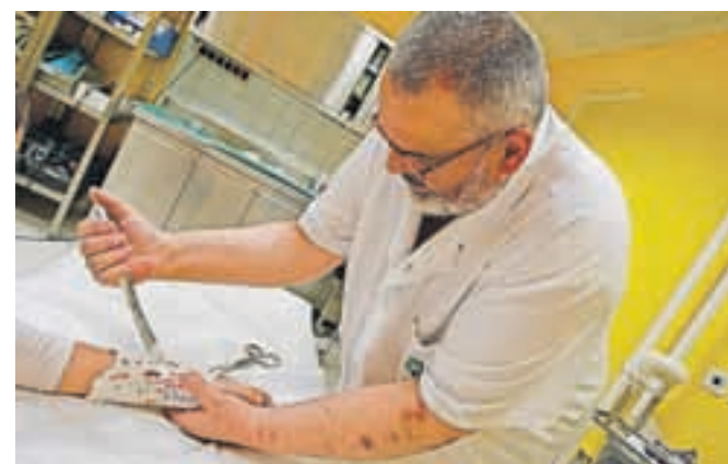
Postopek obravnave poškodovanih je enak, ne glede na to, kdaj pridejo, s tem da ponoči opravijo le nujne operacije, z drugimi počakajo do jutra.