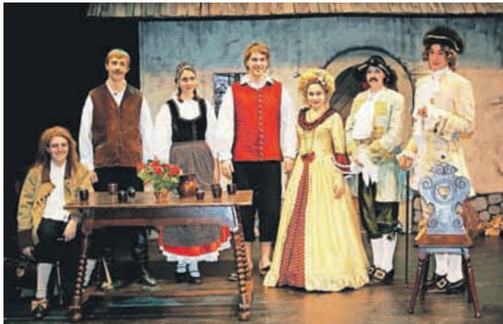
Mlada ekipa igralcev

Županova Micka je svoj odrski krst doživela leta 1789 v Ljubljani in je prva komedija v slovenskem jeziku.