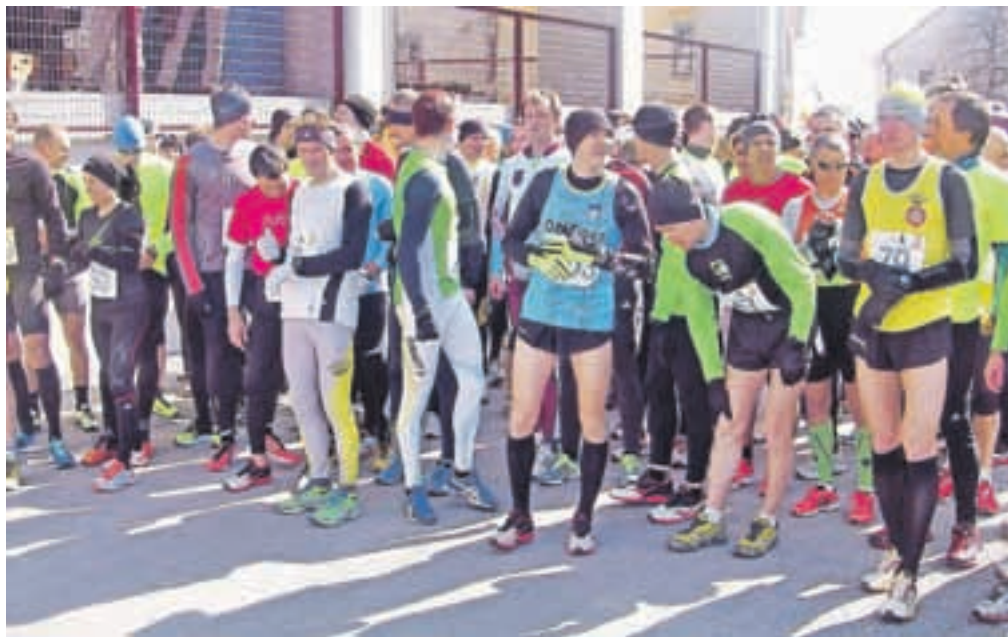
Tekači pred startom