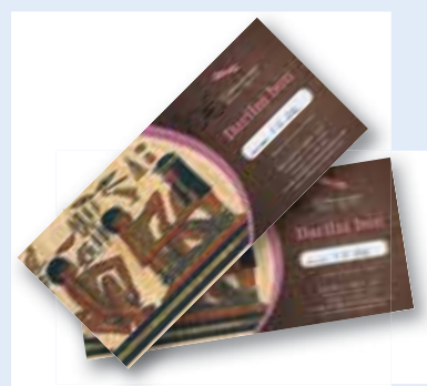
ali darilni bon za refleksoterapijo v vrednosti 20 EUR