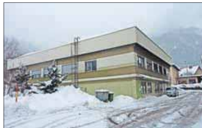
Poslovna stavba Območne obrtno podjetniške zbornice Jesenice je v lasti zbornice, ki del prihodkov ustvarja tudi z oddajo poslovnih prostorov v najem.