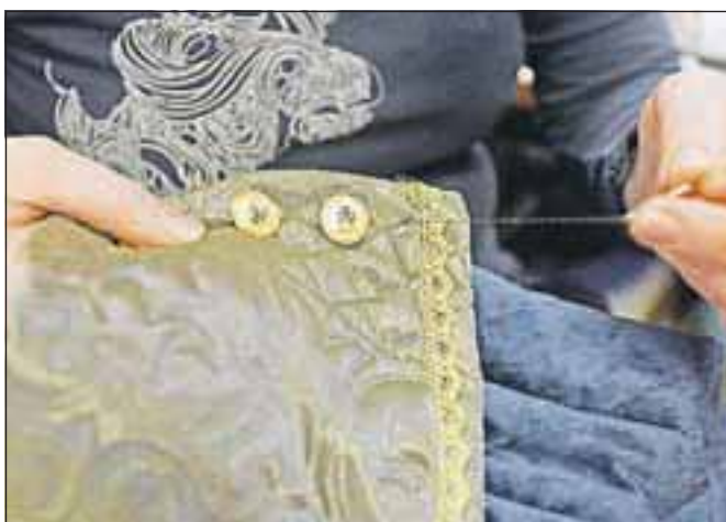
Veliko je tudi ročnega šivanja.