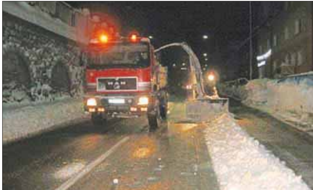
Delavci komunale so prek noči očistili večji del zapadlega snega.

Zaradi obilnega sneženja, po podatkih komunale je prejšnji teden samo v torek med 7. in 14. uro na območju Jesenic padlo več kot 50, v Planini pod Golico pa več kot 90 centimetrov snega, je prišlo do prometnega kolapsa. Na več mestih so tako v prometu obtičali tovornjaki, po stranskih ulicah so se Jeseničani prebijali po cellem snegu, kjer so številni obtičali in se na svoj način spopadli z obilico snega. Slabe razmere na cestah pa so povzročile nemalo hude krvi med občani in občankami Jesenic, ki se še popoldne na nekaterih območjih Jesenic niso mogli prebiti do svojih domov. Kot je pojasnil vodja zimske službe jeseniškega komunalnega podjetja Jeko-in Blaž Knific, so bile na terenu vse razpoložljive sile, ki pa obilne količine snega preprosto niso zmogle: »Delali smo celo noč in odvažali sneg, ki je zapadel dan prej, zjutraj pa zaradi obilnega sneženja ni šlo več. Več kot delati se ne da. Dve ekipi sta frezali in dve odvažali. V dveh dneh, zase lahko povem, sem spal slabi dve uri. Program imamo dober, številni koooperanti pa so opravili neverjetno delo, saj so bile razmere res kaotične.« Delo zimske službe v dneh sneženja smo si ogledali tudi sami, komunalni delavci pa so nas seznanili s težavami, s katerimi se spopadajo. Največjo