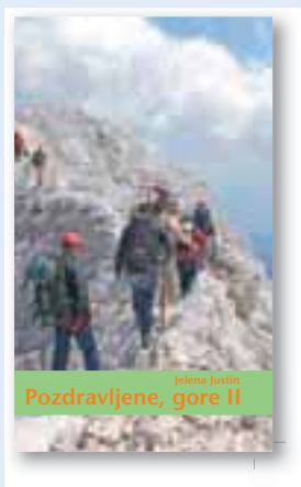
ali knjiga Pozdravljene gore II