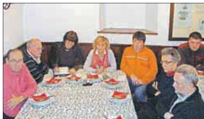
Decembrsko srečanje sveta krajevne skupnosti s predstavniki društev in organizacij

dotrajane prostore. Največ dela in stroškov je z vzdrževanjem, zelo drago je ogrevanje.