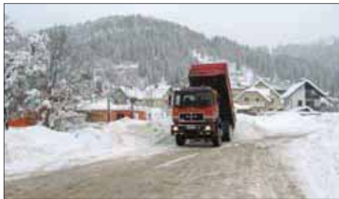
Zaradi obilne količine so bili delavci Jeko-ina prisiljeni sneg odvažati na deponije, eno takšnih so naredili pri balinišču Baza.