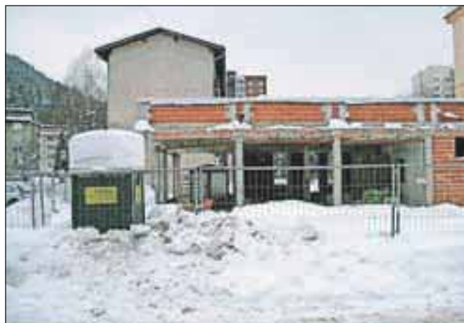
Zagotovo se bo še letos selila Lekarna Plavž – v nov objekt na mestu Pikove dame.