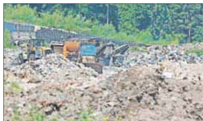
Količina odloženih odpadkov na deponiji Mala Mežakla se iz leto v leto zmanjšuje.

be ravnanja z odpadki v občinah Postojna, Pivka, Kamnik in Komenda. Marko Markelj je opozoril, da se vse deponije v Sloveniji trudijo zagotoviti potrebno količino odpadkov in s tem rentabilno poslovanje. Nekatere deponije ponujajo tudi bistveno nižjo ceno za dovoz odpadkov, celo od 40 do 60 evrov za tona. Vendar nekatere od teh deponij nimajo okoljevarstvenega dovoljenja, zato tudi ne zaračunavajo finančnega jamstva.