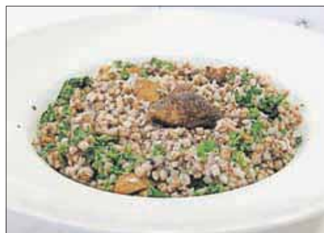
Ajdova kaša z jurčki