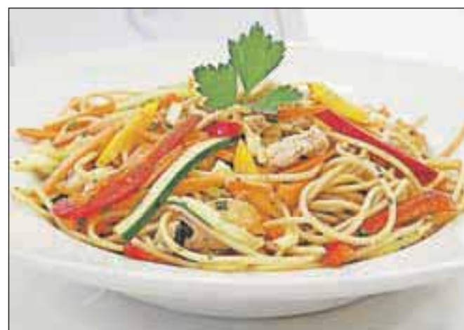
Polnozrnatni špageti z rezanci sveže zelenjave in piščančjim filejem