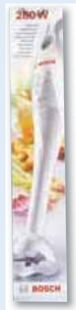
ali palični mešalnik BOSCH

Na Gorenjski glas se želim naročiti najmanj za eno leto (cena izvoda je 1,50 EUR). Brezplačno ga bom prejel 3 mesece, prejel bom od 10- do 25-odstotni popust, enkrat mesečno brezplačno objavo malega oglasa, veliko zanimivega branja in darilo.