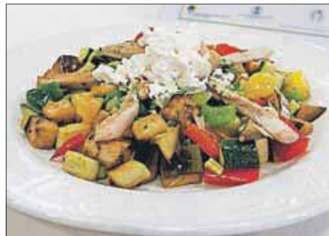
Krožnik Ejga s popečeno zelenjavo s puranom in feta sirom