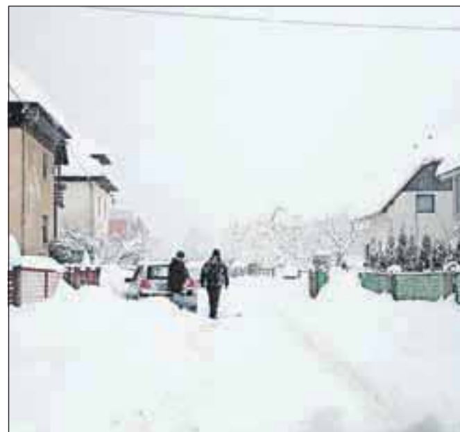
Deli mesta, denimo Podmežakla, so bili nekaj časa dostopni le peš.

težavo jeseniškim komunalnim delavcem je poleg obilice snega predstavljalo pomanjkanje prostora, kamor bi sneg še lahko odvažali in odmetavali. Tako so uredili dve deponiji snega pri balinišču Baza in čistilni napravi na Javorniku, kamor so s tovornjaki odvažali sneg, ki so ga s pločnikov in javnih površin odmetavali s frezami. »Tako ko se je sneženje umirilo, smo očistili glavne ceste in avtobusne postaje, nato so na vrsto prišli pločniki, najprej na šolskih poteh. Naš načrt pluzenja in čiščenja je dober, sneg nas ni presenetil, preprosto ga je bilo preveč, da bi ga lahko očistili. Želimo si, da bi občani to razumeli.«