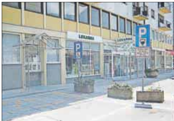
Gorenjske lekarne že dalj časa razmišljajo o selitvi bližje zdravstvenemu domu ali bolnišnici.