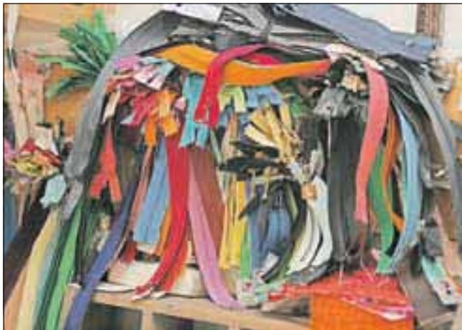
Kupi zadrge ...