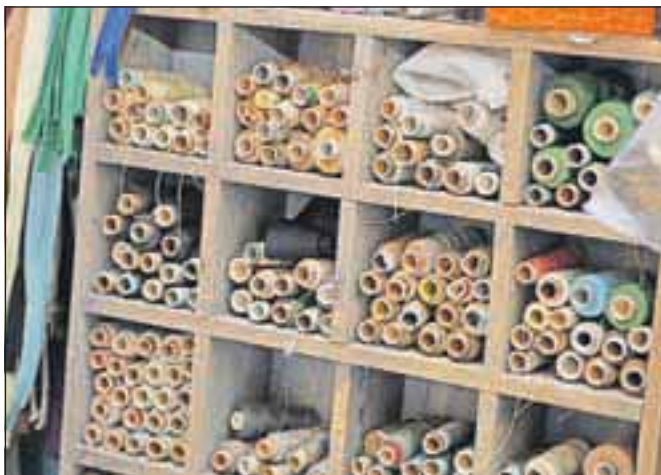
... in sukanca različnih barv v šivalnici