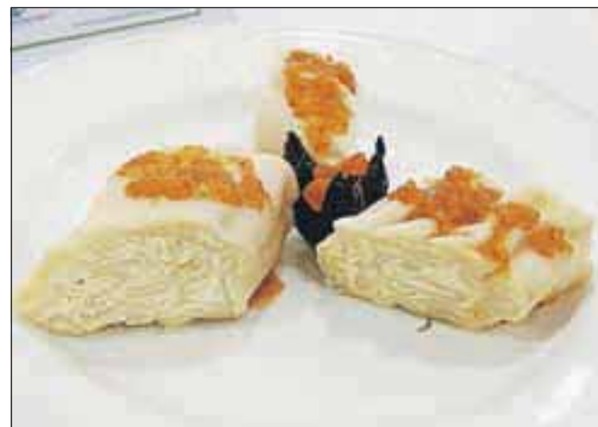
Domači sirovi štruklji