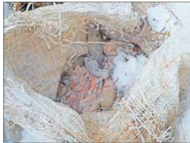
V vrečki so bili kože, drobovina in okostje goveda in prašiča.