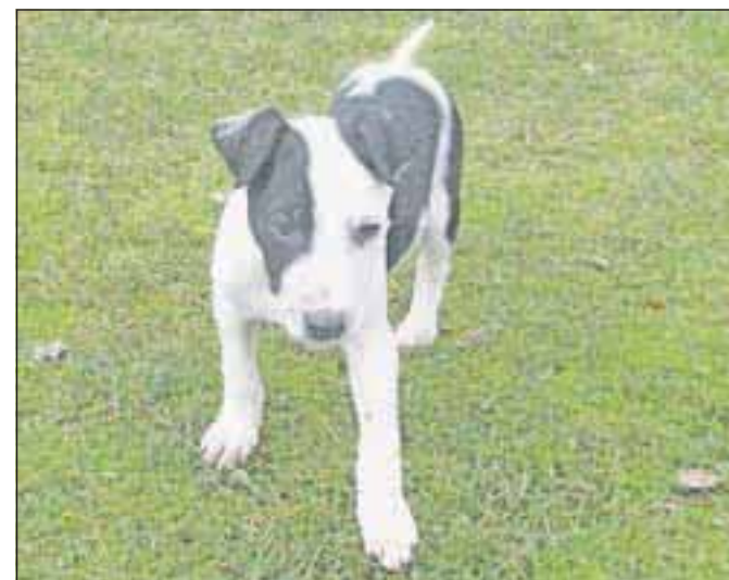
Nov dom išče samček, star tri mesece. Tel.: 041/666-187