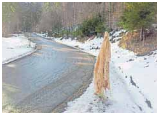
Živalska koža na obcestnem drogu ...