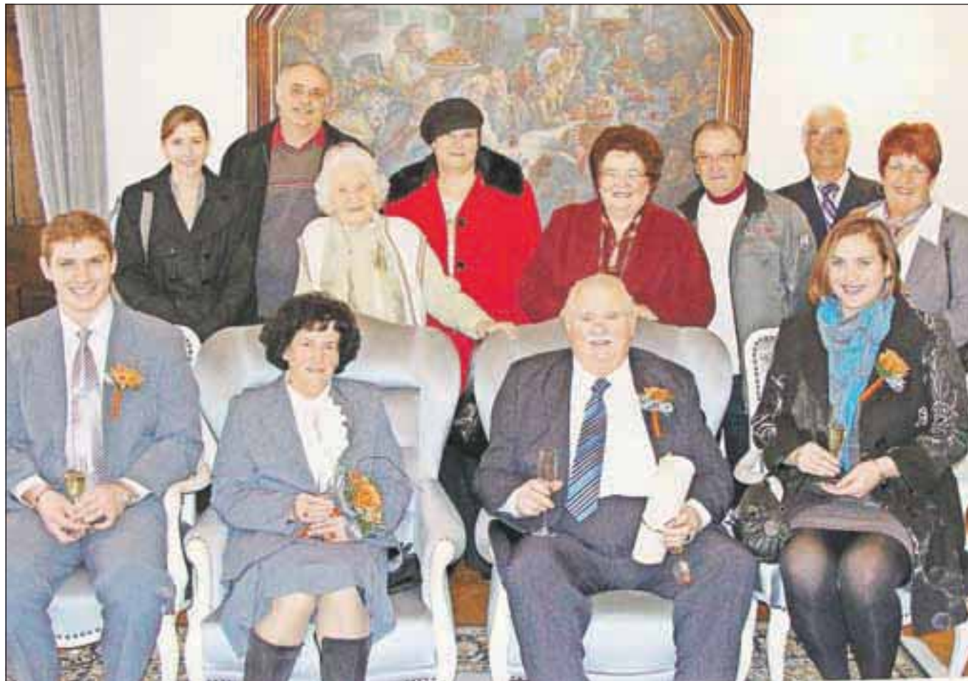
Zlatoporočnica v krogu domačih in prijateljev