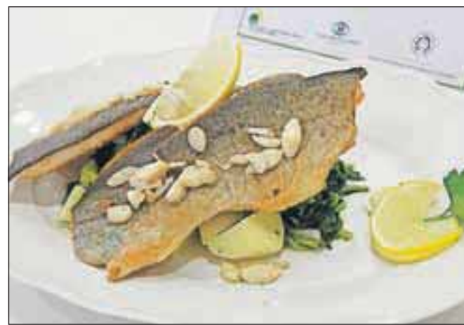
File rdeče postevi s praženimi mandlji in blitvo s krompirjem

renjskem bolj slab, saj je znak za zdaj prejela samo restavracija Ejga. Po besedah lastnice restavracije Alenke Dovžan se sama kot nekdanja športnica močno zaveda pomena zdrave prehrane. V njeni restavraciji se pogosto prehranjujejo tudi športniki, od hokejistov do smučarjev, ki morajo paziti na sestavo obrokov. "V lokalu še vedno opažamo, da se mladina prehranjuje nezdravo, naročajo zlasti ocvrte jedi, zato bi jih radi spodbudili, da bi kdaj izbrali tudi kaj bolj zdravega. Mi-slim, da mora biti ena od nalog gostincev tudi spodbujanje zdravih prehranjevalnih navad," je povedala Alenka, ki obenem ugotavlja, da so se prehranjevalne navade gostov v zadnjih letih spremenile. "Največ jih običajno restavracijo za malico ali kosilo, hitro pojedjo in hitijo nazaj v službo. Večerni obisk restavracij, ko bi jedli počasi in v miru, pa se je zmanjšal," dodaja. A žal veliko ljudi še vedno meni, da je dobra restavracija tista, kjer na krožniku dobiš toliko hrane, da gleda prek roba krožnika, ugotavljajo tudi na Zavodu za zdravstveno varstvo Kranj. Takšno prepričanje bi radi spremenili tudi z akcijami, kot je Zdrava izbira. Alenka Dovžan iz Ejga pa obljublja, da bodo ponudbo zdravih jedi še širili, že spomladi bodo gostom poleg običajnih pic ponudili tudi polnozrnatne pice z zelenjavo.