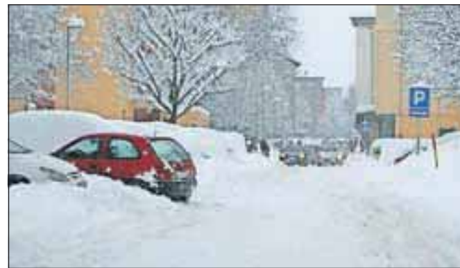
Zaradi obilnega sneženja je v torek po Jesenicah prihajalo do prometnih zastojev, obtičali so tovornjaki, nekatere ulice pa so bile neprevozne.

optika Berce fashion eyewear JESENICE - LESCE