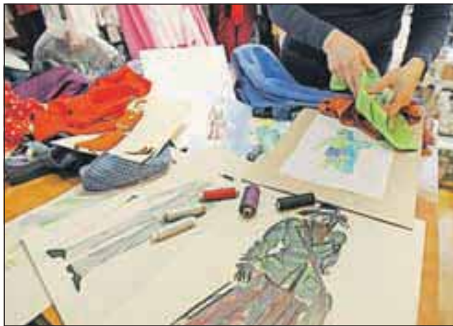
Začetek vsakega kostuma je običajno skica.