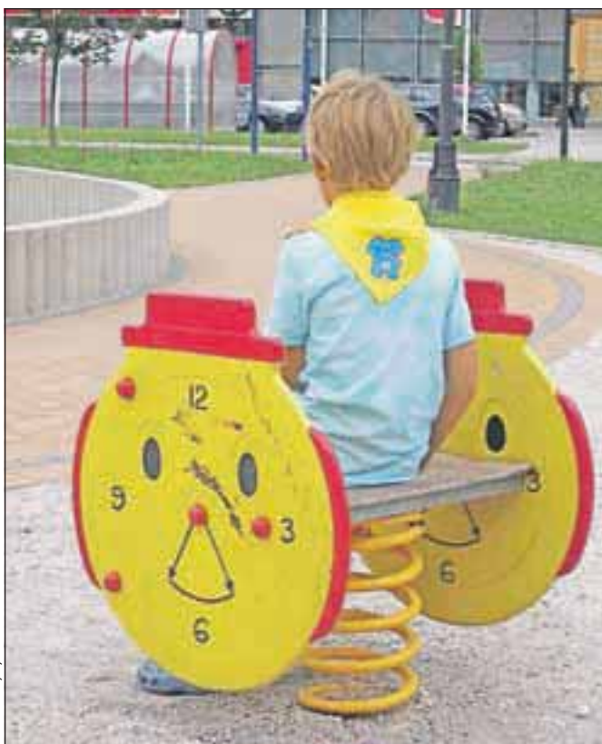
FOTOGRAFIJA JE SIMBOLIČNA