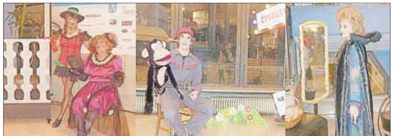
Aleksandrini kostumi so "oživeli" na decembrski noči gledališč.