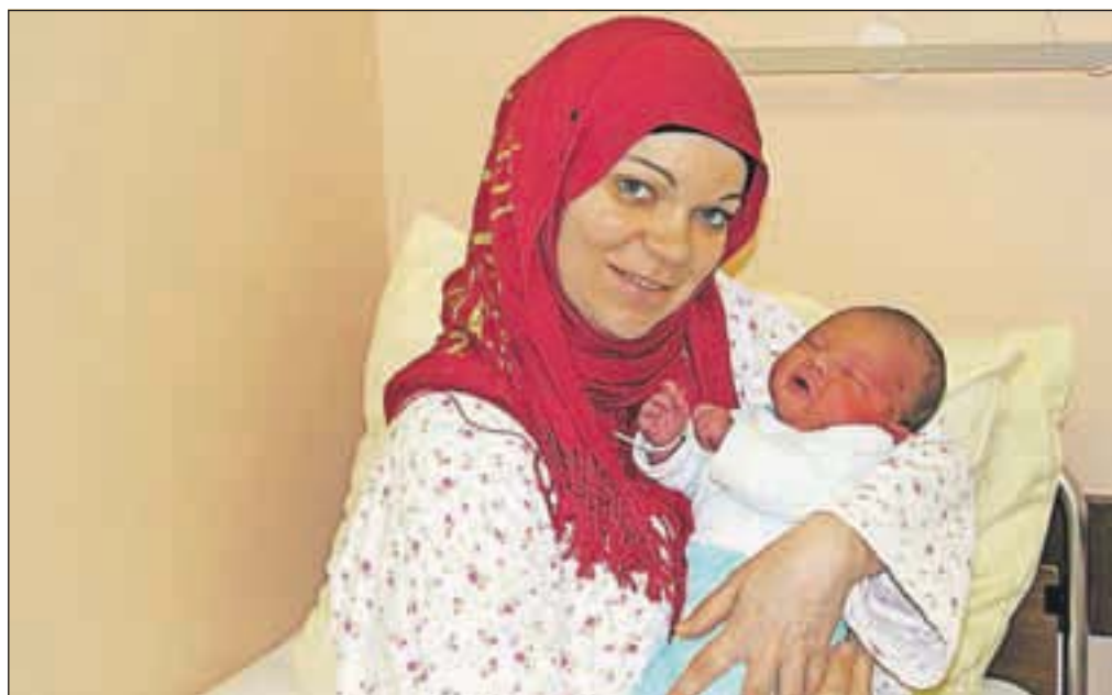
Tretji z datumom rojstva 1. januar pa je Naser Ismail, ki ga je rodila Jeseničanka Faila Pašić Bišić.