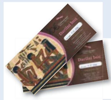
ali darilni bon za refleksoterapijo v vrednosti 20 EUR