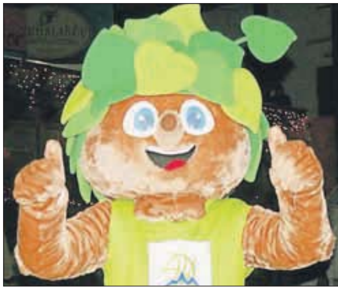
Lipko se je na Čufarjevem trgu družil z obiskovalci koncertov, pridružil pa se je tudi glasbenikom na odru.