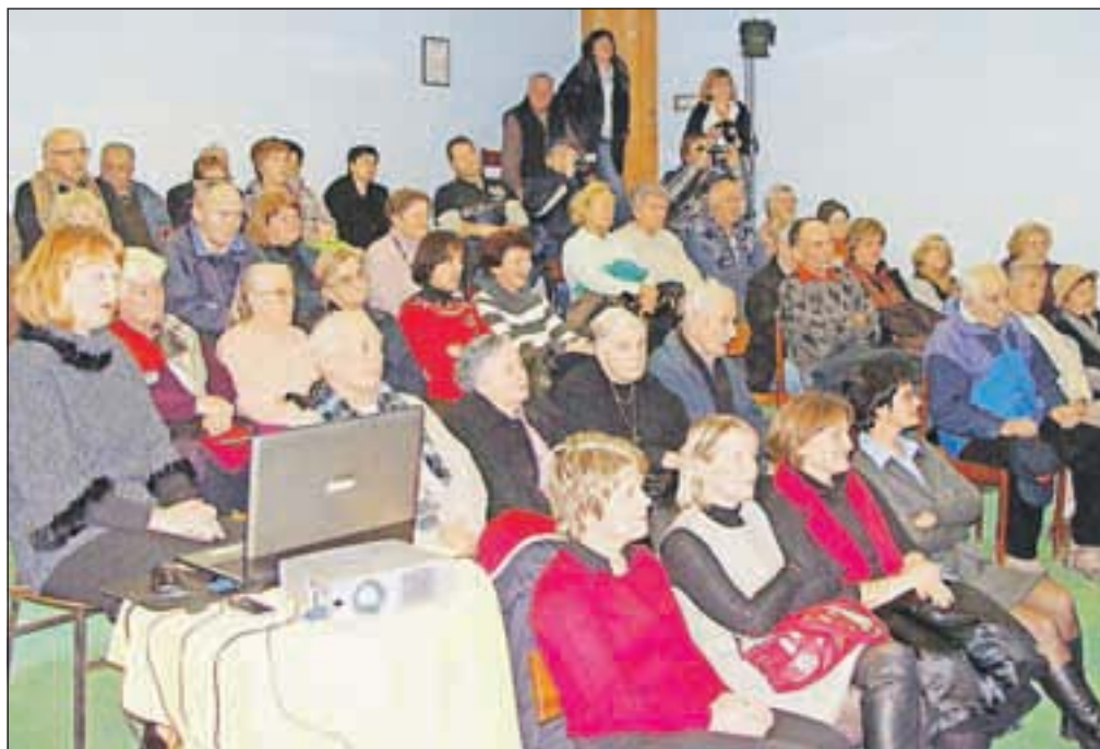
Knjižico z naslovom Kako so včasih na Slovenskem Javorniku živeli? so predstavili na decembrskem srečanju na Javorniku.