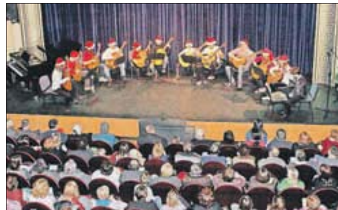
S koncerta na Jesenicah

Za prijetne glasbene dogodke je tik pred prazniki poskrbela Glasbena šola Jesenice. Pripravila je kar tri božično-novoletne koncerte, enega v Žirovnici, enega v Kranjski Gori, zadnjega pa kar na velikem odru Gledališča Toneta Čufarja na Jesenicah. Učenci pod vodstvom mentorjev so na vseh treh koncertih navdušili s svojim znanjem, z glasbo pa so pričarali lepo praznično vzdušje obiskovalcem, ki so napolnili dvorane na vseh treh dogodkih. J. P.