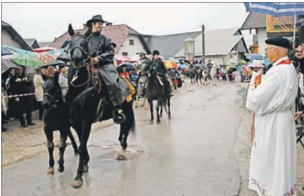
Srečanja in blagoslova konj se je kljub slabemu vremenu udeležilo 34 konj in konjenikov.

Ob prazniku svetega Štefana so se 26. decembra na trgu pred cerkvijo sv. Štefana na Blejski Dobravi kljub slabemu vremenu znova zbrali konjeniki na tradicionalnem blagoslovu konj, ki na Blejski Dobravi poteka že več kot 15 let. Blagoslov živine, posebej konj izhaja še iz prazgodovine, saj je sveti Štefan nadomestil eno izmed indoevropskih božanstev, ki so jim prazgodovinska ljudstva zaupala varstvo živine. Večstoletno tradicijo, ki je po drugi svetovni vojni zamrla, so pred leti obnovili dobravski ljubitelji konj in tradicije, sprva v obliki neorganiziranih srečanj, zadnja leta pa v obliki organizirane prireditve. Slabo vreme ni odvrnilo ne obiskovalcev ne konjenikov, saj se je blagoslova udeležilo kar 34 konj in konjenikov s širšega območja zgornje