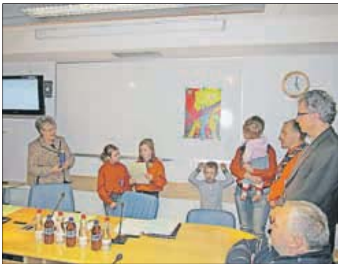
Skavtsko poslanico miru je prebrala ena najmlajših skavtinja.

Na decembrsko sejo občinskega sveta, ki je potekala tik pred božično-novoletnimi prazniki, so – tako kot že zadnjih nekaj let – jeseniški skavti prinesli luč miru in lepe želje za leto 2013. U. P.