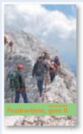
ali knjiga Pozdravljene gore II