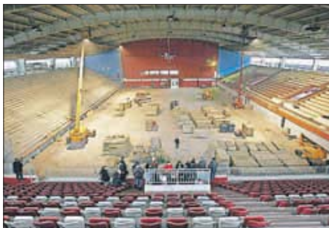
Delavci v hali Podmežakla hitijo z deli.

novimi garderobami. »Ker dvorano poleg tekmovalnih športov na ledu uporabljajo tudi številni rekreativci, se ni bati, da dvorana ne bi imela uporabnikov. Že zdaj je bila odprta vsak dan od sedmih zjutraj do enajstih zvečer, tudi ob sobotah, nedeljah in praznikih,« je povedal Kra- mar. Kot je dodal, bo s tem dvorana v celoti prenovljena; zgrajena je bila leta 1954, leta 1966 so zgradili severno tri- buno, leta 1968 so postavili streho, torej je trajalo več kot šest desetletij, da so jo ven- darle dokončno uredili.