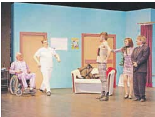
To imamo v družini je naslov 351. premiere jeseniških gledališčnikov. Tokrat so jo uprizorili prav na silvestrovo.