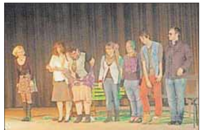
Gledališka predstava Facebook na komičen način prikazuje, na kakšen način mladi komunicirajo med sabo in kako lahko Facebook medgeneracijsko povezuje ljudi.

veliko ljudi. Gledališka predstava Facebook na komičen način prikazuje, kako mladi komunicirajo med sabo in kako lahko Facebook medgeneracijsko povezuje ljudi. V glavni vlogi sta bila lika babic, ki sta se želeli naučiti uporabljati Facebook in na ta način stopiti v korak s časom. Ustvarjalnost mladih je podprl tudi Mladinski center Jesenice-Zavod za šport Jesenice. Mladi gledališčniki bodo predstavo prikazali tudi v drugih mestih, prva ponovitev predstave bo v Dolu pri Ljubljani.