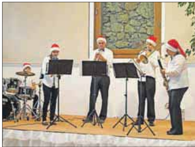
Za kulturni program na sprejemu so poskrbeli učenci Glasbene šole Jesenice z glasbenimi in baletnimi točkami.