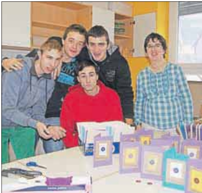
Učenci šole z voščilnicami En gumbek za srečo

Jesenice, Klub jeseniških študentov ter Visoko šolo za zdravstveno nego Jesenice. Izdelali pa so tudi glinene obeske v obliki copatkov za Eko hotel Park Bohinj. Z njimi bodo uslužbenci hotela obdarili goste, učence šole pa so v zameno obdarili z brezplačnimi vstopnicami za Vodni park Bohinj. Izdelke iz različnih materialov pa je bilo mogoče kupiti tudi na novoletni prireditvi šole.