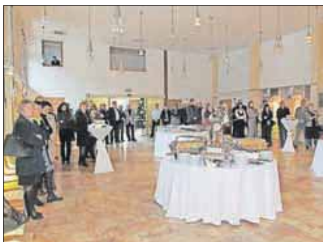
Tradicionalnega sprejema v Kolpernu se udeležujejo direktorji podjetij, zavodov in ustanov, vodje občinskih oddelkov, predstavniki medijskih hiš, skratka vsi, ki soustvarjajo razvoj Jesenic.