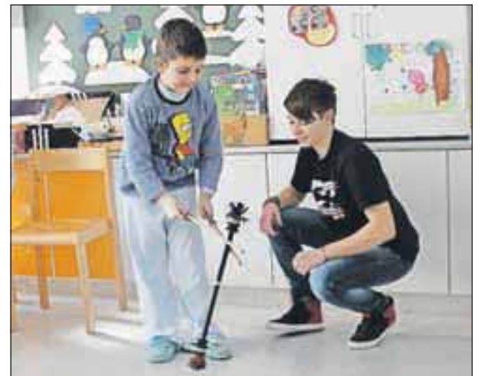
Gimnazijci ob svojih prostovoljnih obiskih v bolnišnici popestrijo tudi dneve malim bolnikom na pediatričnem oddelku.

kakšno svojo življenjsko zgodbo ali zakaj so danes tu. Delo se mi je zdelo zabavno in zanimivo in bi to z vese-