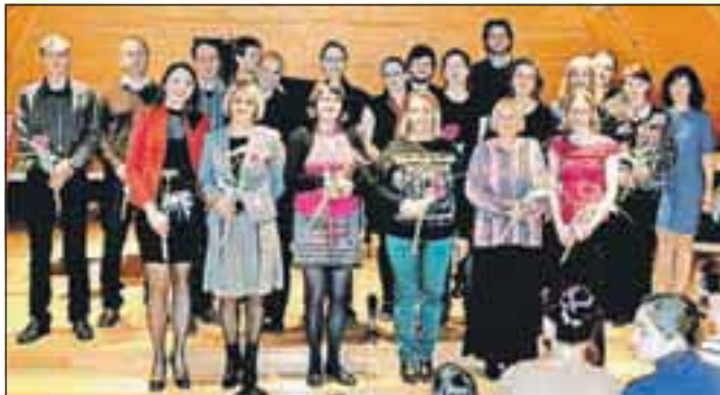
Skupinska fotografija nastopajočih učiteljev