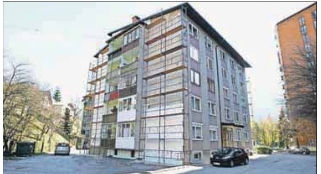
Za energetske sanacije objektov bo v letu 2013 vendarle na voljo več denarja, in sicer 165 tisoč evrov.

Občina Jesenice je dobila proračun za leto 2013. Ta pomemben dokument so sprejeli jeseniški občinski svetniki na seji prejšnji četrtek. Prihodki proračuna bodo znašali 24,6 milijona evrov, odhodki pa 29,4 milijona evrov. Razliko bodo pokrili z ostankom sredstev na računu (predvidoma v višini 4,5 milijona evrov) ter z zadolževanjem, ki pa bo manjše, kot so načrtovali ob pripravi proračuna. Občina Jesenice je namreč za drugo fazo obnove Športne dvorane Podmežakla prejela skoraj 3,5 milijona evrov, kar je več od prvotno načrtovanega. Zato se bo občina v letu 2013 zadolžila za milijon evrov namesto 2,2 milijona evrov, kot so načrtovali ob pripravi osnutka proračuna. Ob prvi obravnavi proračuna na novembrski seji občinskega sveta in še prej na odborih so občinski svetniki in člani odborov podali več pripomb in predlogov, do katerih so se pristojne občinske službe opredelile do druge obravnave. Nekaj so jih upoštevale, med drugim so sredstva za energetske sanacije objektov s pr-