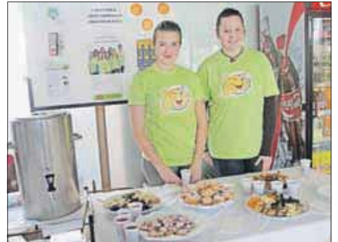
Prostovoljki Manca in Neža sta ob panoju delili napitke in pecivo mimoidečim ter se z njimi pogovarjali o prostovoljstvu.

»Na mednarodni dan prostovoljstva sva skupaj z Nežo opravljali prostovoljno delo v Splošni bolnišnici Jesenice. Bolnišnica Jesenice po dolgem času zopet podpira prostovoljno delo, zato sva se na poziv mentorice odpravili tja in delili piškote, suho sadje in čaj. V delu sem uživala, saj so bili ljudje prijazni, nekateri so se večkrat vrnili, nama povedali