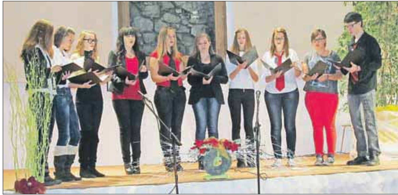
Gimnazijski pevski zbor dr. Janka Pribošiča z imenitno glasbeno točko