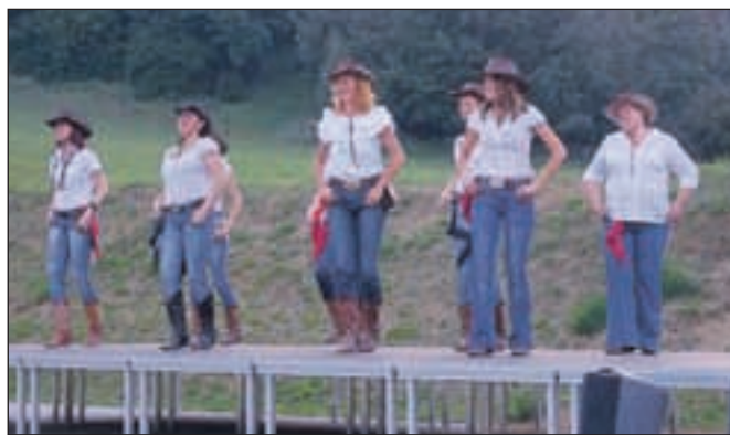
Plesna skupina Colorado je krajanje navdušila s poskočnimi kantri plesi in dokazala, da se lahko tudi ob zvokih Avsenikove Golice zazibamo v kantri stilu.

mo srečno in ponosno. Nato je prešel na infrastrukturne težave, natančneje na še nedokončano obvoznico mimo Lipc, katere drugi del naj bi se začel graditi že letos. »Ne glede na vse težave,« je poudaril v zaključnem delu, »pa je prav, da se ob takih srečanjih spomnimo krajanov, ki nam vsakdanjik popestrijo s svojimi dejanji. Zaslužijo si, da jim s podeljenim priznanjem povemo, da je njihovo delo cenjeno in v dobrobit vseh krajanov.«