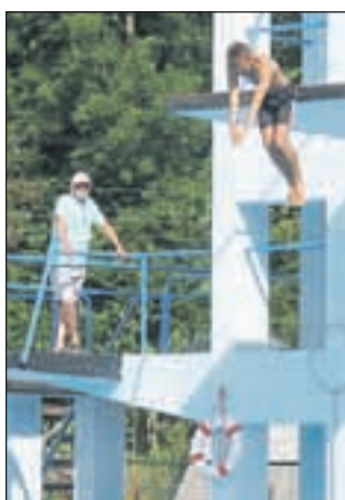
Skoke v vodo so odprli najmlajši. Tekmovalo jih je štiriindvajset.