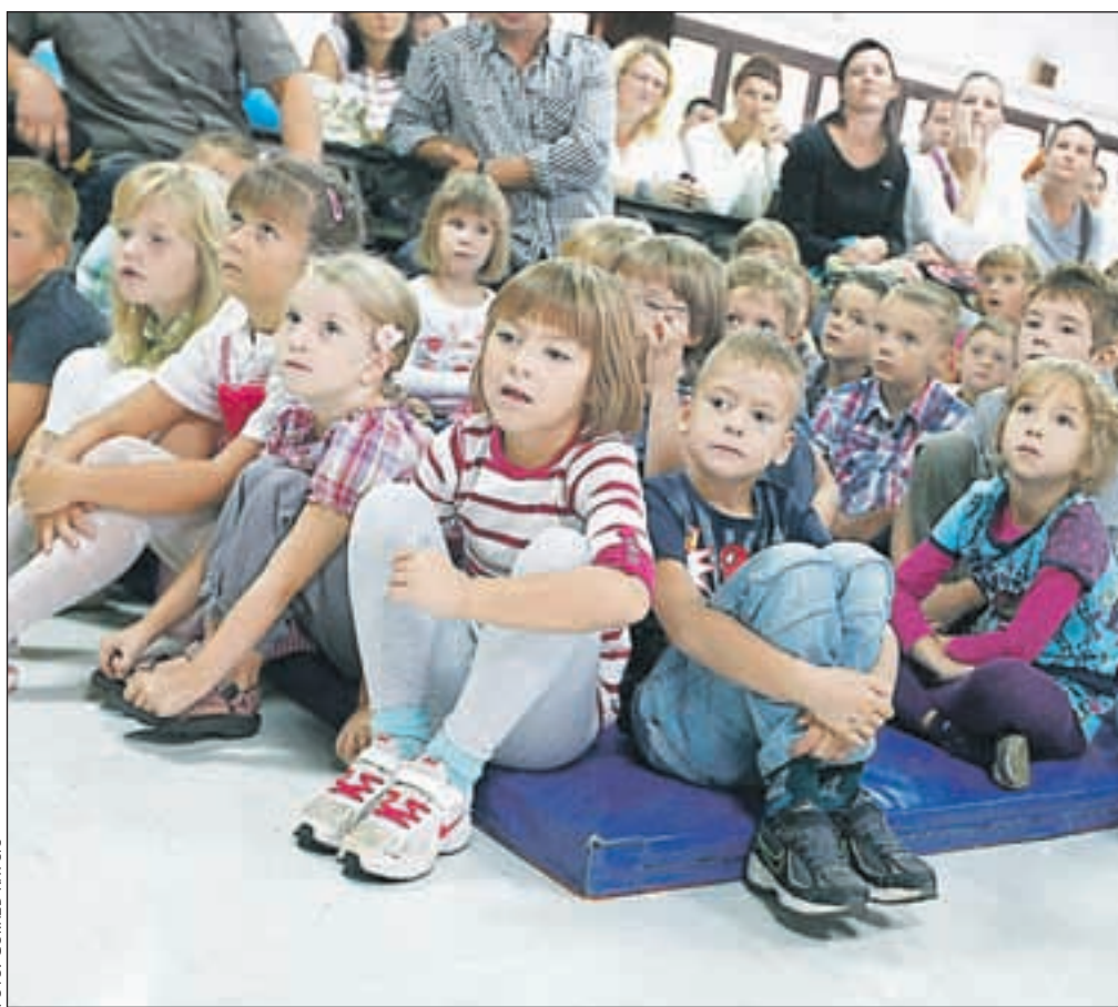
Prvi šolski dan za prvošolčke (letos jih imajo šestdeset) na Osnovni šoli Koroška Bela

Jeseniške vrtce bo obiskovalo 699 malčkov v 39 oddelkih.