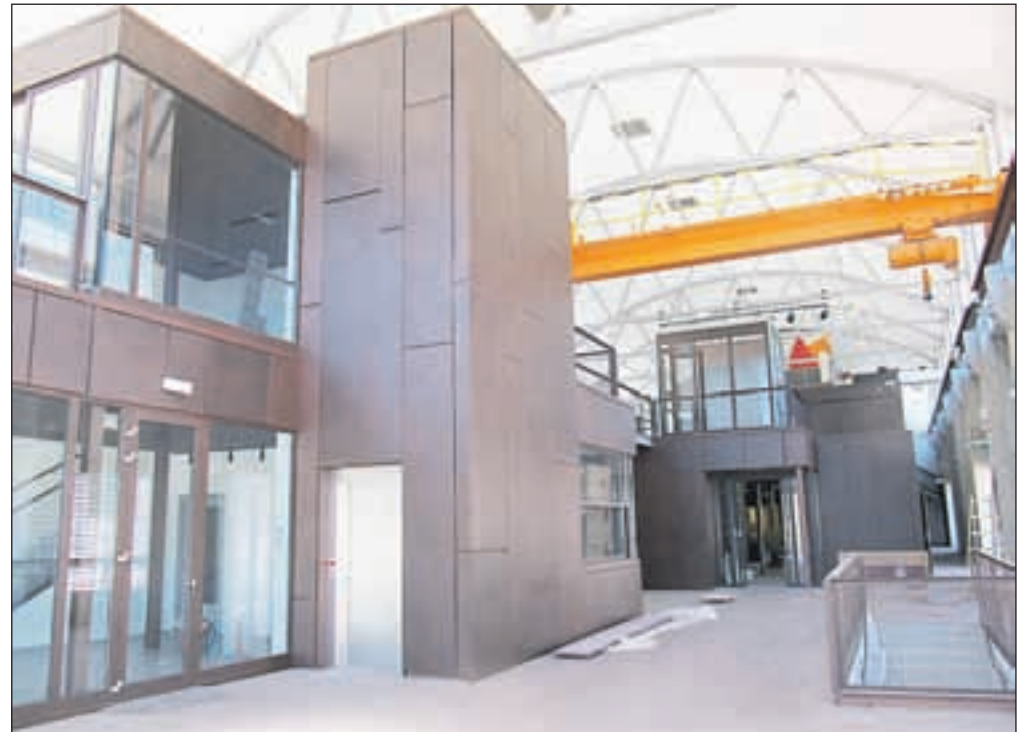
Tržnico so uredili v nekdanji železarski hali.