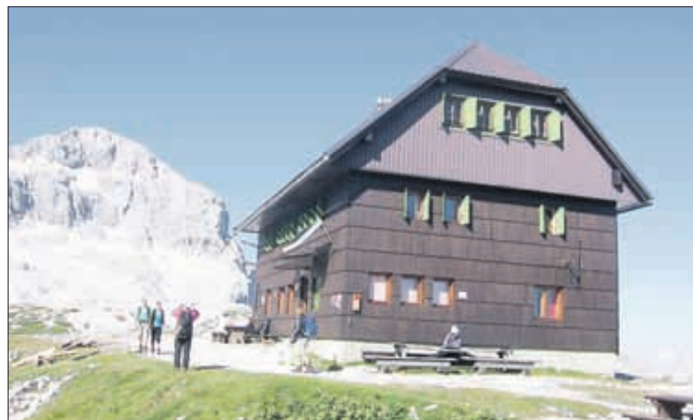
Staničev dom pod Triglavom

Pri Planinskem društvu Javornik-Koroška Bela ob pestri letošnji dejavnosti v poletnih dneh glavno skrb namenjajo trem svojim postojankam: Kovinarski koči v Krmi, Prešernovi koči na Stolu in Staničevem domu