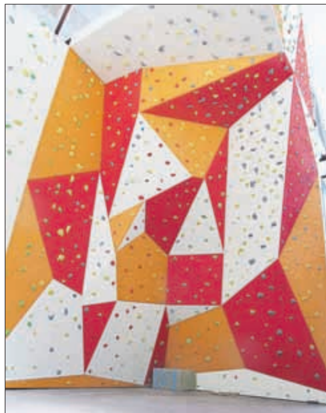
V sklop tržnice sodi tudi najsodobnejša plezalna stena.