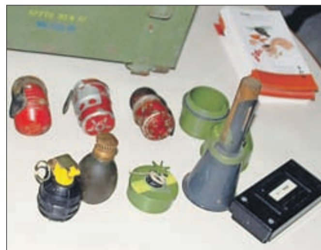
Najrazličnejše eksplozivne najdbe, mnoge med njimi se zdijo kot igračke.