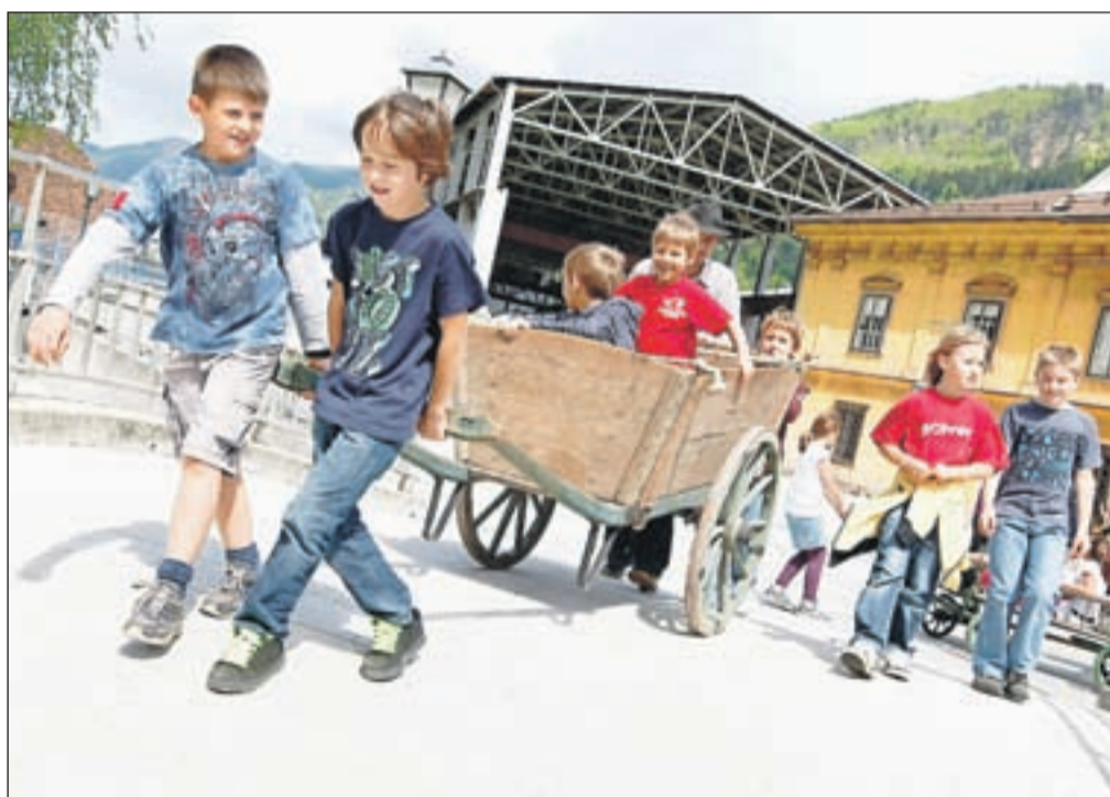
Z lesenim vozičkom, s kakršnim so včasih vozili rudo, po Stari Savi ...