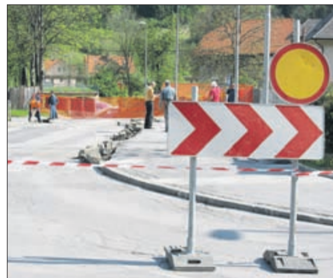
Most čez Savo in podvoz Podmežakla bosta predvidoma zaprta do konca junija.

V začetku meseca so začeli obnavljati most čez Savo v Podmežaku, zaradi česar sta zaprti cesta in površina za pešce v podvozu Podmežakla. Gre za občinsko investicijo. »Obnovitvena dela se izvajajo skladno s sprejetim planom gradnje in vzdrževanja občinskih cest v občini Jesenice v obdobju 2011 do 2014,« so pojasnili na Občini Jesenice. Izvajalec del je podjetje Maptrade, ki je bilo izbrano z javnim natečajem. S sanacijo mostu bo urejena tudi javna razsvetljava na območju mostu in križišča, nameščena pa bo tudi nova ograja. Skupna vrednost investicije znaša dobrih sto tisoč evrov, dela pa naj bi bila končana do konca junija. Ob tem na Občini Jesenice poudarjajo, da obvoz poteka po vzporednih ulicah in cestah, pešce pa prosijo, da uporabljajo druge površine, namenjene hoji. U. P.