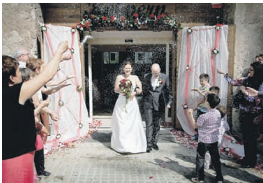
Brez sprejema z rižem na nobeni poroki ne gre ...