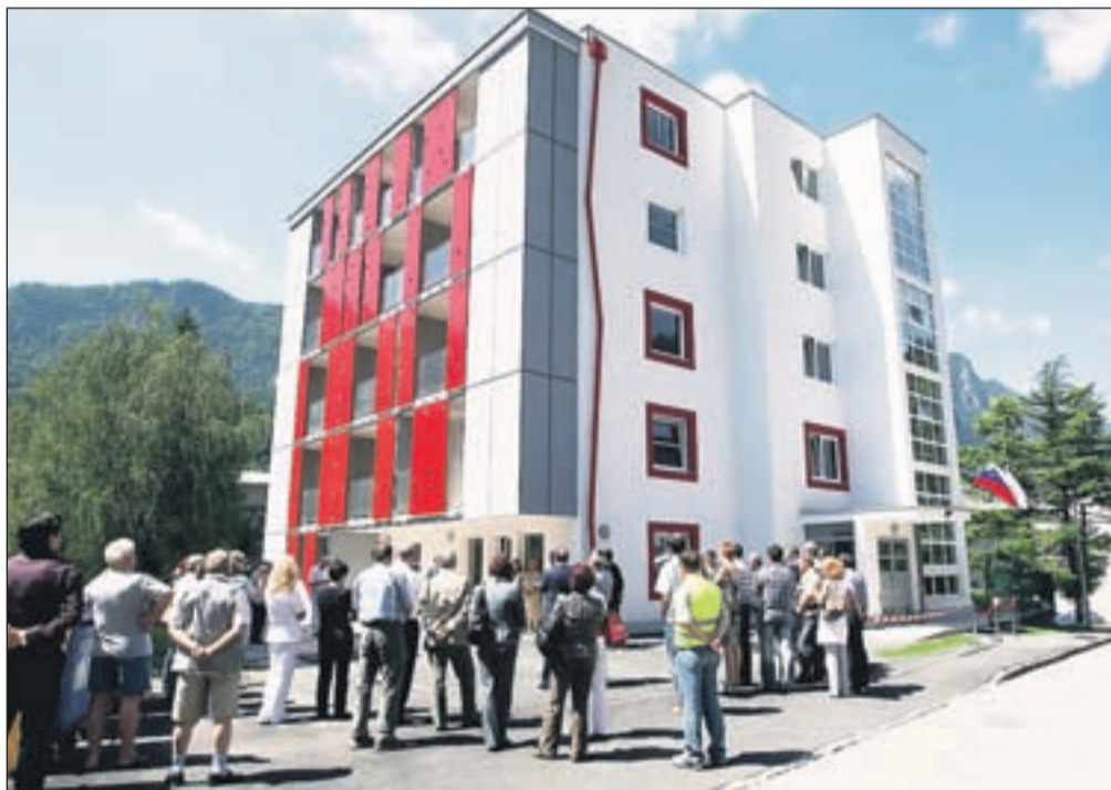
Blok na Bokalovi so namenu predali predlani, oskrbovana stanovanja pa zdaj prodajajo kot običajna.