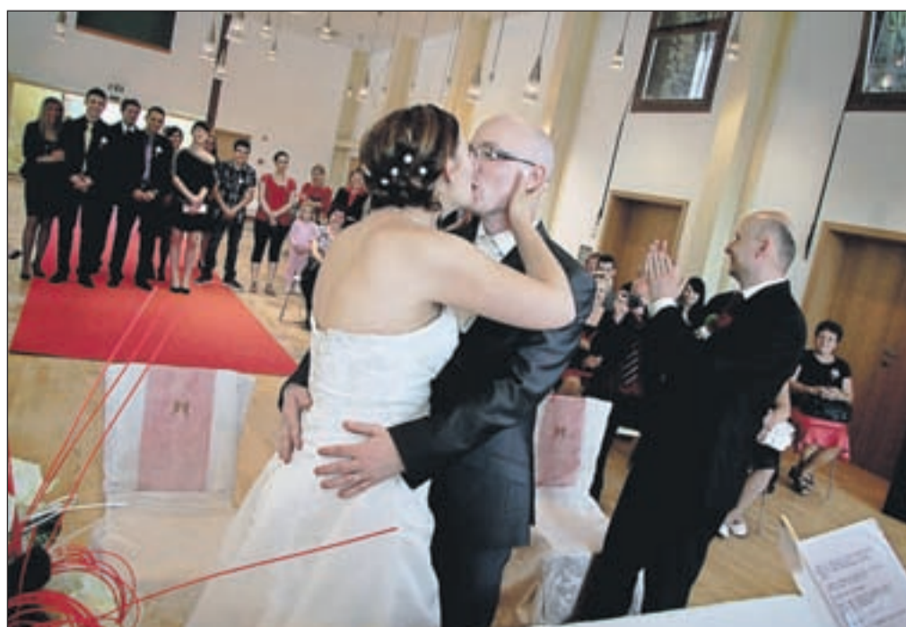
Poročni poljub je pospremil glasen aplavz okrog šestdesetih svatov.