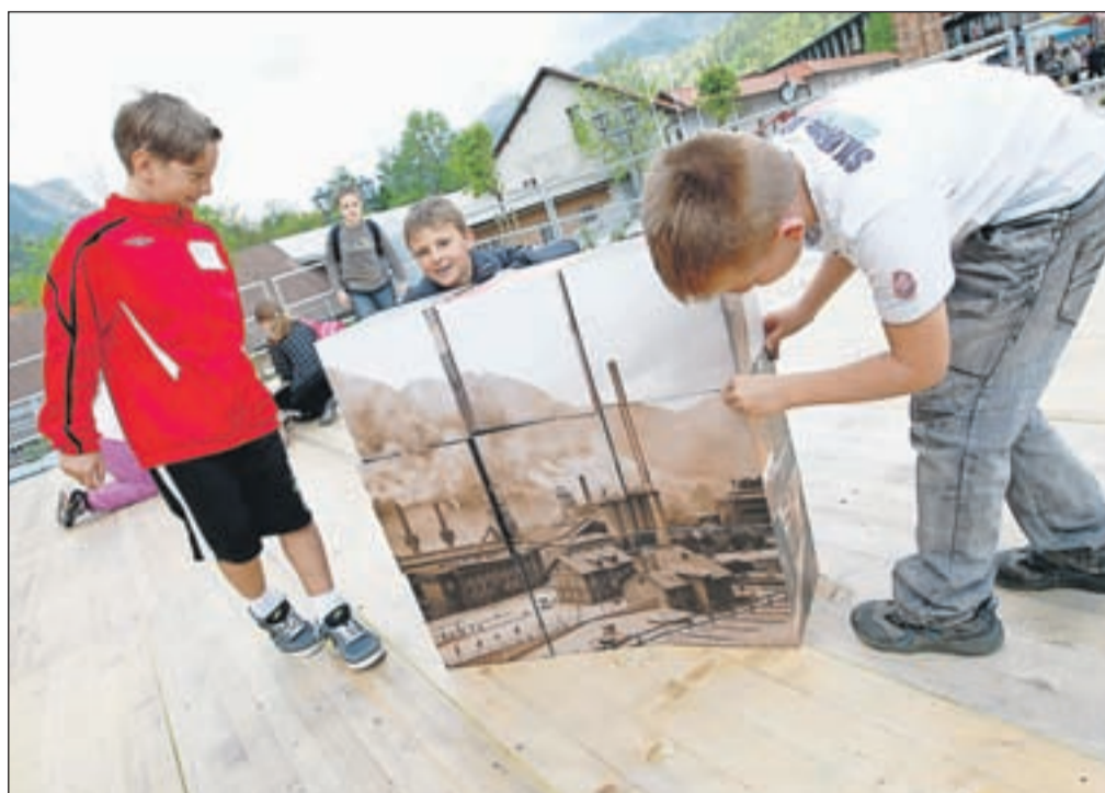
Otroci so pred nekdanjim skladiščem oglja, zdaj obnovljenim Kolpernom, sestavljali sestavljanke s podobo železarskih obratov.