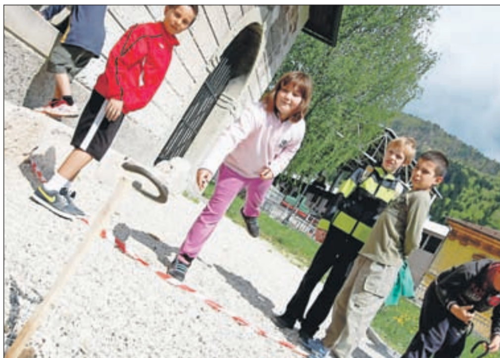
Otroci so se pomerili v metanju podkvic pa tudi hoji s hoduljami, vožnji z lesenimi skiroji, zbijanju korcev, tehtali so dodatke za v plavž, kotalili kolesa ...