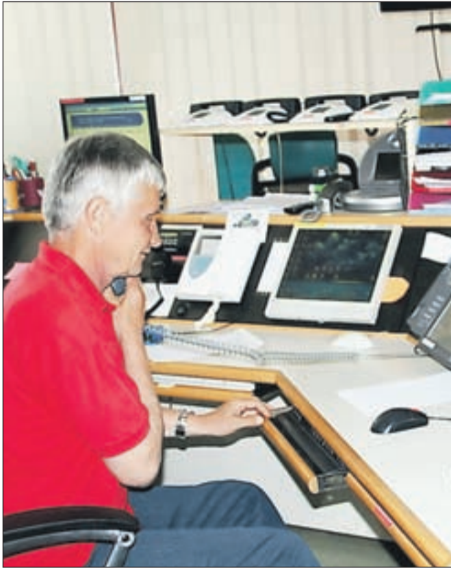
Operater v centru za obveščanje pri delu

Praviloma naj bi ob klicu na telefonsko številko 112 navedli, kdo kliče, kaj, kdaj in kje se je zgodila nesreča in koliko je ranjenih, kakšne so poškodbe in razmere na mestu nesreče in kakšna pomoč je potrebna.