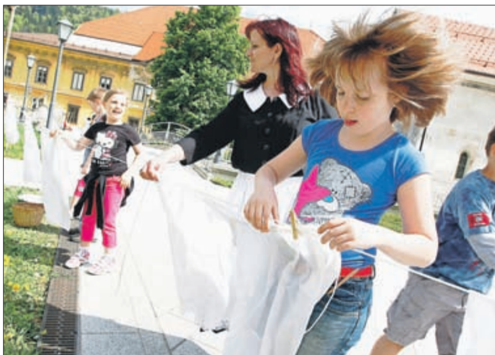
Obešanje perila na star način je prav zabavno ...