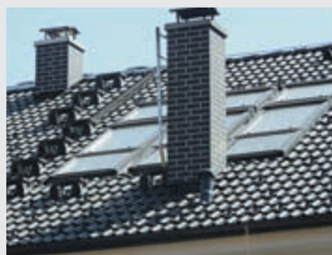
Varen dostop do ustja dimnika.

zgorevanje, večjo količino katranskih oblog ter posledično večjo verjetnost za dimniški požar. Pomembno je, da imajo peči ustrezne certifikate in da so opremljene z dokumentacijo (to je določeno v Zakonu o gradbenih proizvodih in Zakonu o splošni varnosti proizvodov – iz istoimenskih direktiv EU). Uporaba naprav oz. peči, ki niso ustrezno označene in opremljene z navodili za uporabo in montažo, je tvegana. Zato je pomembno, da spremljajoči dokumentaciji posvetite pravo mero pozornosti. Po namestitvi peči je potrebno zagotoviti ustrezno vzdrževanje in nadzor . Prav zato je organizirana dimnikarska služba, ki deluje na osnovi vnaprej določenih kriterijev in rokov.