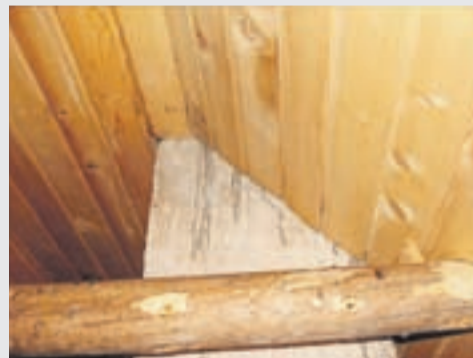
Neustrezni odmik gorljivih materialov od dimnika.

Za varno uporabo peči in dimnika je pomemben tudi zadosten in nemoten dovod zraka za zgorevanje (pozor pri kuhinjskih napah!). Zrakotesna okna, vrata in fasada ne zagotavljajo pretoka zraka, zato je bolj smiselno izbrati in vgrajevati samo peči, ki niso odvisne od zraka v prostoru. Neustrezni pogoji pomenijo slabo