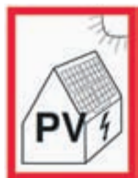
Oznaka za označevanje objektov s PV napravami, ki bo priporočena tudi v nastajajoči slovenski smernici