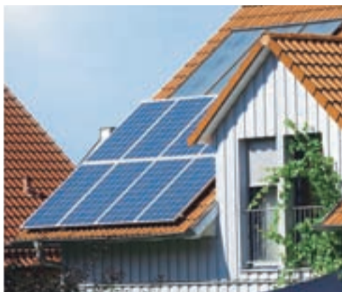
Na številnih strehah najdemo poleg PV naprav tudi sončne kolektorje (na sliki so nameščeni nad PV moduli), ki sončno energijo spreminjajo v toploto.

Zaradi omejenih zalog in vedno višjih cen fosilnih goriv, njihovega škodljivega vpliva na okolje in vedno večjih svetovnih potreb se mrzlično iščejo alternativni, predvsem obnovljivi viri energije. Velik potencial za prihodnost predstavlja energija sonca, ki jo znamo s PV-napravami pretvoriti v električno.