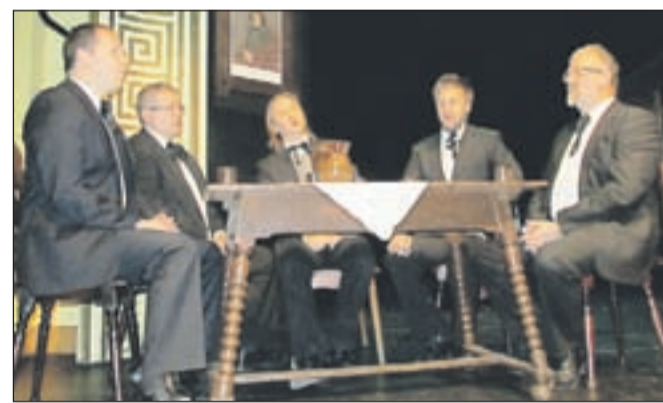
Kvintet za 5 (pet)