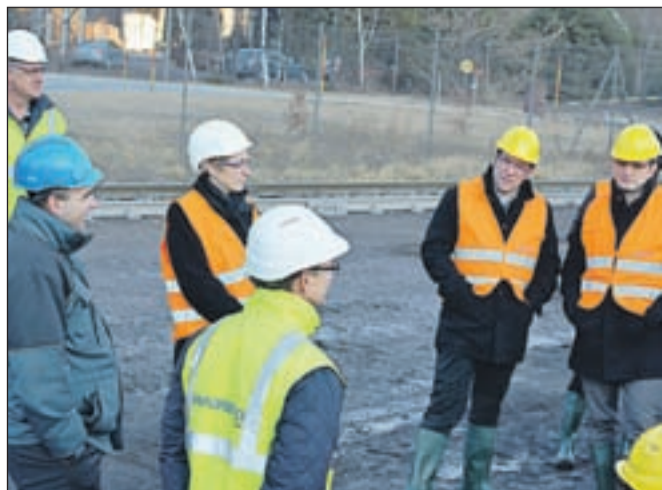
Občinski svetniki na ogledu