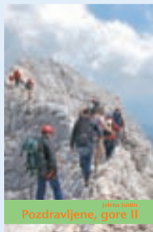
ali knjiga Pozdravljene gore II