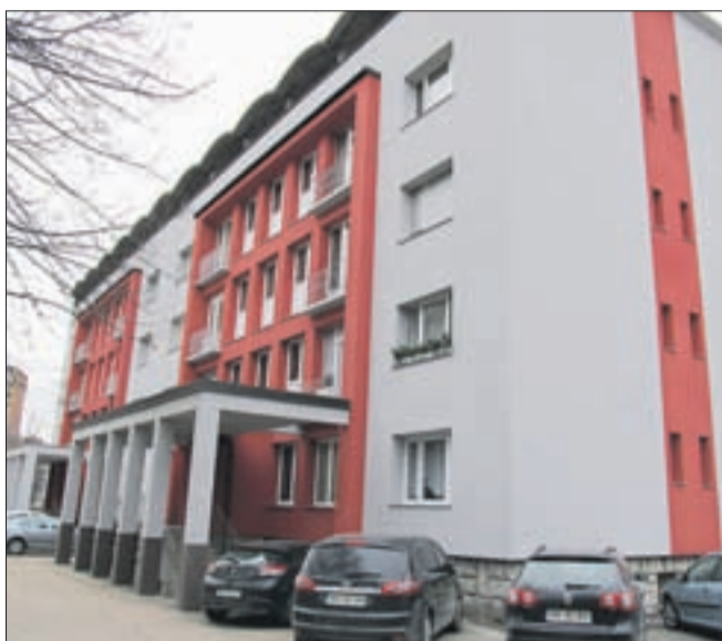
Med bloki z obnovljenimi fasadi so med lepšimi tisti z rdeče-sivimi fasadami na Tavčarjevi na Plavžu.

"Vse je odvisno od kvadrature. Pri večstanovanjskih objektih denimo so stroški od 40 pa do 140 tisoč evrov, v povprečju na stanovanje to pride denimo okrog 4500 evrov. Obnova fasade zasebne hiše stane od 12 do 15 tisoč evrov, spet seveda odvisno od velikosti fasade. Pri večstanovanjskih objektih stanovalci vplačujejo v rezervni sklad, kjer se nabere del denarja za obnovo, poleg tega pa lahko del denarja dobijo od Eko sklada in od Občine Jesenice, ki je ena redkih, ki spodbuja energetske sanacije stavb in s tem obnovo fasad."