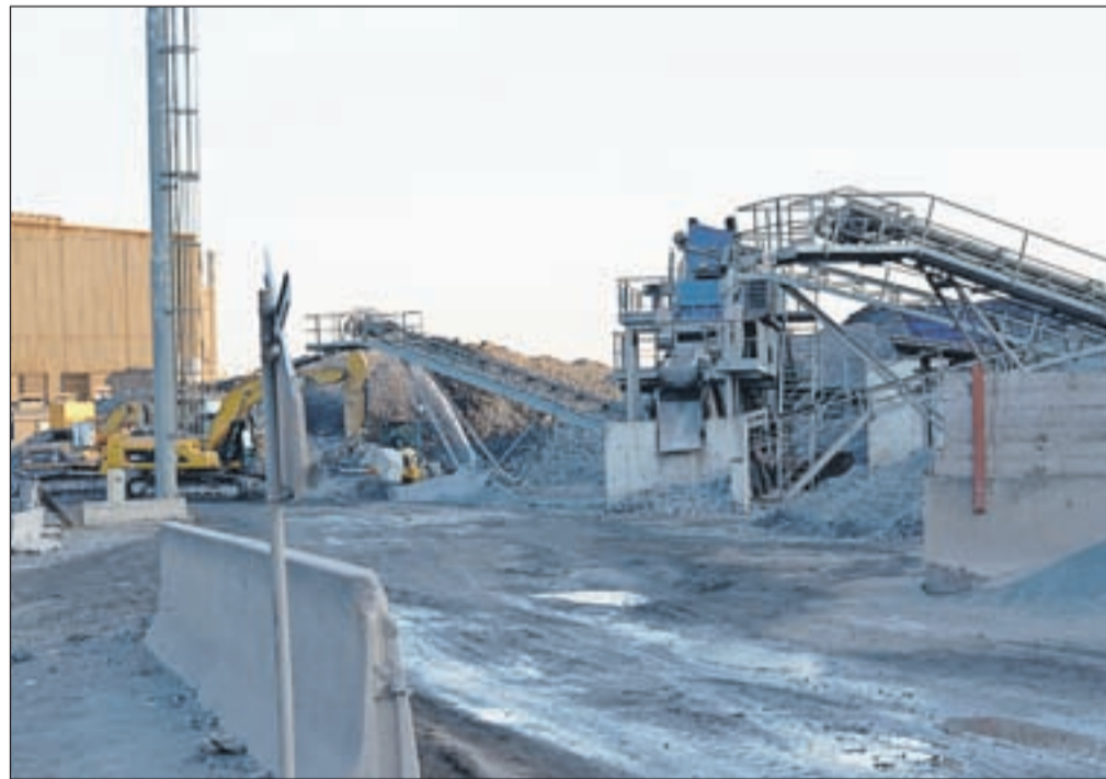
Proces predelave črne žlindre

moral krajanom bolje predstaviti svoje načrte. "Žal je to taka dejavnost, da so ljudje na Jesenicah zelo občutljivi, zato bi se postopki morali voditi zelo transparentno. Če bi krajanom bolje predstavili načrte, bi bilo tudi manj dvomov in skrbi," je dejal Rebolj.