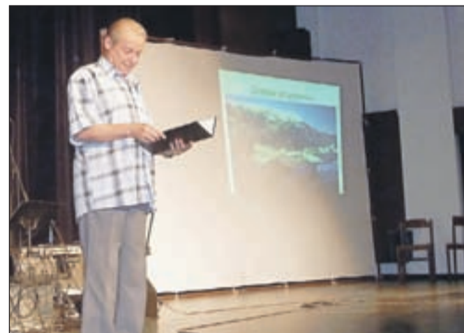
V veliki dvorani so skorajda vsakodnevnne vaje in prireditve domačih in drugih skupin.

na domačem odru in gostovanja. V razstavnem salonu Viktorja Gregorčiča vsako leto pripravijo od deset do dvanajst likovnih, fotografskih in drugih razstav. V prihodnje želijo večji poudarek dati koncertni dejavnosti, ki bo potekala v okviru glasbene sekcije. Razveseljivi so tudi podatki o koriščenju in zasedenosti prostorov v Kulturnem domu na Slovenskem Javorniku. V veliki dvorani so skorajda vsakodnevnne vaje in prireditve domačih in drugih skupin. V lanskem letu so bili prostori zasedeni kar 472 dni oziroma 1240 ur. Devetdesetletnico delovanja DPD Svoboda bodo dostojno počastili letos jeseni. Če razkrijemo le nekaj načrtov: pripravili bodo slavnostno predstavo in glasbeni koncert, svoje prispevke bodo dali člani društvenih sekcij.