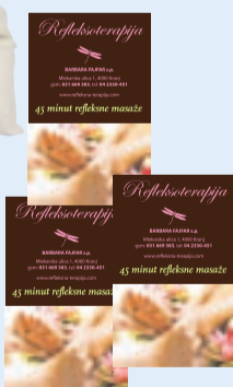
ali darilni bon za refleksno masažo stopal