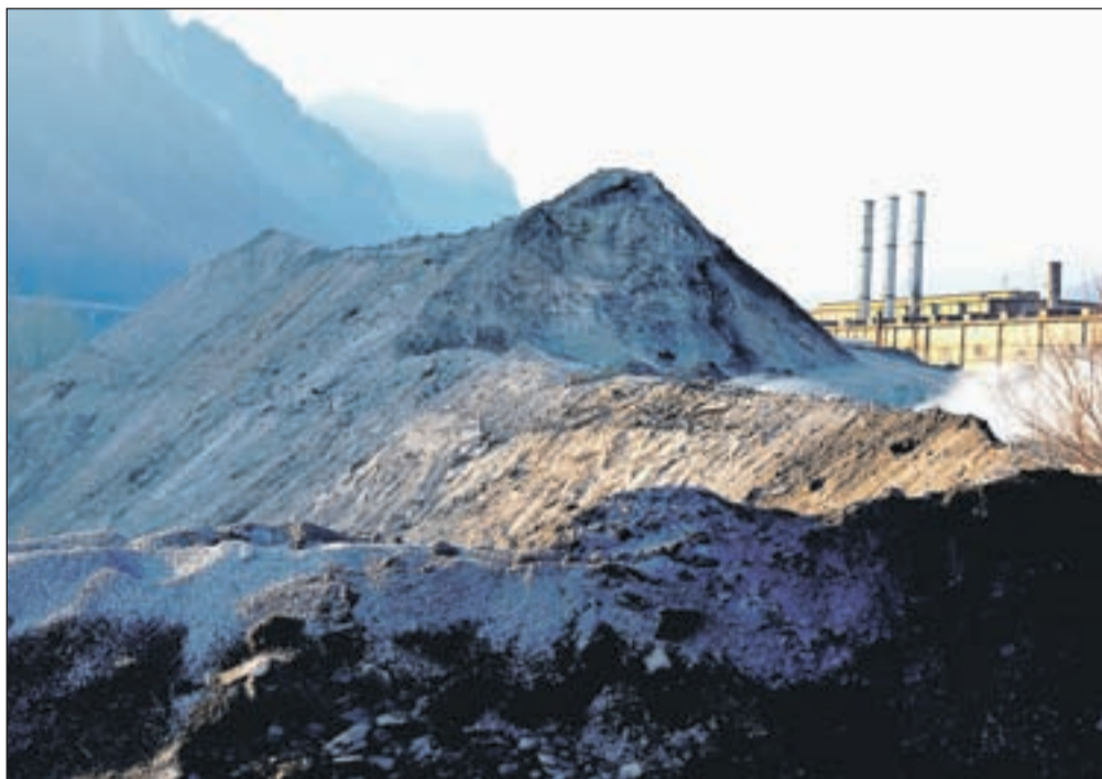
Kupi žlindre, ki so se kopičili desetletja dolgo.