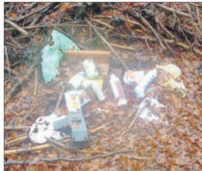
... in nekaj "lepote", ki jo ustvarja človek! Fuj!