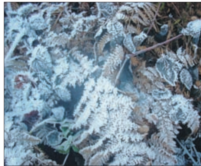
Lepota, ki jo ustvarja narava ...