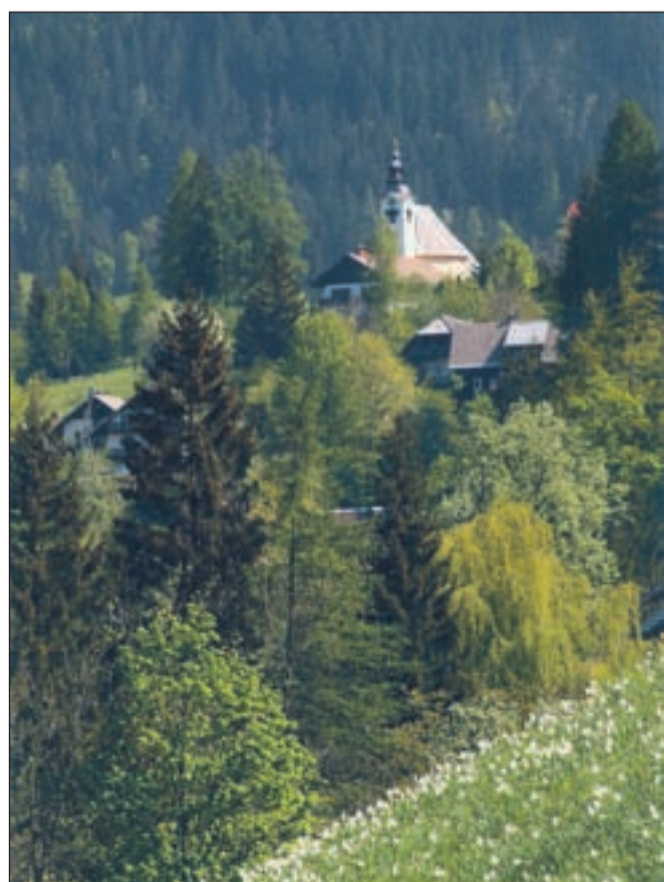
Planina pod Golico

"Nimam interneta niti televizije, sem pravi puščavnik ... Imam pa še nekaj boljšega - okna s pogledom na Golico ...," pravi France Urbanija.