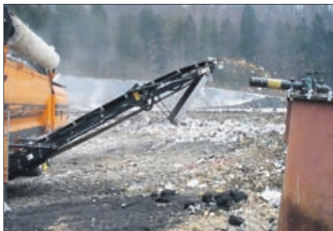
Začasna sortirnica deluje tako, da v sortirni boben stresejo mešane odpadke, ki jih na deponijo pripeljejo smetarska vozila, v bobnu pa se ob vrtenju izločijo kovine in plastika.