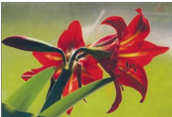
Motiv cvetice