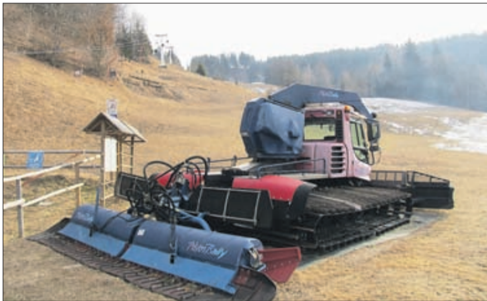
Smučišče Španov vrh sameva, še vedno čakajo na pošiljko naravnega snega.

Cena smučarskih vozovnic na smučišču Španov vrh ostaja enaka kot lani, celodnevna karta za odrasle stane trinajst evrov.