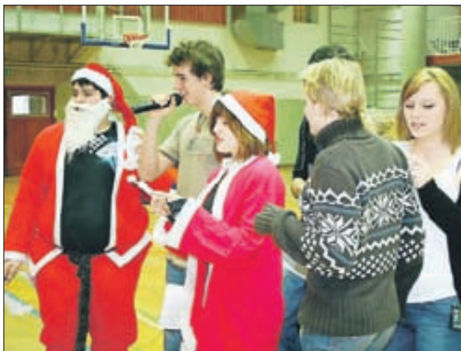
Novoletna prireditev v telovadnici gimnazije

božično-novoletni kulturni program in jih obdarili z voščilnicami in pecivom, ki so ga sami spekli. Oskrbovanci so bili obiska zelo veseli. Gimnazijski pevski zbor Janka Pribošiča je letos izvedel kar tri božično-novoletne koncerte. Prvi je bil na Gimnaziji Jesenice, drugi v Kinu Železar, tretji pa v Kolpernu. Izkupiček od prostovoljnih prispevkov je bil namenjen v šolski sklad za pomoč socialno šibkim dijakom. Izvedli so tudi dobrodelno prodajno razstavo slik, ki so jih naslikali dijaki. Na razstavi je bilo 18 slik. Ogle dati si jih je mogoče na šolski spletni strani. Pridobljene prispevke za slike so name-