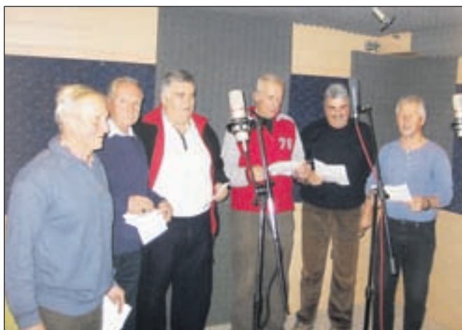
Fantje s Hrušice pri snemanju himne