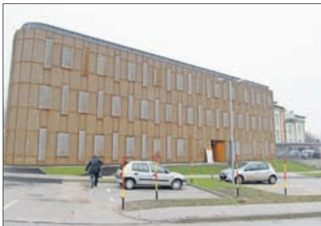
Upravna enota Jesenice se bo predvidoma aprila preselila v novi Upravni center Jesenice ob občinski stavbi.

"Zaradi pričakovanega večjega števila vlog za zamenjavo osebnih dokumentov na območju cele države pričakujemo tudi daljši čas izdelave