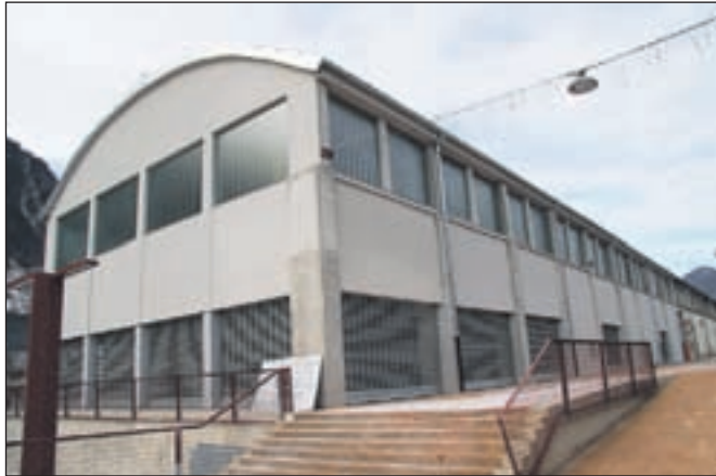
Tržnica bo predana namenu za občinski praznik, torej 20. marca.

je tržnice meseca decembra. Ker je še sedaj nekaj težav z urejanjem dokumentacije, smo sprejeli odločitev, da bo tržnica predana namenu za občinski praznik, torej 20. marca," je še povedal župan.