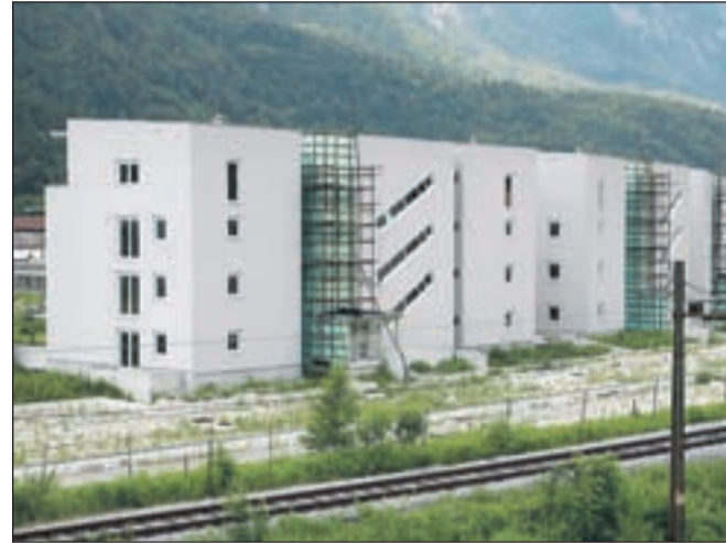
V Aleasingu zatrjujejo, da bodo gradnjo blokov vendarle nadaljevali in da bodo začeli graditi tudi prečno povezovalno pot.