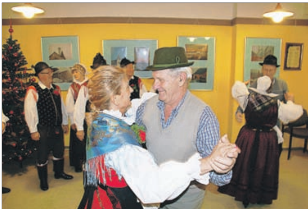
Druženje krajanov KS Sava je popestrila folklorna skupina Golica, s člani katere so se zavrteli tudi nekateri krajanje.

Devetega decembra pa so se v domu društva upoko-