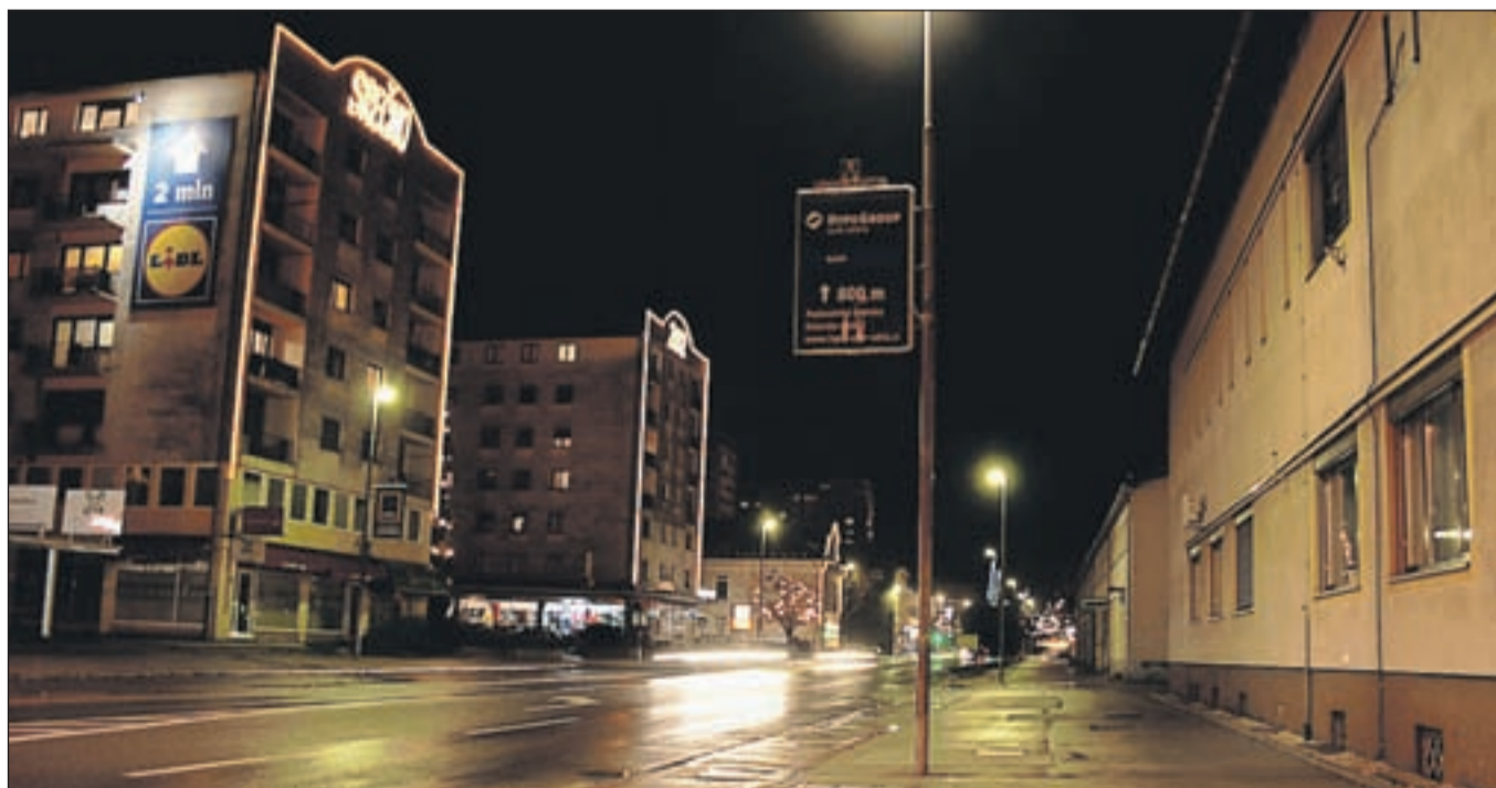
Jesenice so že praznično osvetljene.