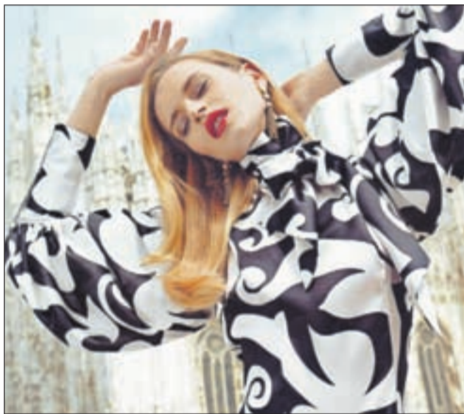
Vzorec, svila, pentlja - za maksimalen trendni učinek

Danes se bomo spogledovali s svilo. Če se v svilo še niste zaljubili, je skrajni čas, da se to zgodi. Ljubezen na prvi pogled ali dotik, kakorkoli hočete. Svila zadovolji potrebo po eleganci, zapeljevanju, presenečenju. V njenem objemu se ženska počuti kot romantična princesa ali kot drzna popotnica. Tako kot žensko ali pa še bolj neti tudi moško domišljijo.