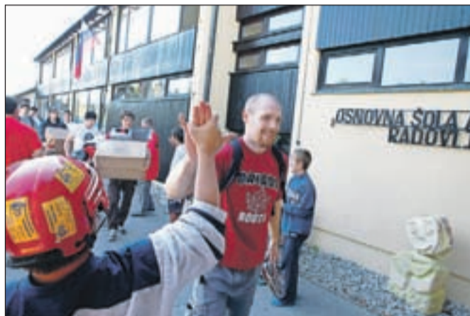
Navdušen sprejem jeseniških hokejistov ob prihodu na OŠ Antona Janše