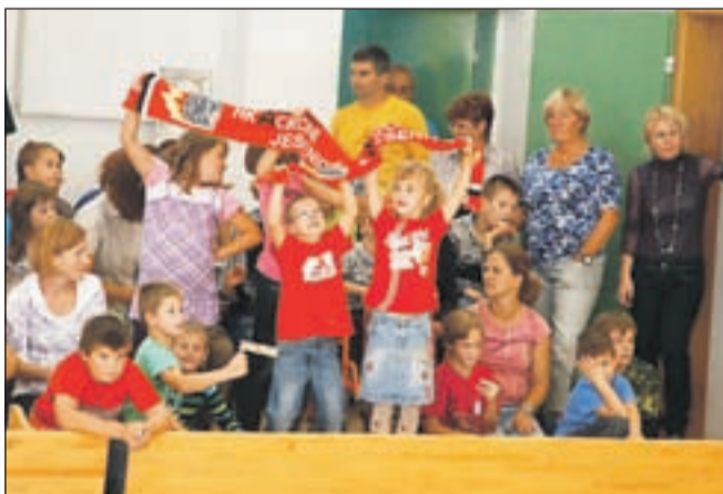
Strastni navijači HK Acroni Jesenice so tokrat enako navdušeno navijali za obe ekipi.