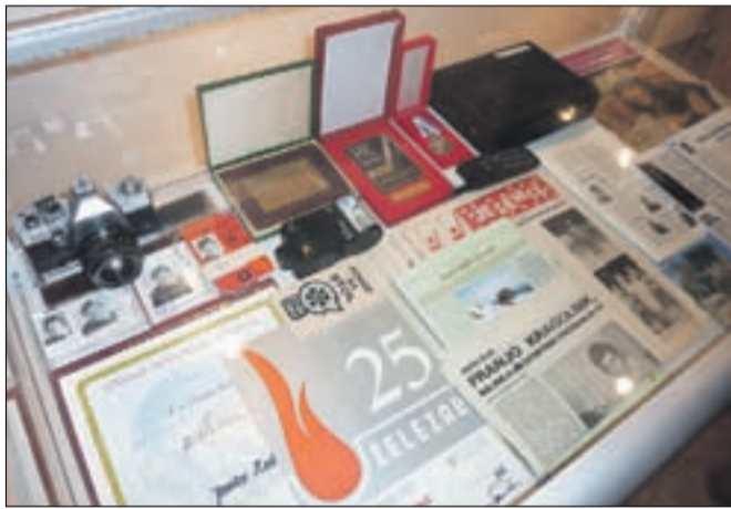
Vitrina s predmeti, ki so zaznamovali štirideset let novinarskega dela: prvi fotoaparati, prvi mobilni telefoni, novinarske izkaznice, revije, časopisi in bilteni.