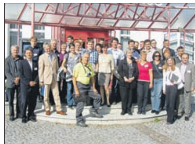
Udeleženci srečanja pred kulturnim domom v Ločah

Na zaključnem srečanju v kulturnem domu v Ločah je