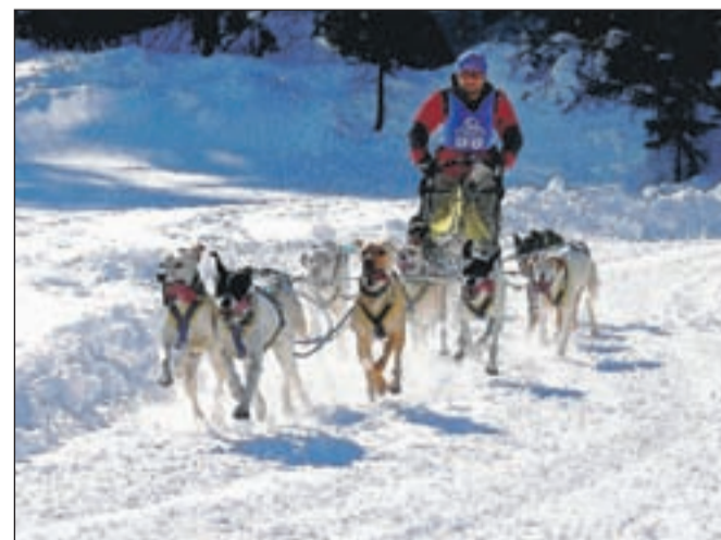
Na vso moč, Bricljeva najuspešnejša športna fotografija