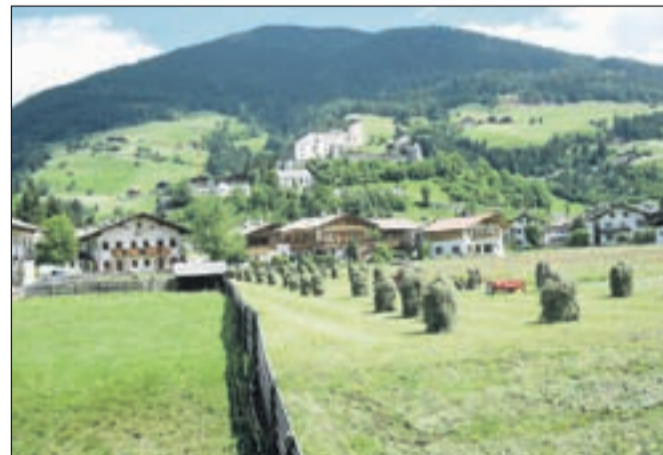
Kolesarjenje med travniki ravno v času košnje