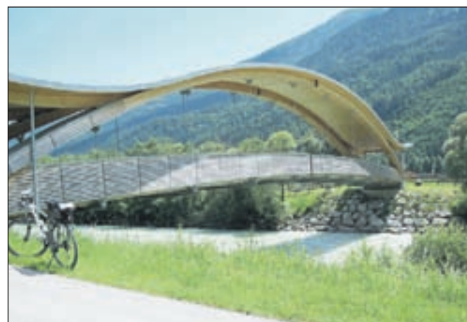
Novi most pri Oberdrauburgu