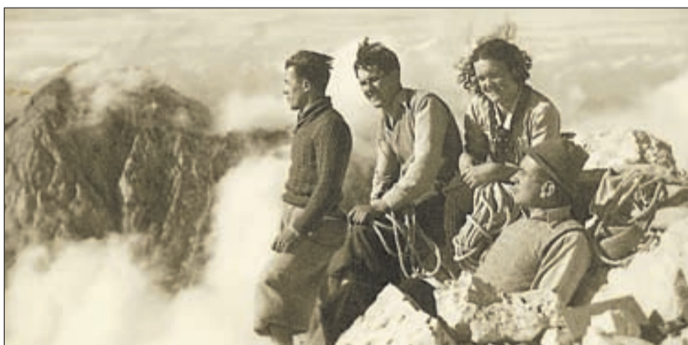
Spomini na mladost - na vrhu Jalovca.