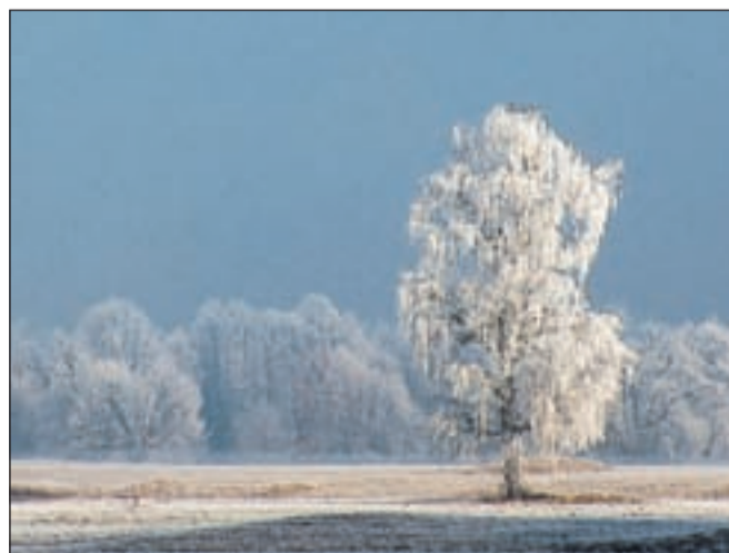
Breza žari, leta 2009 četrta najuspešnejša fotografija