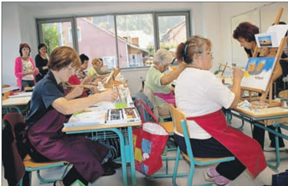
Utrinek s srečanja sekcije Kreativnost