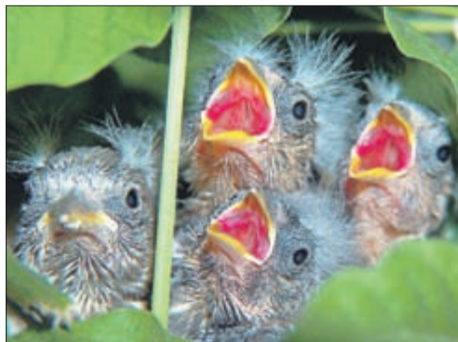
Lačni smo, Bricljeva najuspešnejša fotografija, razstavljena in nagrajena na razstavah v 15 državah po vsem svetu, leta 2006 druga najuspešnejša fotografija v Sloveniji.

2006 druga najuspešnejša fotografija v državi po številu prejetih nagrad in uvrstitev na razstave. Zelo uspešen pa je bil - predvsem onstran luže - tudi s športnimi fotografijami - s fotografijami pasjih vpreg in planiških poletov. Sicer pa so bile njegove fotografije doslej razstavljene v tridesetih državah, zanje pa je prejel že 117 nagrad in pohval.