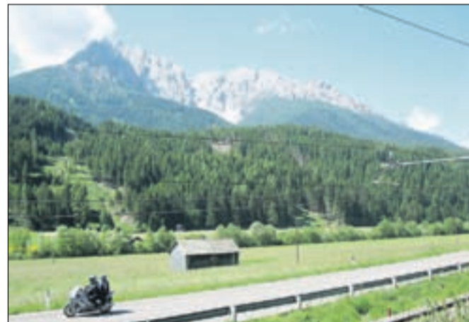
Dolomiti nad Toblaškim poljem