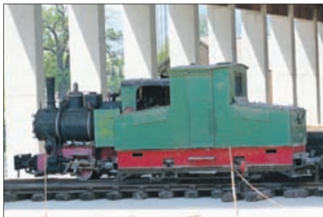
Tehniška dediščina na novi lokaciji na Stari Savi

V soglasju z Občino Jesenice bodo v prihodnje v hali na Stari Savi razstavili še druge eksponate, ki so bili povezani s plavžem, martinarno, livarno, valjarnami in drugimi jeseniškimi železarskimi obrati.