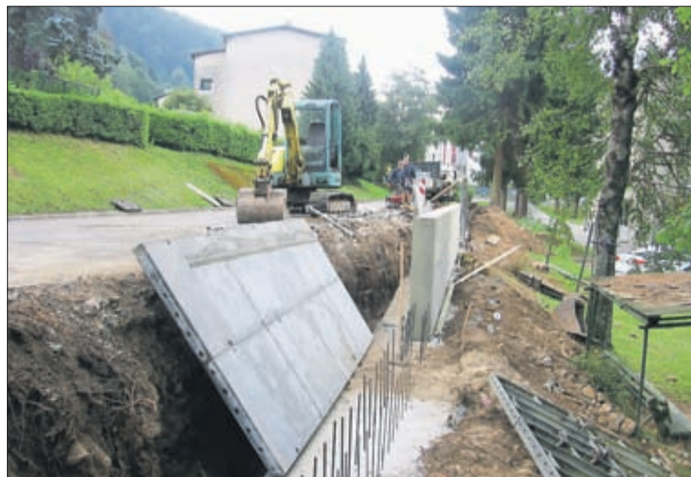
Začeli so graditi pločnik ob cesti do doma.

delo, družino in socialne zadeve za energetske sanacije domov za starejše. Imajo priložnost za pridobitev nepovratnih evropskih sredstev iz kohezijskih skladov v vrednosti devetdesetih odstotkov investicije. Tako