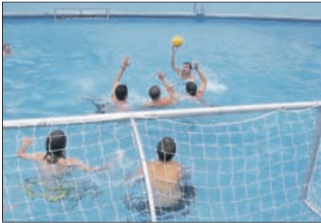
Utrinek z vaterpolo tekme