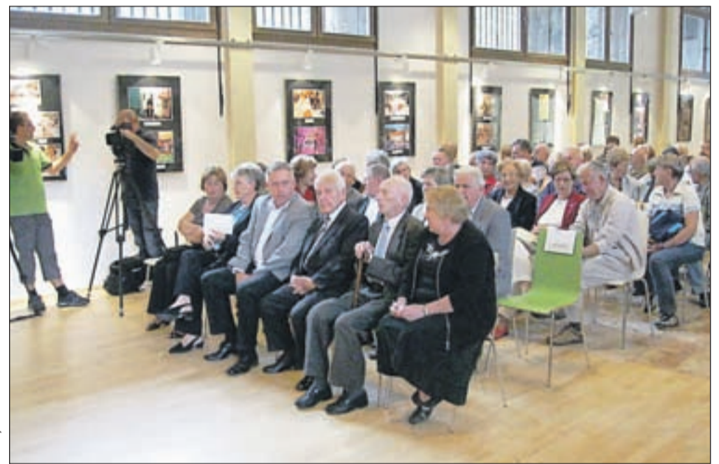
Slovesnost ob spominskem dnevu je potekala v banketni dvorani obnovljenega Kolperna. Organizirala sta jo Občina Jesenice in Združenje borcev za vrednote NOB Jesenice.