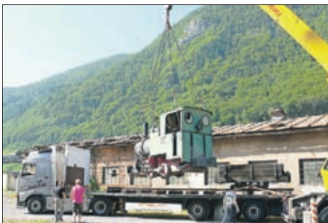
Nakladanje stare lokomotive

Glavna železniška proga je bila zgrajena leta 1905 in je povezovala martinarno na Jesenicah z valjarnami na Javorniku. Po njej so vozile parne in tudi električne lokomotive, saj je bila proga že zgodaj elektrificirana in je predstavljala eno od najstarejših elektrificiranih prog v Evropi. Prišlo je leto 1987 in čas velikih sprememb. Z zaprtjem plavžev in martinarne je tovarniška železnica izgubila svoj pomen, zato so jo ukiniteli. Jese-