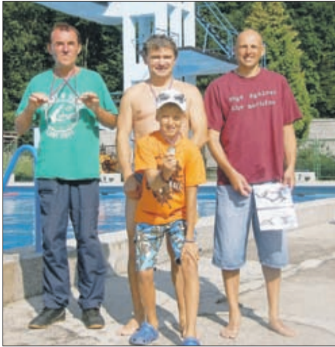
Udeleženci skokov v vodo