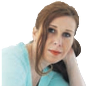
MAG. KARMEN KLOBASA

Zgoraj je sivkasto zelena, spodaj belkasta, na čelu, na grlu in na prsni pa rumeno rdečkasta. Ima tanek raven kljun. Je črvičke, pajke, raznovrstne mehke žužke, rada kljune kakšno sočno jagodo. (Vir: Fran Erjavec, Domače in tuje živali v podobah)