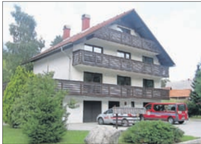
Hiša na Blejski Dobravi, ki jo je najel klub za skupno bivanje tujih hokejistov.