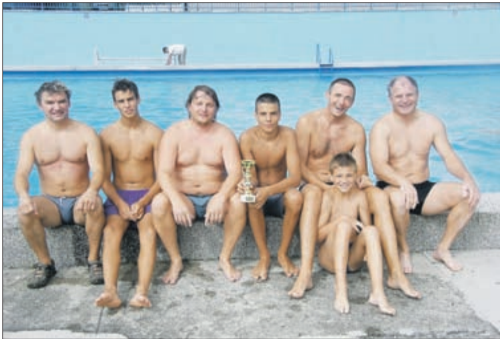
Zmagovalci vaterpola Kozli 99