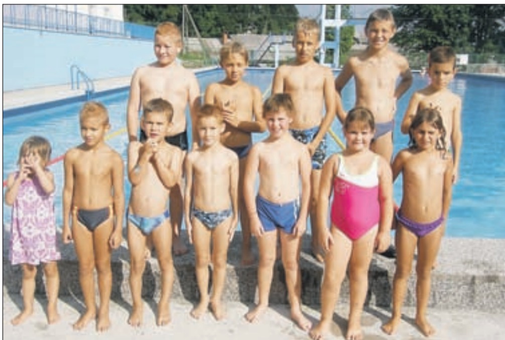
Udeleženci akvatlona v otroški konkurenci