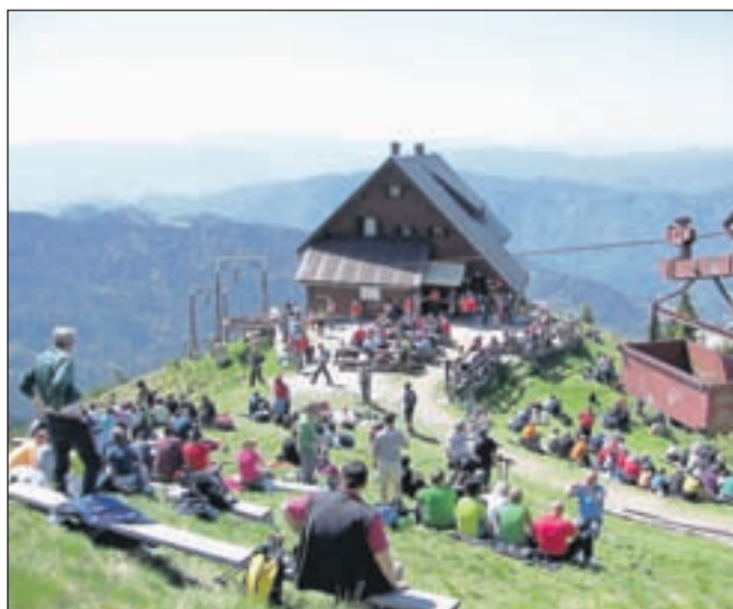
Pravo invazijo je doživela Golica že prvi vikend v maju, ko se je nanjo povzpelo več tisoč ljudi.

SVETI KRAJEVNIH SKUPNOSTI STANETA BOKALA MIRKA ROGLJA-PETKA CIRILA TAVČARJA Tavčarjeva 3/b, 4270 JESENICE