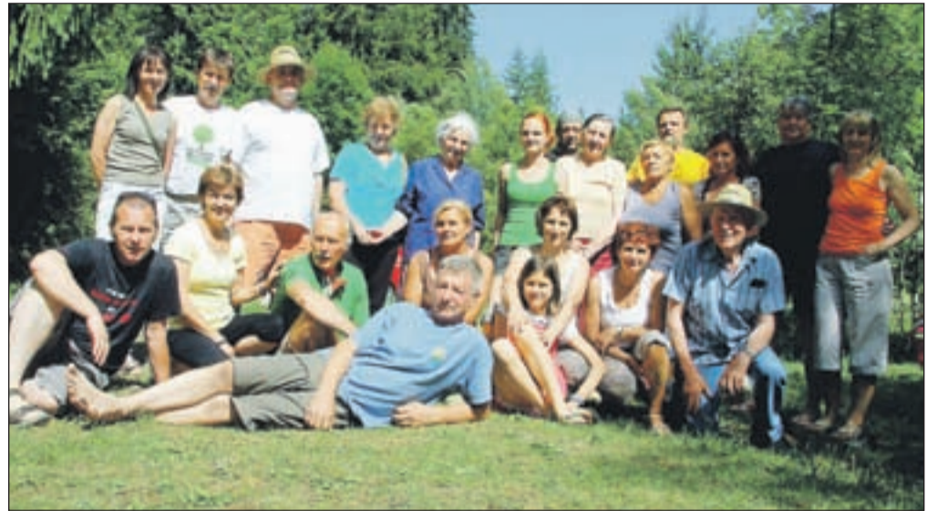
Tradicionalnih srečanj bivših in sedanjih stanovalcev Ceste revolucije 9 se udeležujejo vse generacije.