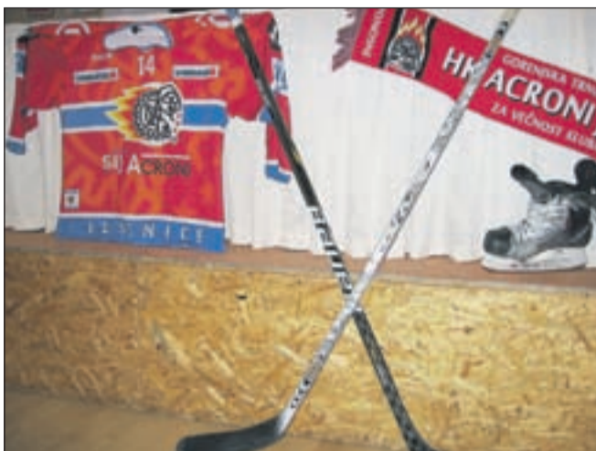
Hokejisti tokrat niso bili v ospredju. Nanje spominja hokejska oprema.