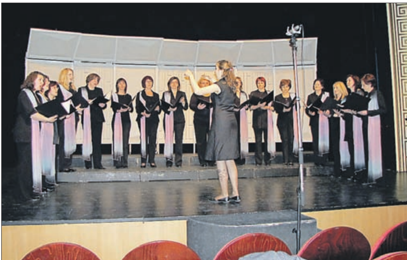
V 43 letih je Ženski pevski zbor Milko Škoberne nanizal prek 550 nastopov.