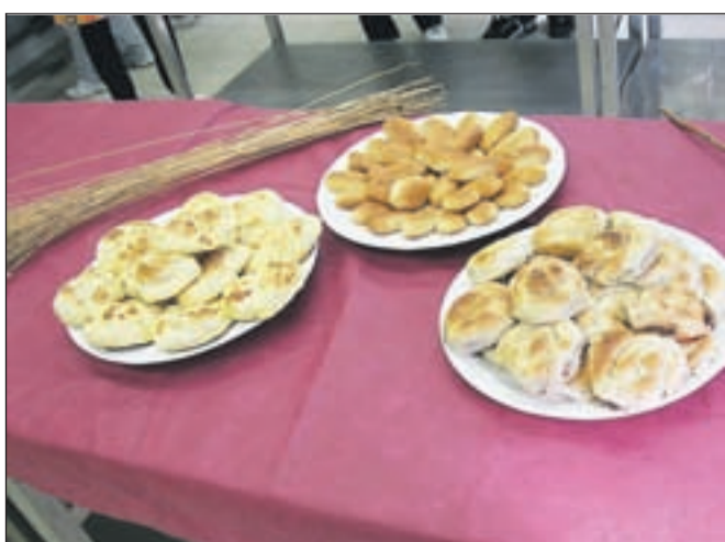
Poleg dveh vrst bureka so bosanske ženske spekle še hurmašice, v obliki datljev oblikovano pecivo, napojeno s sladkorno vodo.