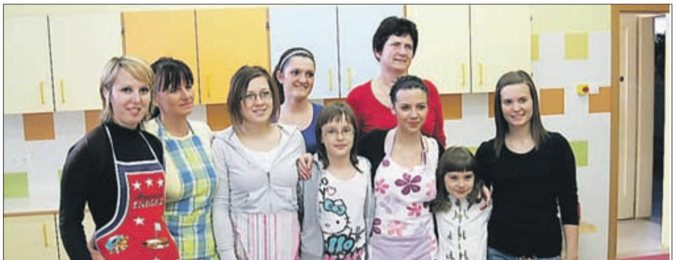
Ekipo deklet iz KŠD Bošnjakov Biser Jesenice