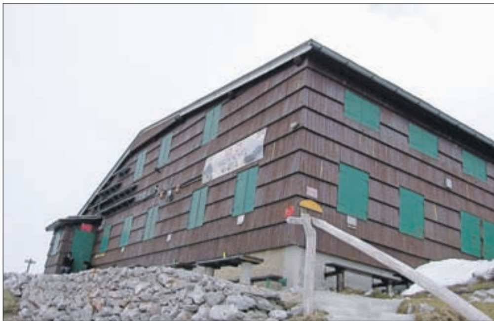
Prešernova koča je še zaprta, odprli jo bodo 11. junija.

do koče, kjer drva potrebujejo v poletni sezoni. Nekateri so "gorniško dolžnost" že opravili, druge pa drva še čakajo.