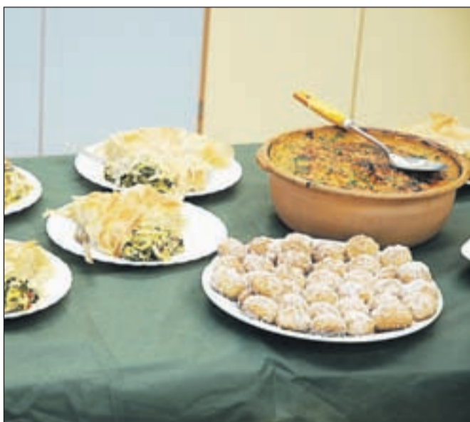
Kot značilne makedonske jedi so pripravili zeljnik, gravče na tavče in pivarke.