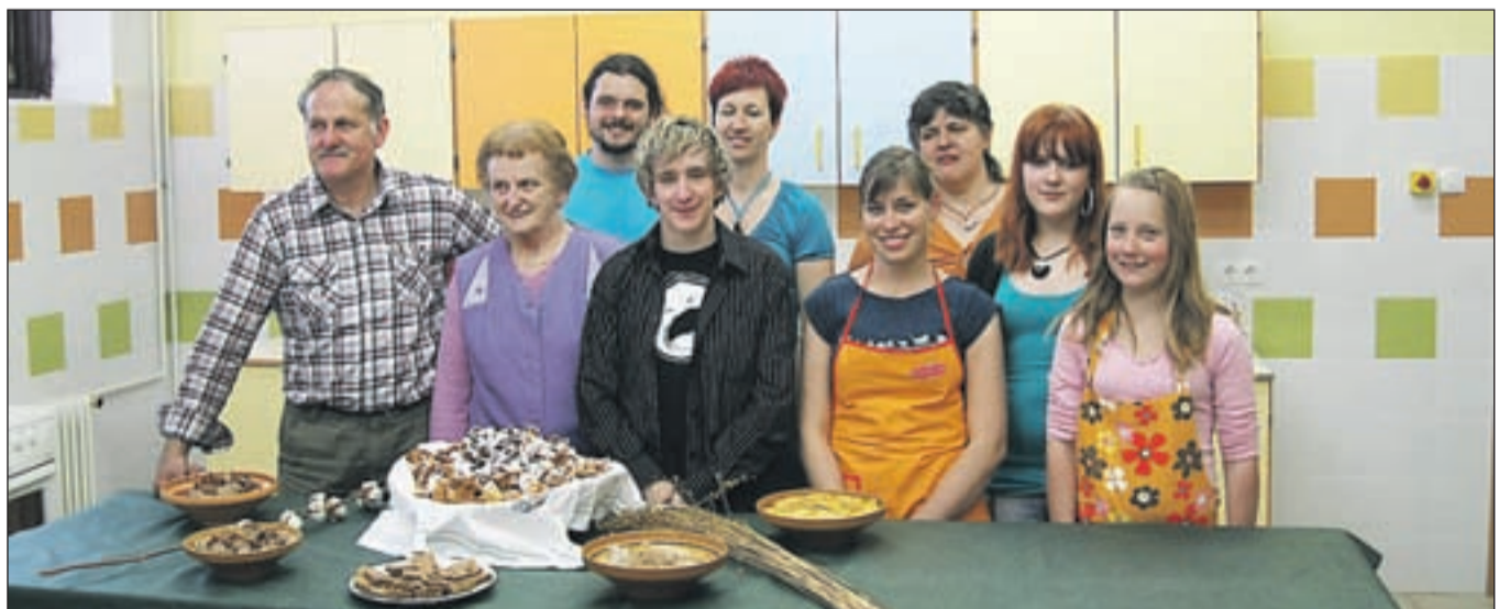
Članice in člani KUD Triglav Javornik-Jesenice v kuhinji po opravljenem delu