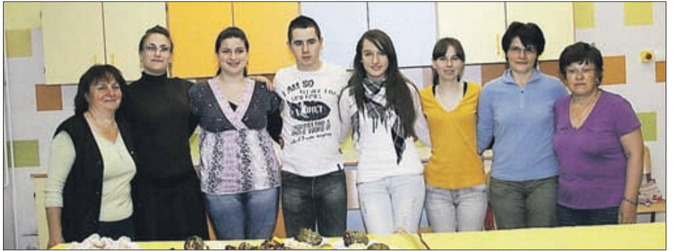
Člani KPŠD Vuk Karadžić Radovljica so pripravljali srbske dobrote.