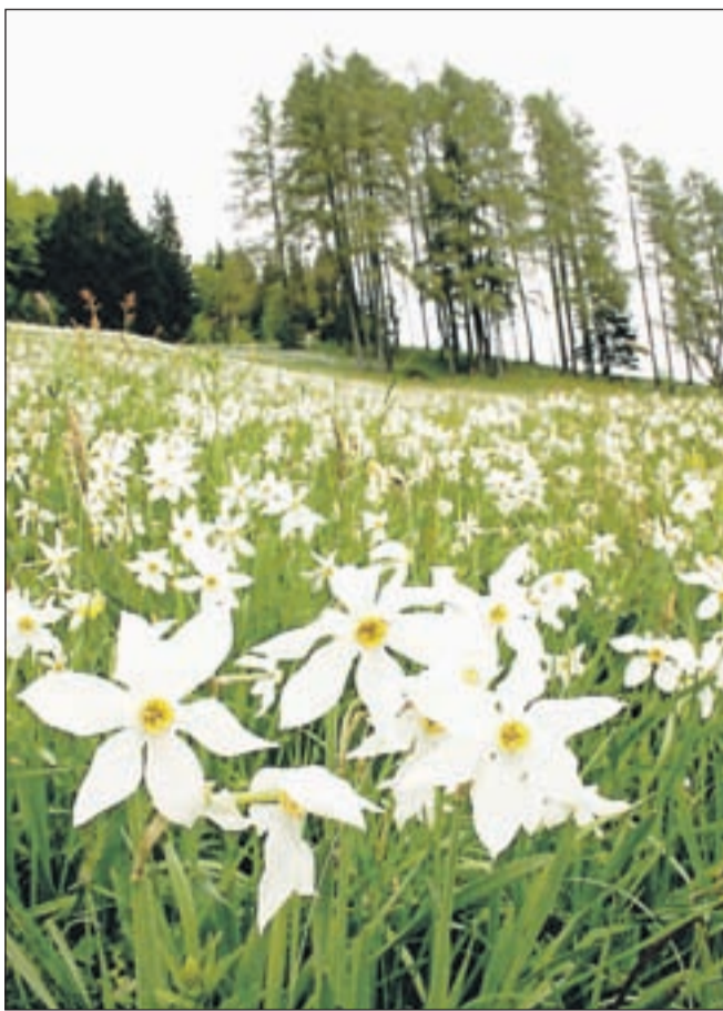
Po pričakovanjih naj bi narcise v vaseh pod Golico letos najlepše cvetele v prvi polovici maja, na Golici pa v drugi polovici maja.

Številne prireditve, povezane z narcisami, pa v maju potekajo v vsej občini.