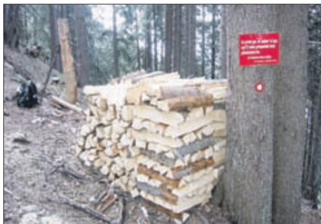
Skladovnica drv za prenos do koče čaka ...