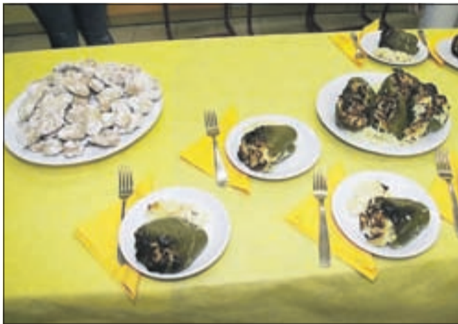
Značilni srbski jedi - polnjene paprike s krompirjem in skuto ter pecivo, imenovano šape