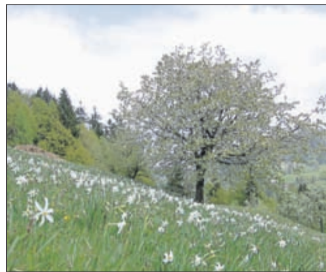
Z narcisami pod Golico je povezana zanimiva legenda o nastanku. Tja naj bi jih umestil kar sam sveti Peter, saj naj bi vsaka narcisa pomenila en ženski greh in kot pravi legenda, naj bi od takrat device hodile pod Golico trgati sledi svojih grehov.

Sicer pa gorska narcisa, ki jo pod Golico imenujejo tudi ključavnica, ne cveti povsod po Sloveniji, jeseniška pobočja so le ena od redkih lokacij, najdemo jo še na Krasu, na vrhu Slavnika, ponekod na slovenski obali, v Prekmurju in včasih tudi v Zasavju. Prekomerno trganje narcis ni dovoljeno, saj so zaščitene. Lahko jih občudujete na fotografijah ali pa v obliki izdelkov, ki jih tudi letos v okviru marketinške akcije izdelujejo tudi na Jesenicah. Akcija se bo zaključila 31. maja, s prireditvijo v Kolpernu na Stari Savi.