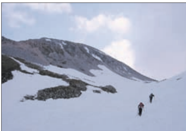
Proti vrhu Stola - še v snegu ...