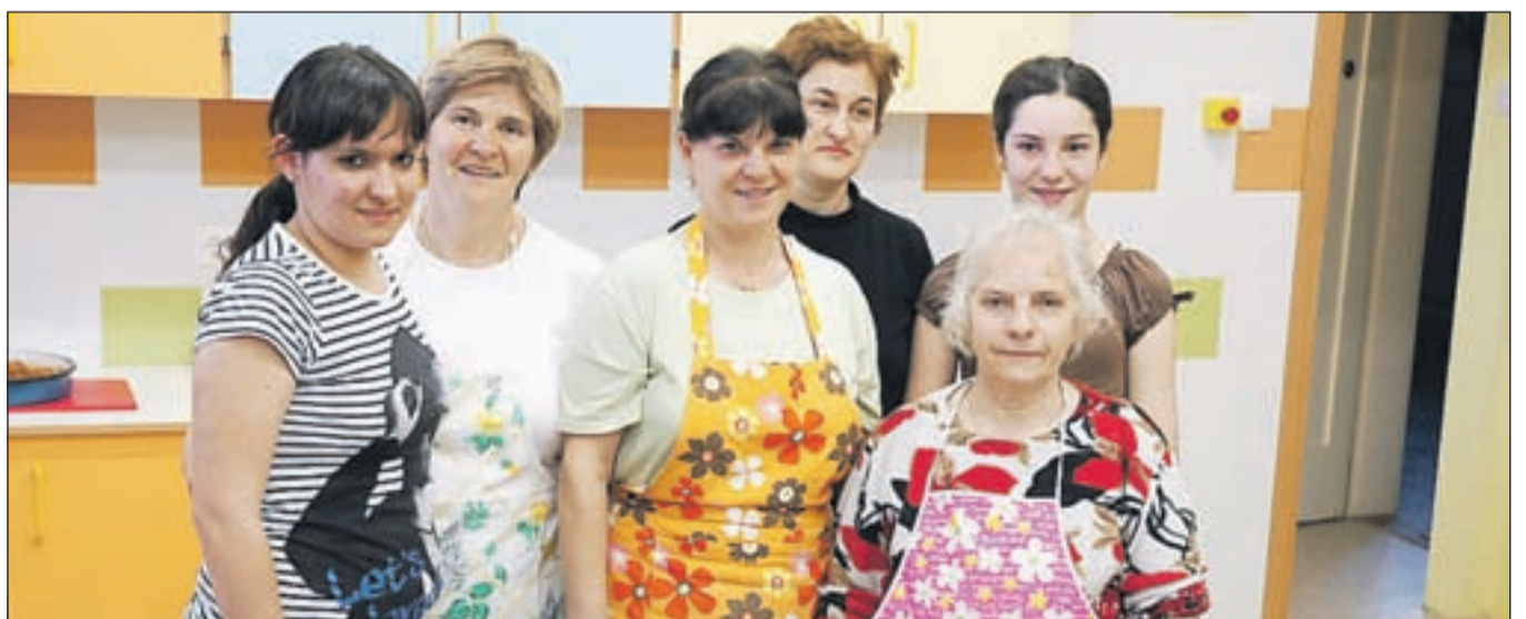
Društvo MKD Ilinden Jesenice je pripravljalo dobrote makedonske kuhinje.