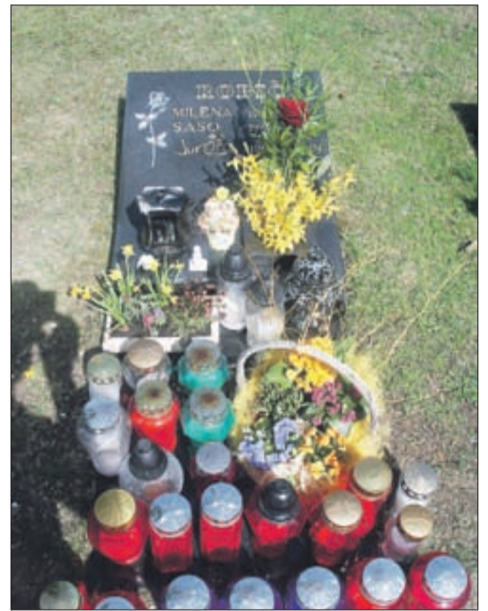
Grob, ki je postal "kolesarska meka".