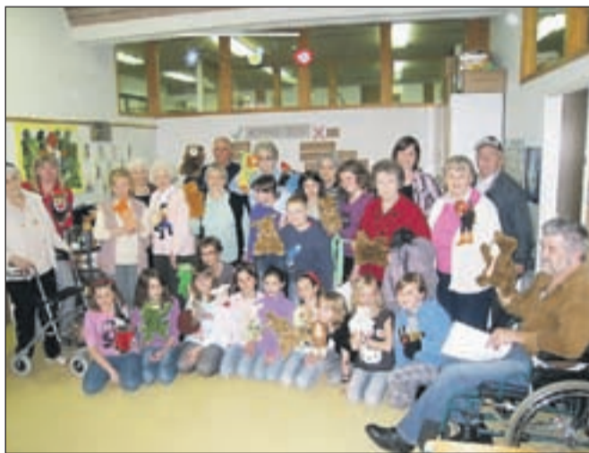
Učenci OŠ Toneta Čufarja in stanovalci Doma upokoencev dr. Franceta Berglja Jesenice