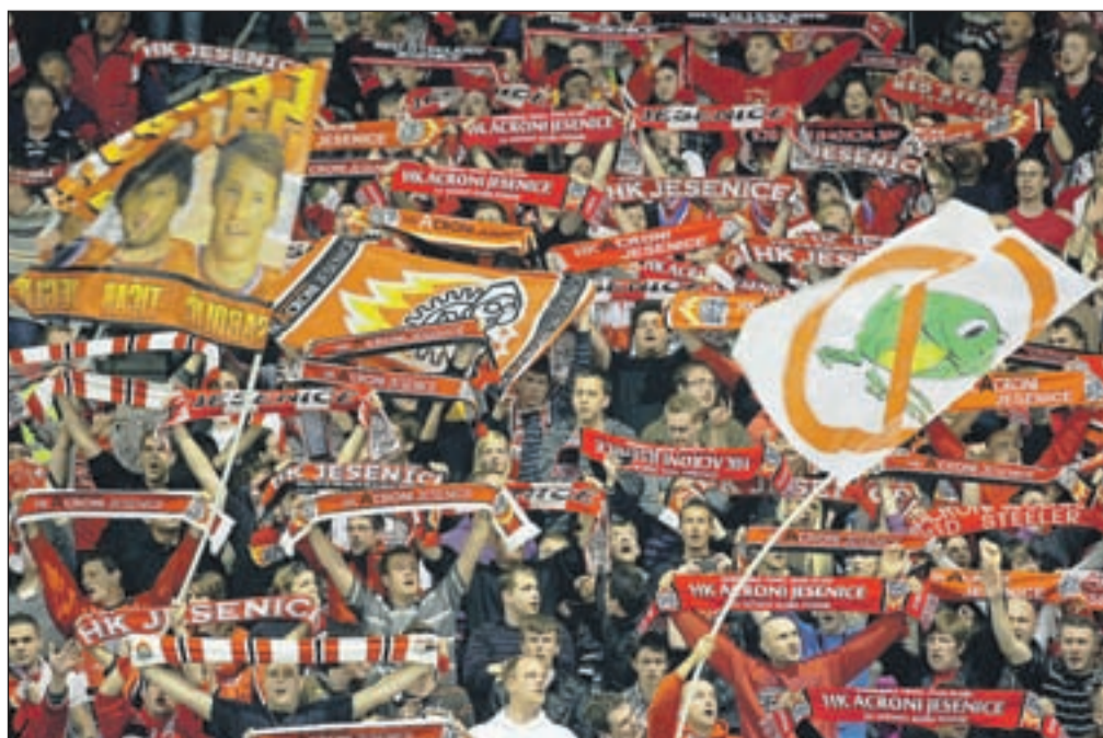
Na tretji finalni tekmi so igrali pred praznimi tribunami, dan kasneje, na četrti finalni tekmi, pa so glasni jeseniški navijači dali svoj pomemben delež k novi zvezdici.