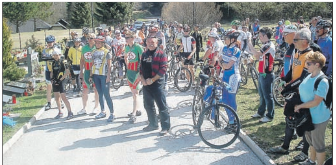
Večstoglavna skupina kolesarjev se je podala na 25-kilometrsko pot od Jesenic do Juretovega groba v Kranjski Gori.