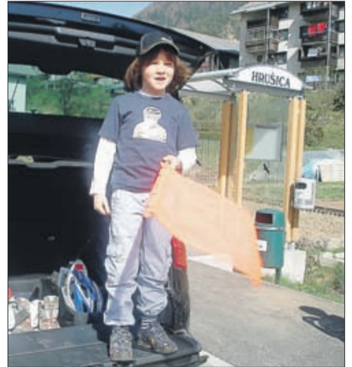
Juretov sin Nal nam je pomahal na startu izleta.