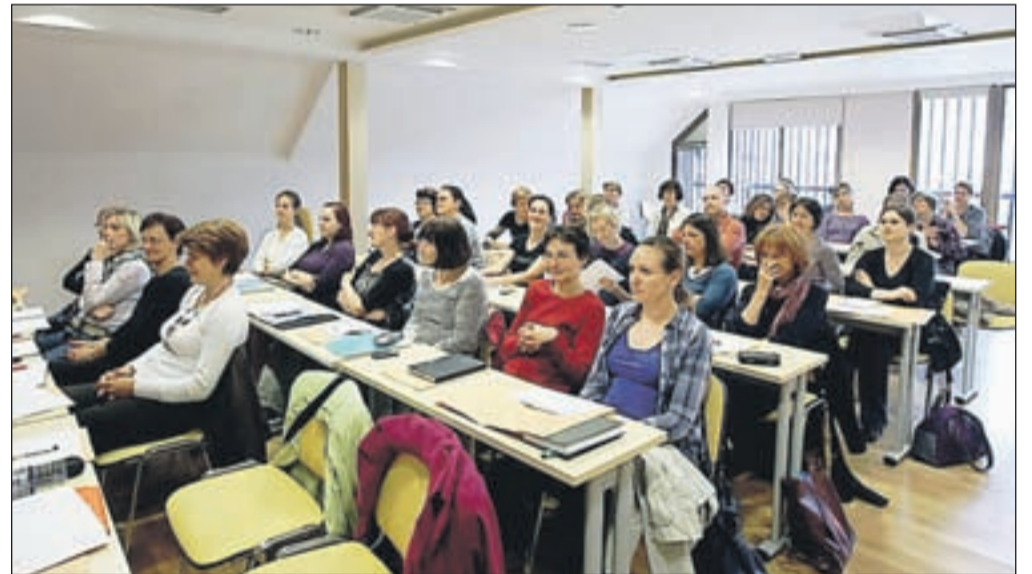
Vsa prosta študijska mesta so bila takoj zapolnjena.