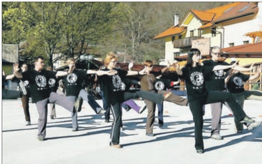
Taiči na prostem na Čufarjevem trgu

ima pa zlasti blagodejne učinke na sklepe, kosti, pomaga pri osteoporozi, revmi, artritisu, krepi občutek ravnotežja, deluje blagodejno pri stresu, glavobolih ...," naštevata blagodejne učinke vadbe sogovornika. "Po vadbi nisi zadihán, temveč sproščen, napolnjen, vesel, srečen," dodajata. Sama vadita vsak dan, saj je pri njihju taiči postal del življenjskega stila, medtem ko začetnikom priporočajo vadbo vsaj dvakrat tedensko. "Začnemo res zelo počasi, vadba je prilagojena posamezniku, nato pa počasi stopnjujemo in šele po nekako petih letih rednega ukvarjanja s taičijem vključimo zahtevne elemente borilnih veščin," razlaga Marko. Najlepša je vadba na prostem, v naravi, zato so tudi pripravili prikaz na Čufarjevem trgu. Mimoidoči so se z zanimanjem ustavljali in opazovali sodelujoče pri izvajanju počasnih gibov taičija. "Taiči je res tako blagodejna vadba, da si jo želimo približati čim širšemu krogu ljudi," poudarjata Dragi in Marko. Želita si, da posamezniki, ki vadijo taiči, ne bi bili deležni predsodkov, temveč bi tudi v Sloveniji postalo nekaj običajnega, če bi zjutraj v parku videli nekoga, ki na ta način skrbi za svoje notranje ravnovesje in zdravje.