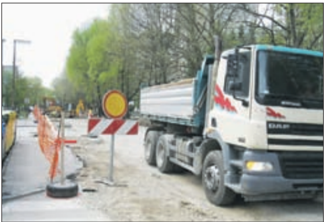
Začeli so tudi drugo fazo obnove Tavčarjeve ulice

Župan pa je tudi povedal, da se je podjetje Plastkom, ki ima na Jesenicah predelovalnico sveč, znašlo v težavah. Inšpekcija je zaprla podjetje, ker niso imeli vseh potrebnih dokumentov za obratovanje. Podjetje naj bi bilo tudi v hudih finančnih težavah. Iščejo različne rešitve, da bi devetsto ton sveč, kolikor naj bi jih bilo ta čas nakopičenih na dvorišču podjetja na Spodnjem Plavžu, vendarle predelali.