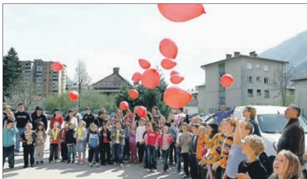
V nebo so jeseniški otroci spustili petdeset rdečih balonov v spomin na polet prvega človeka v vesolje.