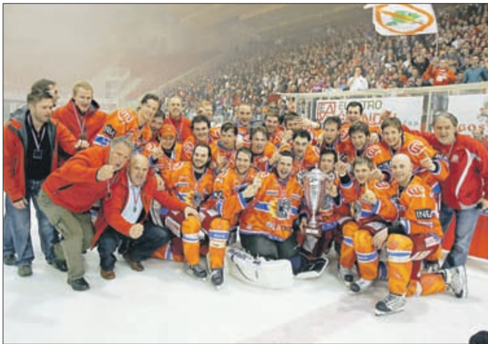
Jeseniški hokejisti so devetkrat osvojili naslov, sedemkrat so se končne zmage veselili v Tivoliju, v Podmežakli so se veselili proti Slaviji in letos prvič proti Olimpiji.

Hokejske Jesenice slavijo nov naslov državnega prvaka. V klubski zgodovini je to že 32. zvezdica, deveta, odkar je Slovenija samostojna. Po pričakovanju sta se za prestižno lovoriko državnega prvaka "udarila" večna tekmeča ljubljanska Tilia Olimpija in Acroni Jesenice. Zeleno-beli so bili bolje uvrščeni v ligi EBEL, kar jim je prineslo prednost domače dvorane. Prvi dve tekmi sta bili tako odigrani v Tivoliju. Jeseničani so še enkrat dokazali, da jim letos tuje ledene ploskve še kako dišijo. Obakrat so se s Tivolija vrnili s polnim pleonom in povsem izničili Olimpijino prednost domače dvorane. Prvo tekmo so dobili po podaljškju s 3 : 2, drugo pa z 2 : 1. Okrog tretje tekme je bilo kar veliko zapletov. Kot vemo, dvorana Podmežakla ni imela uporabnega dovoljenja. Jeseniško vodstvo se je z ljubljancema dogovorilo v upanju, da bo dvorana dobila zeleno luč, da so torkovo tekmo prestavili na četrtek. Na dan tretje tekme so krožile takšne in drugačne informacije, popoldne pa je iz kluba prišlo sporočilo, da tekma bo, a pred praznimi tribunami. Vsekakor v najbolj nenavadni tekmi v zgodovini slovenskega hokeja so v tišini "železarji" v izenačeni tekmi slavili s 4 : 2. Kljub veliki prednosti finale še zdaleč ni bil odločen, saj so tekme pokazale, da sta ekipi zelo izenačeni. Podobna zgodba tudi v četrti tekmi, v kateri je na trenerski klopi Dejan Varl zamenjal Heikki Mälkiä, ki je zaradi smrti v družini odšel domov na Finsko. Po 40 minutah je