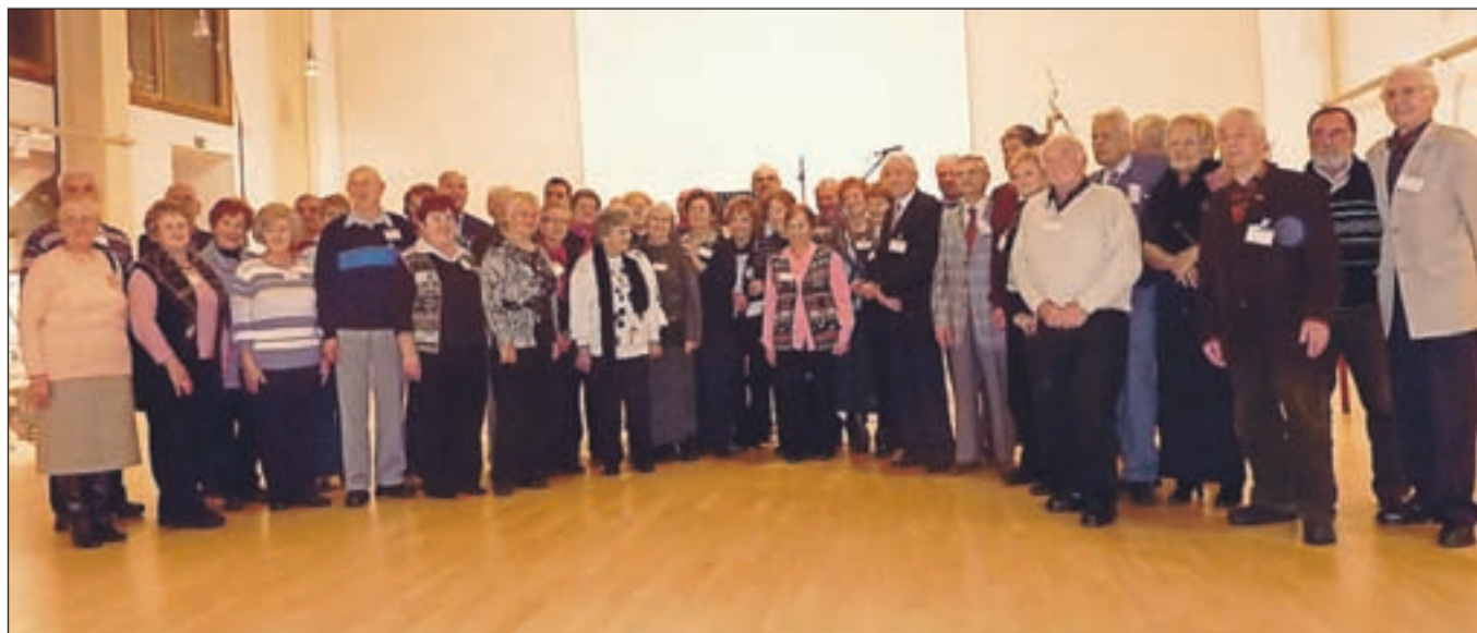
Na srečanje je prišlo več kot petdeset občanov, rojenih leta 1940. Sicer pa je letos 70. rojstni dan praznovalo kar 196 Jeseničank in Jeseničanov.