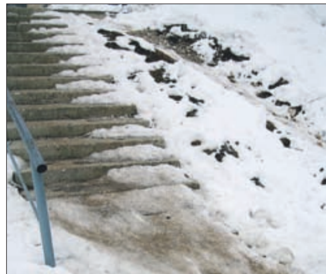
Ogorčena občanka nas je ob zadnjem sneženju obvestila, da so stopnišča v oba trgovska centra na Stari Savi še vedno nevarna za pešce, saj je pošteno padla. Klicala je na komunalo, kjer so ji povedali, da niso pristojni za to površino, so pa trgovcem ponudili svoje storitve in ni bilo dogovora. Trgovci, ki vsak teden dajo veliko denarja za obveščanje o svojih prodajnih akcijah, očitno nimajo denarja za čiščenje dostopa za pešce do svojih trgovin.