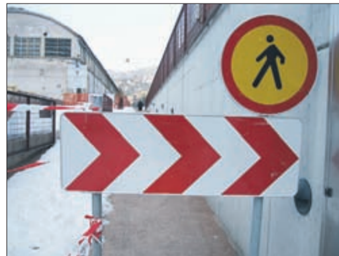
Na Stari Savi je večje delovišče, zato sta okolica muzeja in pot proti trgovinam uradno zaprti za pešce. Kljub temu mnogi lezejo pod trakom in s tem ogrožajo svojo varnost.