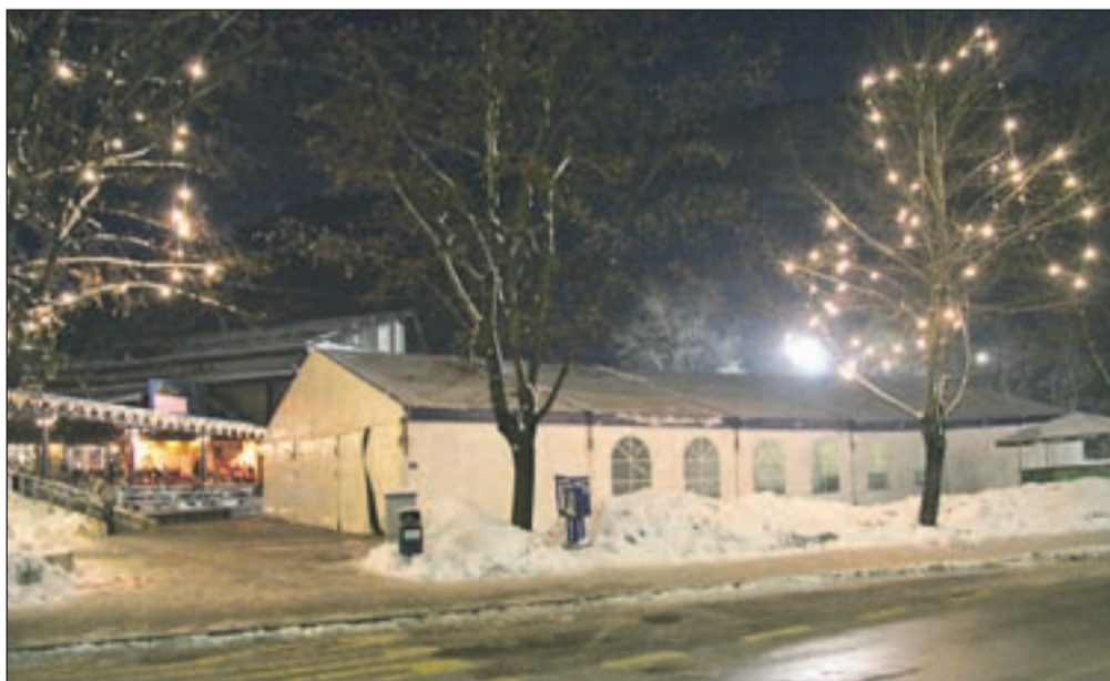
Na Čufarjevem trgu so letos prvič postavili ogrevan šotor, v katerem potekajo vse praznične prireditve.