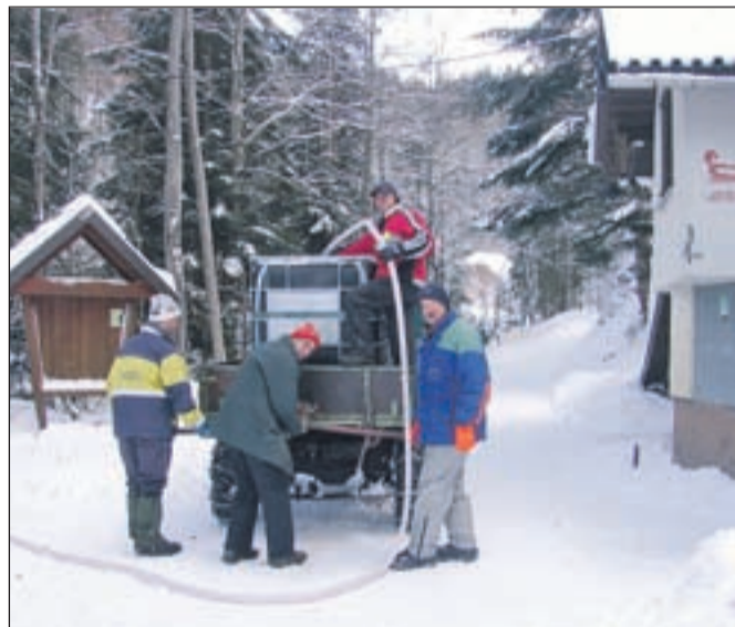
Ekipa, ki ureja sankško progo.

Progo urejajo skupaj s člani Sankaškega kluba Podljubelj. 15. in 16. januarja prihodnje leto bodo člani klubov Jesenice in Podljubelj skupni prireditelji glavne tekme sezone. To bo že tradicionalni in uveljavljeni Celinski pokal z udeležbo sankarjev iz več evropskih držav. Poleg tega tekmovanja bodo izvedli še vsakoletni Jelovčanov memorial, v načrtu pa imajo še nekaj drugih tekem. Po glavni januarski tekmi bo spodnji del proge namenjen tudi ljubiteljem rekreativnega sankanja. J. R.