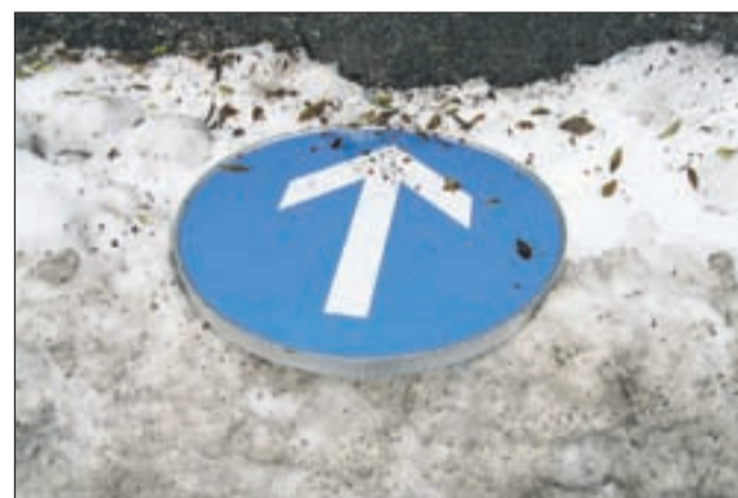
Prometni znaki najbolje služijo, če so na svojem mestu. Komu služi smerokaz prometnega znaka, pa tudi najboljša komisija ne bi ugotovila. Morda pa je prišlo do poškodbe v času pluzenja snega?