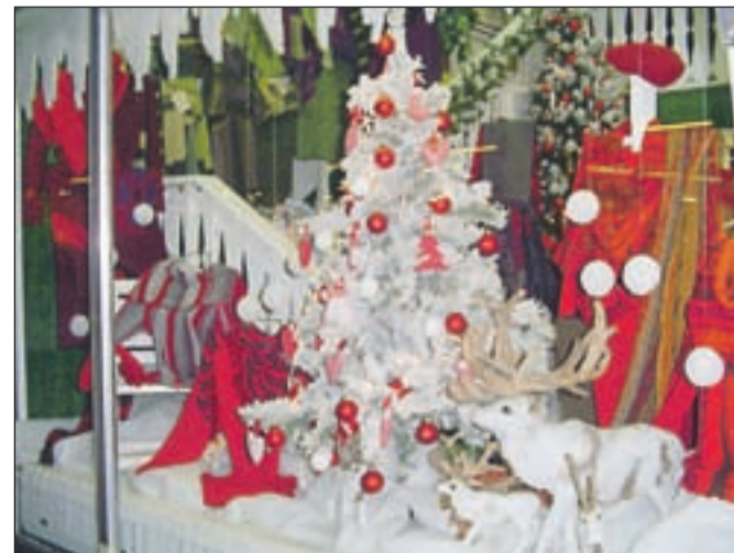
Ena od jeseniških izložb, ki so jih lepo uredili v teh predprazničnih dneh, je izložba trgovine Miksi.