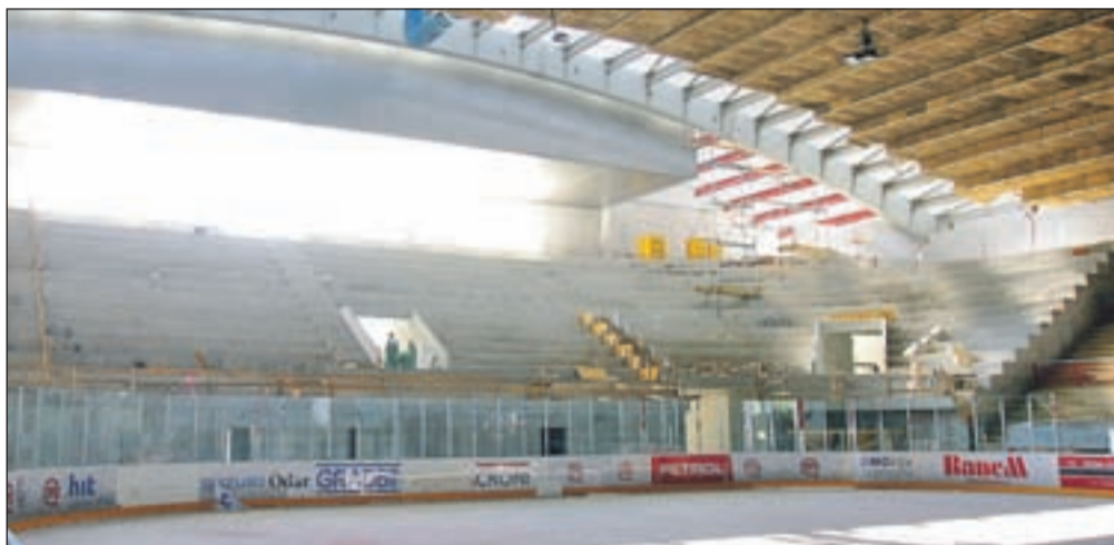
V novo hokejsko sezono bo polepšana stopila tudi hokejska dvorana Podmežakla, prvi del obnove se zaključuje, urejena je tribuna s sedeži za več kot 1400 gledalcev, del hale je zaživel v rdeče-modri kombinaciji ... Prihodnje leto sledi še obnova strehe.

pozitivno, predvsem za mlade igralce, ki niso imeli toliko od sezone. Tisti, ki niso bili v reprezentanci, so startali že 13. aprila, reprezentantje pa so se priključili kasneje. Neke temelje smo postavili s temi treningi. Vedeti moramo, da bo sezona dolga, saj se je reprezentanca spet uvrstila v skupino A. Če delamo primerjavo s tistimi reprezentancami, ki so v vrhu skupine A, nam še veliko manjka. Vsekakor je pogoj, da moramo biti čim bolj fizično pripravljene. Po aktivnem počitku smo nadaljevali z drugim delom suhih pri-