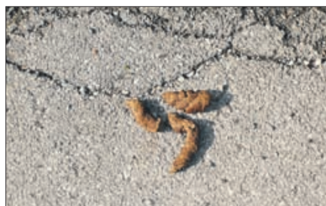
Kazen za pasje kakce na javnih površinah - 200 evrov

"Seveda gre tudi v tem primeru za neke vrste motnje s hrupom in seveda je bilo tudi na ta račun kar nekaj prijav. Popolnoma razumljivo je, da se pes oglaš, s tem naznani tujca, skratka, komunicira z lajanjem. Ravno zaradi tega ta določba ni