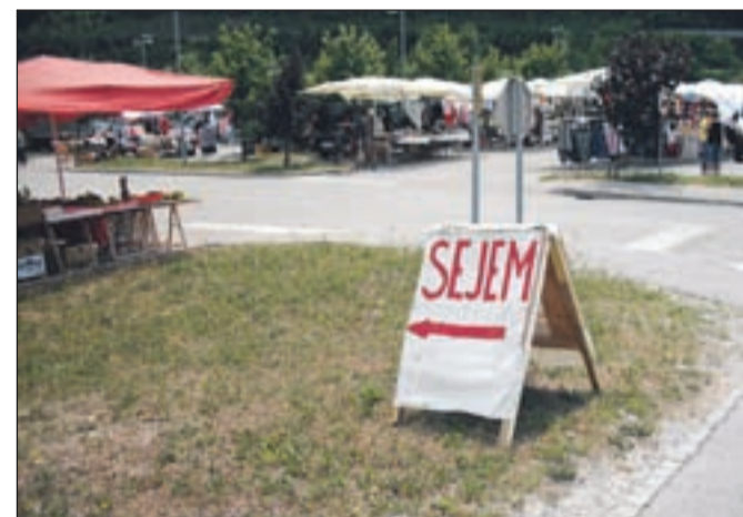
Sejem vsakega 19. v mesecu ostaja zanimiva točka in priložnost za nakupe, čeprav se nam v poletnem času denarice kar malo preveč sušijo.