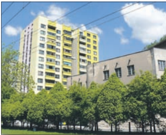
Stolpnica na Cesti maršala Tita 41, Jesenice

Na osnovi tabele o zmanjšanju porabe energije v preteklih letih ugotovimo, da je z energijsko sanacijo prihranek za ogrevanje 45-odstoten, zmanjšanje emisij CO 2 96 ton na leto in vračilo na doba osem let na celotno investicijo 110 tisoč evrov (subvencije: 25 tisoč evrov). Občina Jesenice je v letih od 2000 do 2008 na področju finančnih spodbud realizirala skoraj 1200 ukrepov. Predstavniki občin, ki so sodelovali na konferenci, so pohvalili prizadevanje občine Jesenice pri vseh programih, ki znižujejo rabo energije za ogrevanje in pri pravi topli vode.