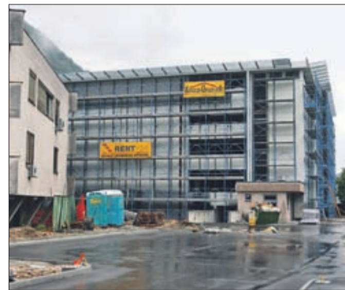
Nova garažna hiša že stoji, dokončana naj bi bila do jeseni.

upa, da ne bo zapletov s pravočasno pridobitvijo dovoljenja za heliport, ki bo urejen na strehi nove garažne hiše. Zaradi gradnje novega objekta reševalni helikopterji zdaj pristajajo na začasni lokaciji na ploščadi v bližini bolnišnice. Lani so s helikopterjem opravili 130 preletov, v večini primerov so pomagali ponesrečencem v gorskih nesrečah, nekaj pa je bilo prevozov novorojenčkov v Ljubljano.