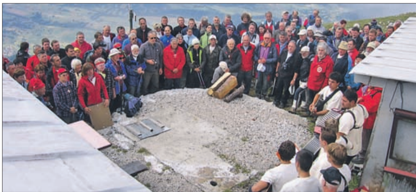
Slovesnosti ob kočici se je udeležilo nekaj sto planincev.