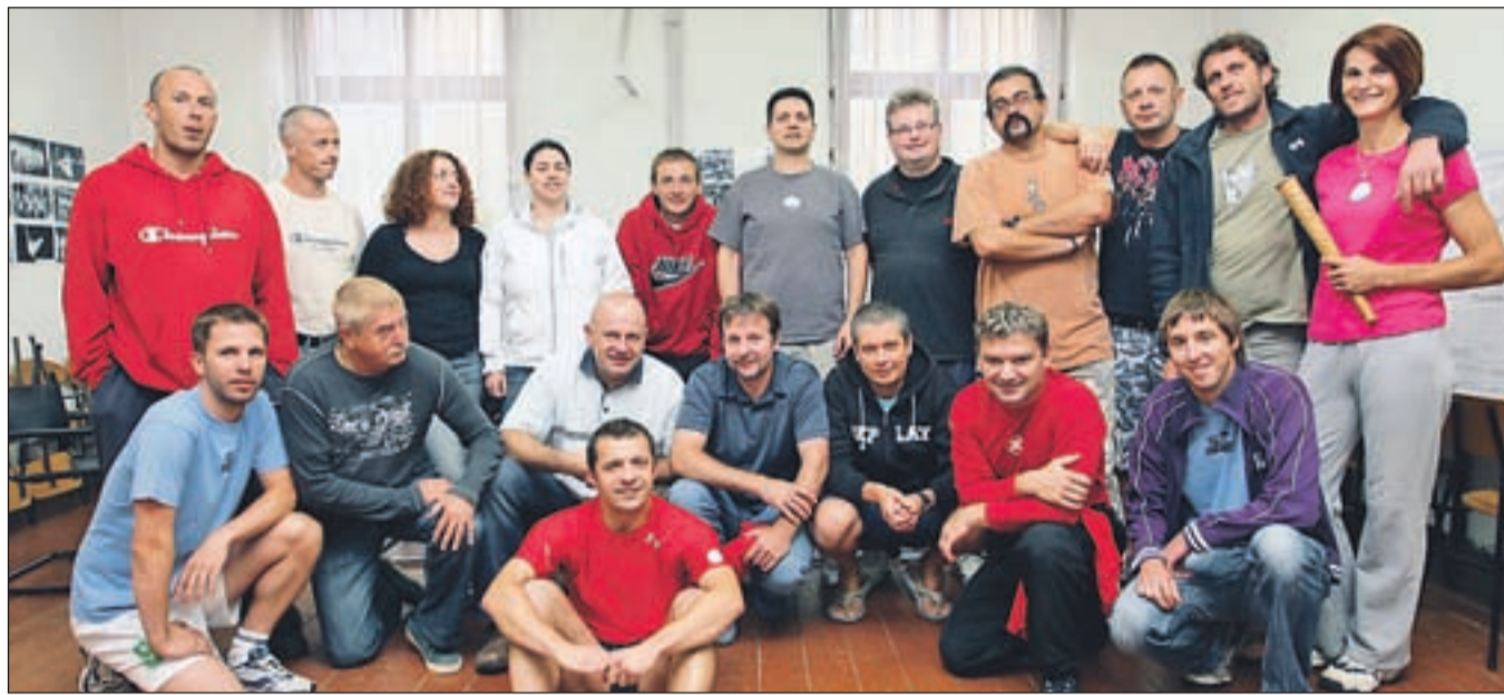
Ekipa tekačic in tekačev ter spremljevalcev na zadnjem sestanku pred odhodom