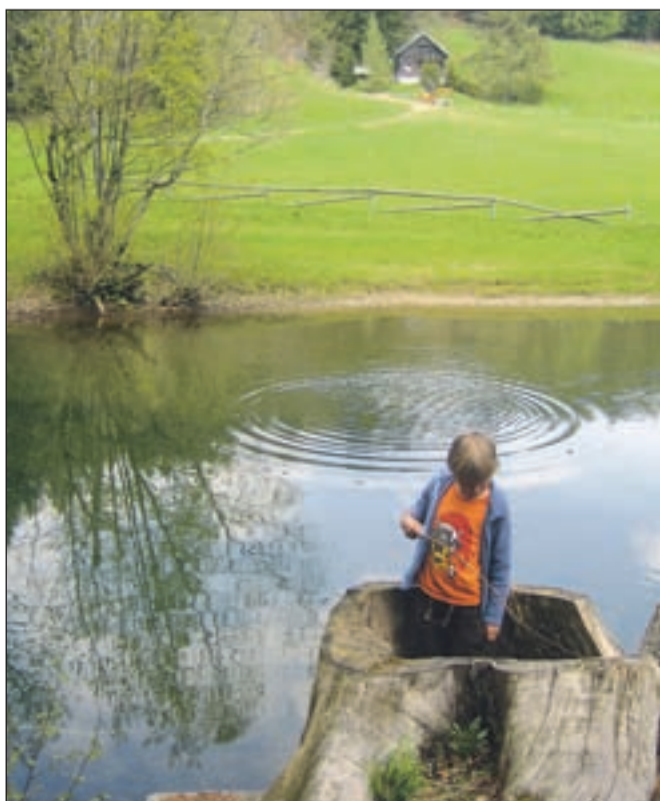
V jezercih so se v preteklosti tudi kopali, pozimi pa drsali.

narave, pristojne občinske službe in Jeko-In. Občina Jesenice načrtuje, da bo za ureditev pridobila denar ministrstva za kmetijstvo, goz-