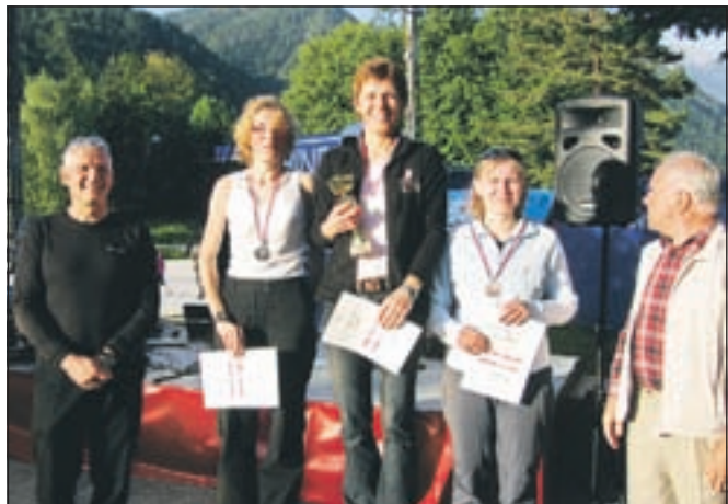
Najhitrejšje tri v ženski konkurenci