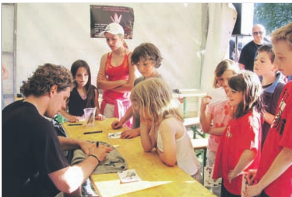
Anže Kopitar je mladim oboževalcem delil tudi avtograme.

Poleg nogometnega je bil še balinarski turnir, na katerem je nastopilo šest ekip. Zmagala je druga ekipa Balinarskega kluba Jesenice pred ekipo Gorij in prvo ekipo Balinarskega kluba Jesenice.