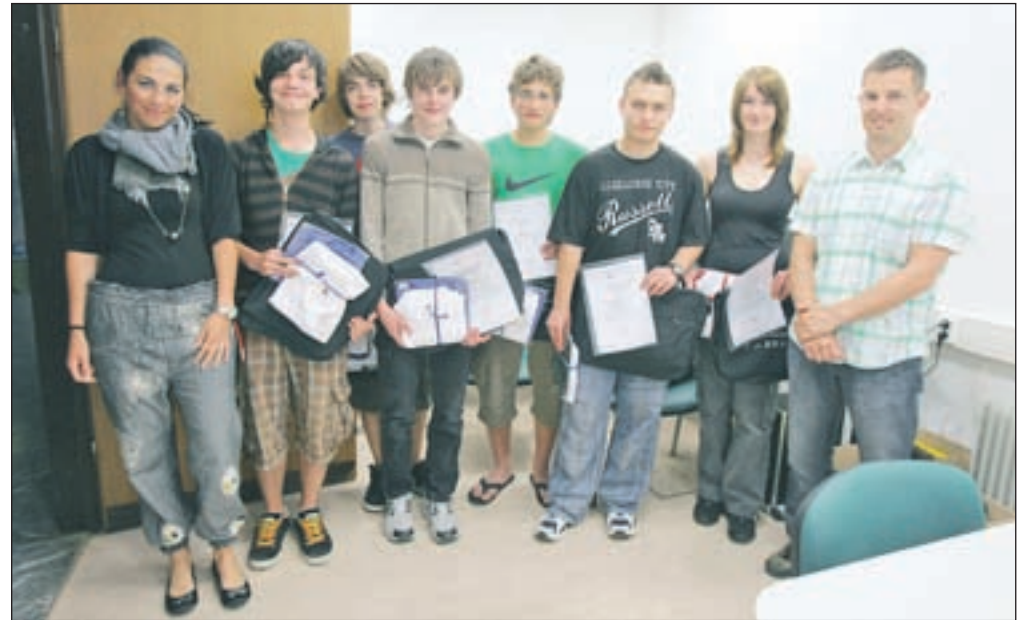
Dijakom, ki so prostovoljno učili starejše uporabljati svetovni splet, so v začetku junija razdelili potrdila.

Pri projektu je sodelovalo 49 starih staršev in 28 vnukov, ki so v vlogi mentorjev stare starše učili uporabljati svetovni splet. Med drugim so jih prek spleta naučili brati tudi naš časopis, obenem pa so spoznavali virtualne muzeje in trgovine, na spletu izvedeli, kaj se dogaja na Gorenjskem, ter kupili vstopnico ali celo letalsko karto iz domačega fotelja. Projekt, za katerega so pridobili tudi sredstva evropskega socialnega sklada, so izvajali v sedmih krajih v Sloveniji, na Gorenjskem v Kranju in na Jesenicah. K sodelovanju so privabili dijake Srednje šole Jesenice, Osnovne šole Orehek Kranj, Tehniškega šolskega centra Kranj in ESIC Kranj. Dijaki so starejšim brezplačno pomagali do boljše računalniške pismenosti prek krajsih individualnih tečajev. Učili so se v skladu z lastnimi sposobnostmi, saj so jih gledali na predznanje, ki so ga ugotavljali z vprašalniki, razdelili v skupine, v katerih sta bila po dva ali trije udeleženci. Vsaki skupini so dodelili mentorja in skupaj so izpeljali skoraj tristo ur izobraževalnega dela. "Staro gospo sem učil, kako se uporablja računalnik in brska po svetovnem spletu. Nekako je šlo, vendar bolj počasi," je razložil eden od dijakov mentorjev Alexandru Maler in dodal, da je moral biti predvsem potrpežljiv. Vsak teden je po dve šolski uri pred računalnikom skupaj z dvema starejšima preživela tudi Aleksandra Mencinger .