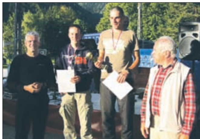
Prva dva v moški konkurenci