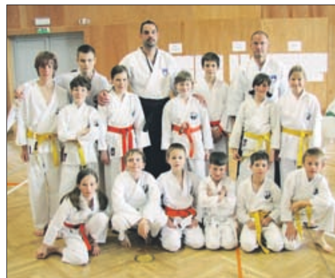
Mladi karateisti Karate kluba Mi-ki